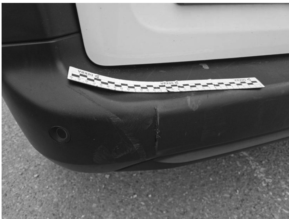
Fot. 52 Zderzak tylny() - Pęknięcie/rozerwanie 3