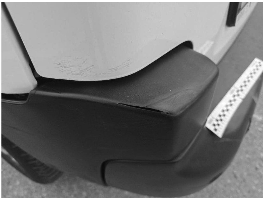
Fot. 51 Zderzak tylny - Pęknięcie/rozerwanie 2