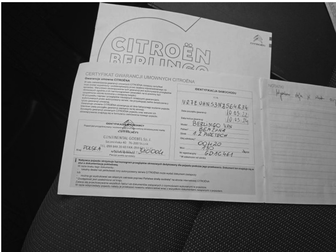
Fot. 34 Książka serwisowa – dane