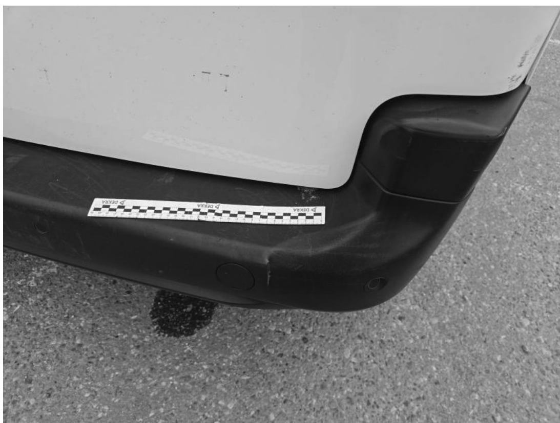
Fot. 50 Zderzak tylny - Pęknięcie/rozerwanie 1