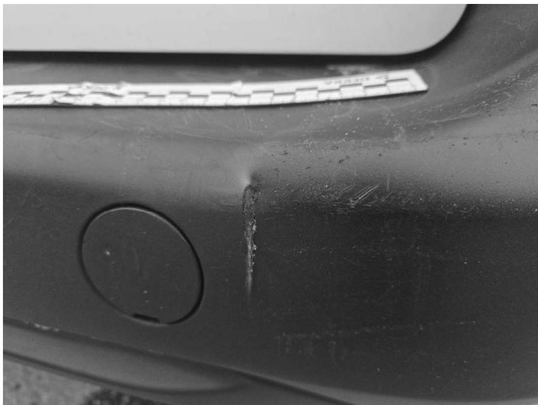
Fot. 49 Zderzak tylny - zdjęcie poglądowe 2