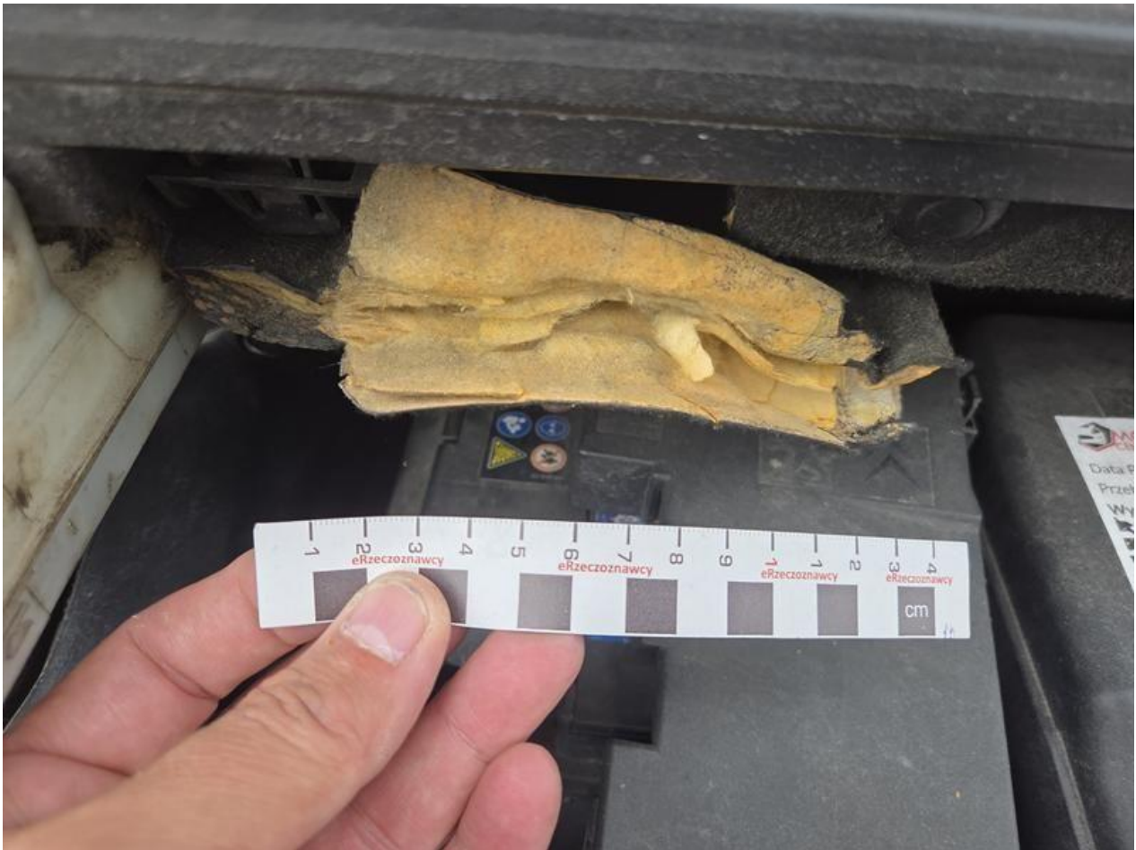
Fot. nr 93