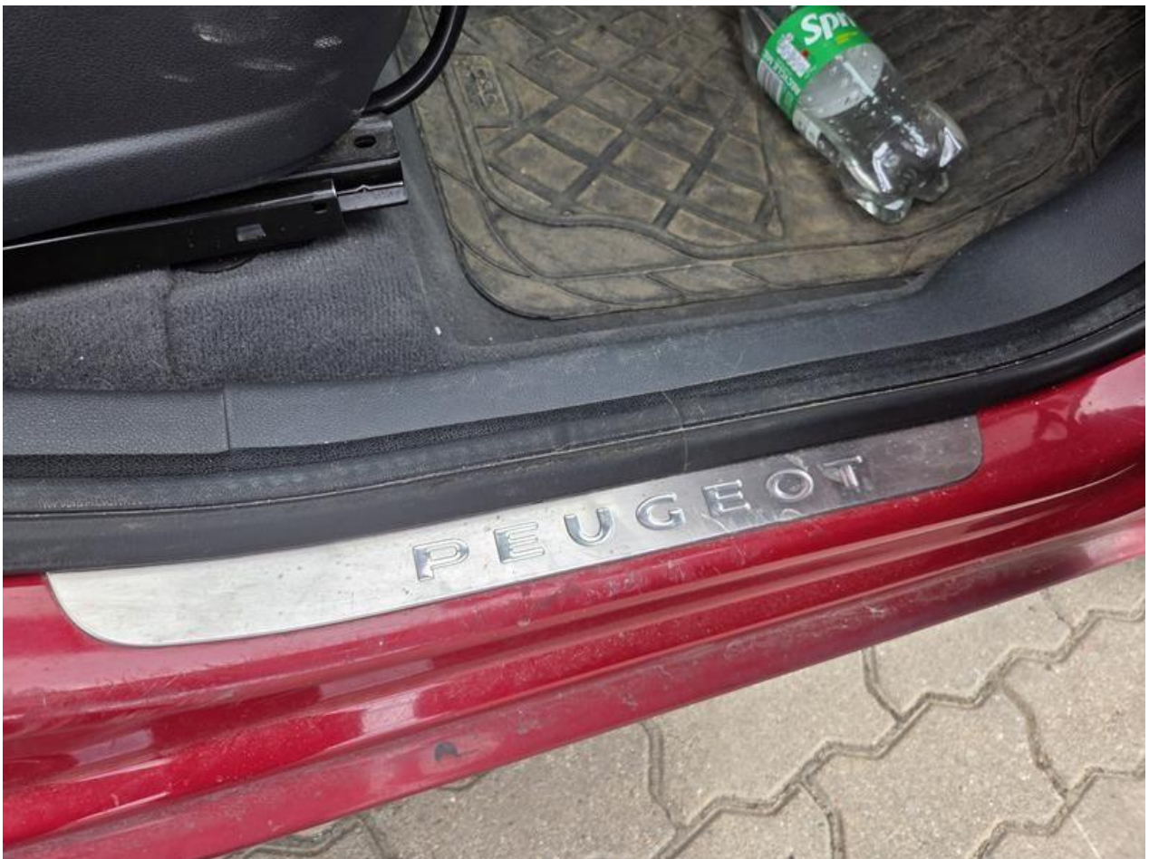
Fot. nr 98