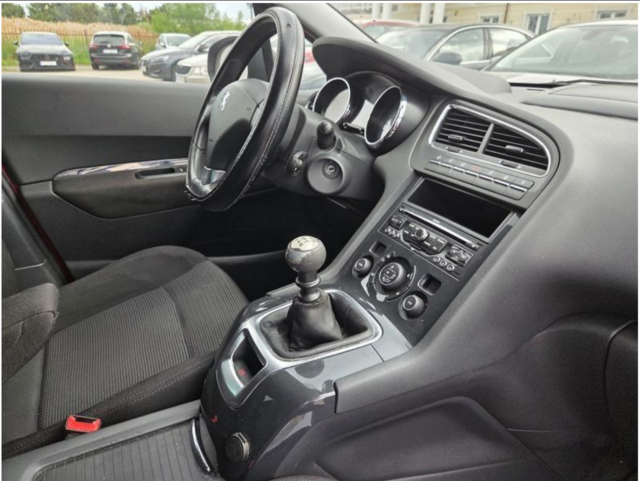
Fot. nr 97