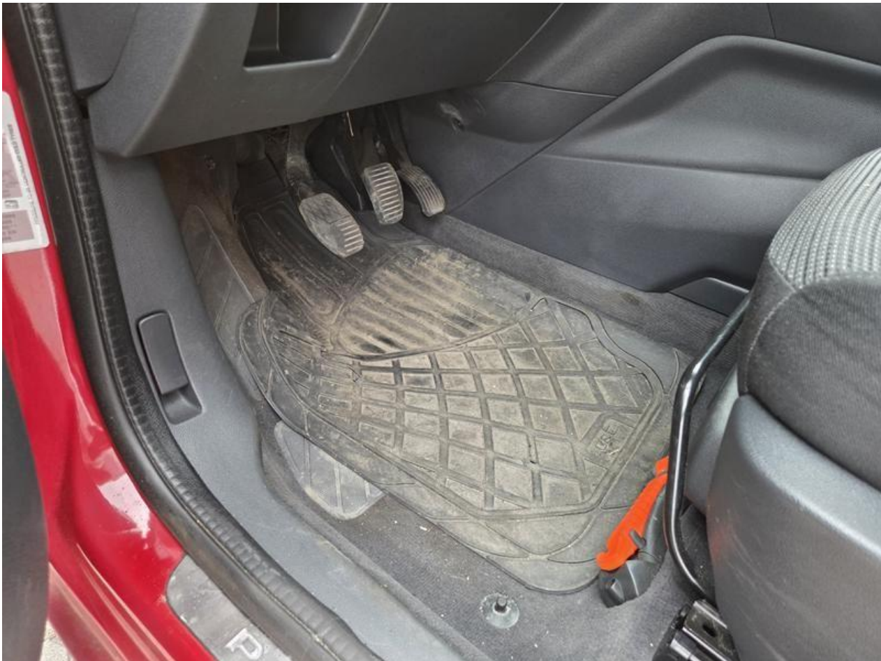
Fot. nr 99