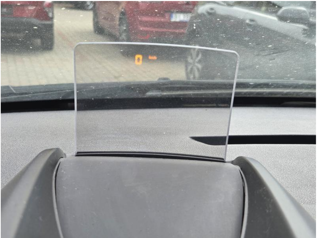
Fot. nr 101