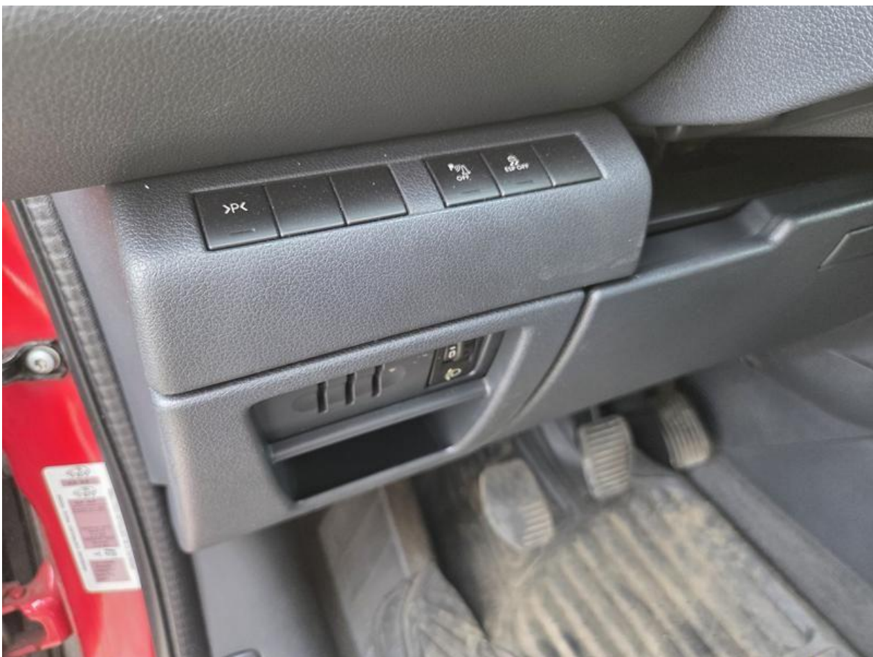
Fot. nr 100