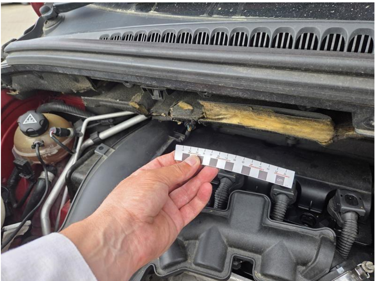
Fot. nr 94