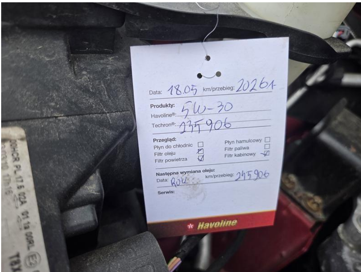
Fot. nr 96