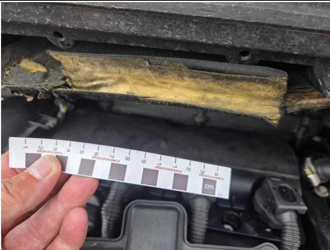
Fot. nr 95