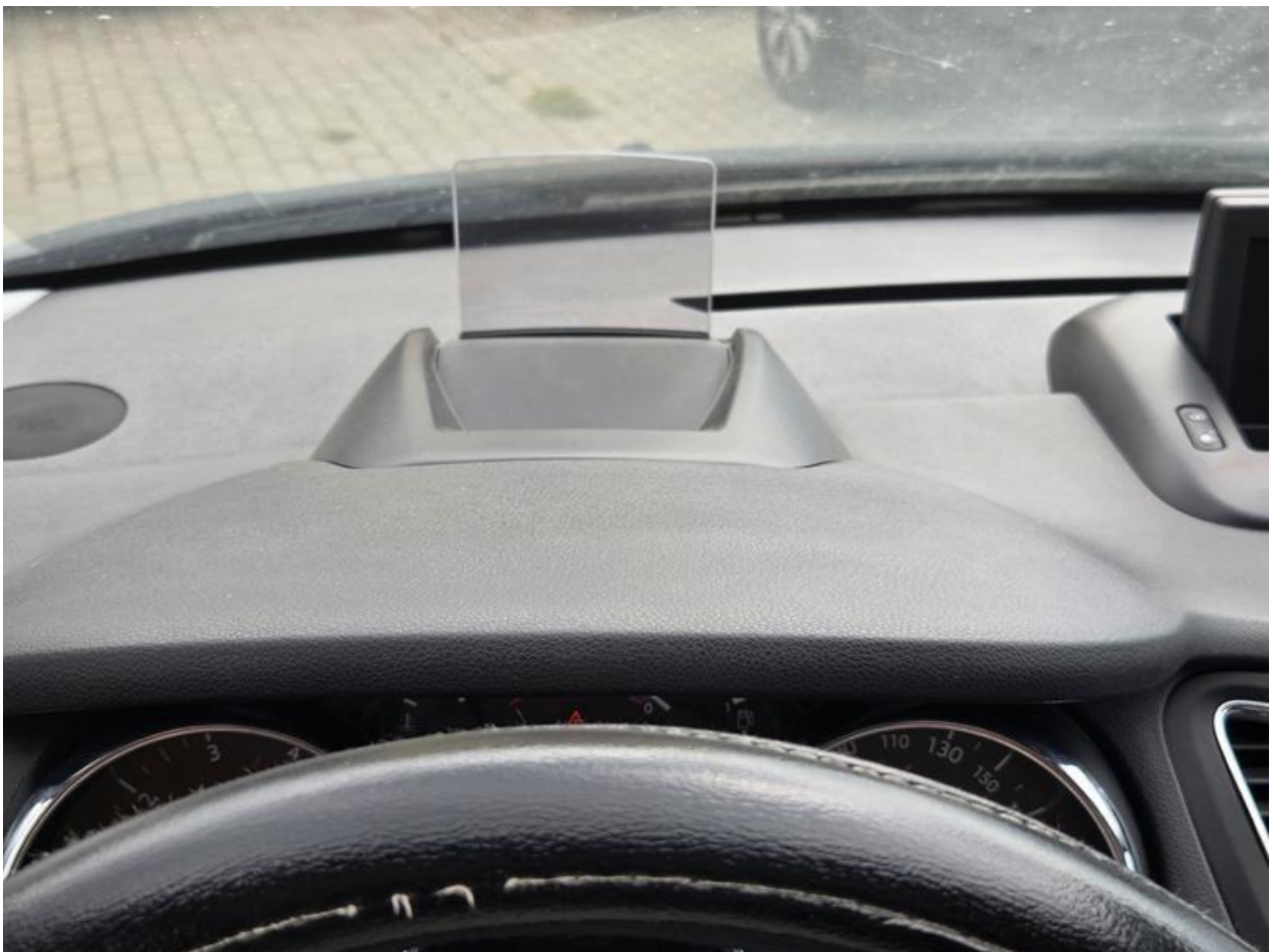
Fot. nr 102