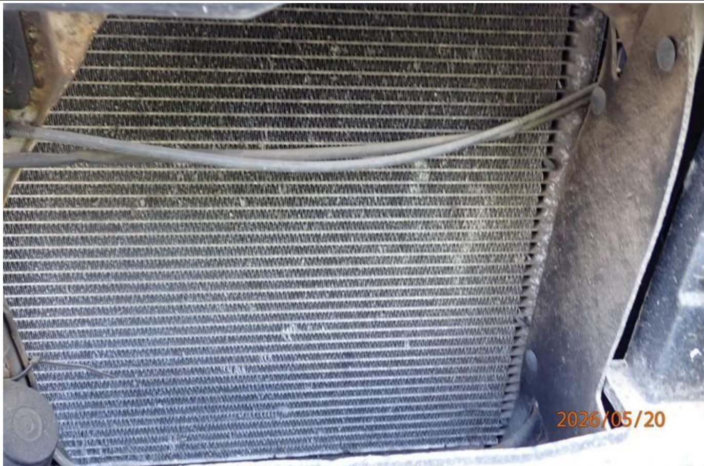
Fot. nr 101