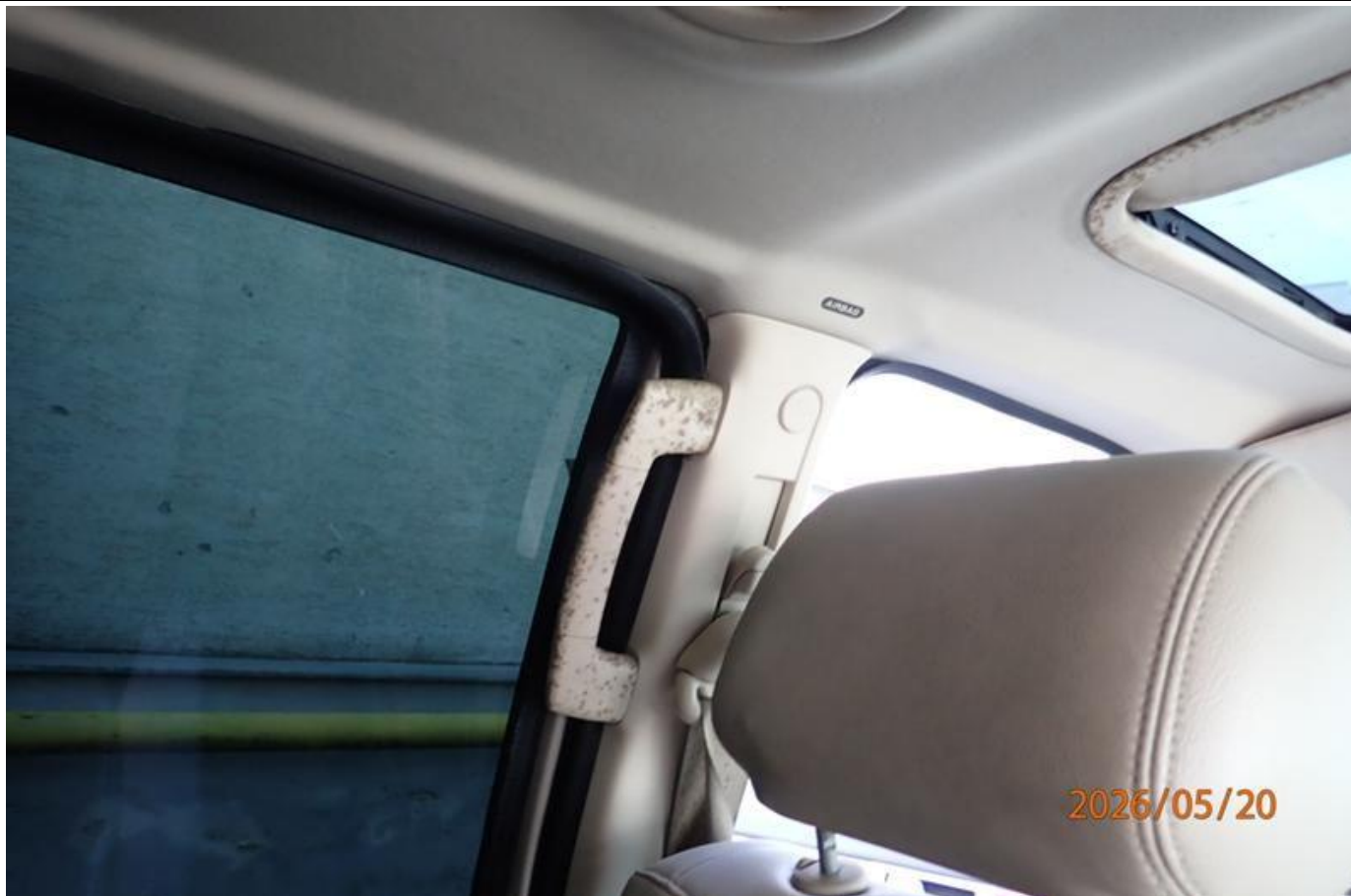
Fot. nr 135