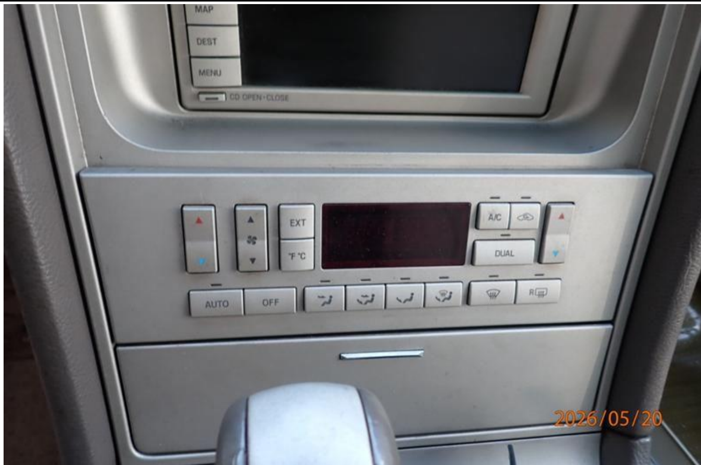
Fot. nr 179