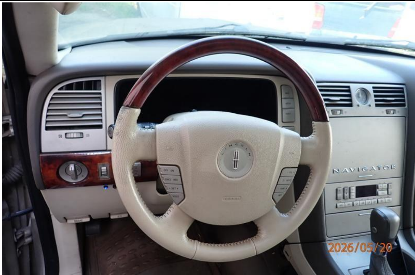
Fot. nr 171