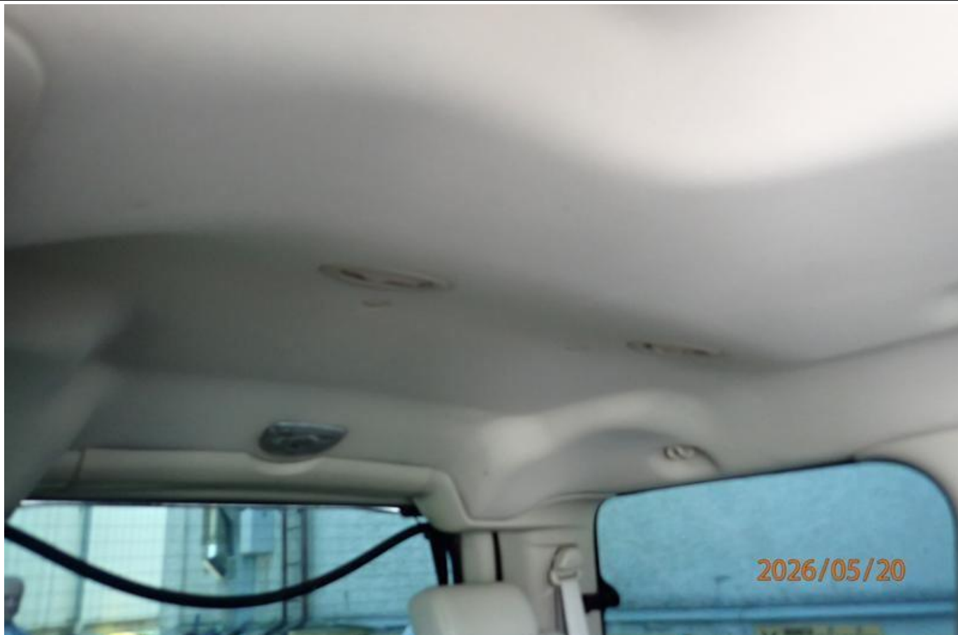
Fot. nr 133