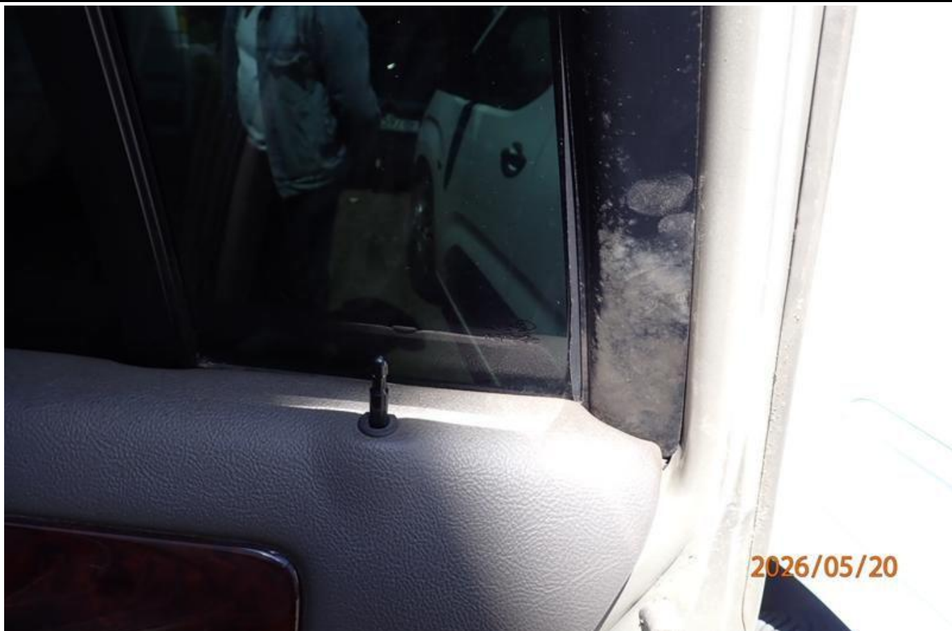
Fot. nr 117