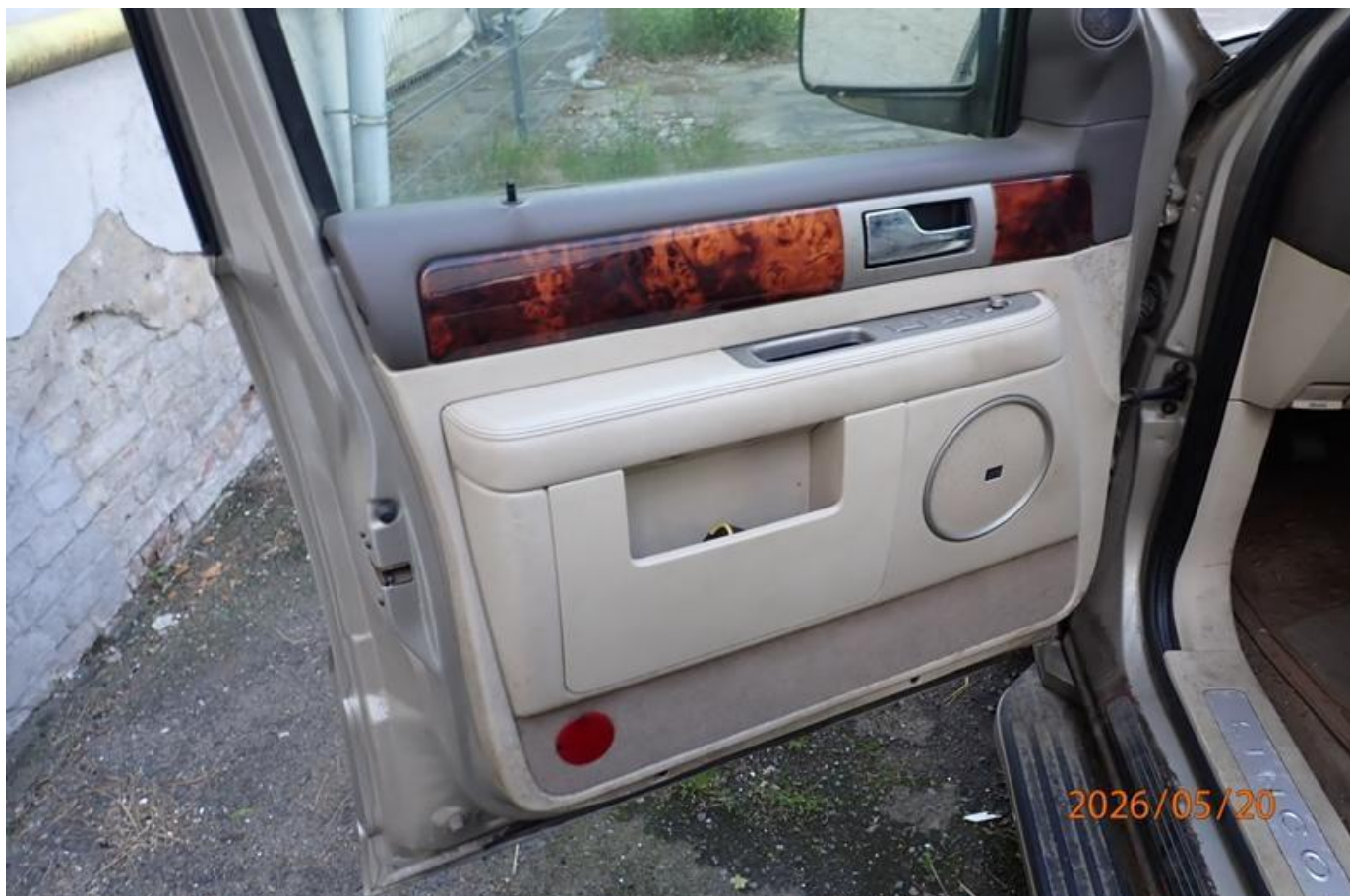
Fot. nr 162