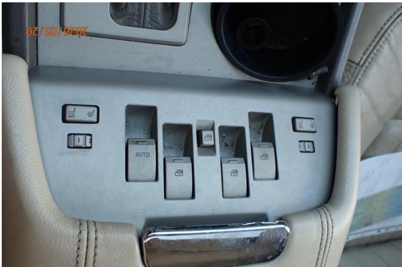
Fot. nr 196