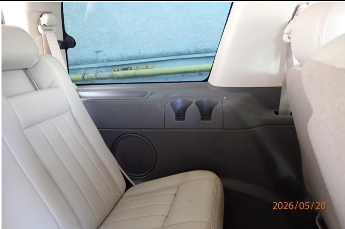
Fot. nr 149