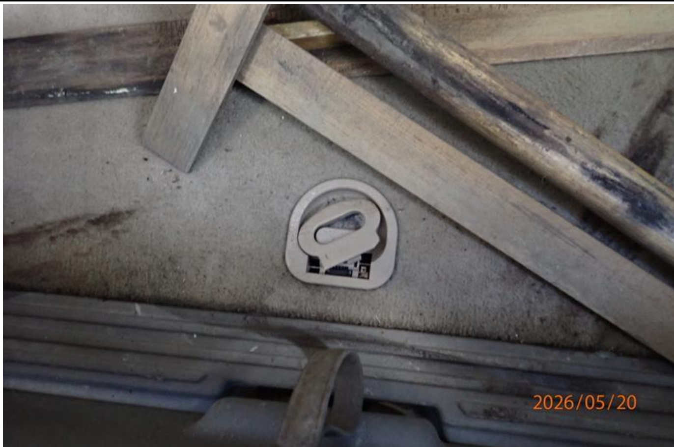
Fot. nr 143