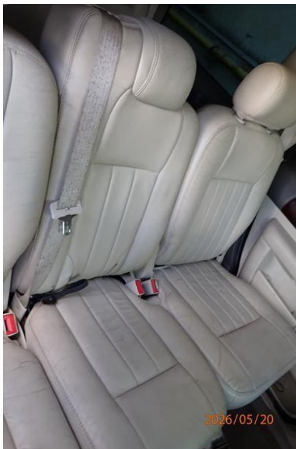
Fot. nr 126