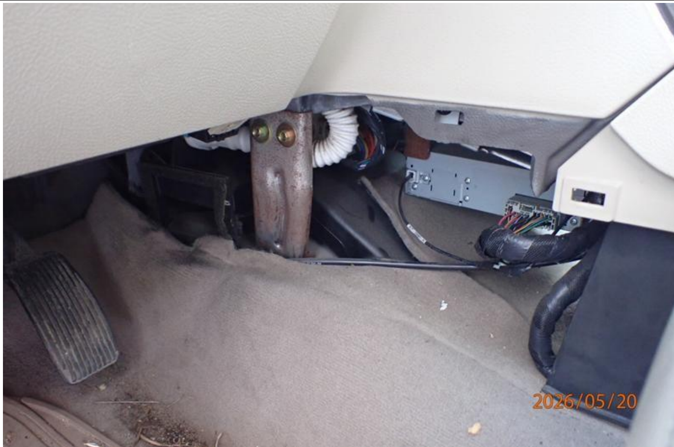
Fot. nr 195