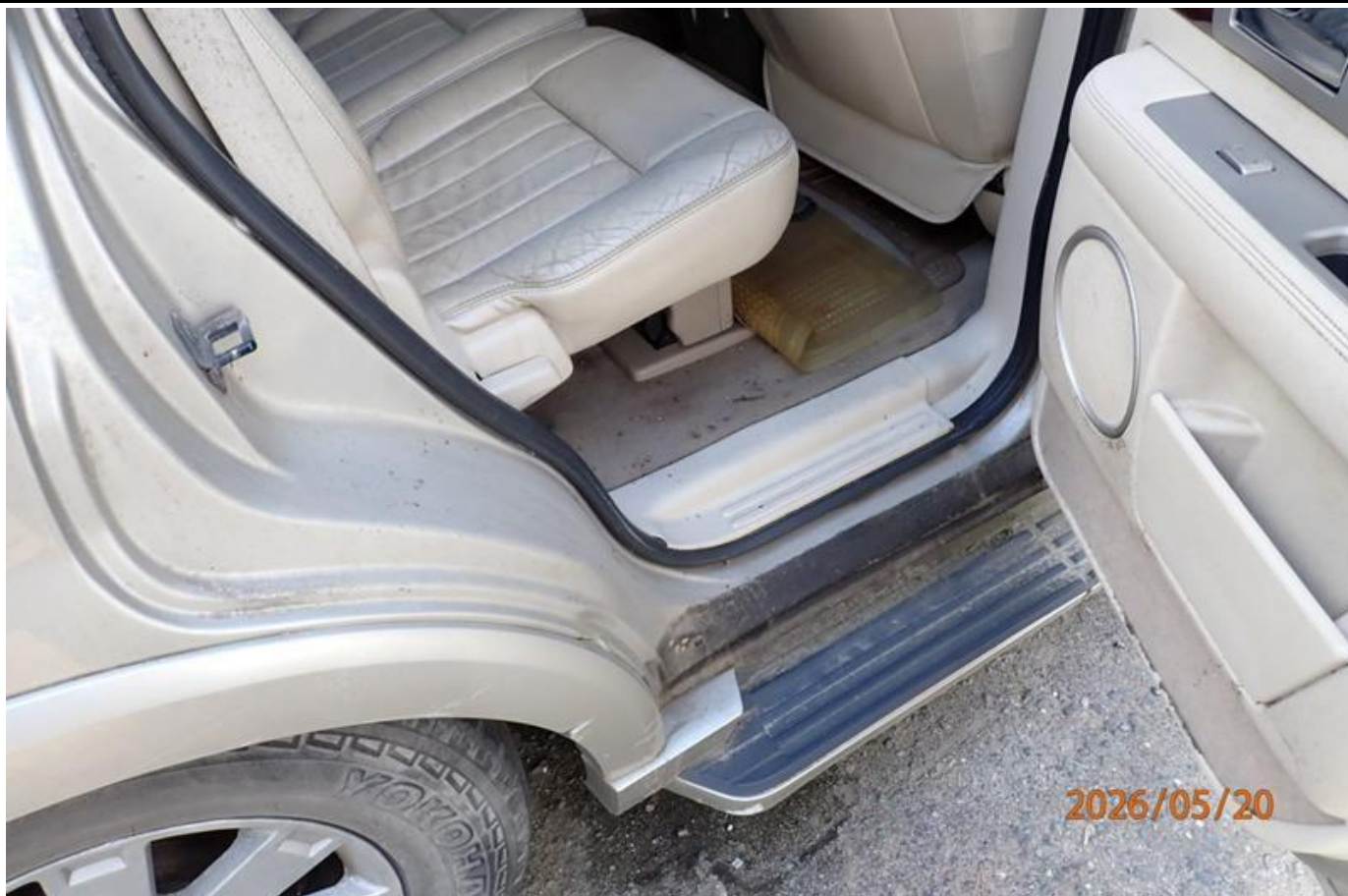
Fot. nr 119