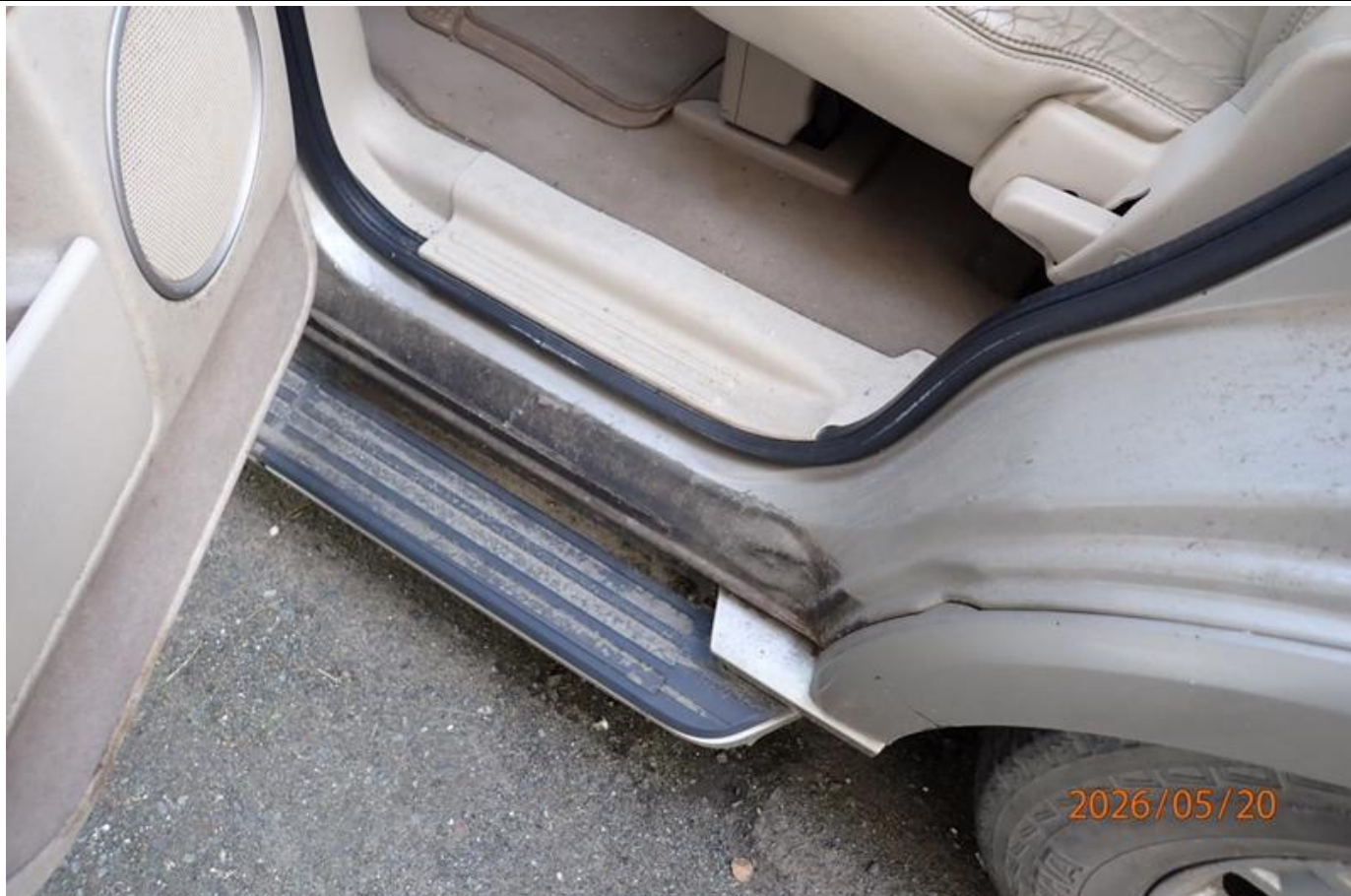
Fot. nr 153