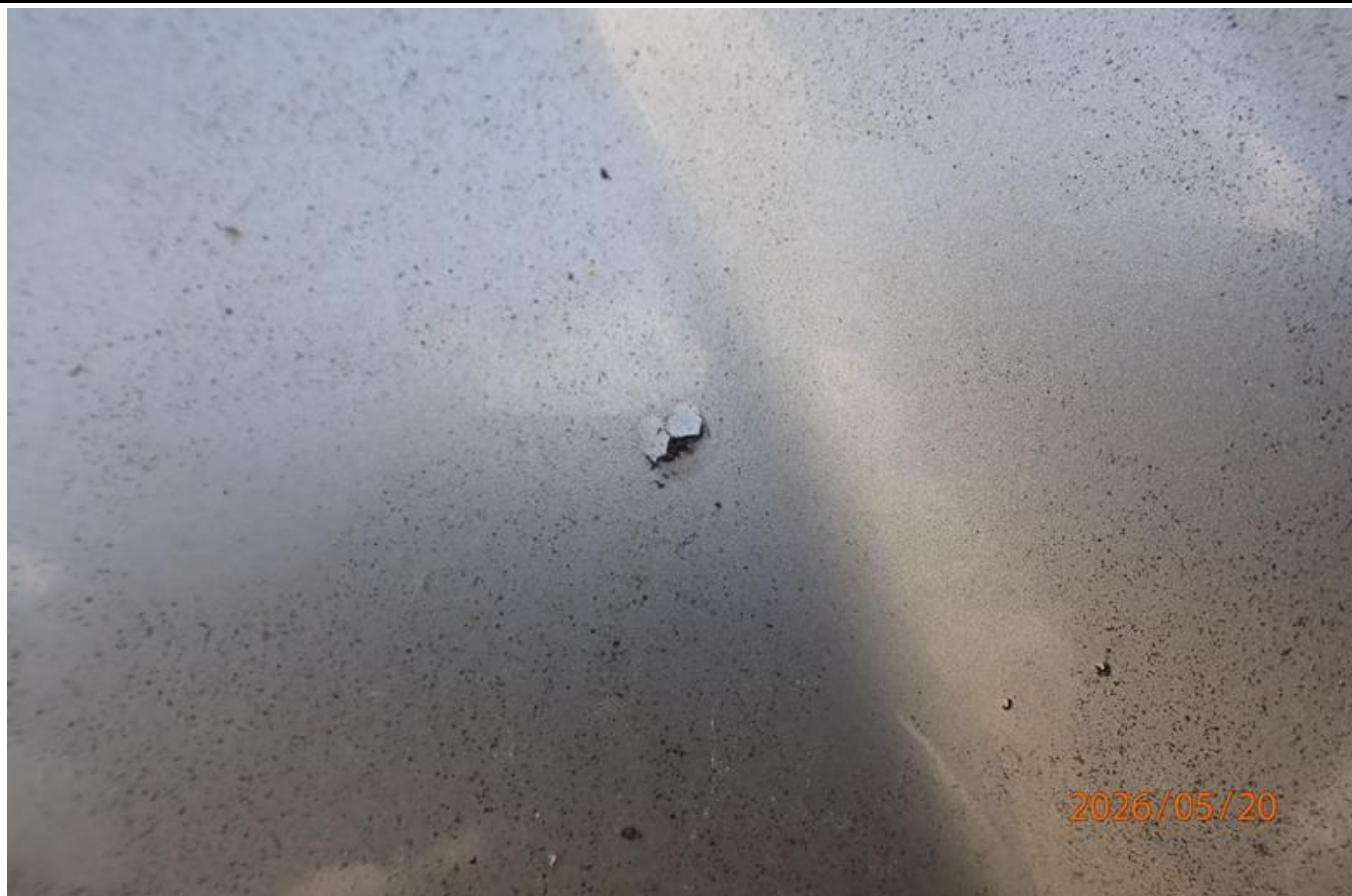
Fot. nr 91