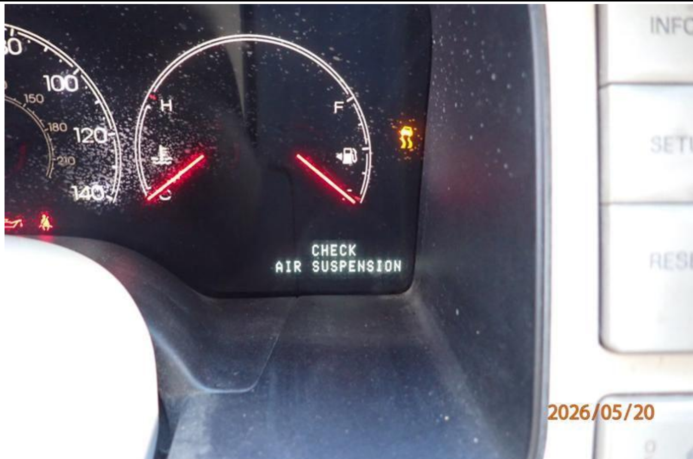
Fot. nr 193