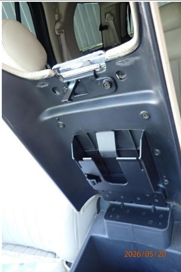
Fot. nr 183