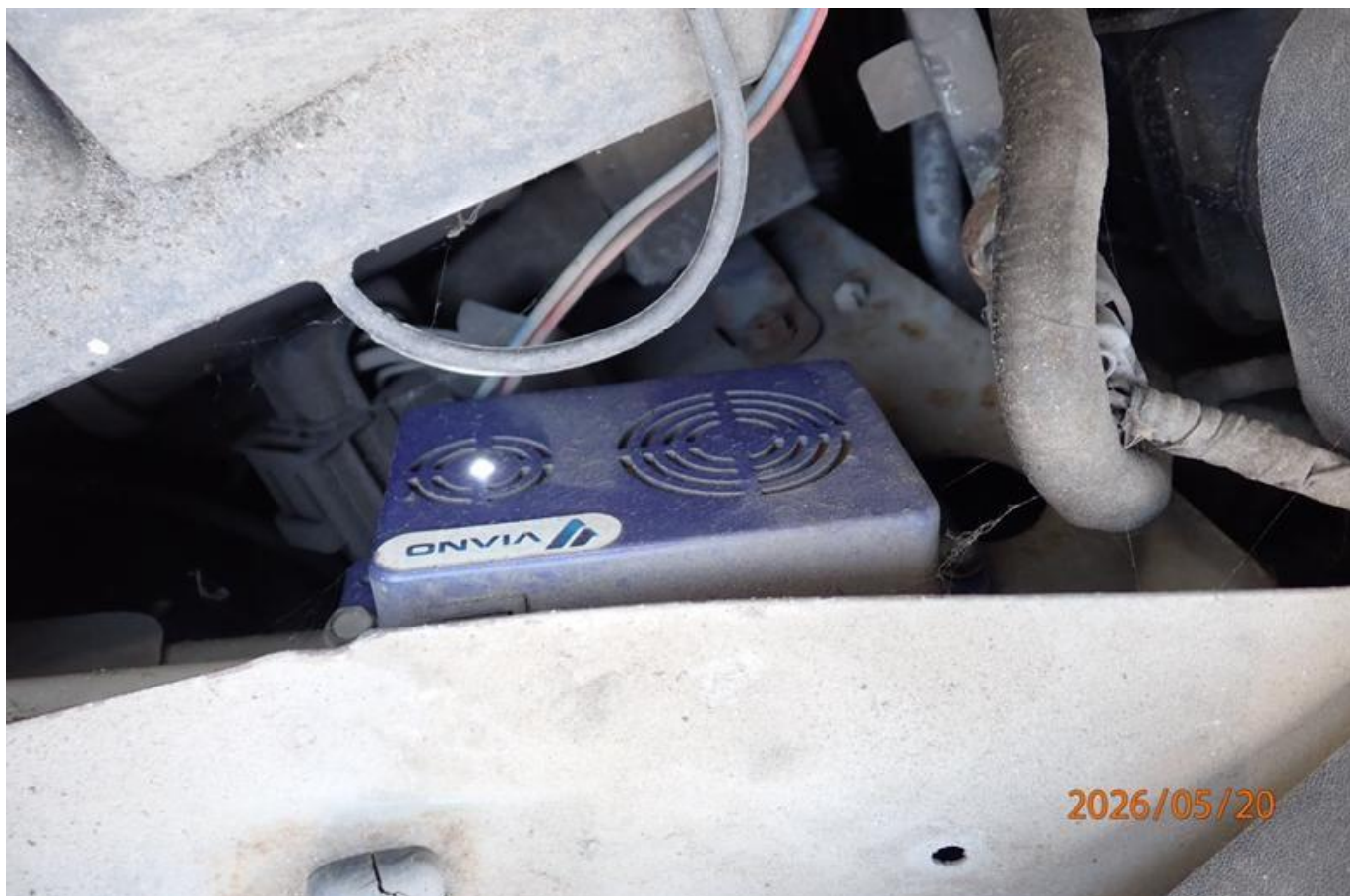
Fot. nr 100