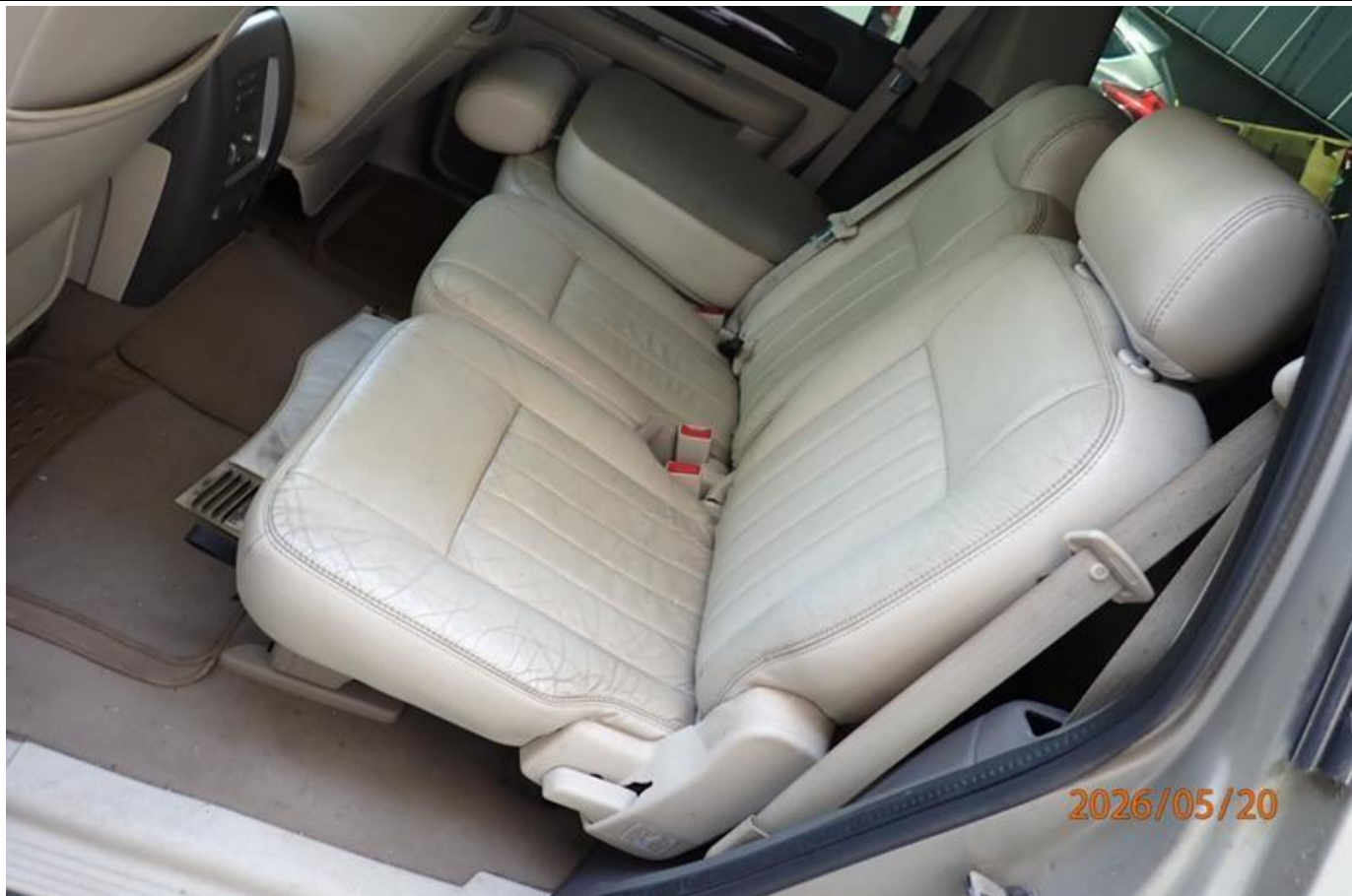
Fot. nr 155