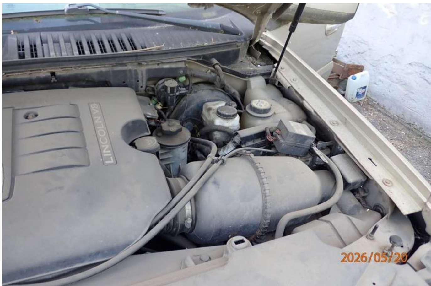
Fot. nr 94