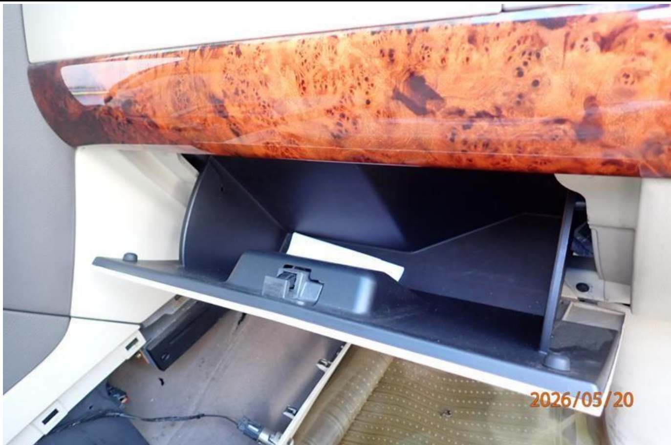
Fot. nr 113