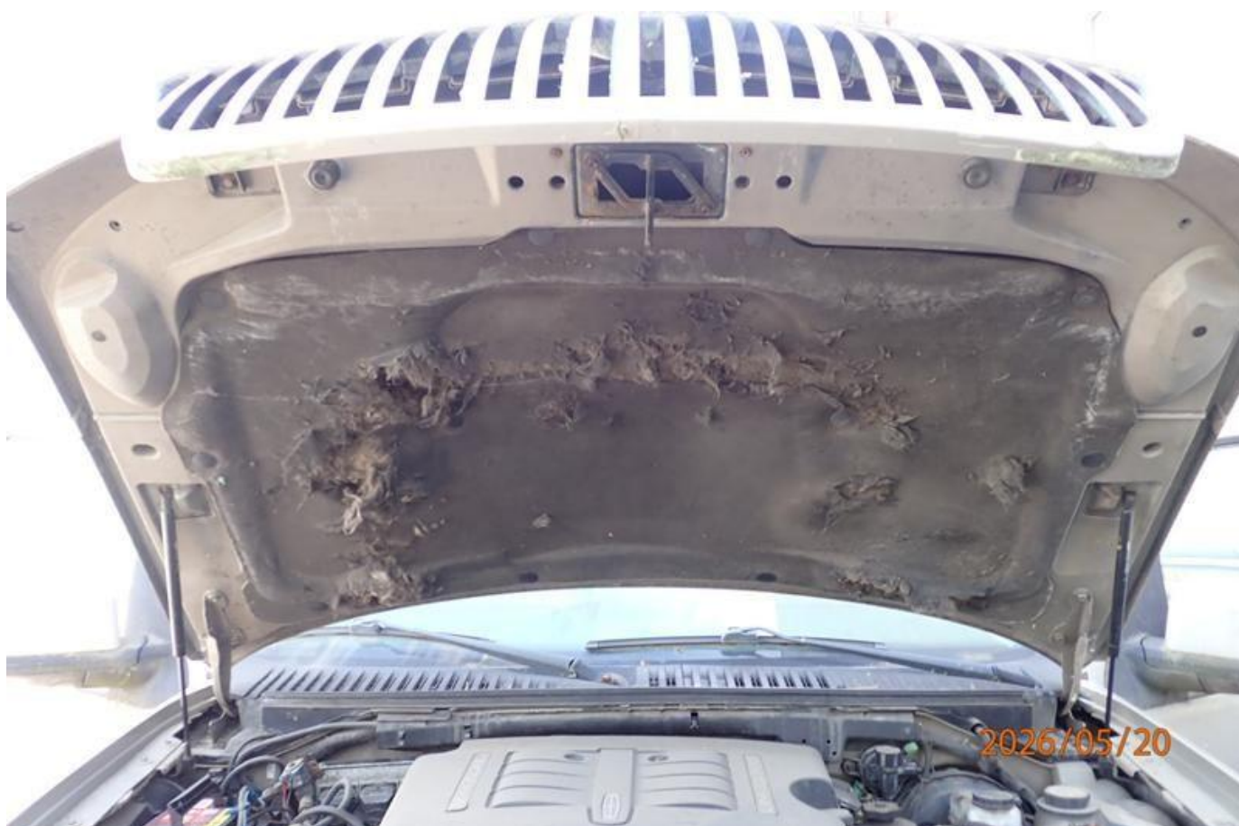
Fot. nr 92