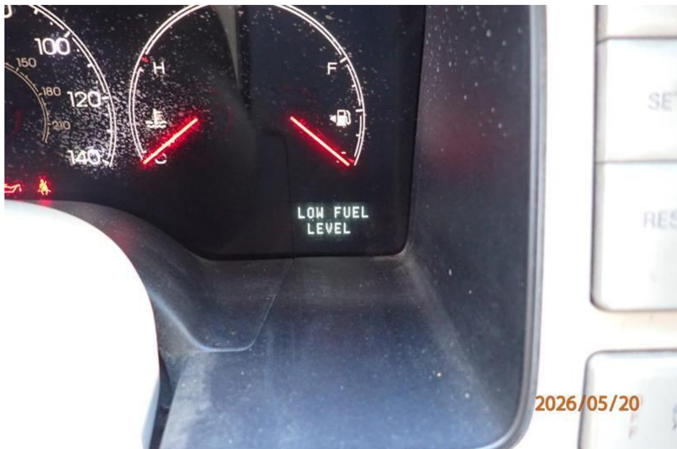
Fot. nr 190