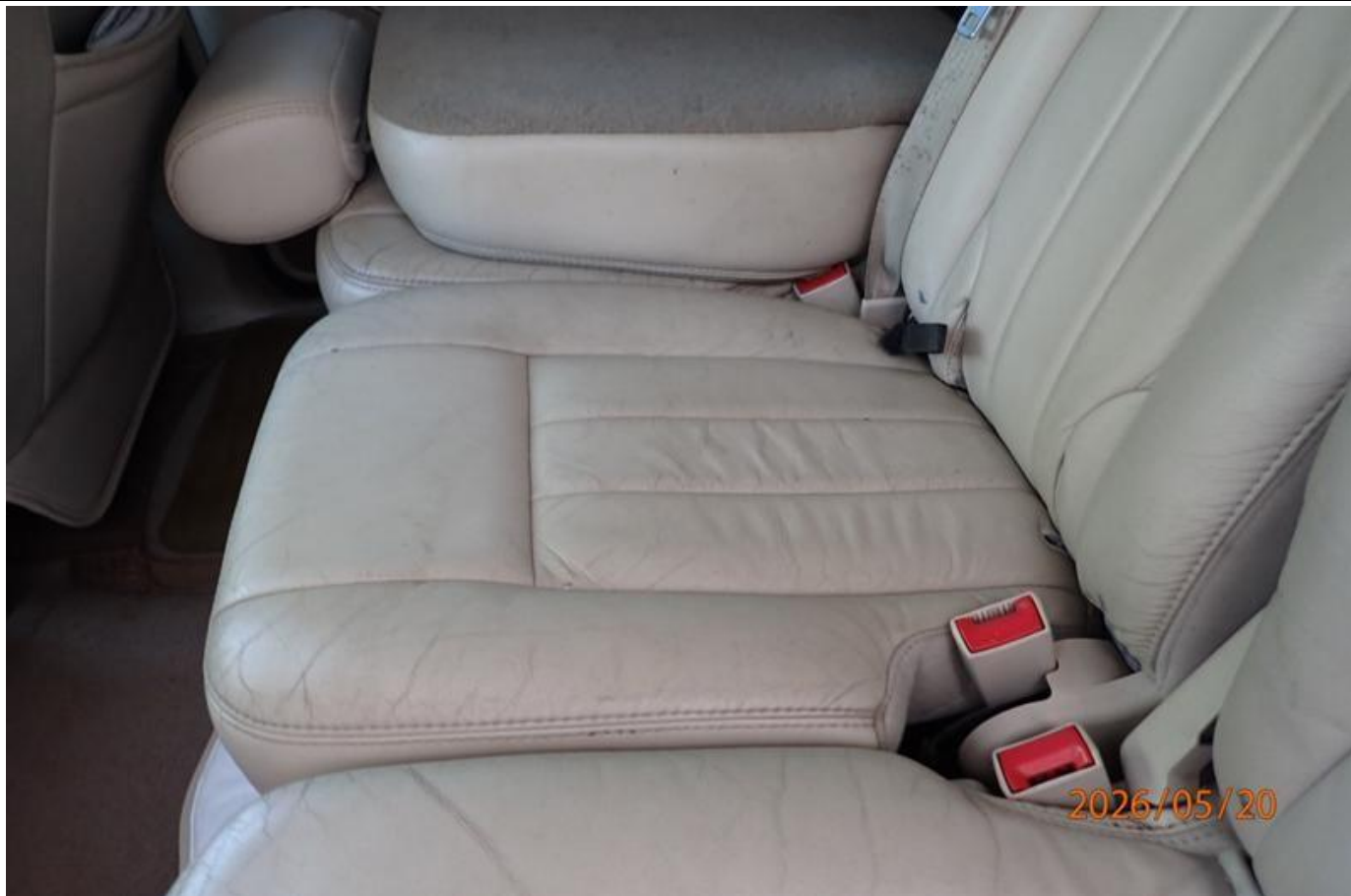
Fot. nr 157