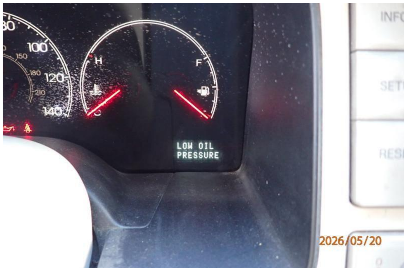
Fot. nr 192