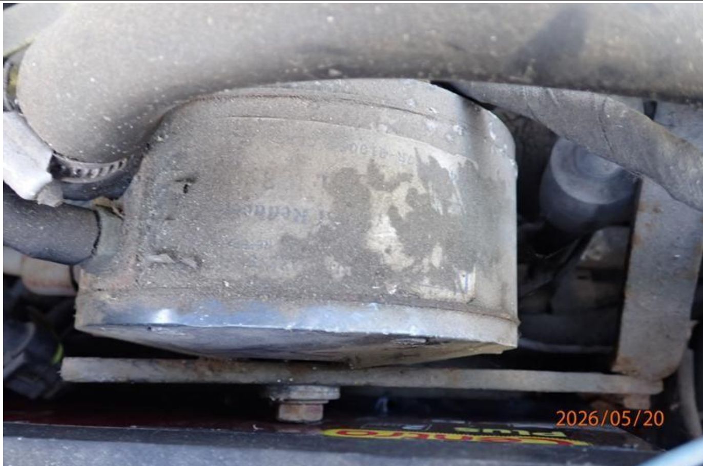
Fot. nr 99