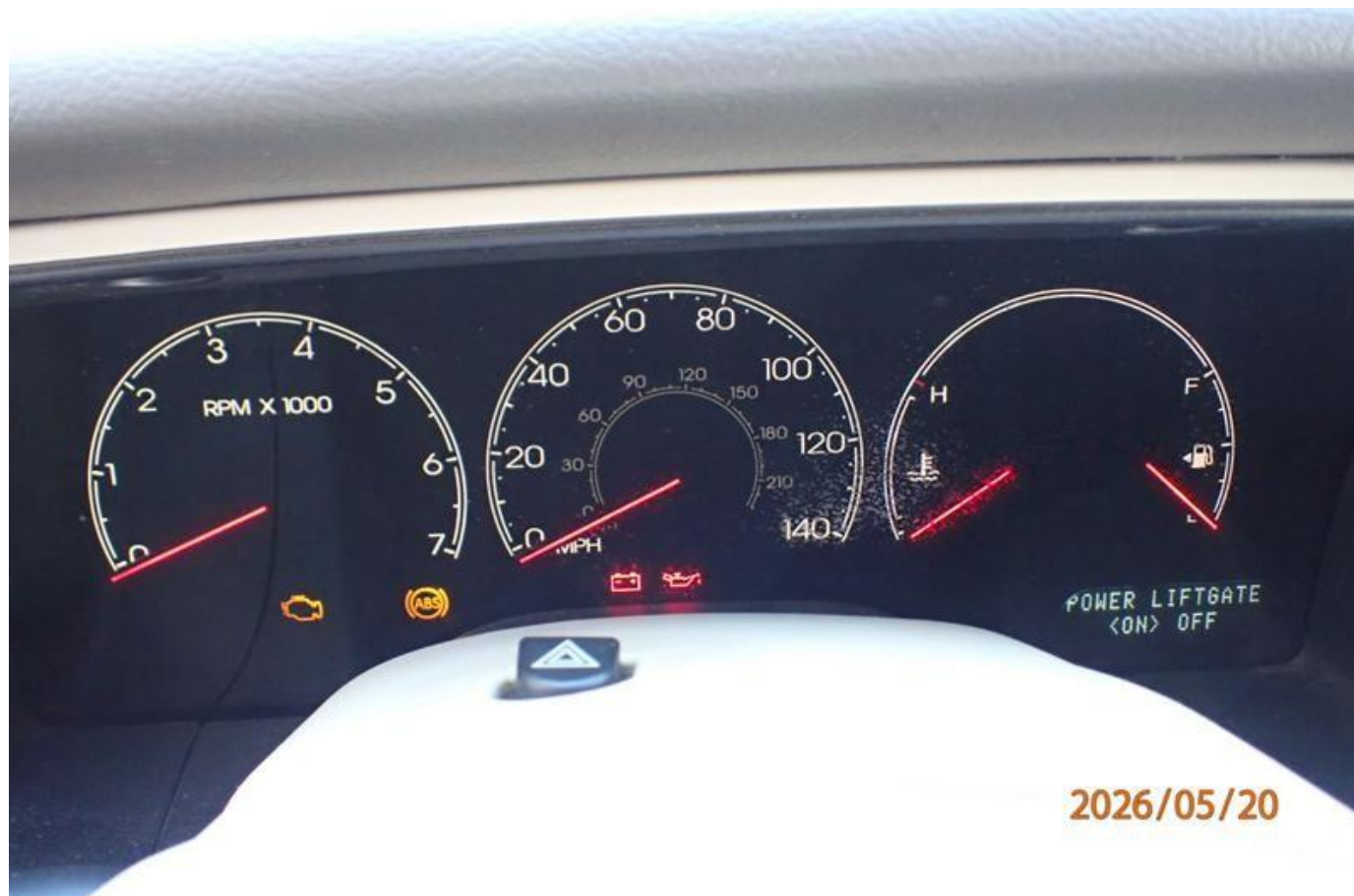
Fot. nr 194