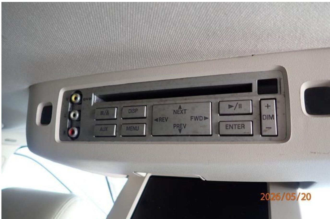
Fot. nr 130