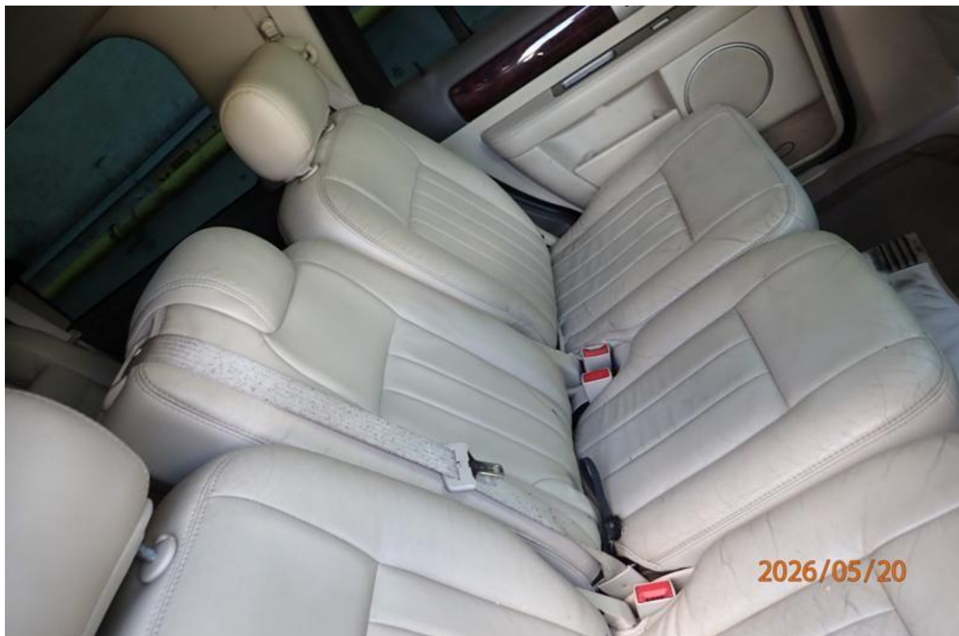
Fot. nr 124