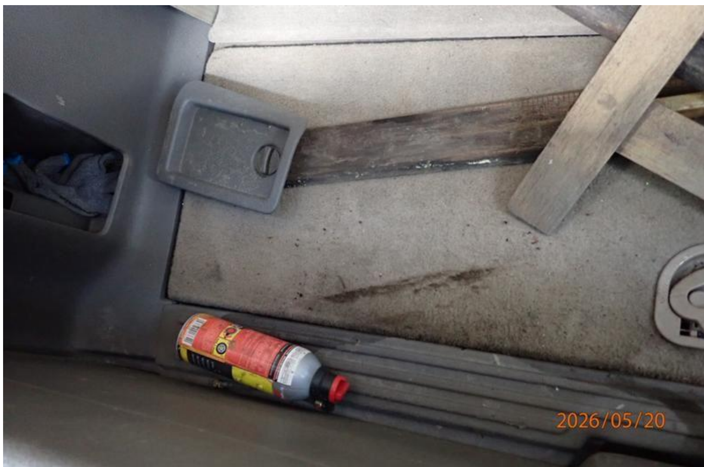
Fot. nr 144