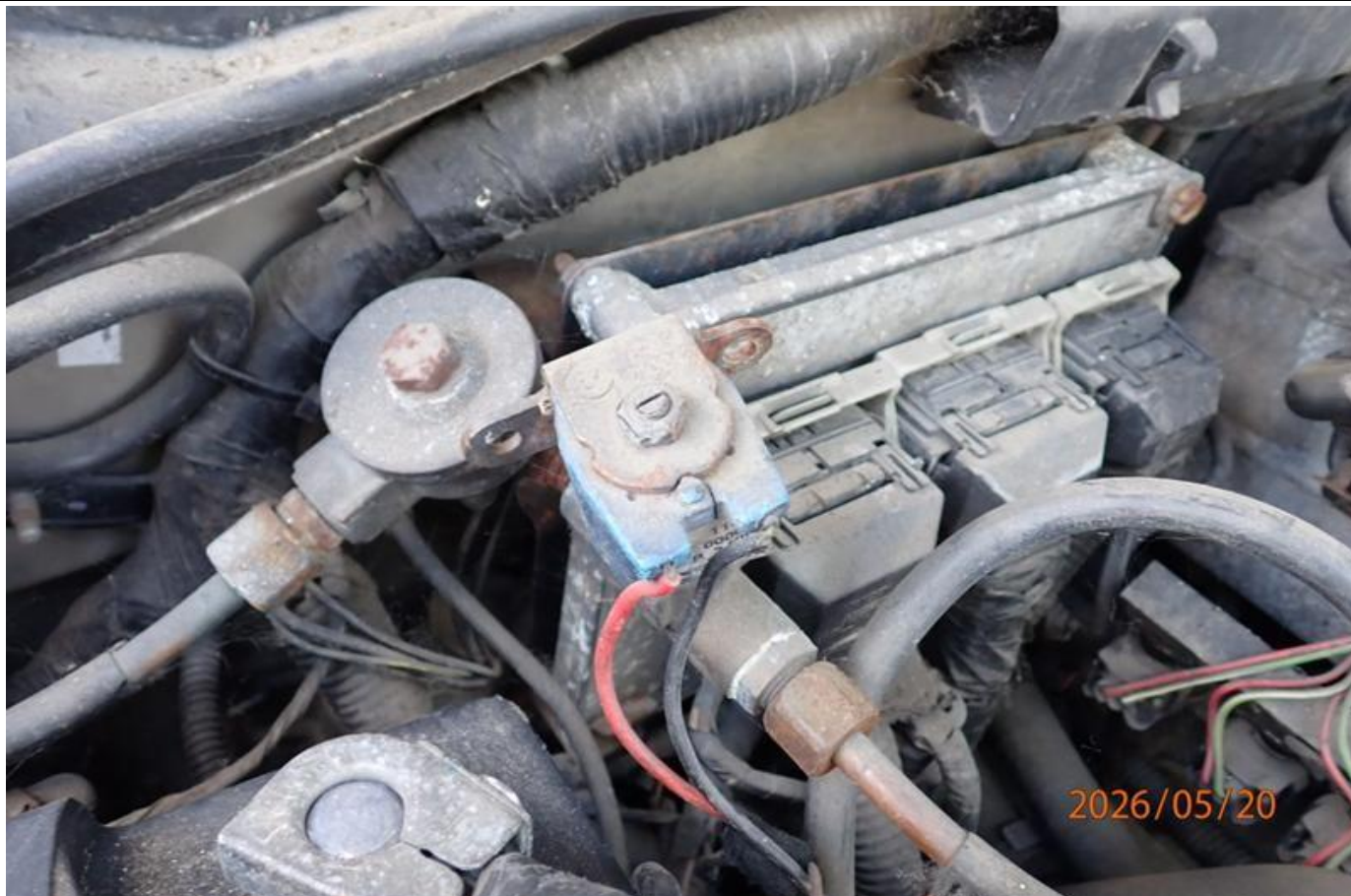
Fot. nr 97