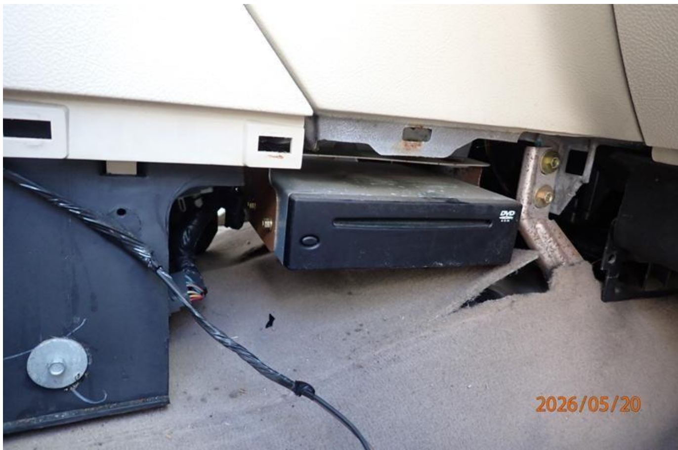
Fot. nr 112