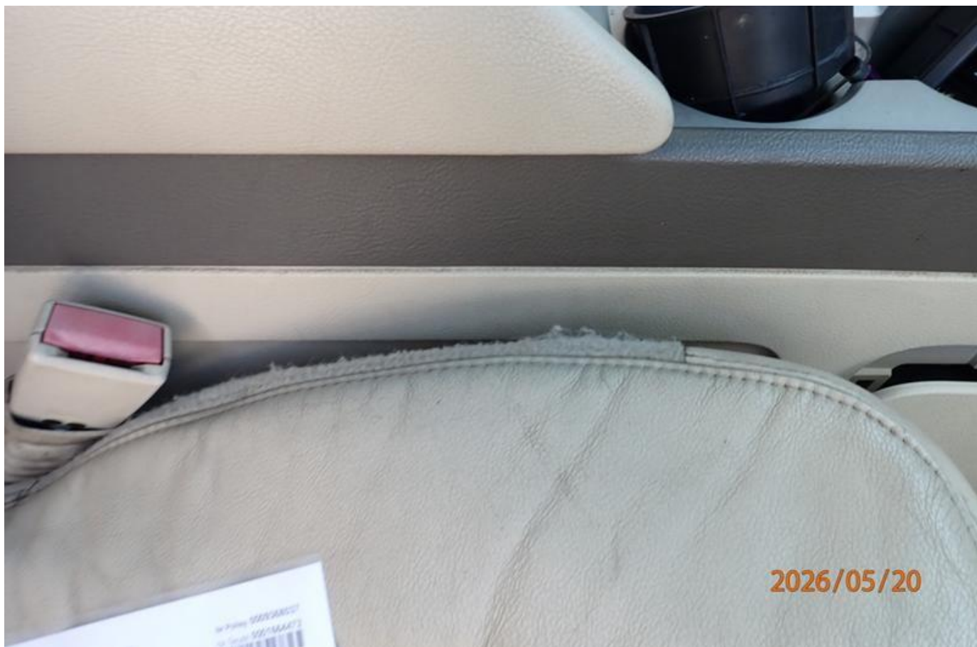
Fot. nr 110