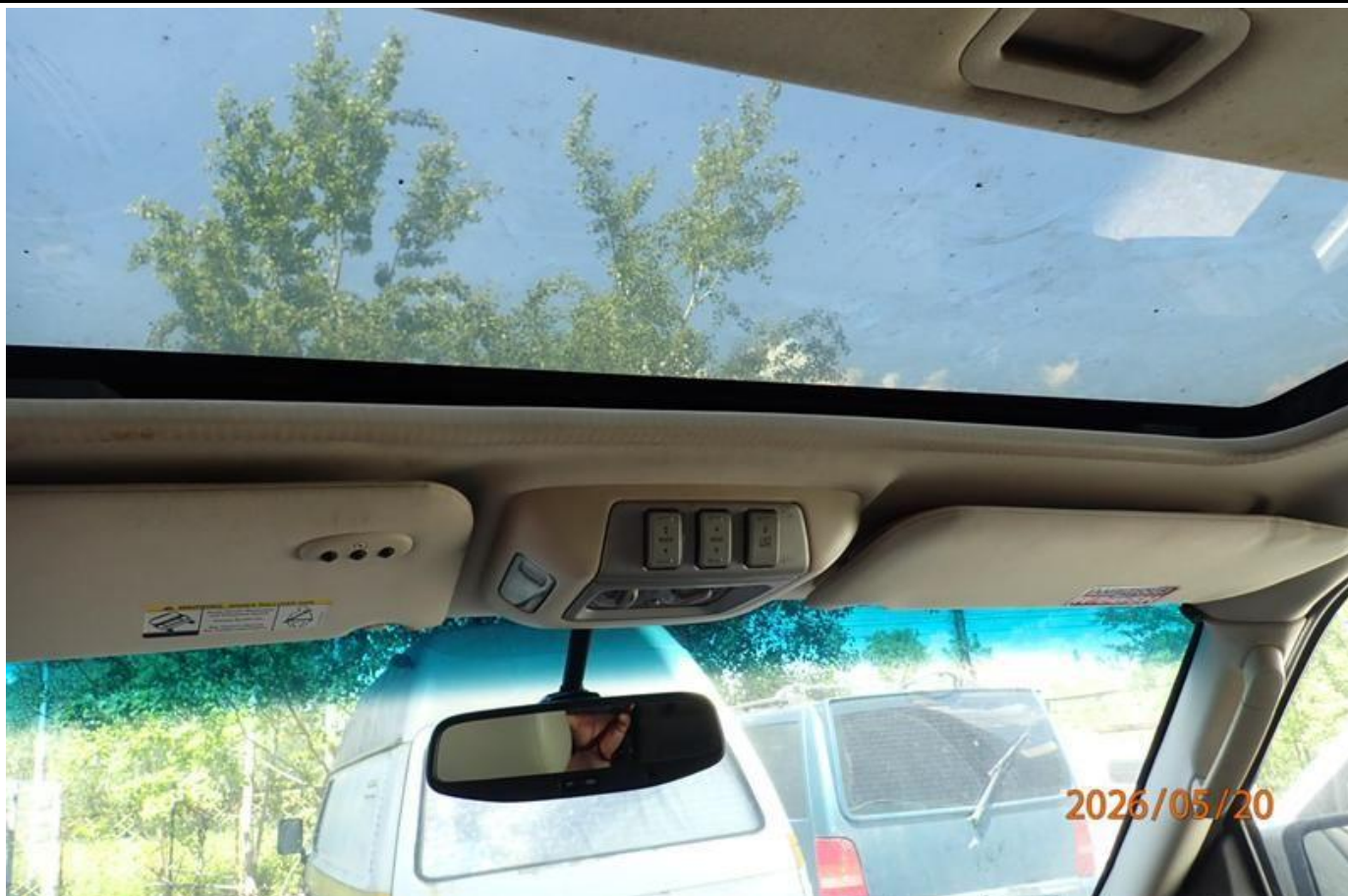
Fot. nr 161