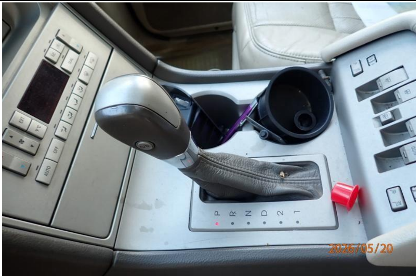
Fot. nr 181