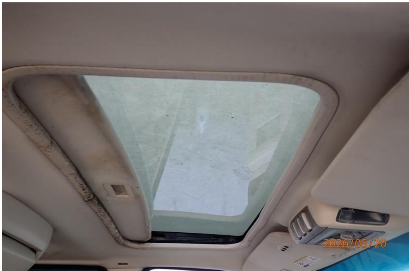
Fot. nr 106