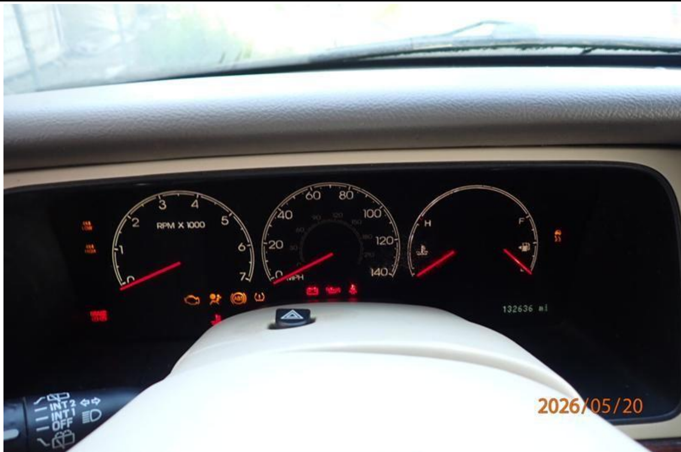
Fot. nr 187