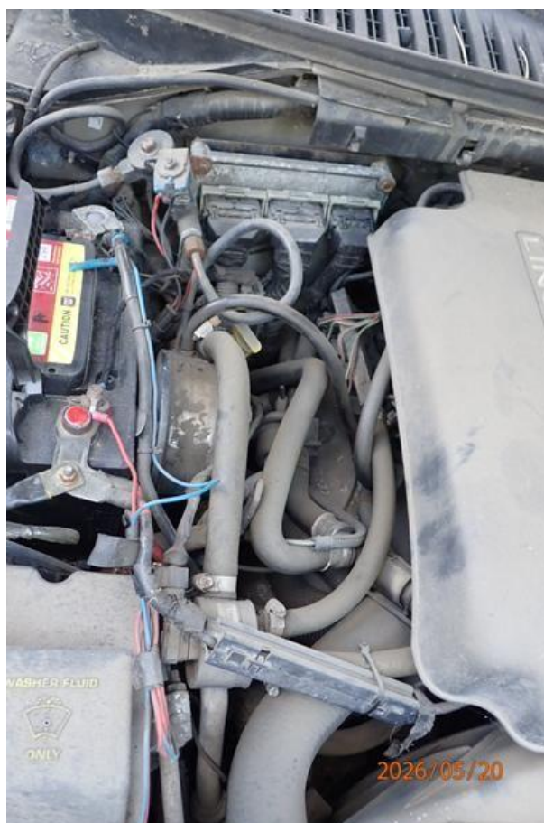
Fot. nr 98