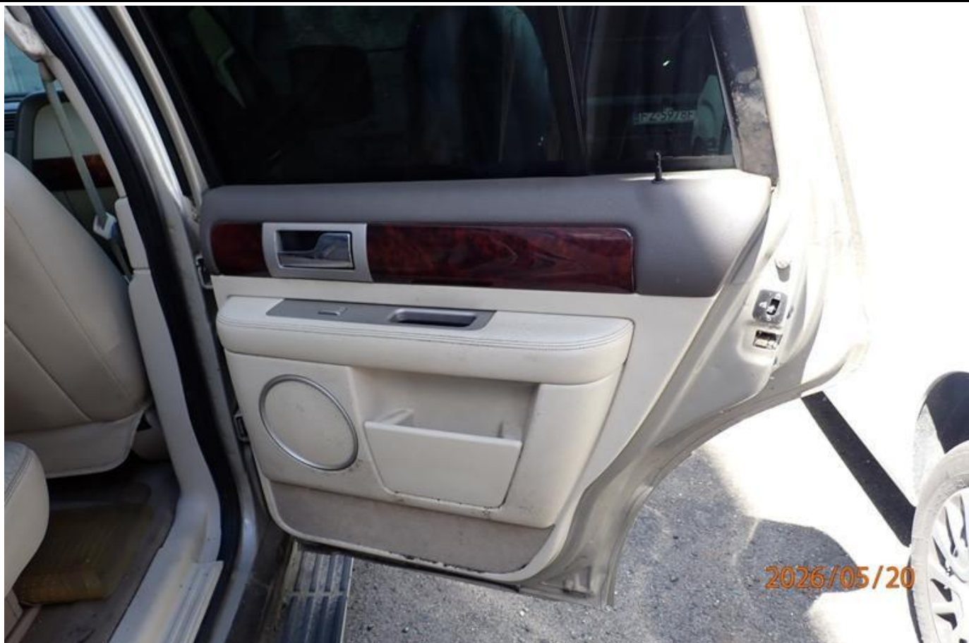
Fot. nr 115