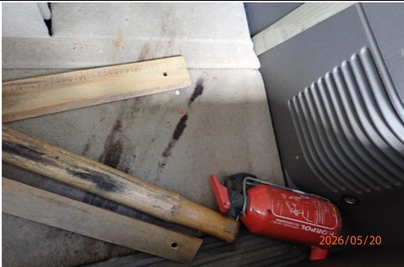
Fot. nr 145