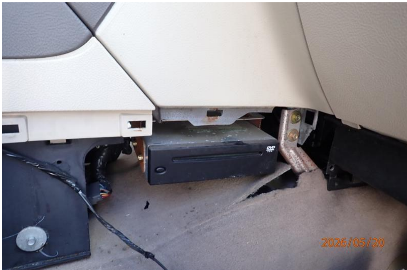
Fot. nr 114