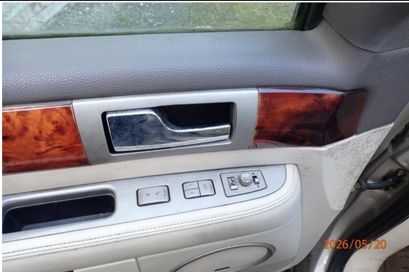
Fot. nr 163