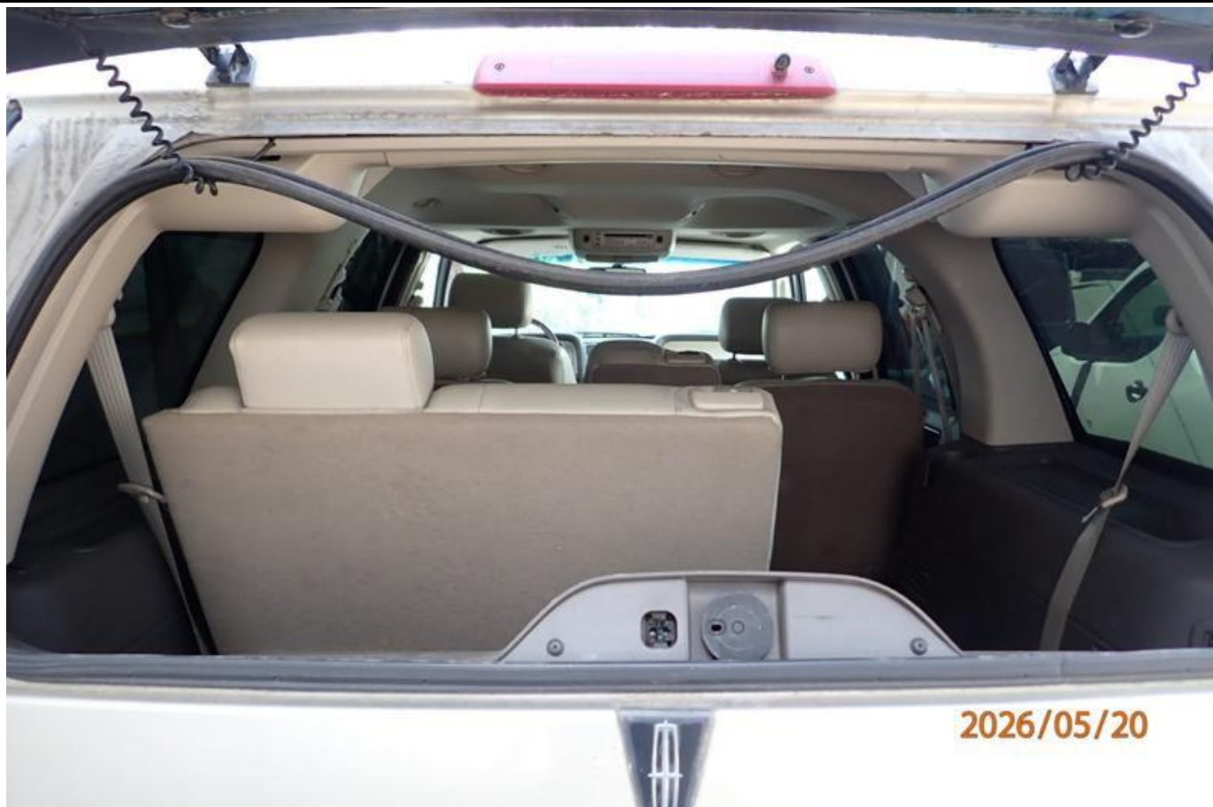
Fot. nr 137