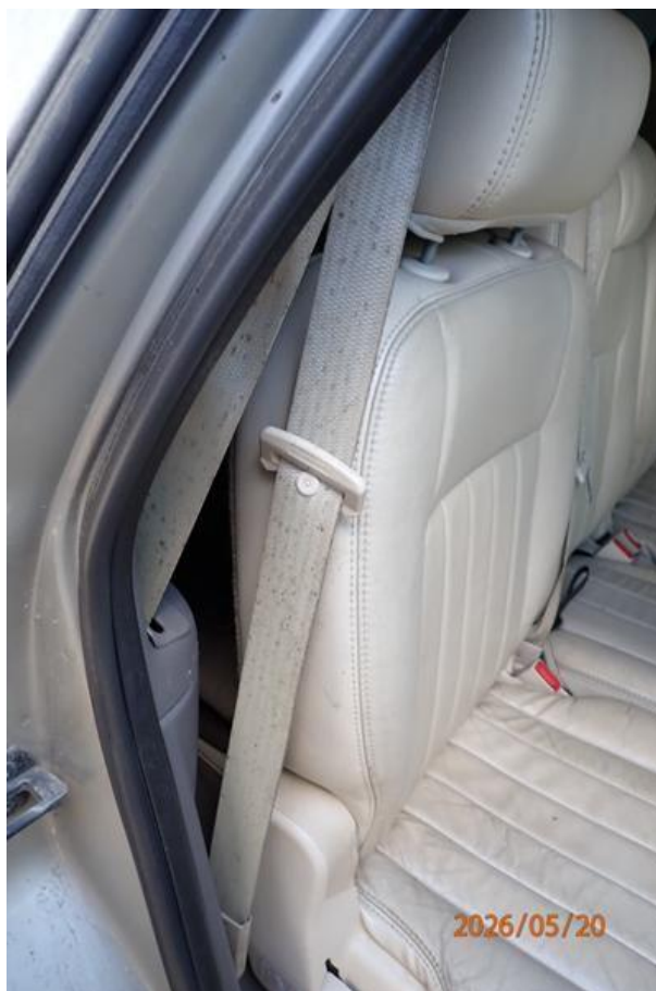
Fot. nr 122