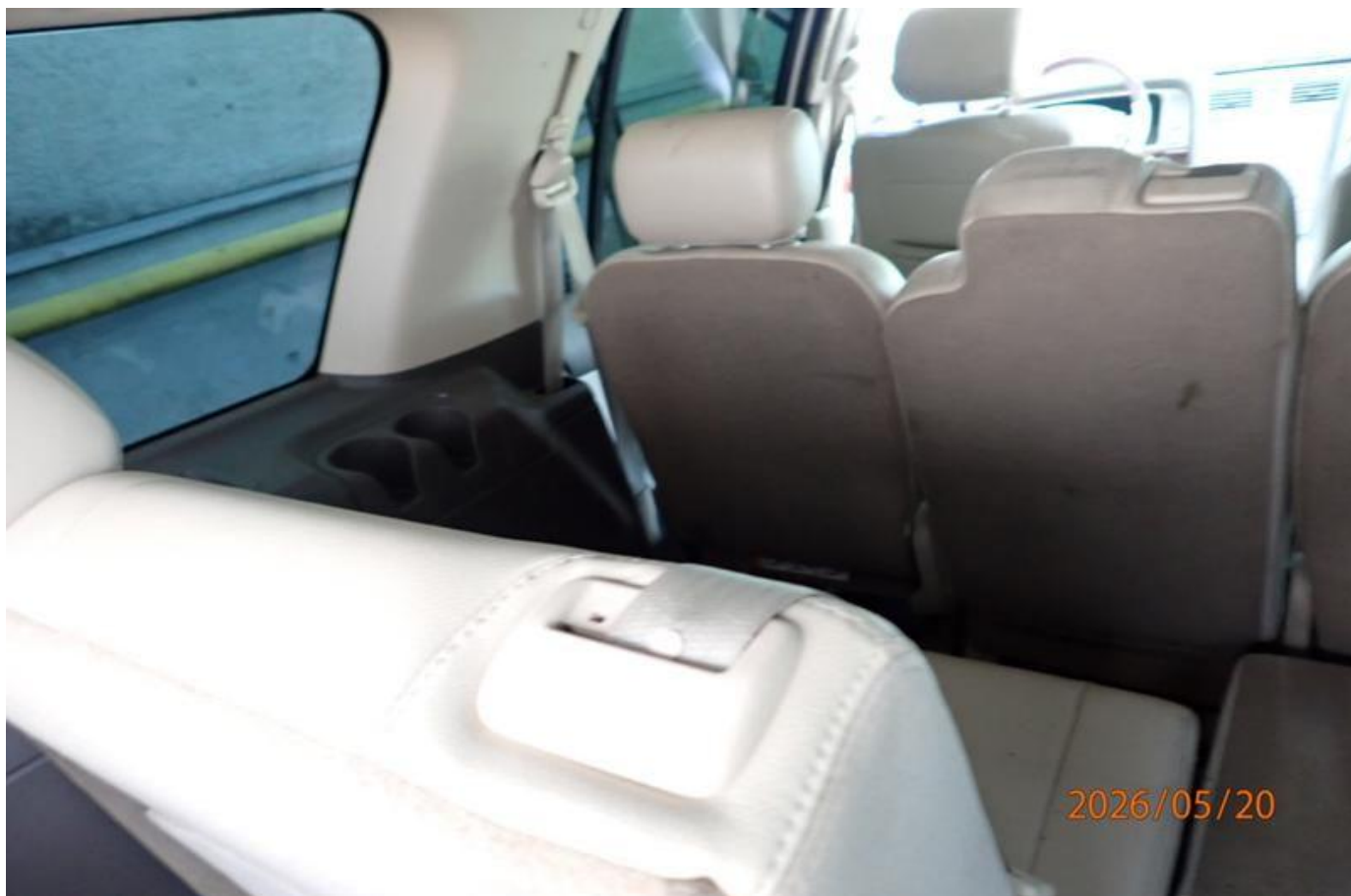
Fot. nr 142