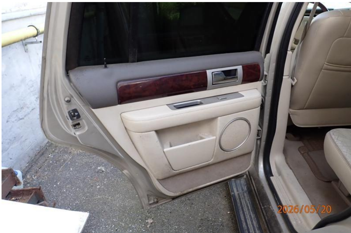
Fot. nr 150