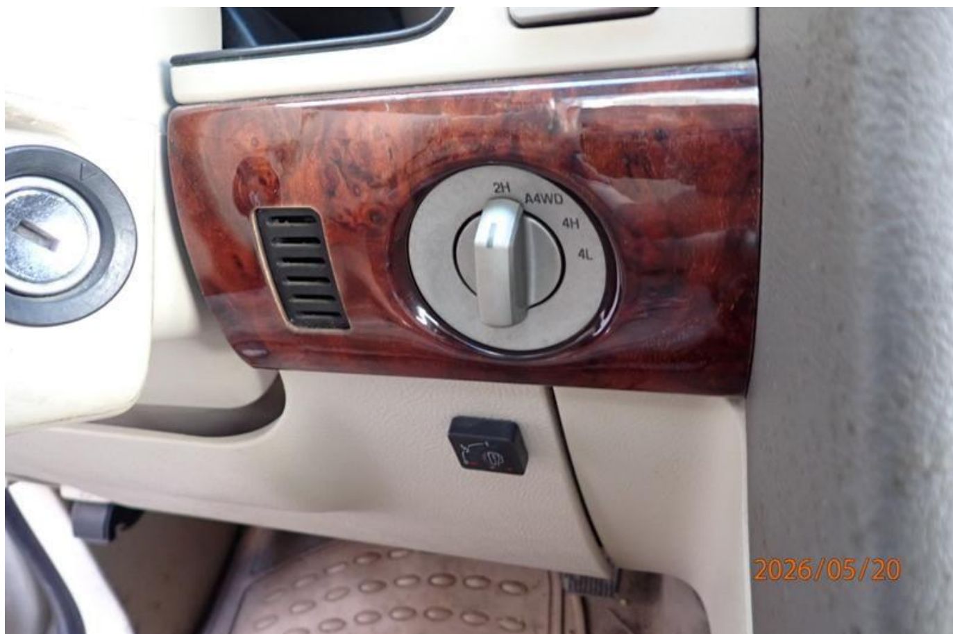
Fot. nr 174