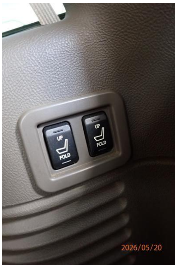
Fot. nr 140