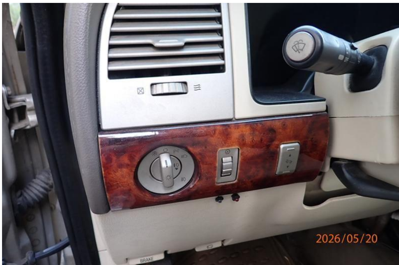
Fot. nr 170