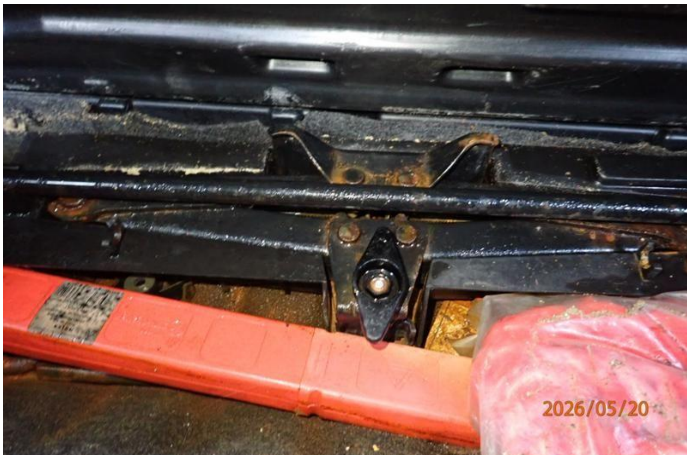
Fot. nr 146