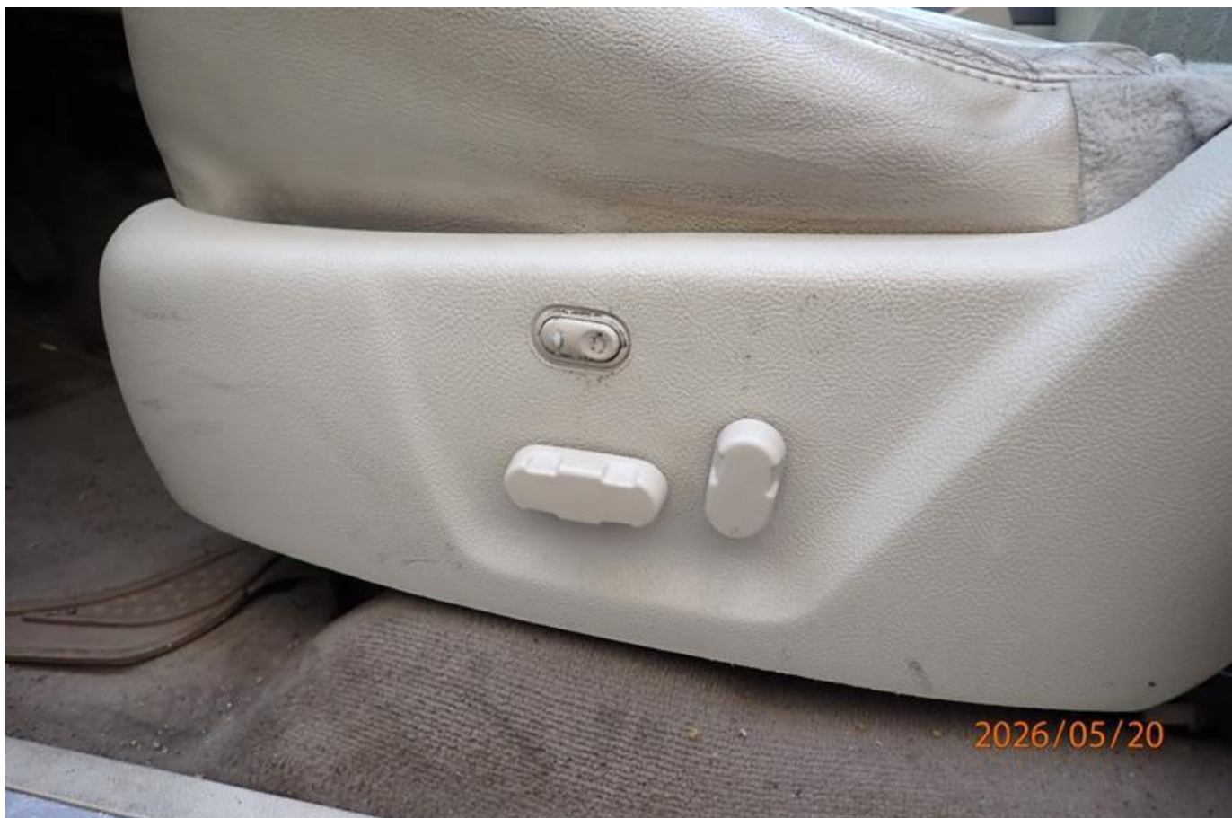
Fot. nr 166