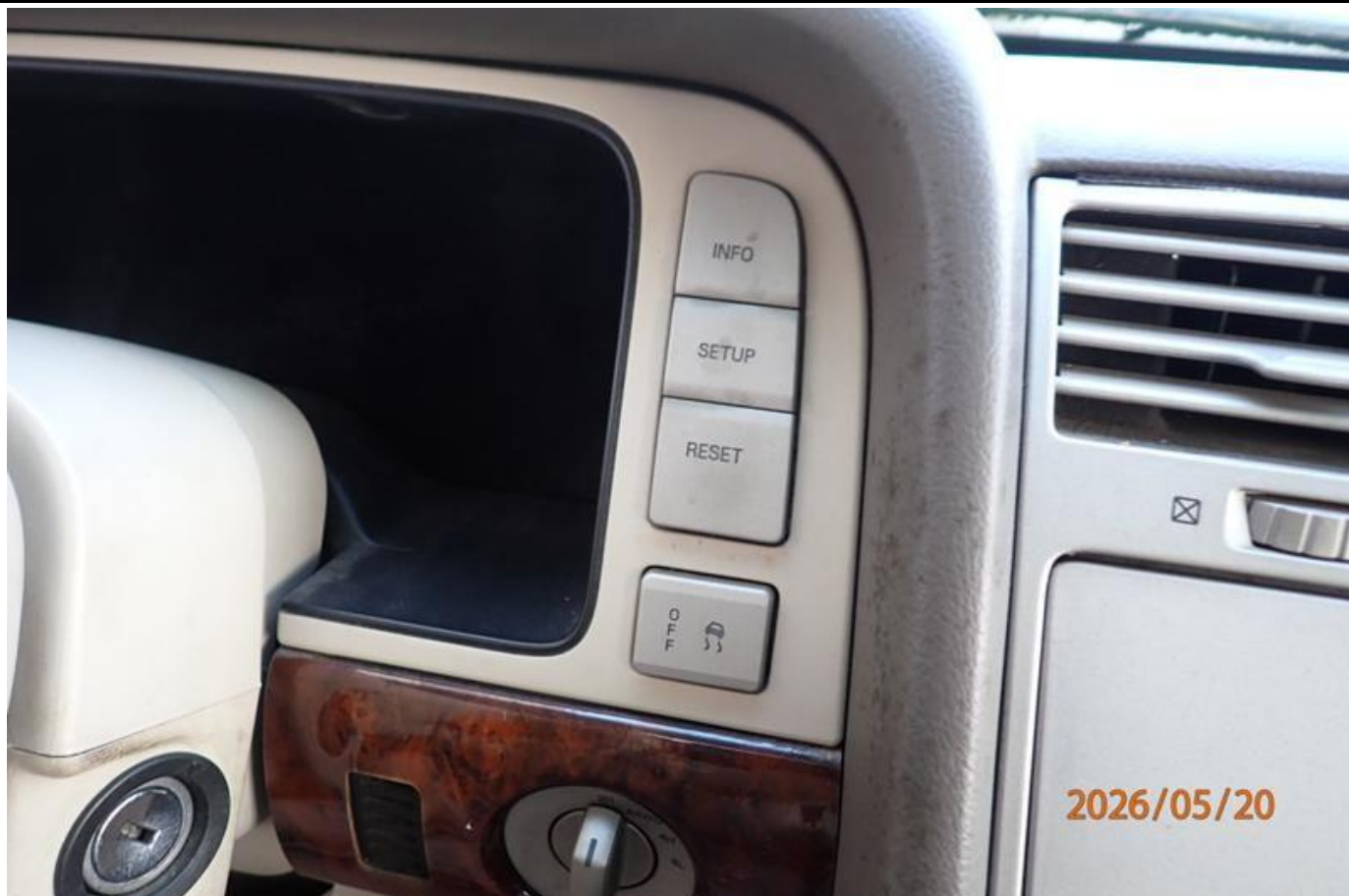
Fot. nr 173