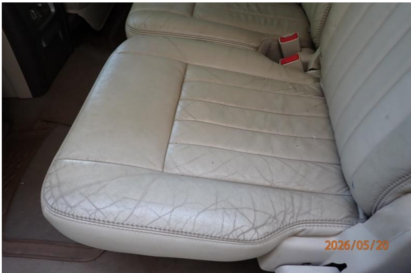
Fot. nr 156