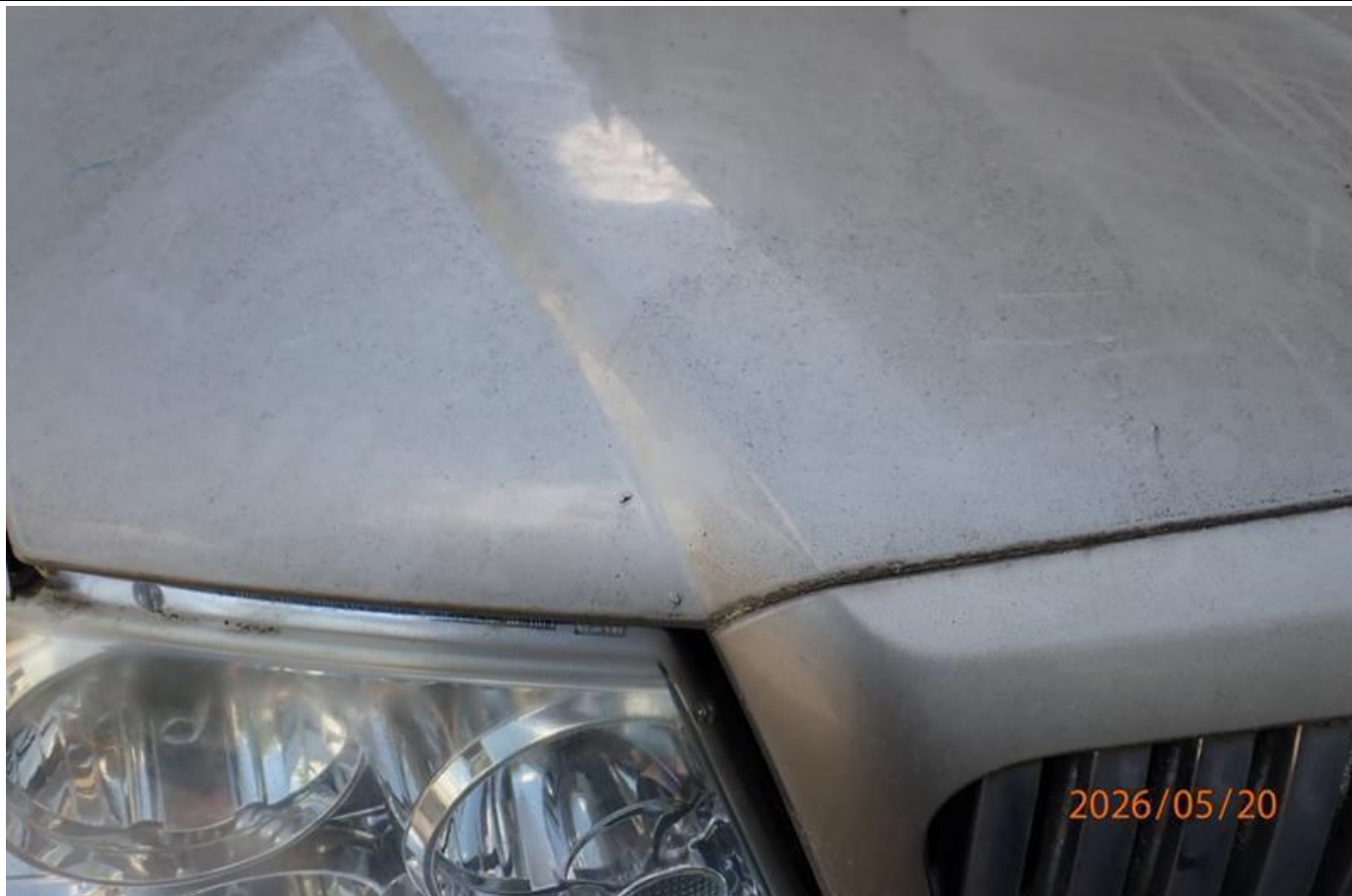
Fot. nr 89