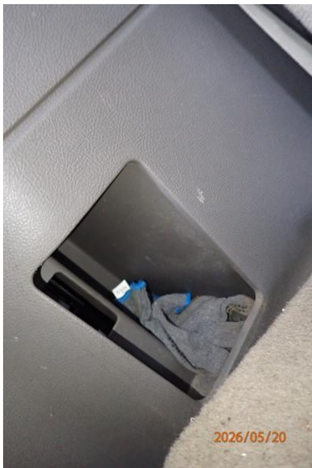
Fot. nr 148