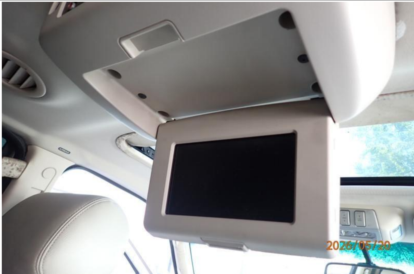
Fot. nr 131