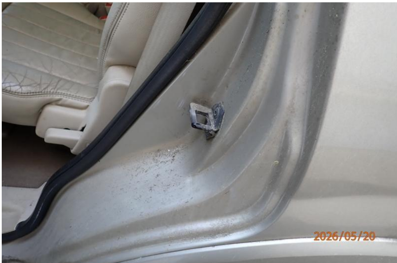
Fot. nr 154