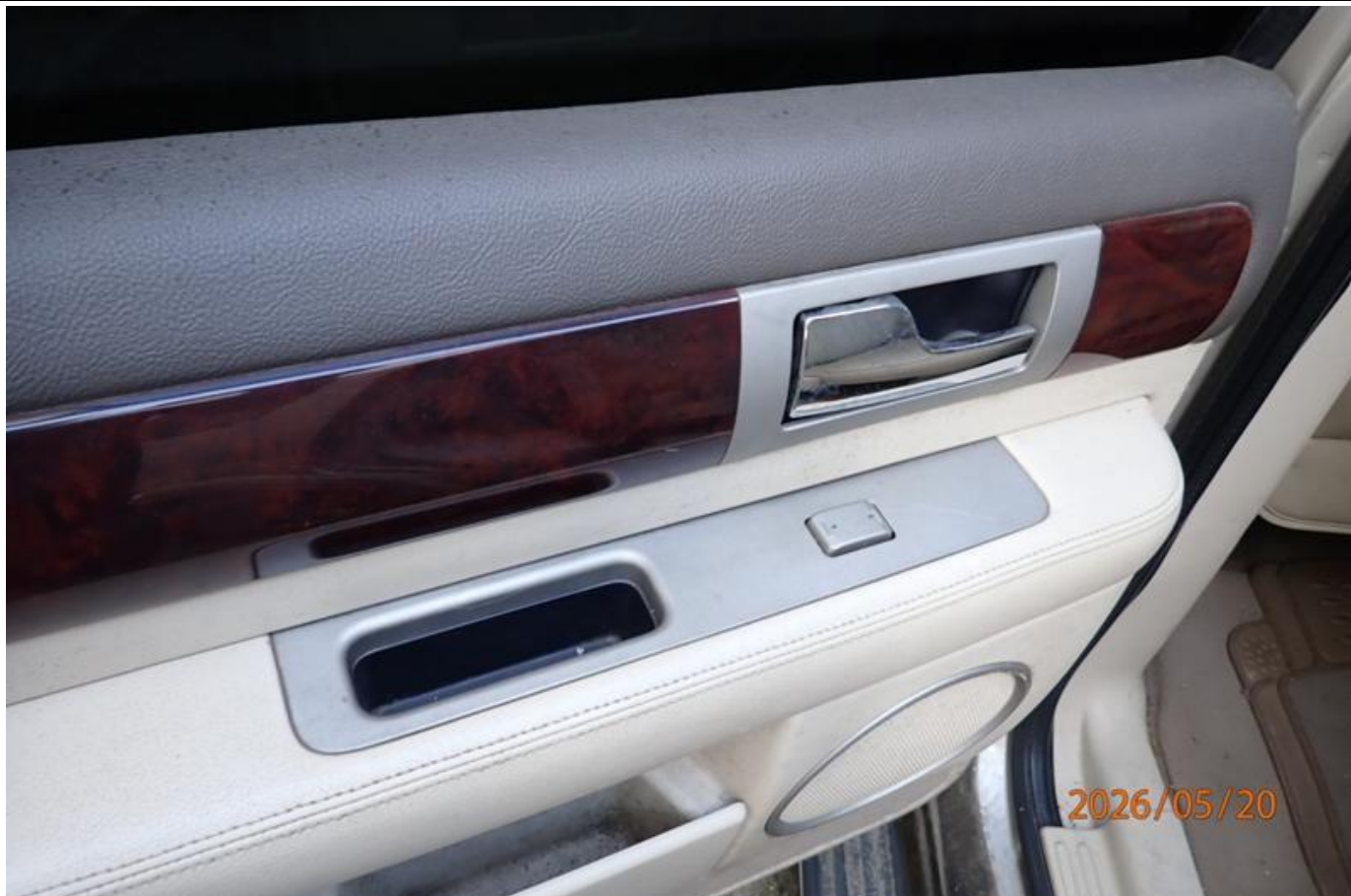
Fot. nr 151