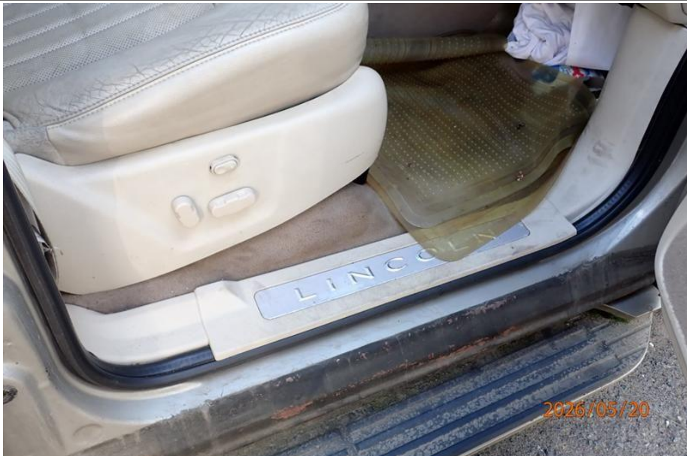
Fot. nr 103