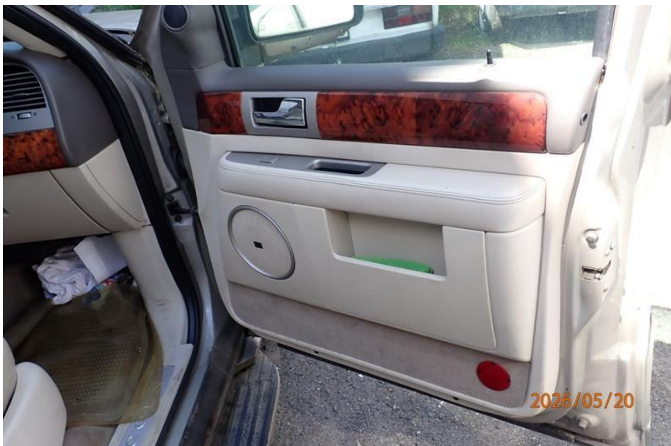
Fot. nr 102