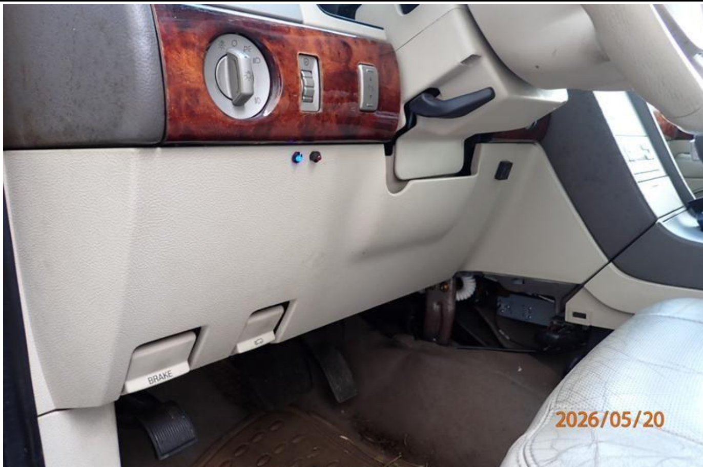
Fot. nr 167