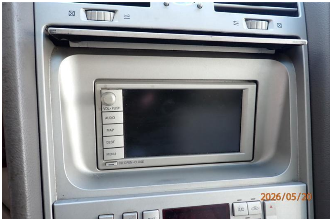
Fot. nr 178