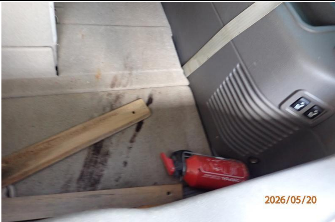
Fot. nr 139