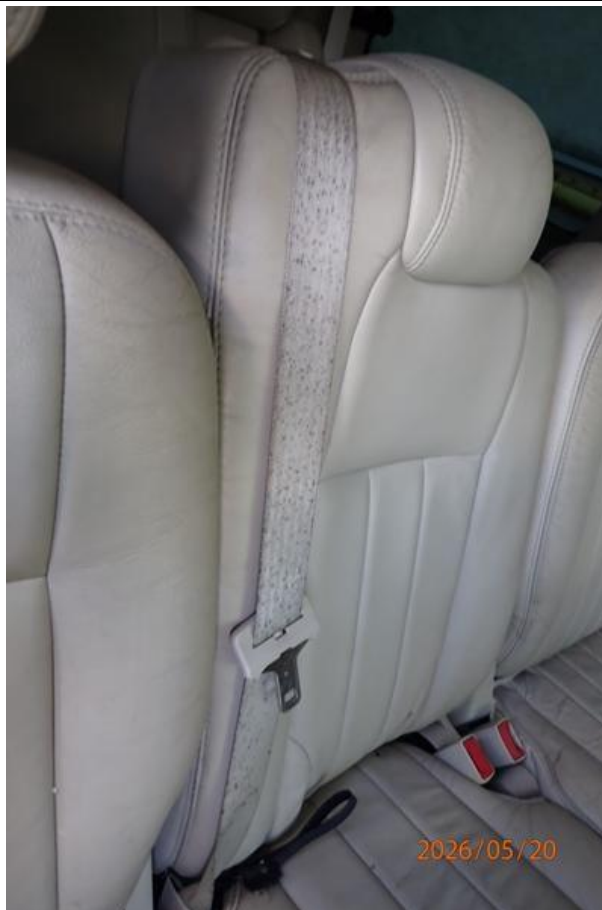
Fot. nr 125