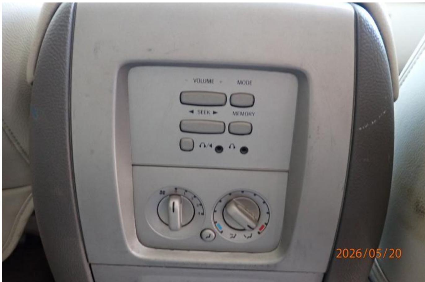
Fot. nr 128