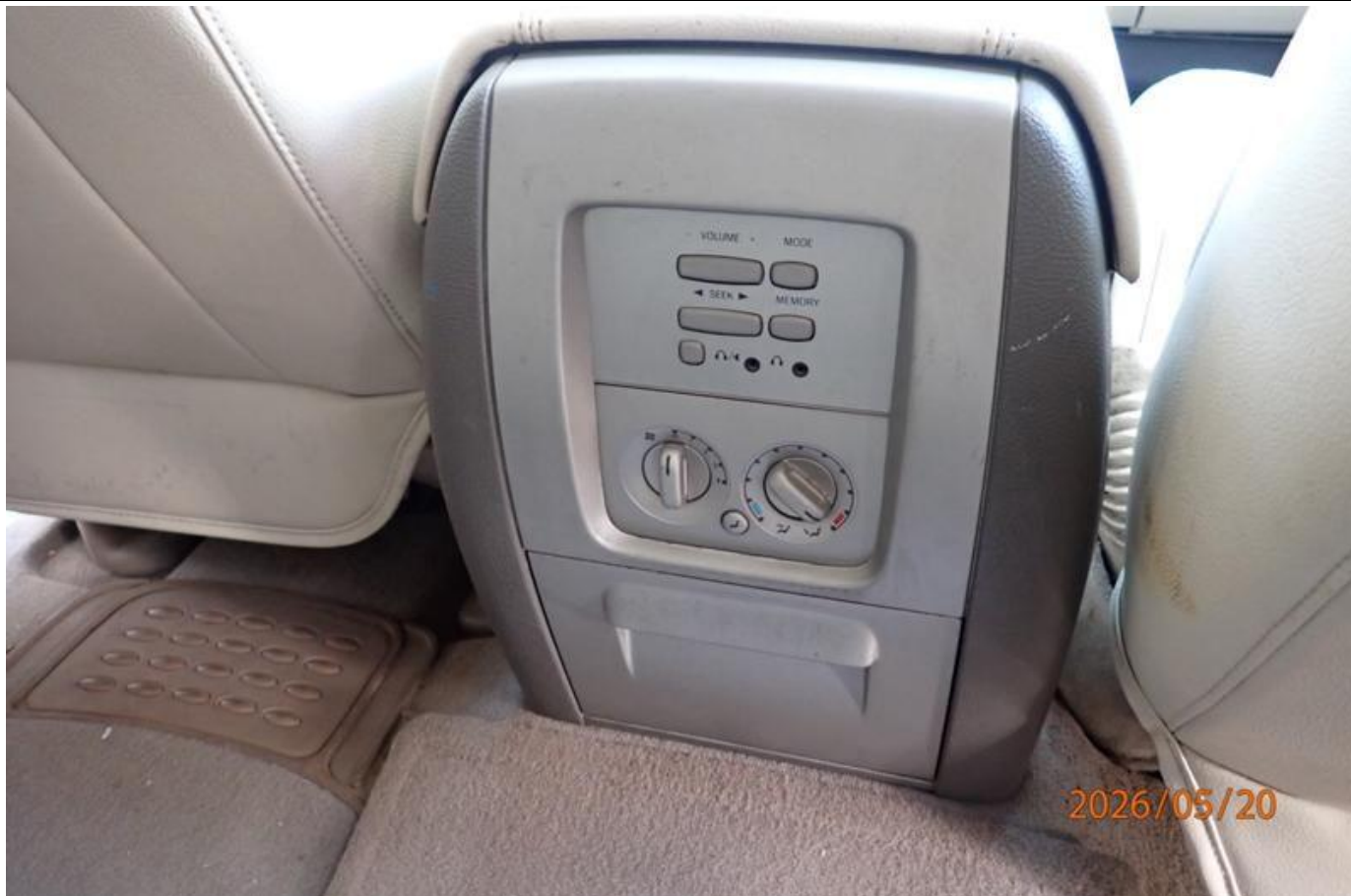
Fot. nr 127