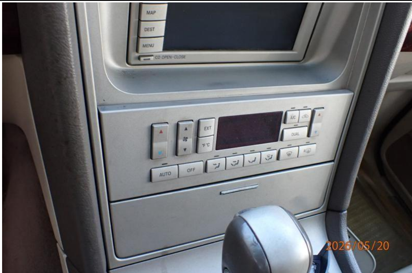
Fot. nr 197