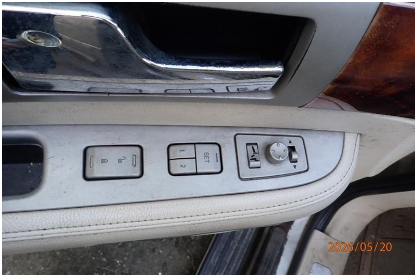
Fot. nr 165