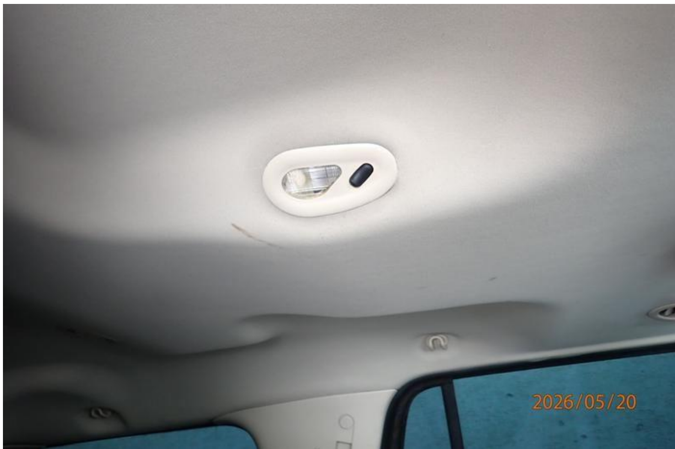
Fot. nr 132