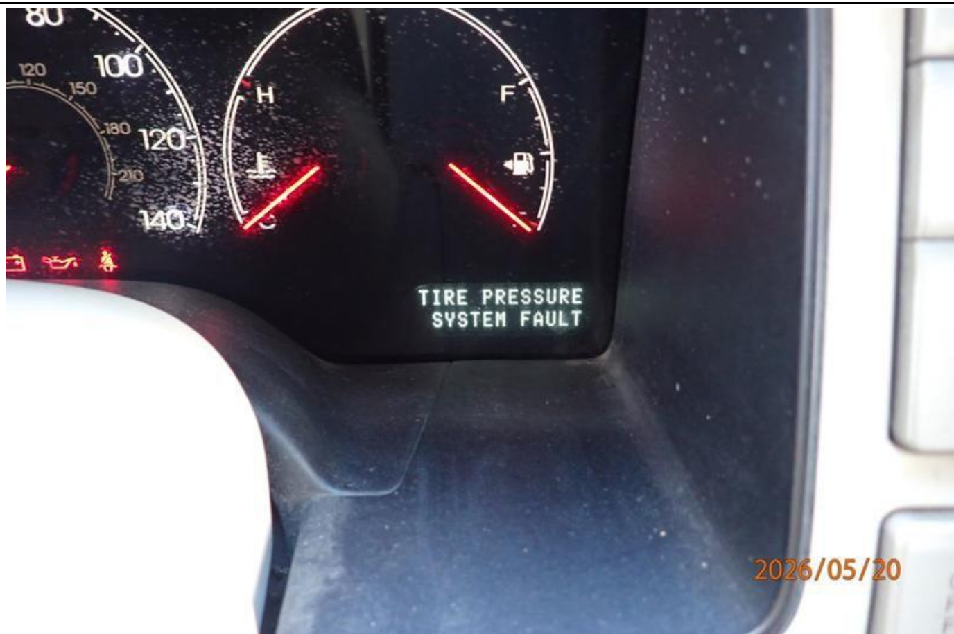
Fot. nr 189