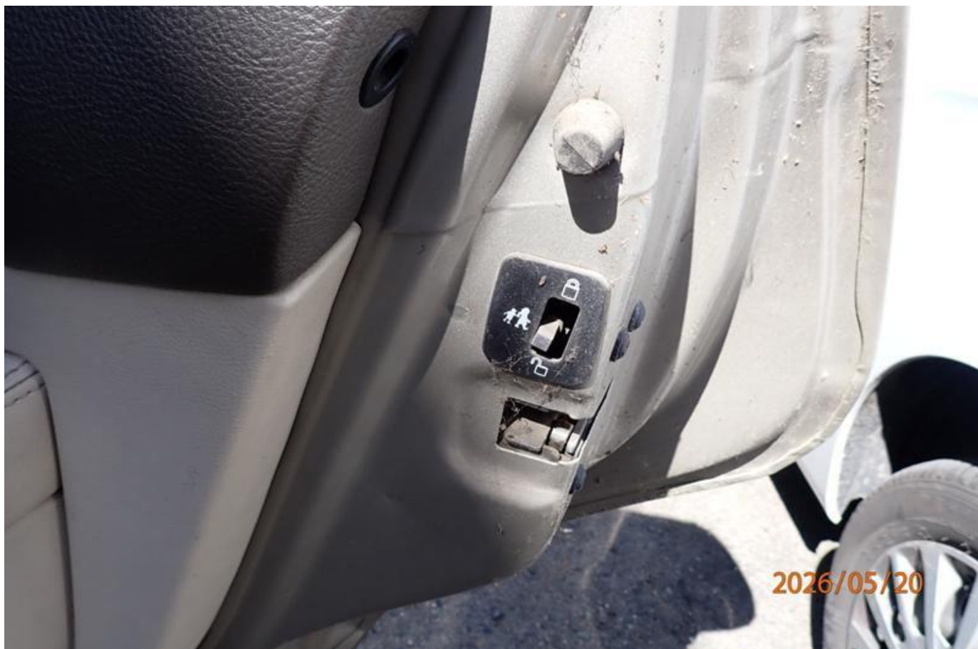
Fot. nr 116