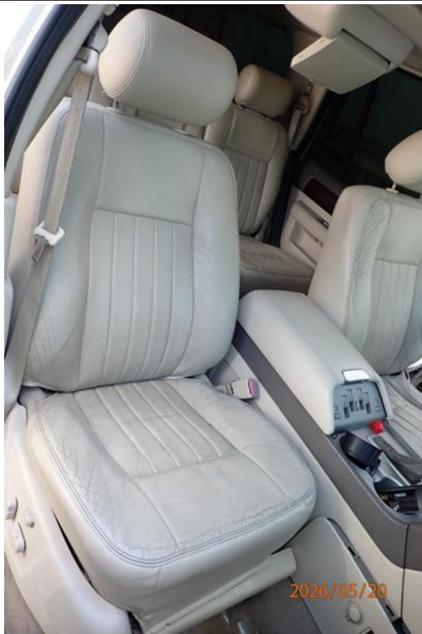
Fot. nr 107