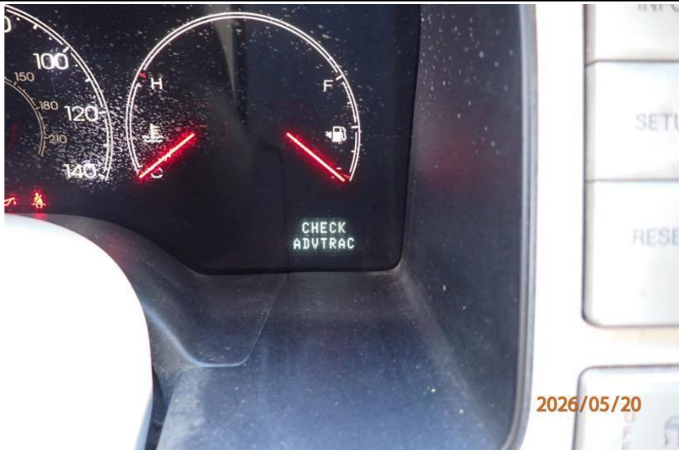
Fot. nr 191