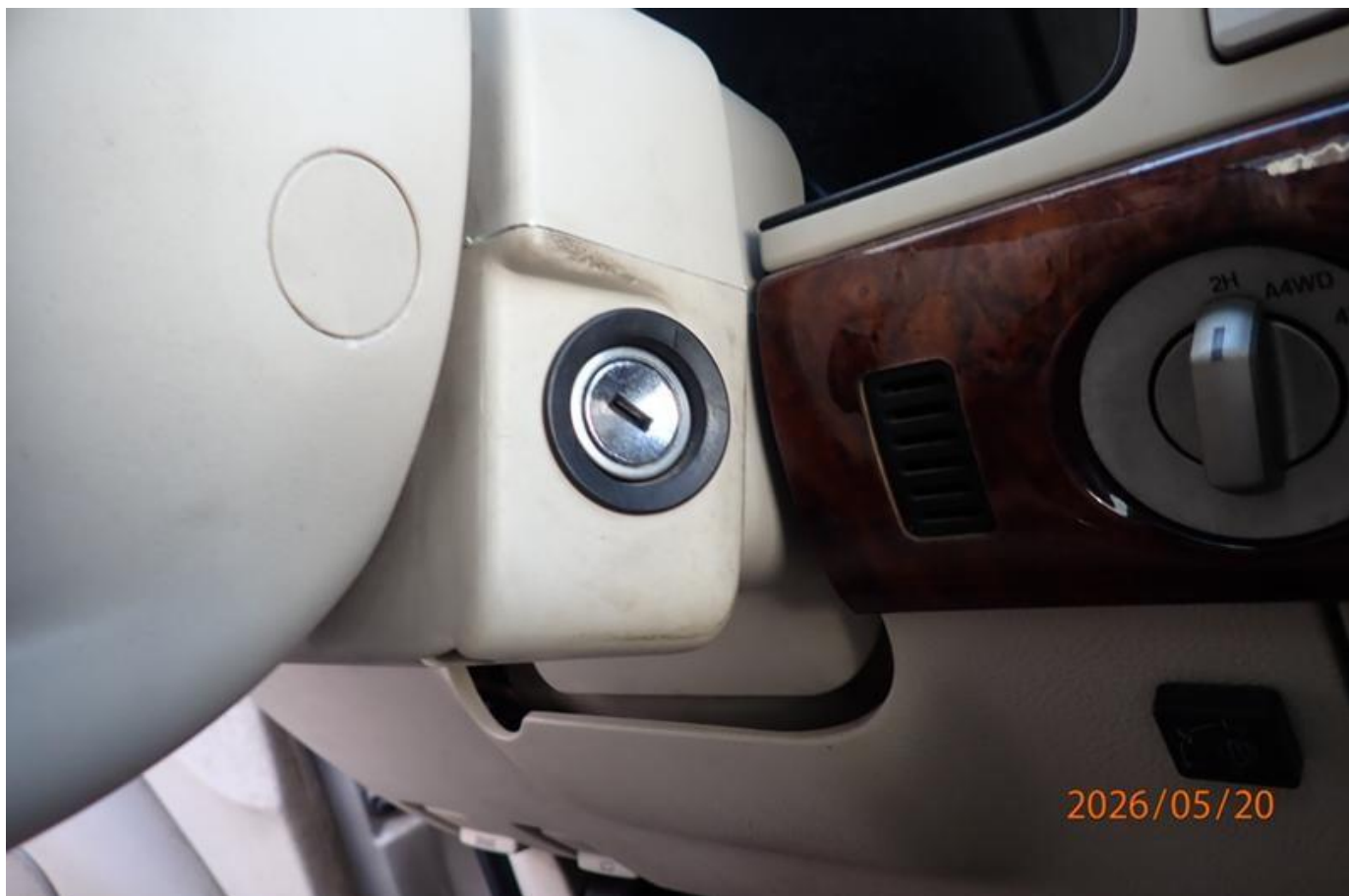
Fot. nr 176