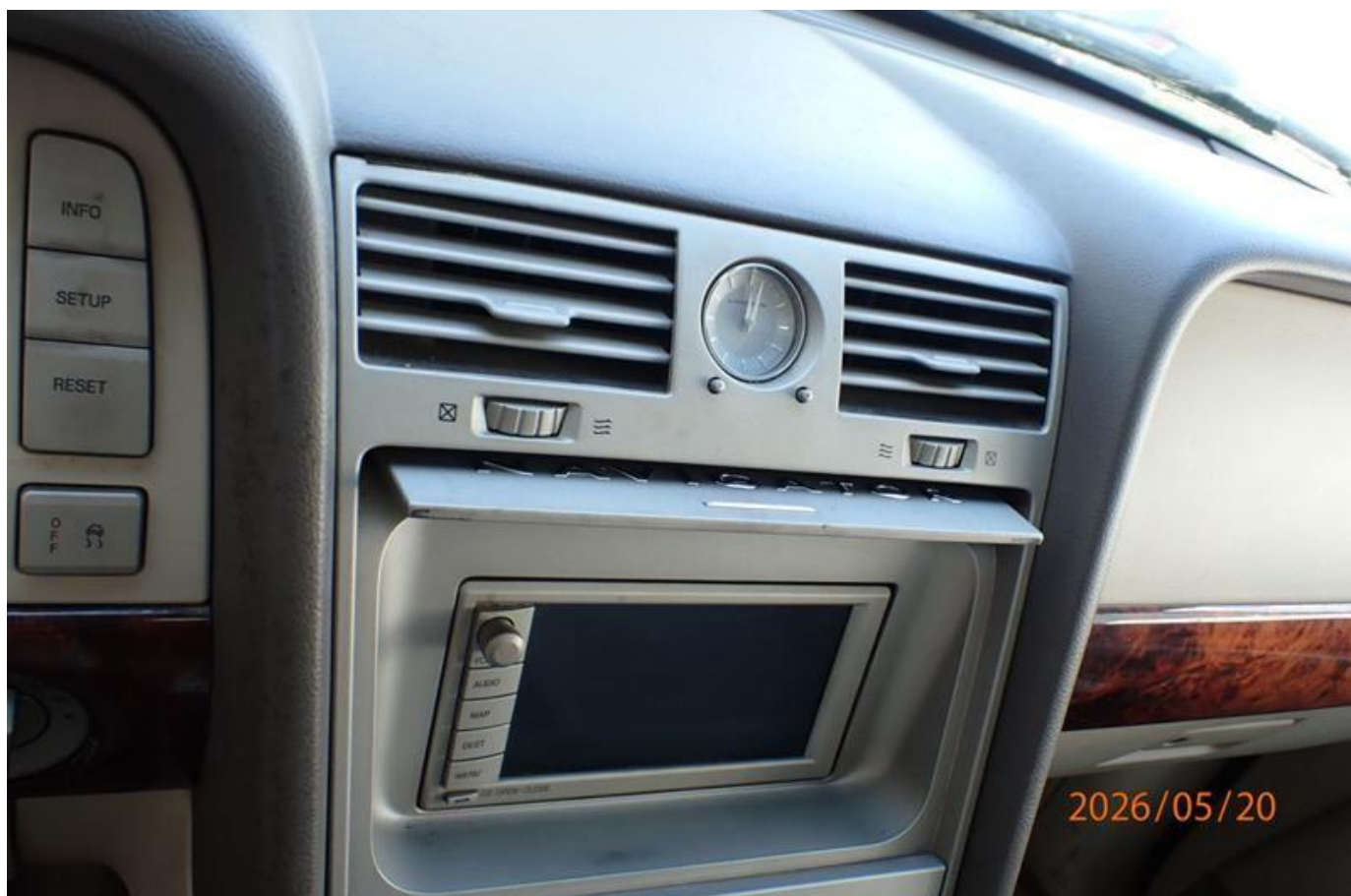
Fot. nr 198