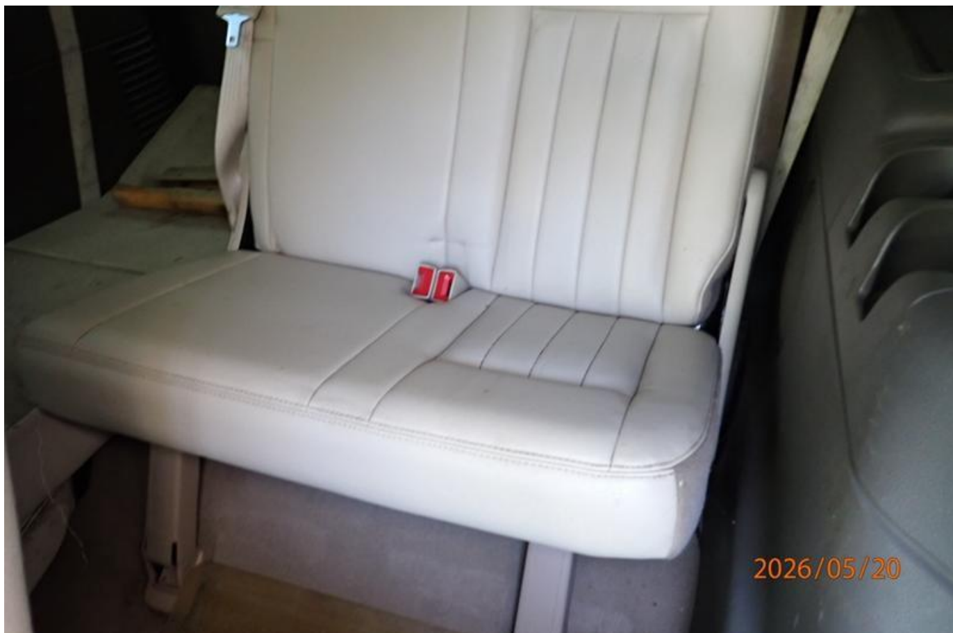
Fot. nr 160