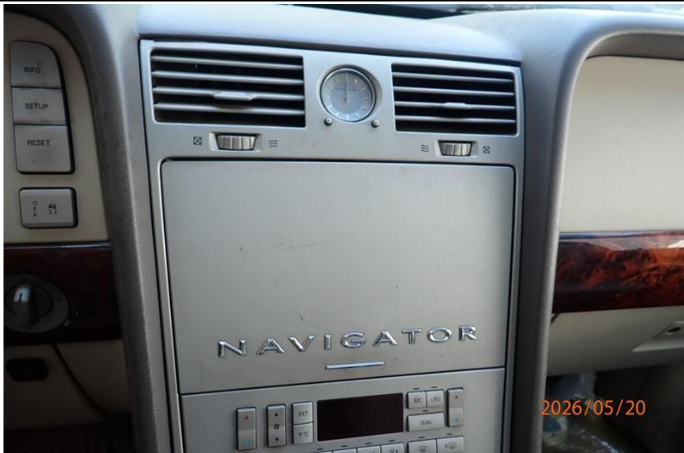
Fot. nr 177