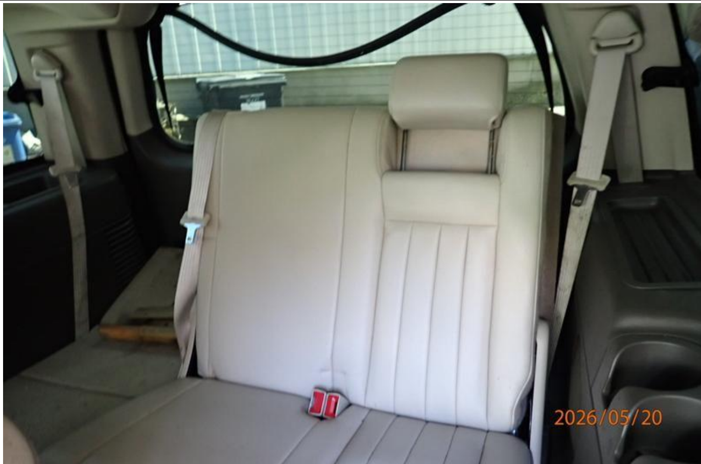
Fot. nr 159