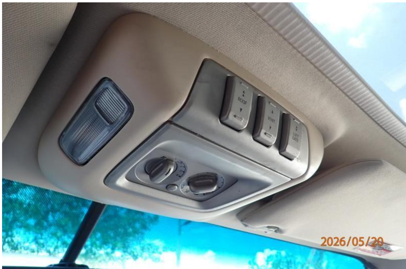
Fot. nr 184