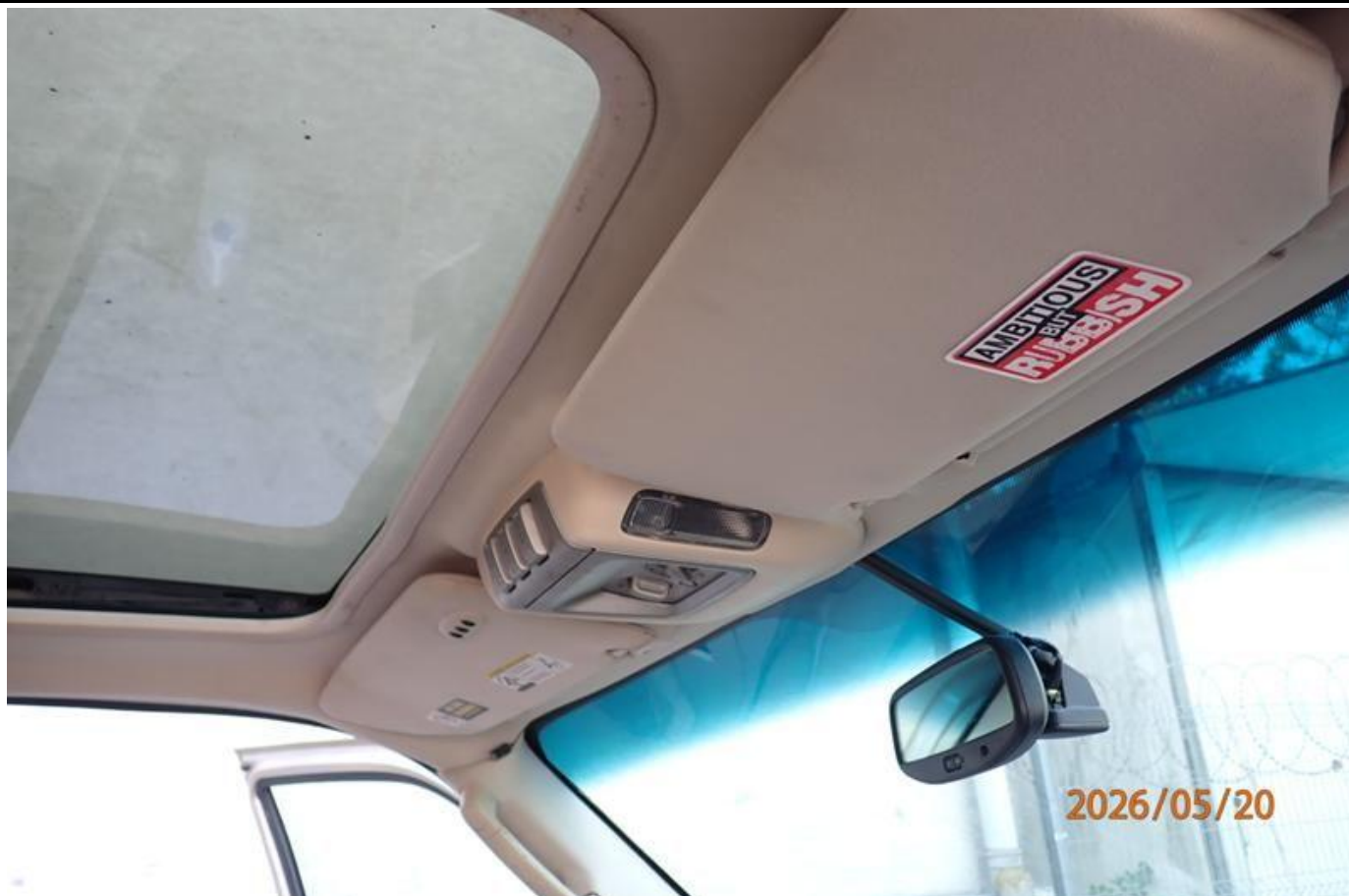
Fot. nr 105