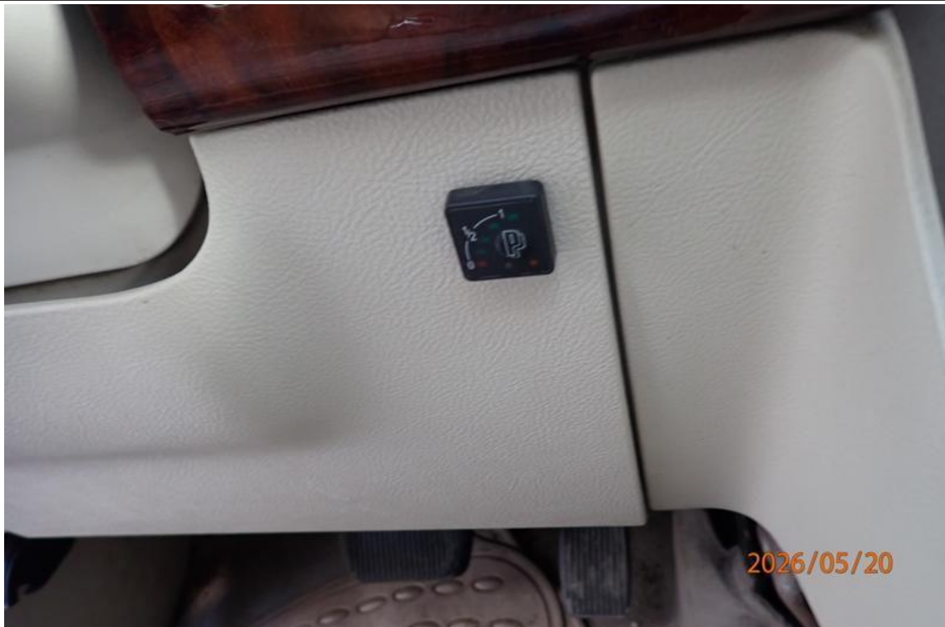
Fot. nr 175