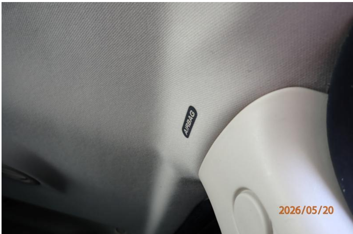
Fot. nr 186