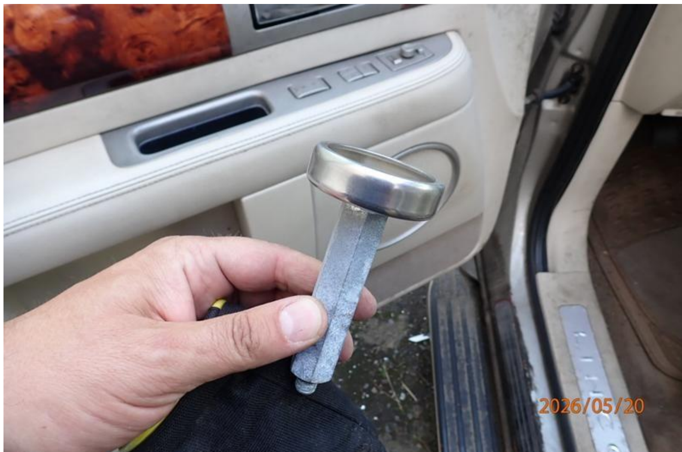
Fot. nr 164