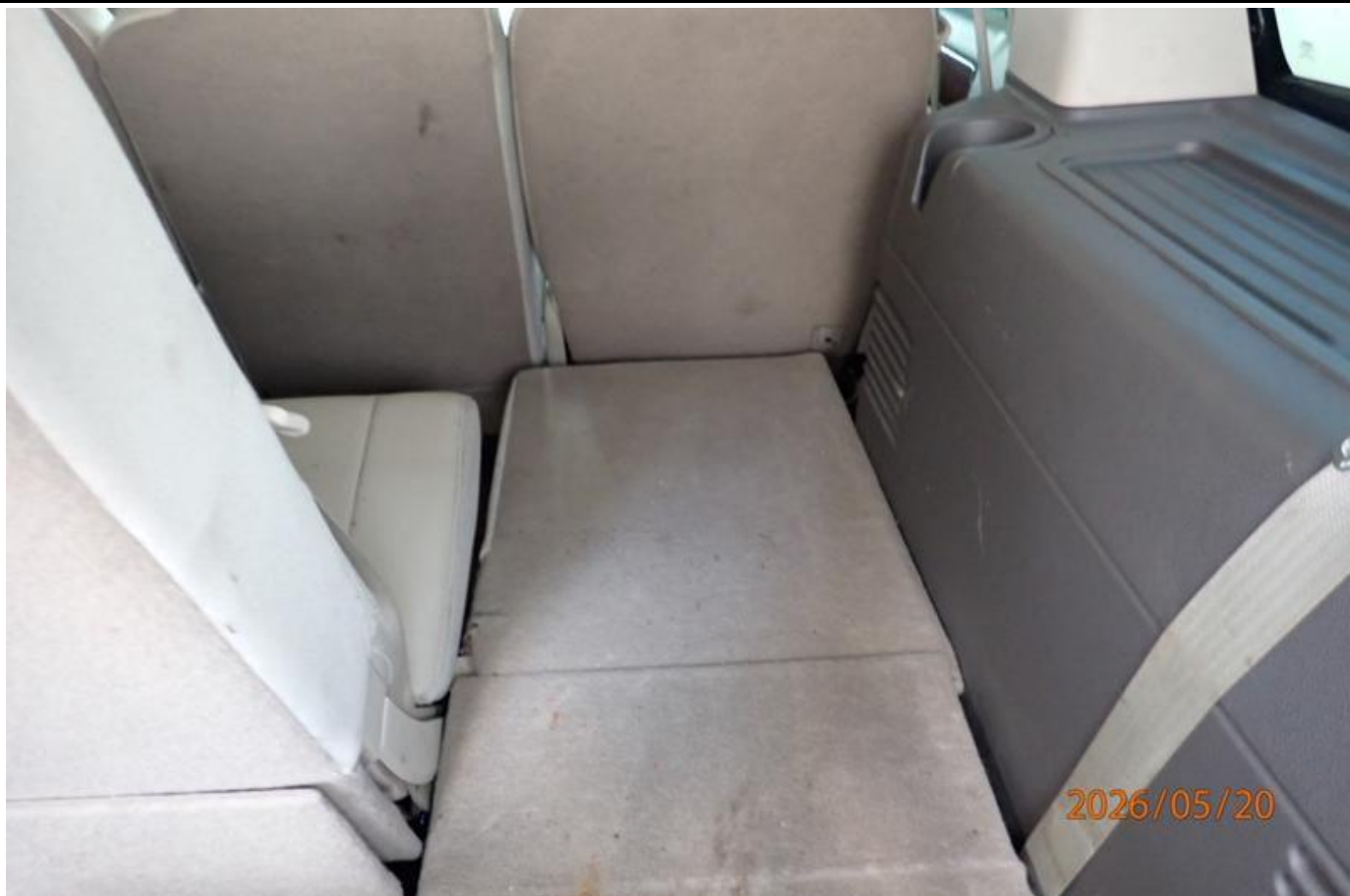
Fot. nr 141