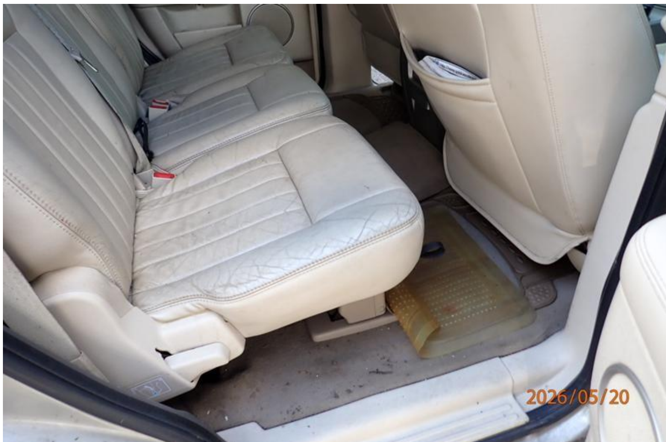
Fot. nr 120