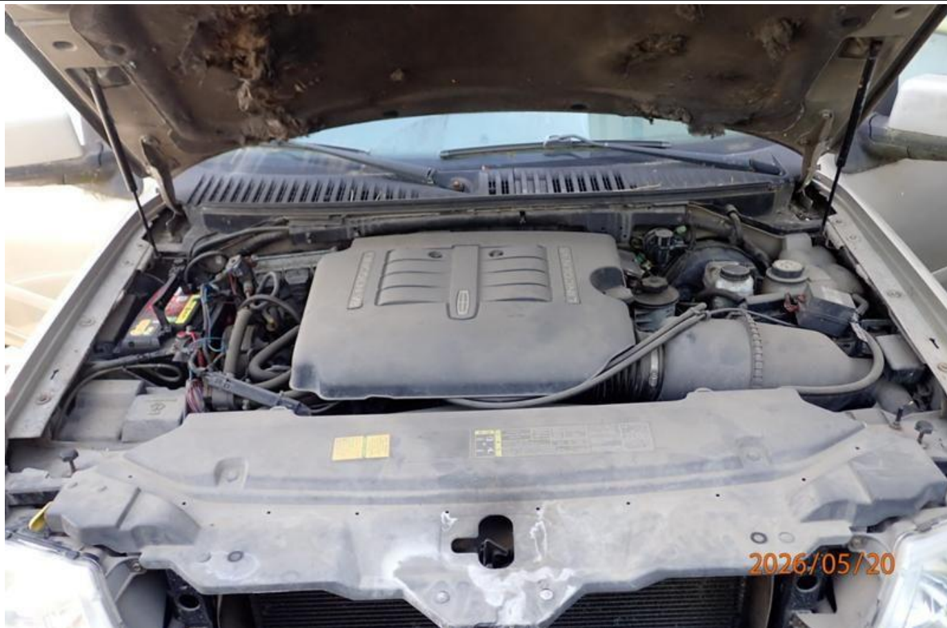
Fot. nr 93