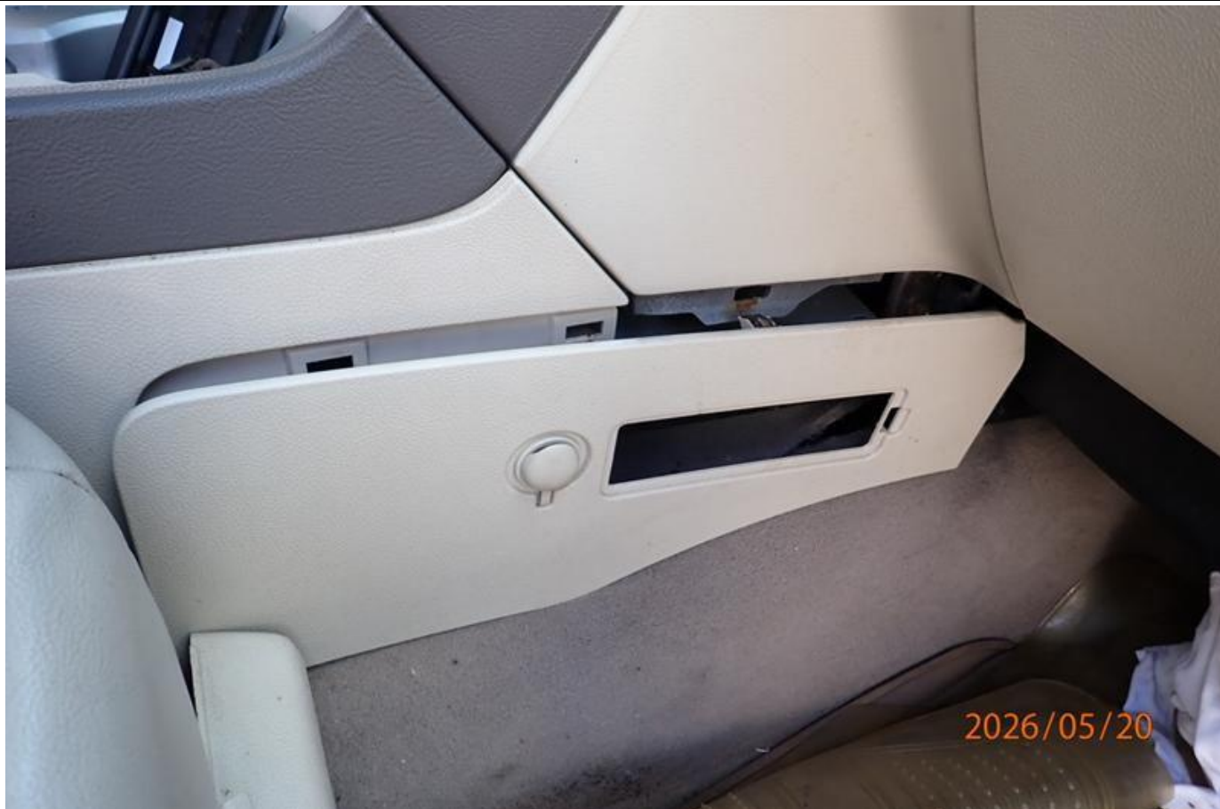
Fot. nr 111