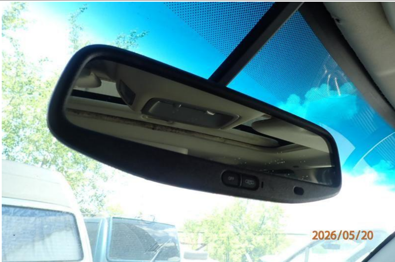
Fot. nr 185