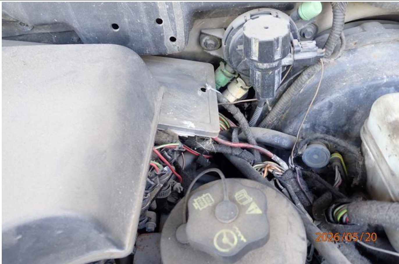
Fot. nr 95