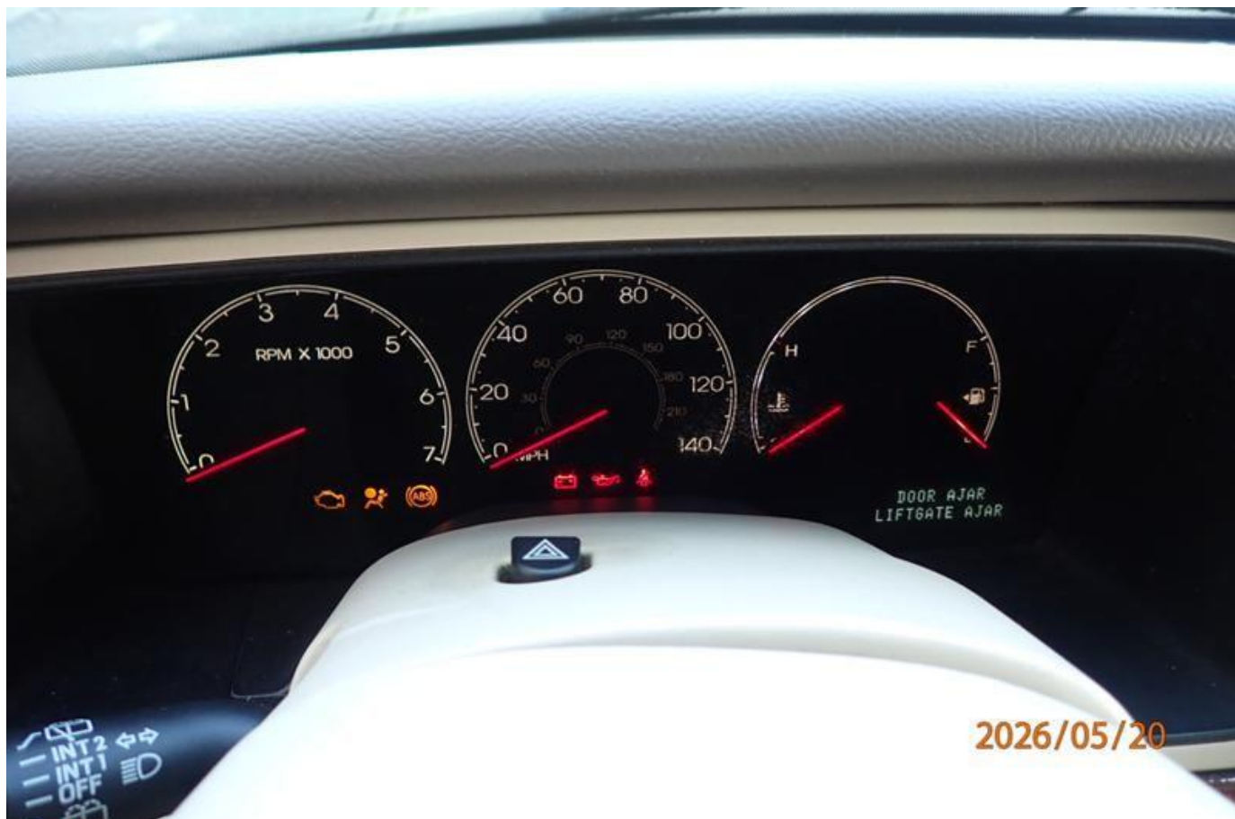
Fot. nr 188