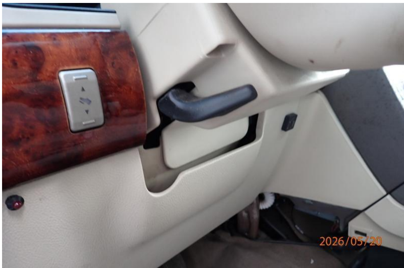
Fot. nr 172