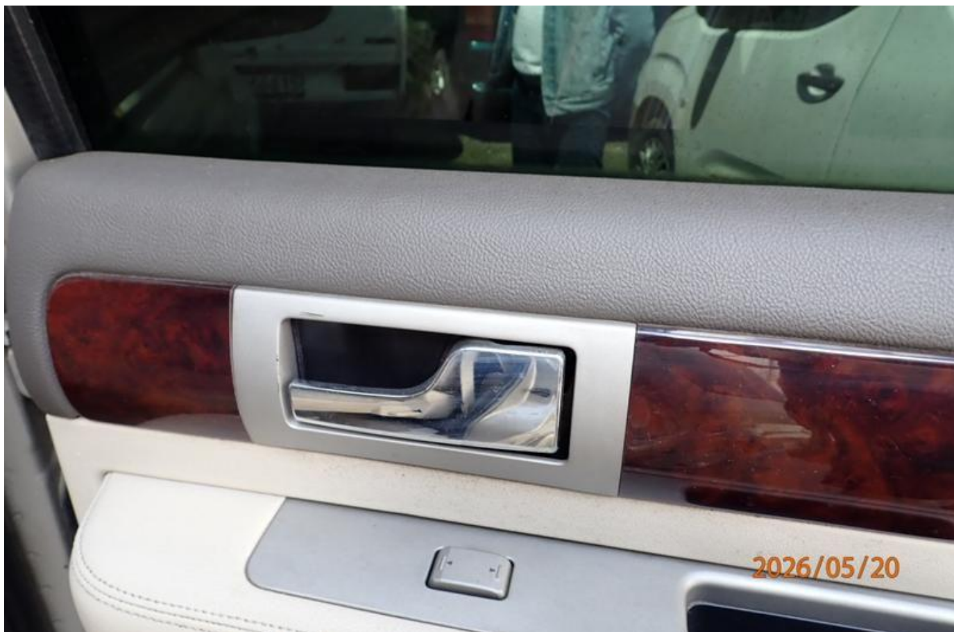
Fot. nr 118