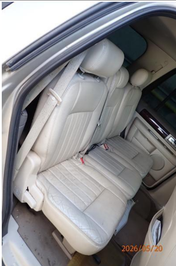
Fot. nr 121