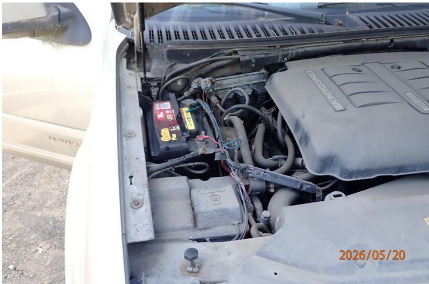
Fot. nr 96