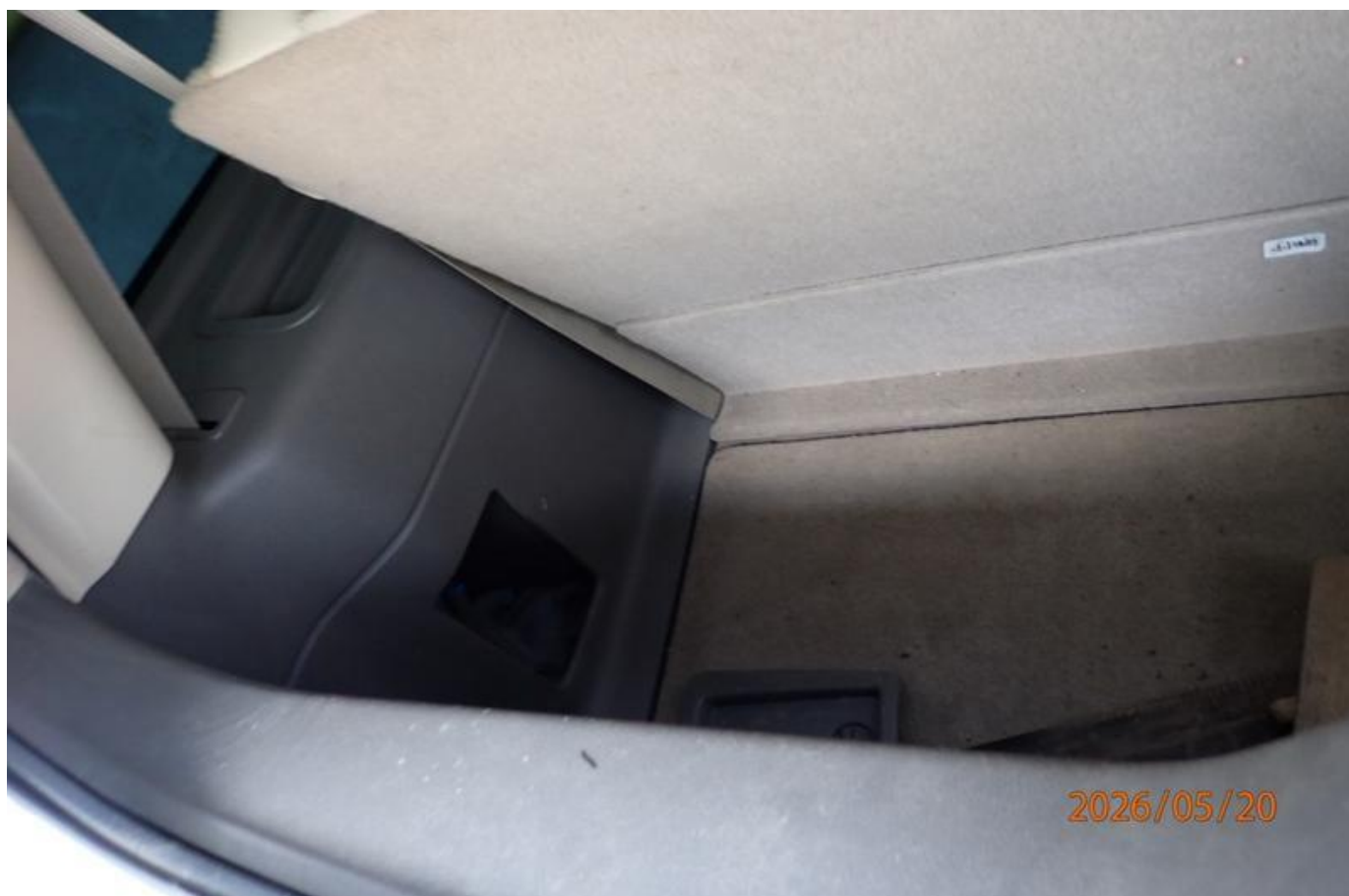
Fot. nr 138