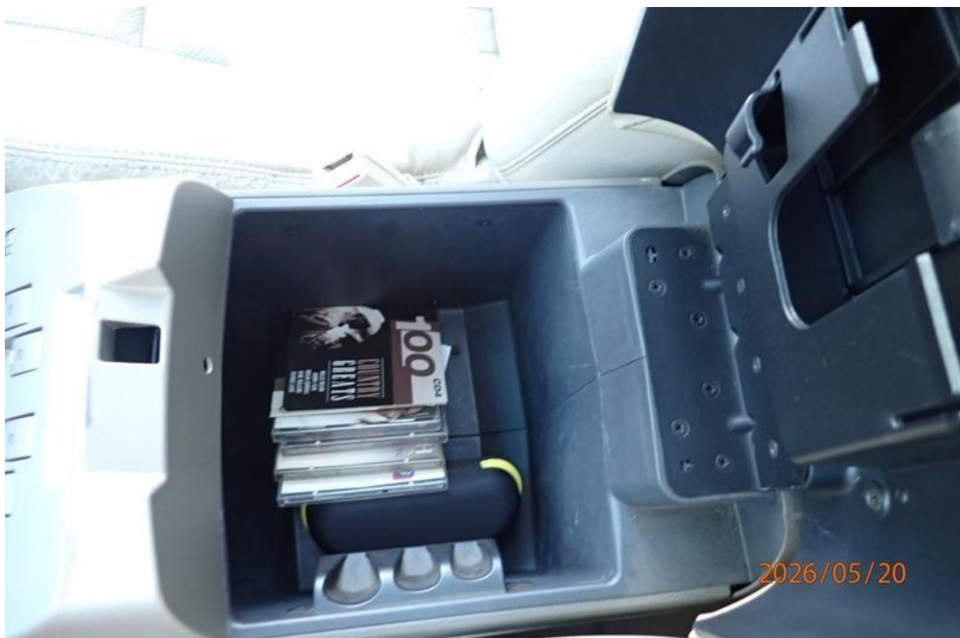
Fot. nr 182