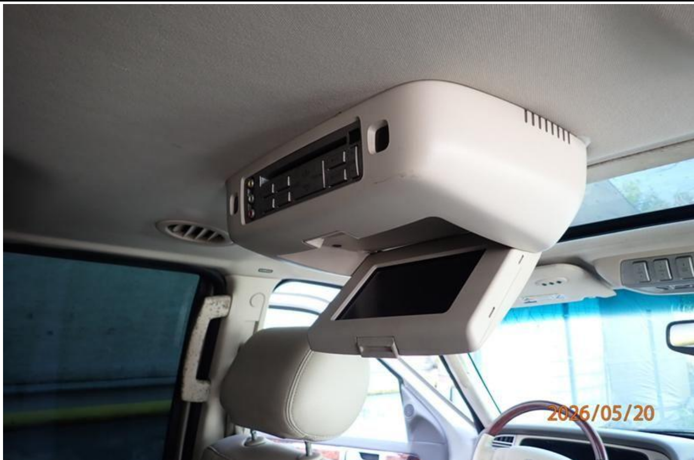
Fot. nr 129