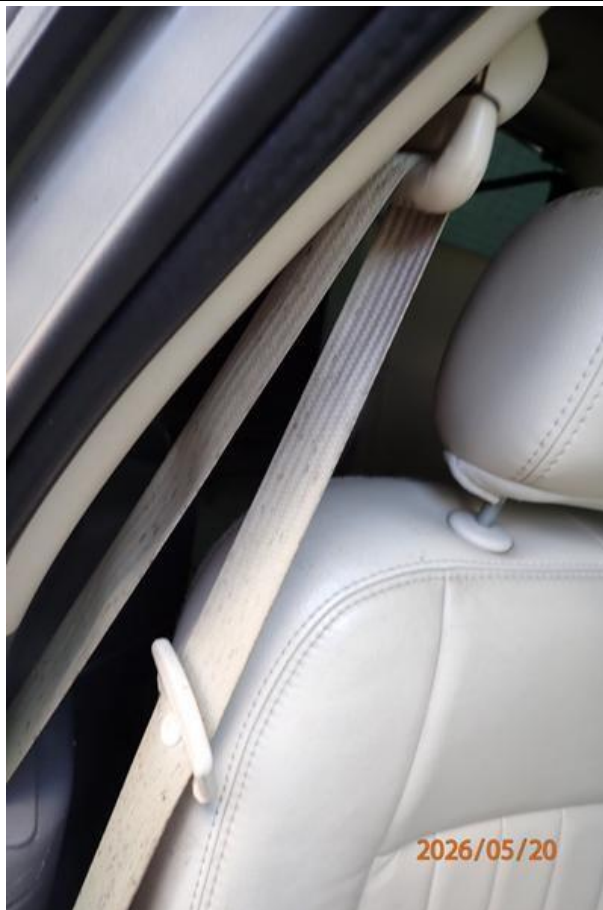
Fot. nr 123