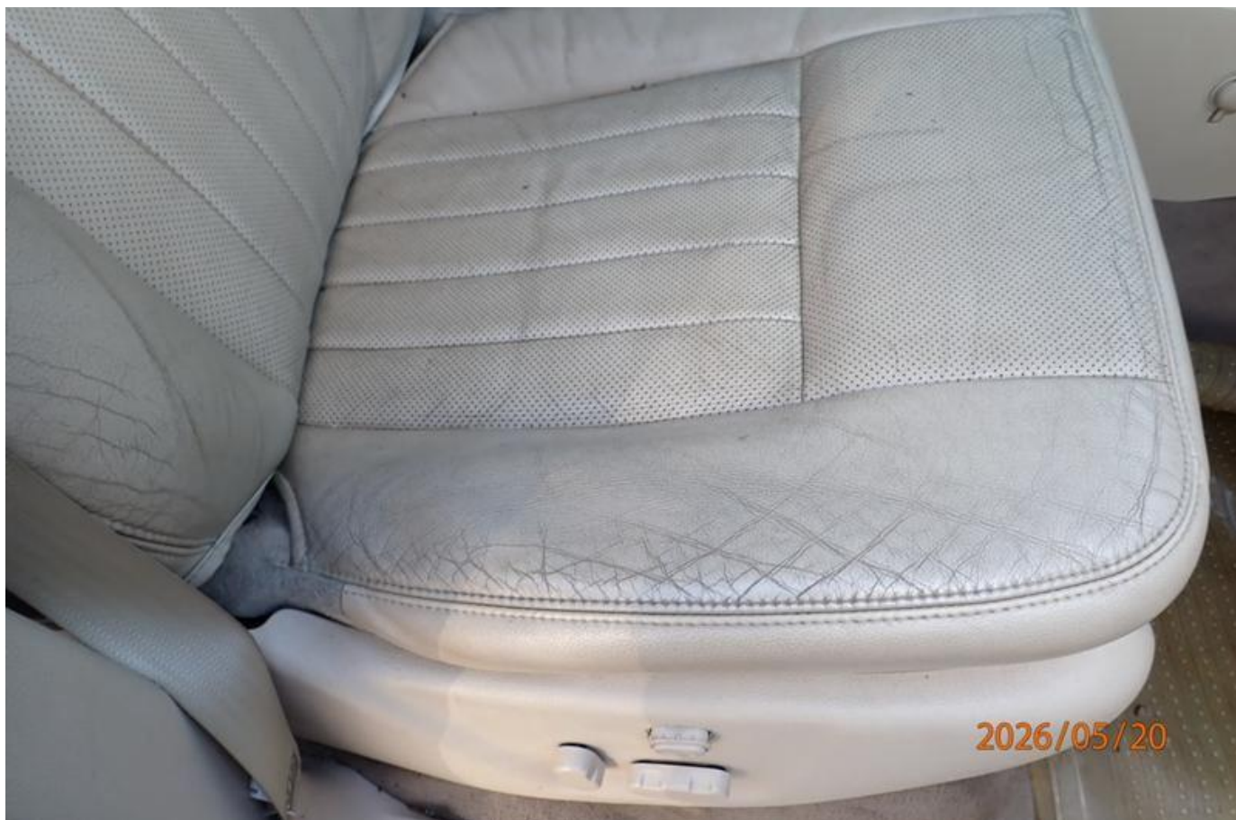
Fot. nr 108