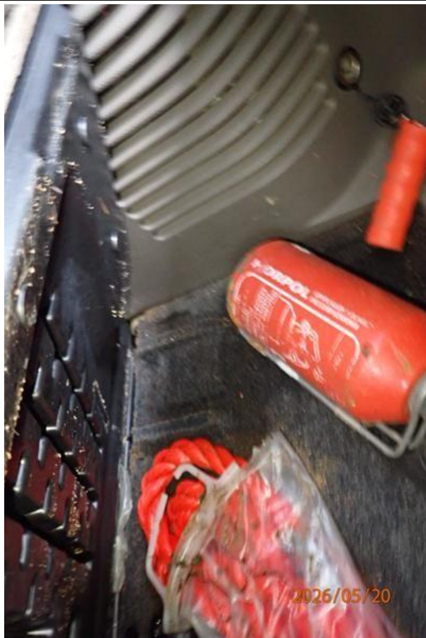
Fot. nr 147