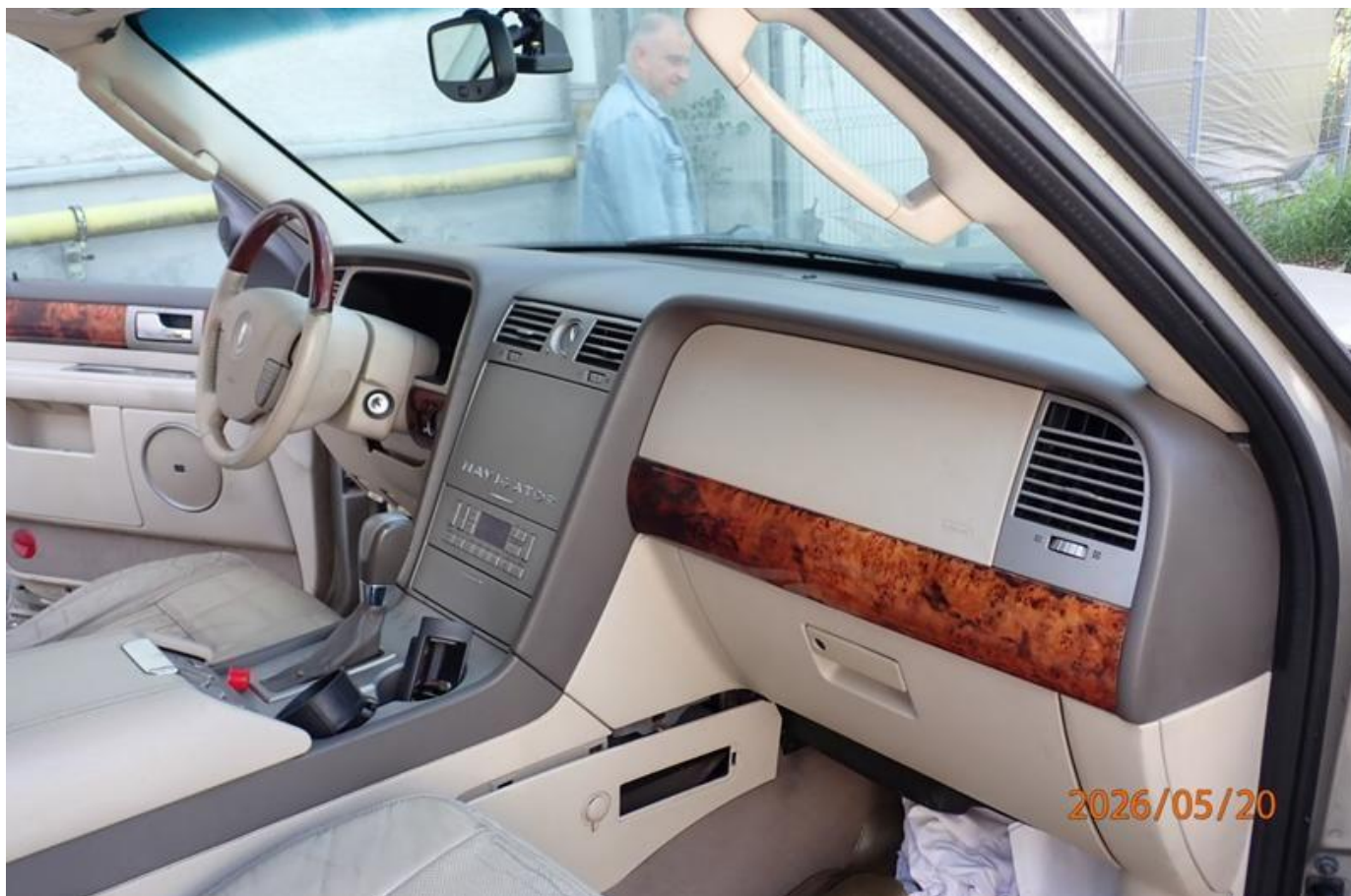
Fot. nr 104