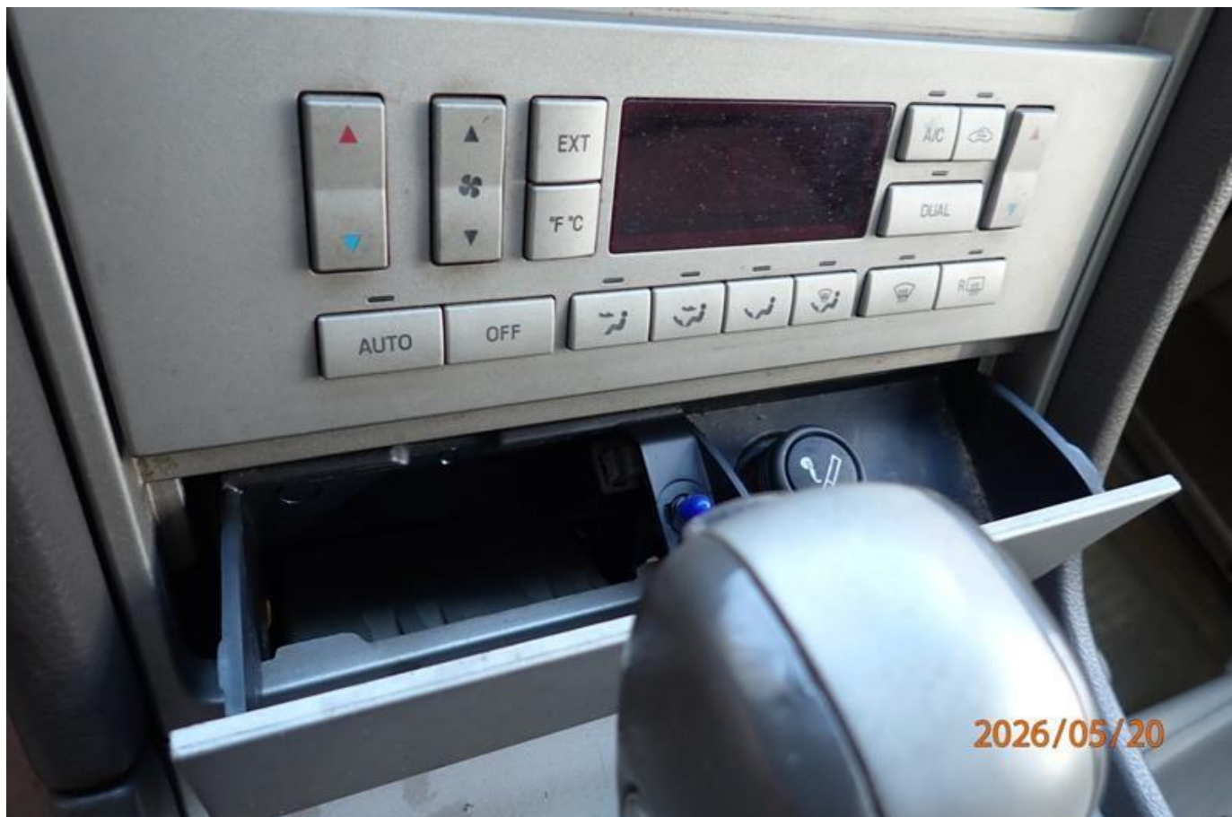
Fot. nr 180