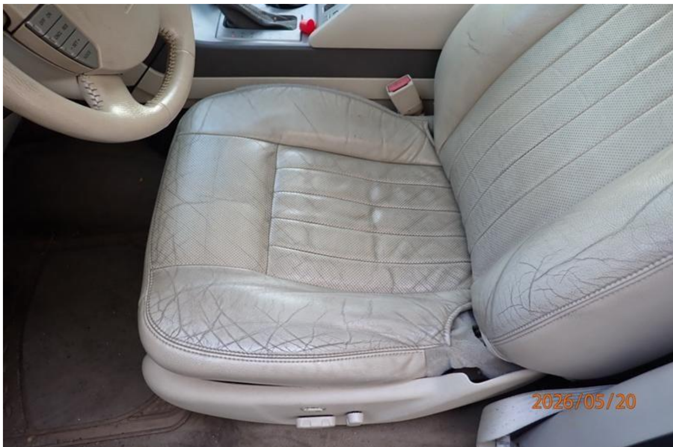
Fot. nr 168