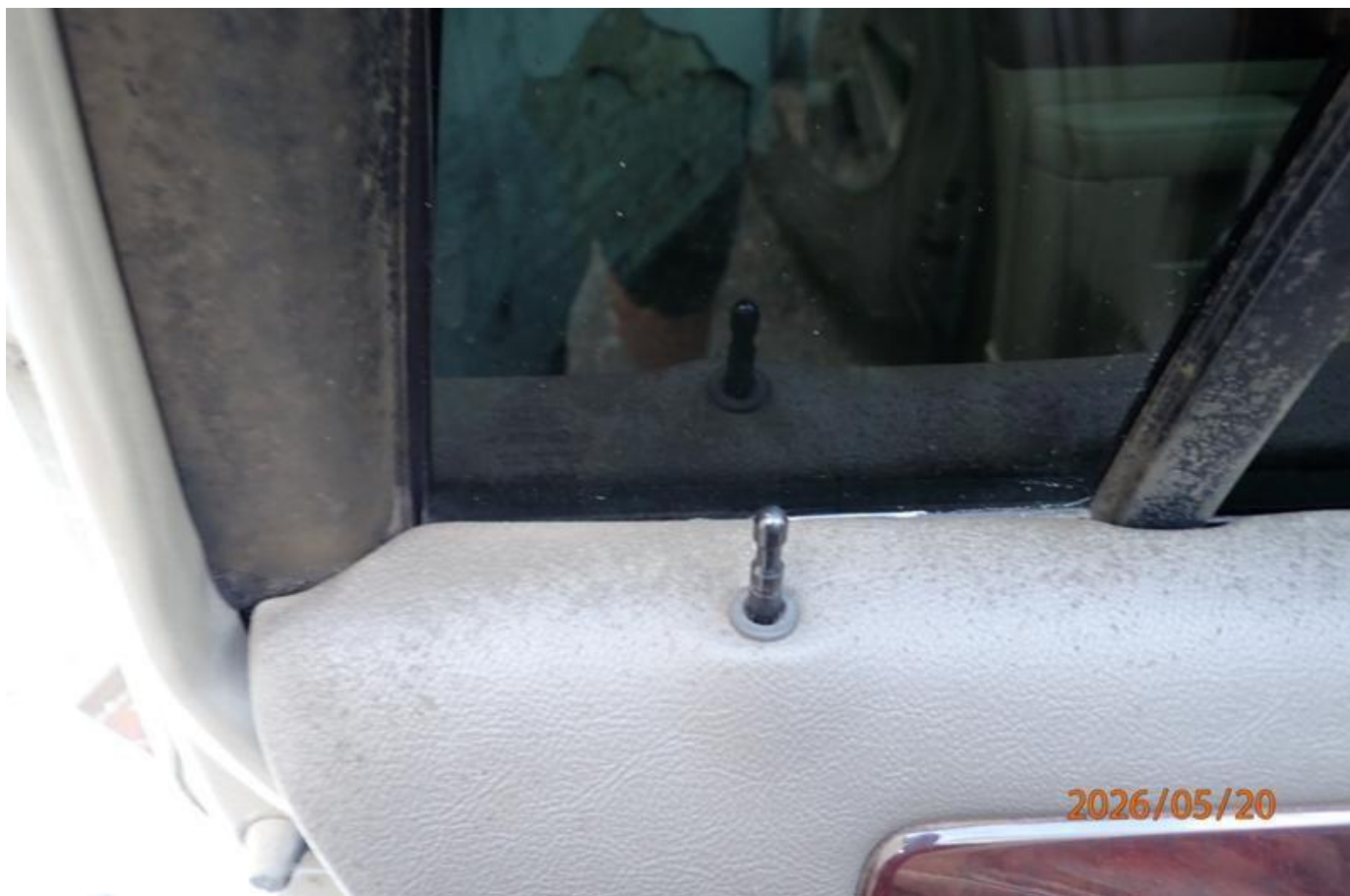
Fot. nr 152