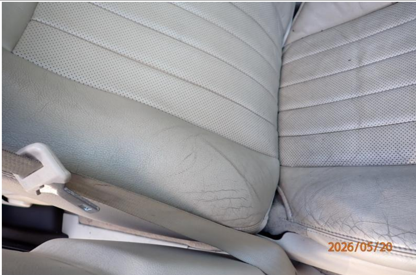
Fot. nr 109