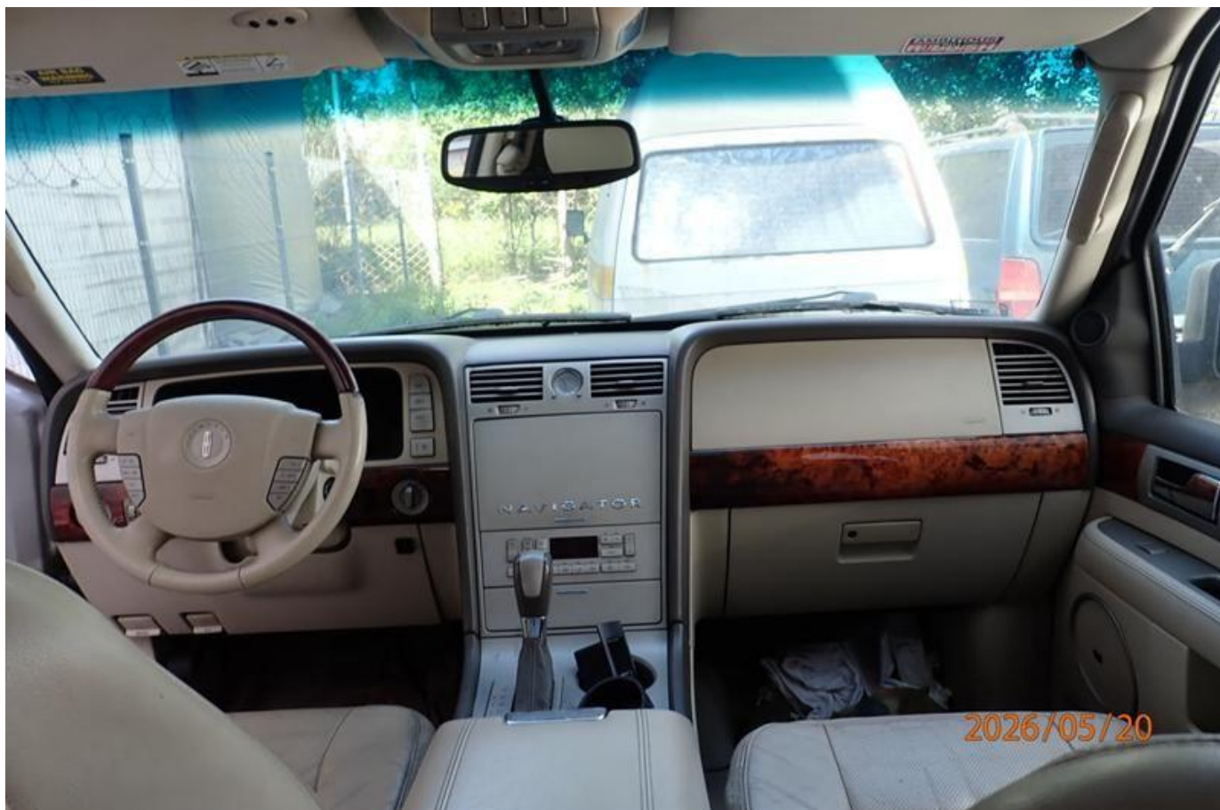
Fot. nr 136