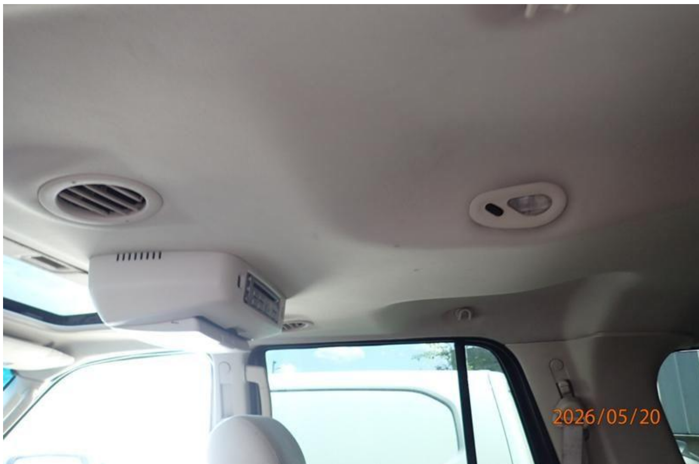
Fot. nr 158