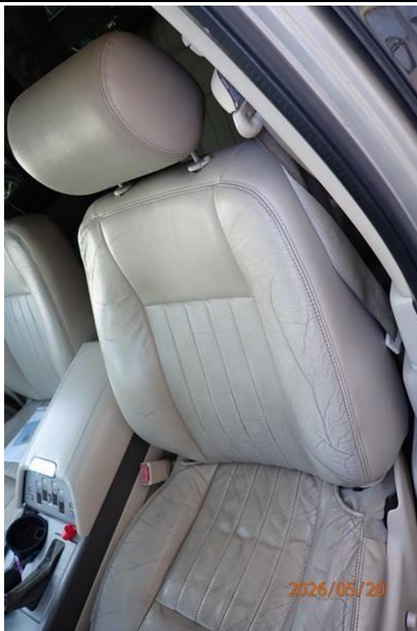
Fot. nr 169