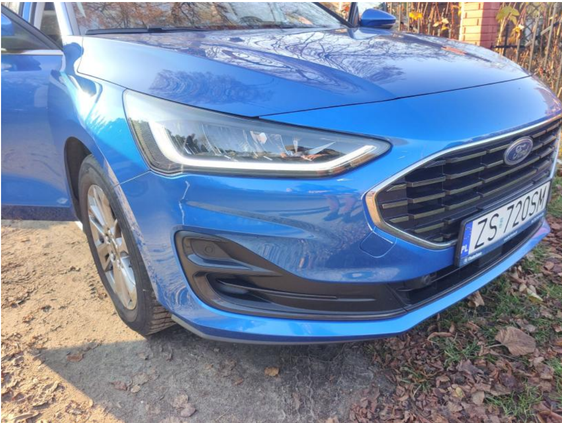
Fot. 37 Zderzak przedni cz P - zdjęcie poglądowe 1