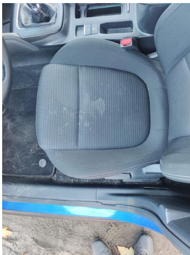
Fot. 46 Fotel prz. lew. - Inne 1