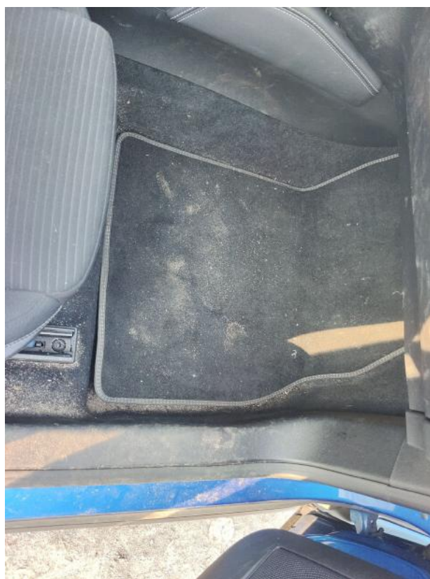
Fot. 52 Dywanik prze P - Inne 1