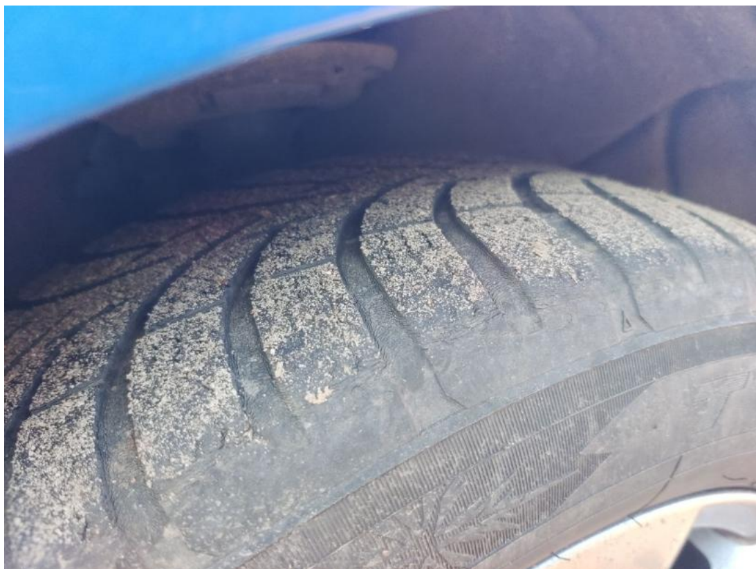
Fot. 43 Opona przednia P - Inne 1