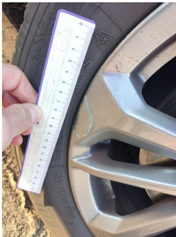
Fot. 42 Felga aluminiowa przednia P - Rysa/odprysk 1