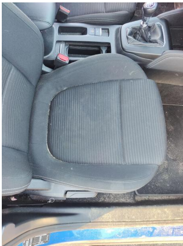
Fot. 47 Fotel prz. praw. - Inne 1