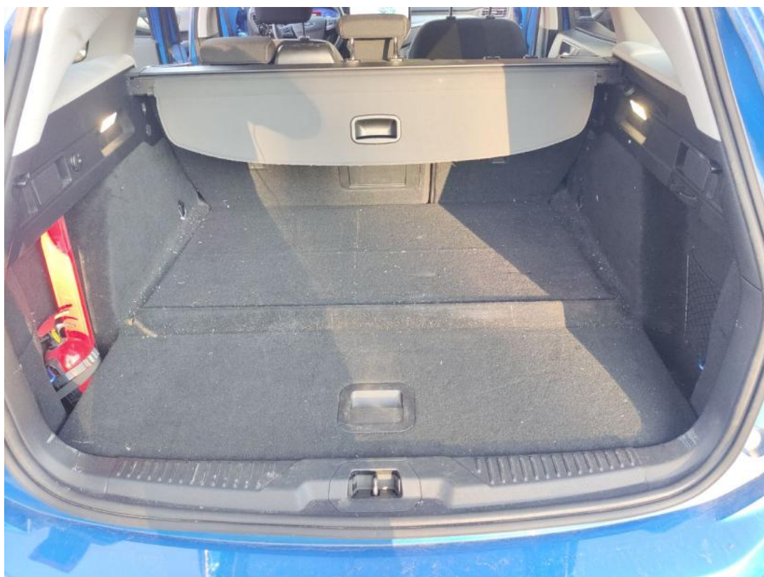
Fot. 53 Podłoga - Inne 1