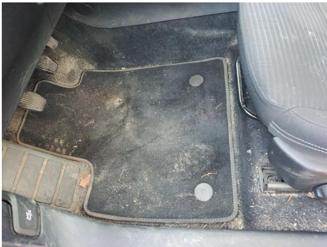
Fot. 51 Dywanik prze L - Inne 1