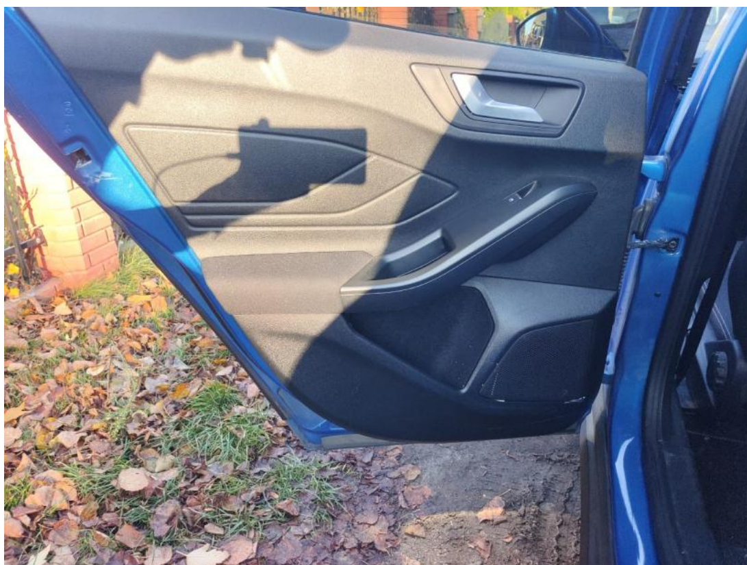
Fot. 49 Tapicerka drzwi tylnych L - zdjęcie poglądowe 1