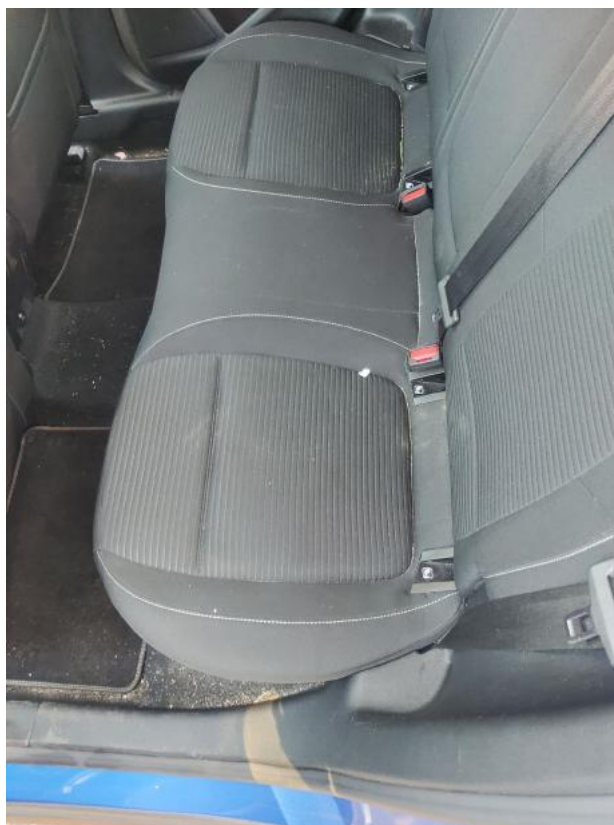
Fot. 48 Kanapa tyl. - Inne 1