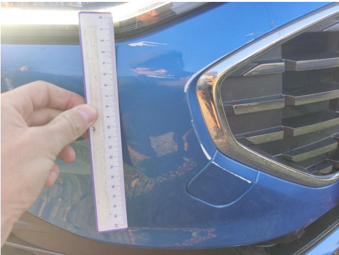
Fot. 38 Zderzak przedni cz P - zdjęcie poglądowe 2