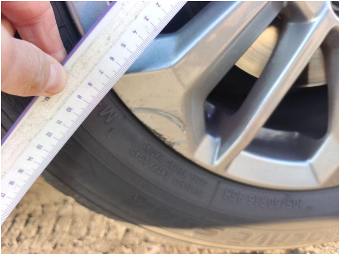
Fot. 41 Felga aluminiowa przednia P - zdjęcie poglądowe 2