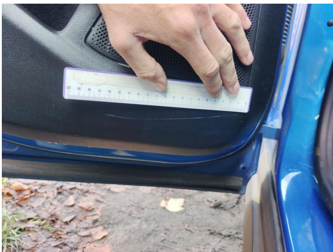
Fot. 50 Tapicerka drzwi tylnych L - Rysa/odprysk 1