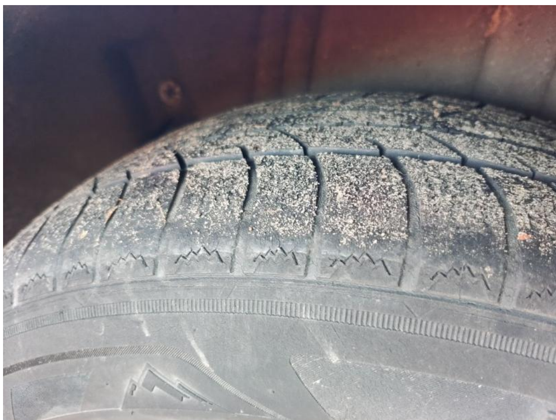
Fot. 44 Opona tylna L - Inne 1