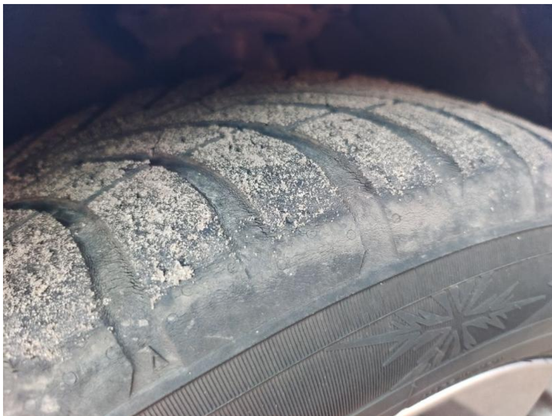
Fot. 45 Opona przednia L - Inne 1