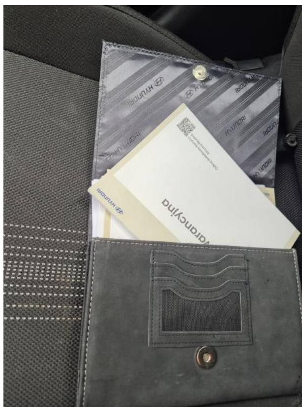
Fot. 34 Instrukcje