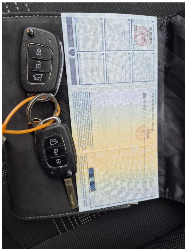
Fot. 31 Dow. Rej. Str.2 i klucze