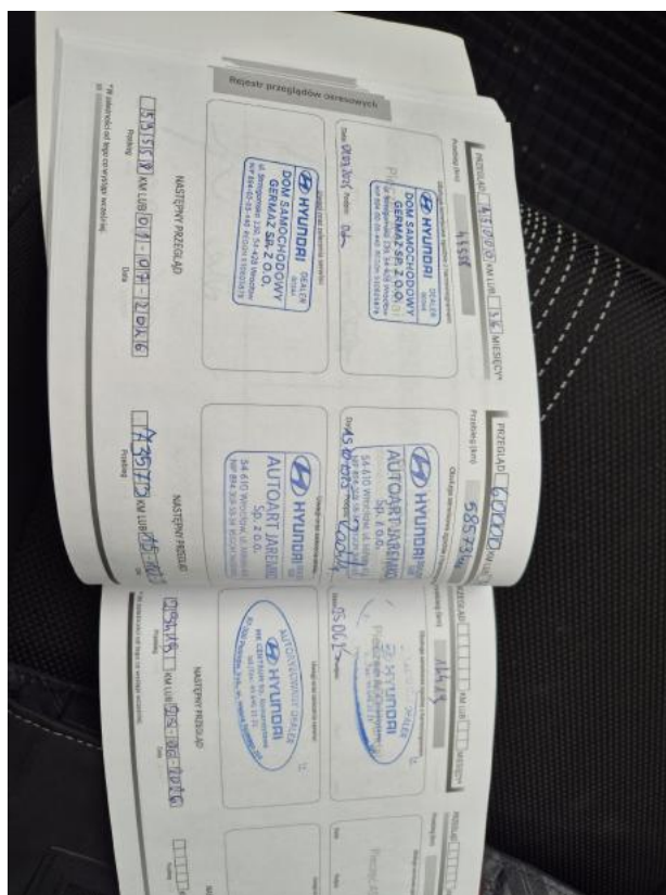
Fot. 33 Książka serwisowa – ostatni przegląd