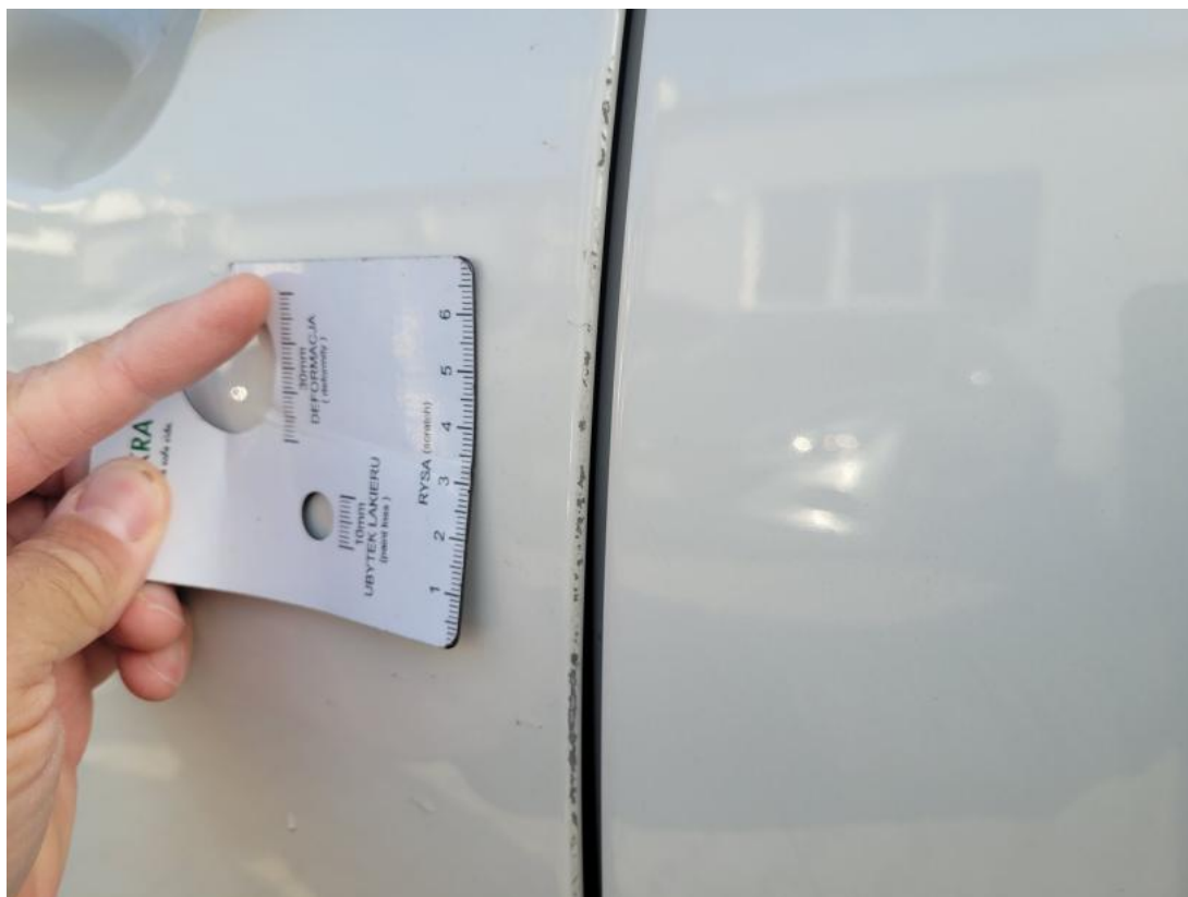
Fot. 41 Drzwi przed L - Rysa/odprysk 1