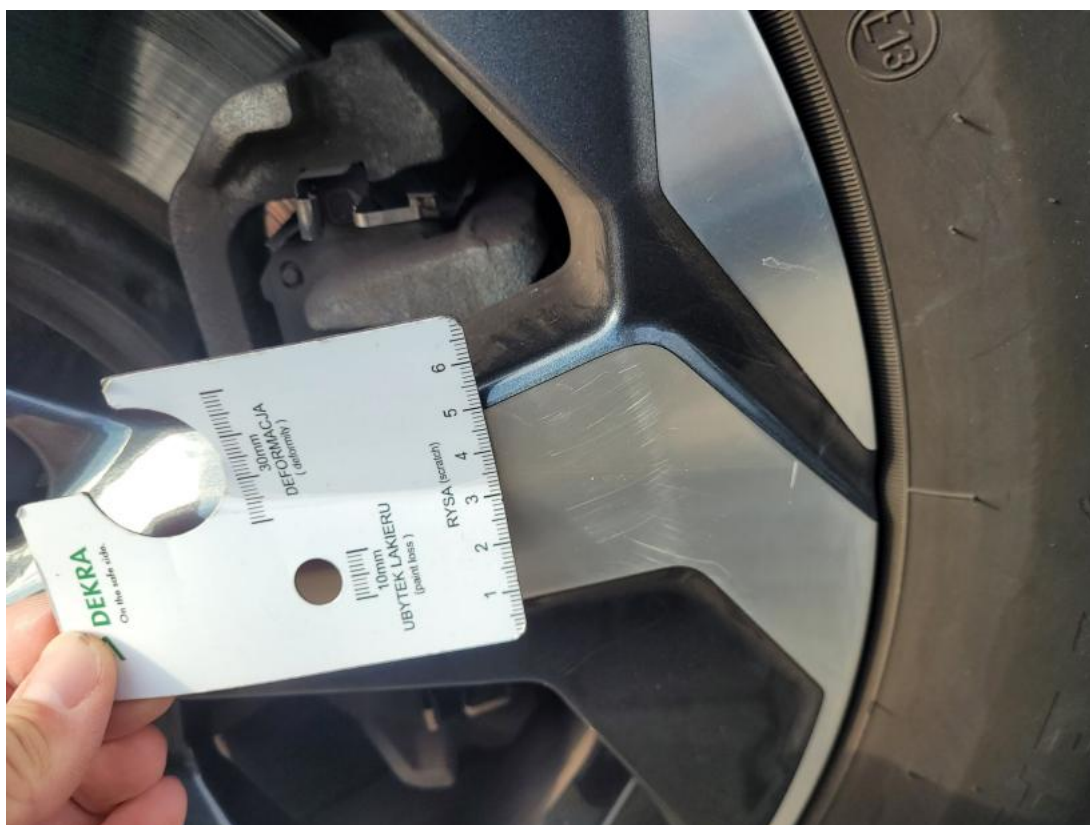
Fot. 37 Felga aluminiowa przednia P - zdjęcie poglądowe 2