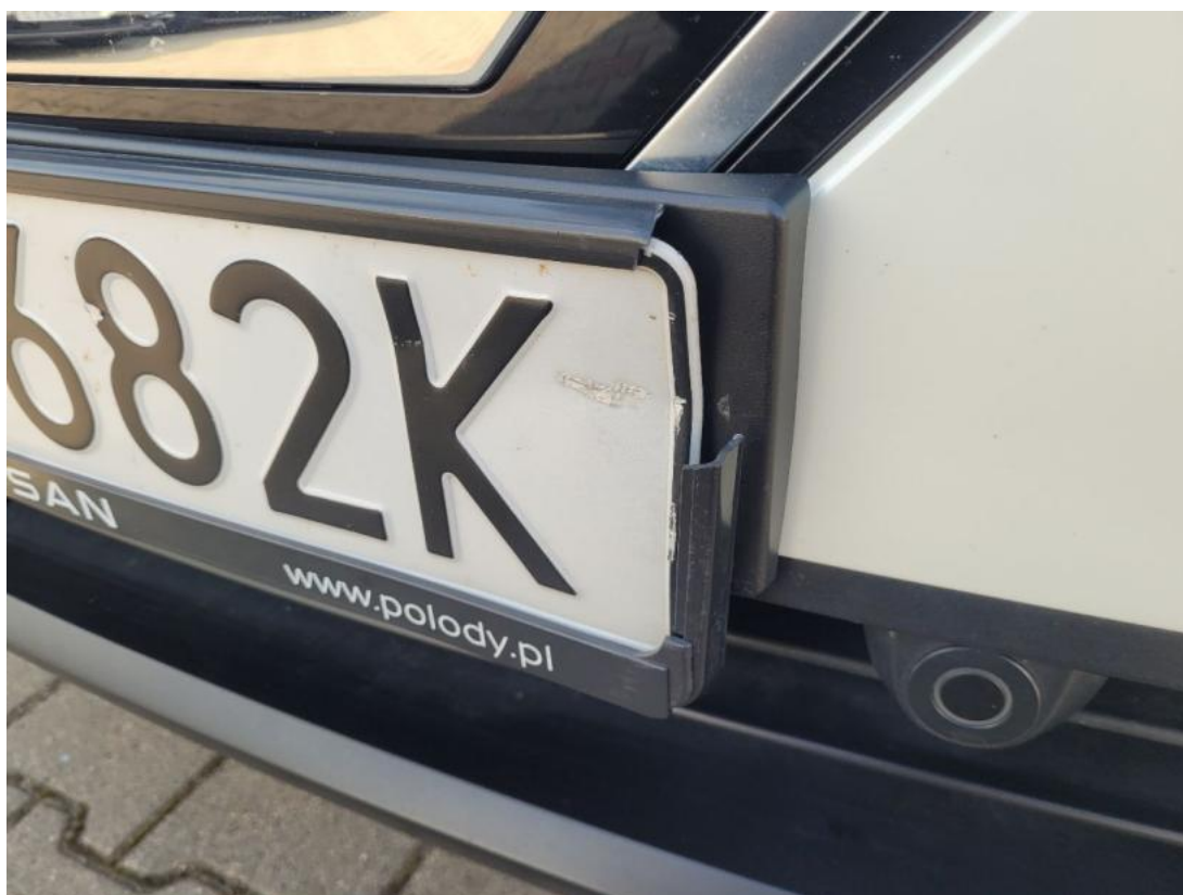
Fot. 36 Zderzak - Inne 1