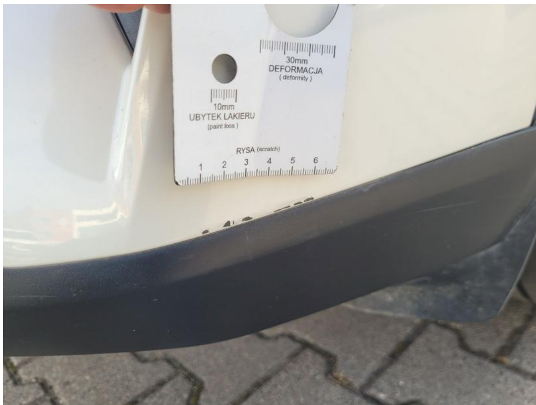
Fot. 35 Zderzak - Rysa/odprysk 1