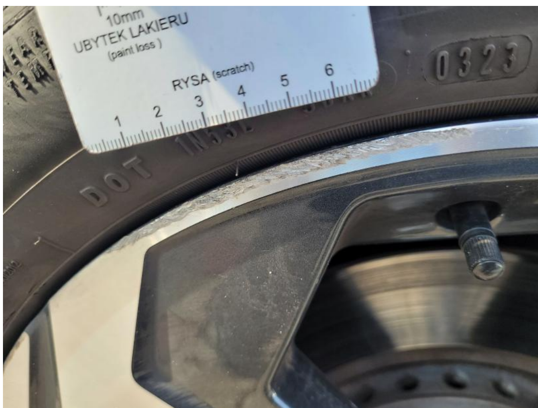
Fot. 38 Felga aluminiowa przednia P - Rysa/odprysk 1