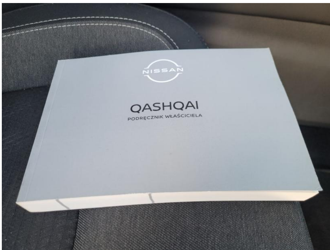
Fot. 32 Instrukcje