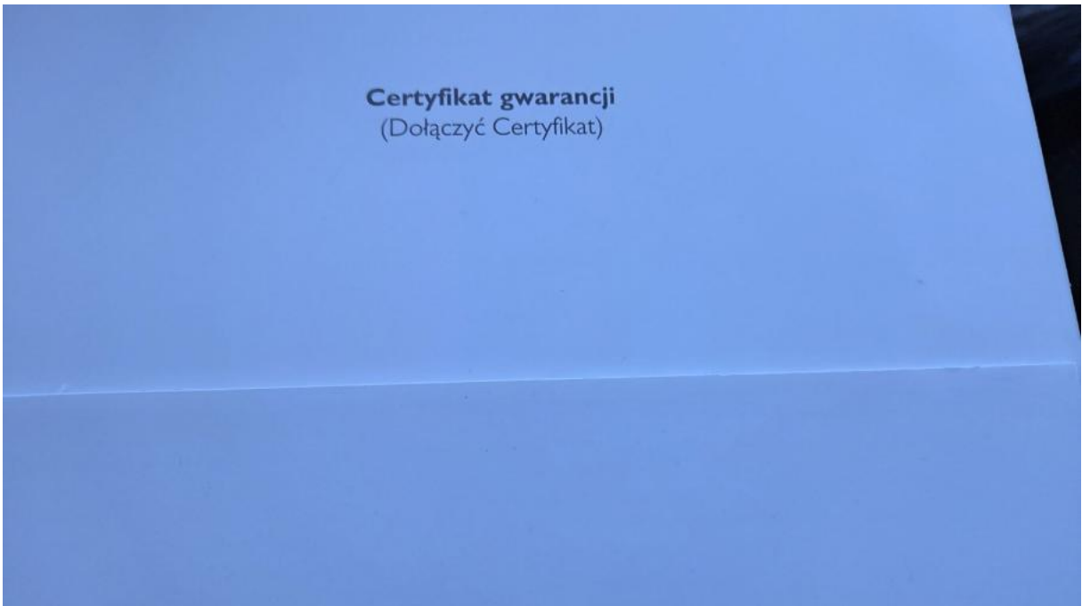
Fot. 30 Książka serwisowa – dane