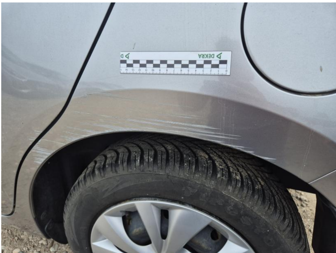
Fot. 40 Błotnik tylny L / Ściana boczna L - Rysa/odprysk 1