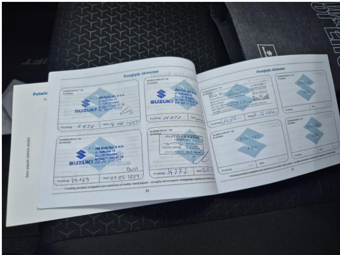
Fot. 35 Książka serwisowa – ostatni przegląd