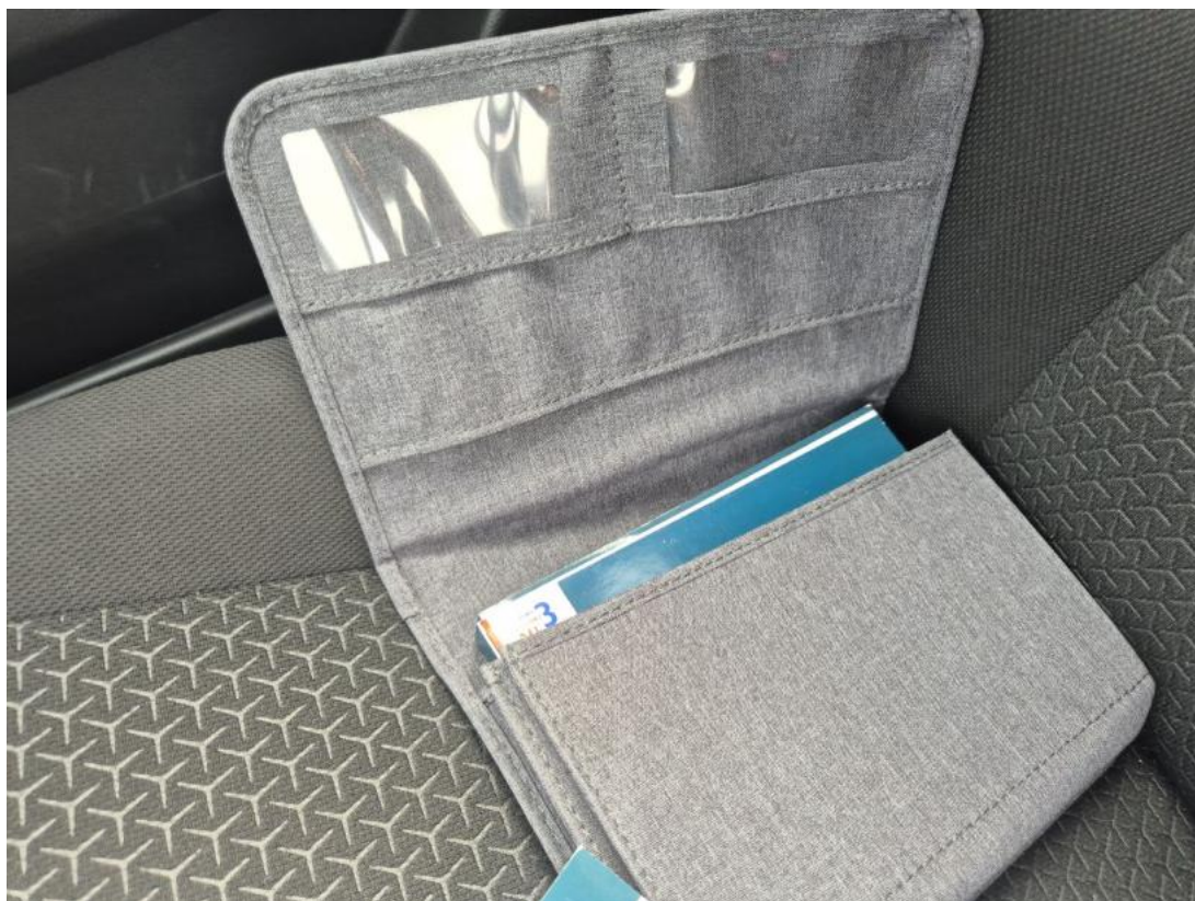
Fot. 37 Instrukcje