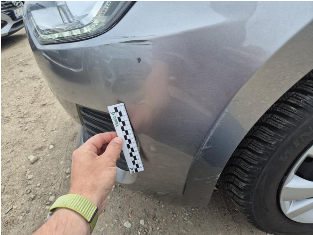
Fot. 39 Zderzak - Rysa/odprysk 1