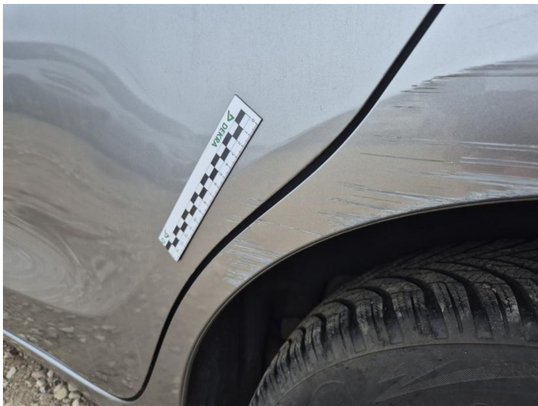
Fot. 41 Drzwi tylne L - Rysa/odprysk 1