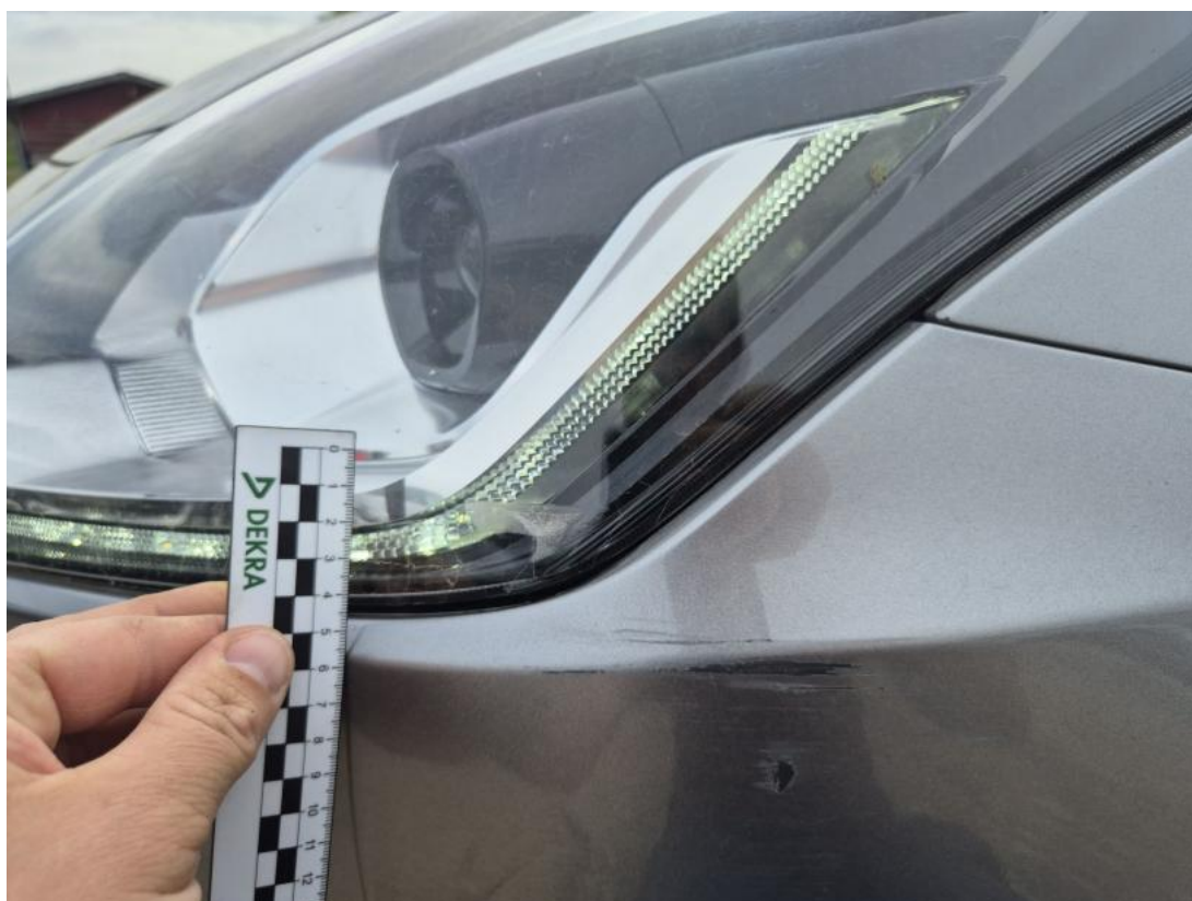
Fot. 42 Reflektor L - Rysa/odprysk 1