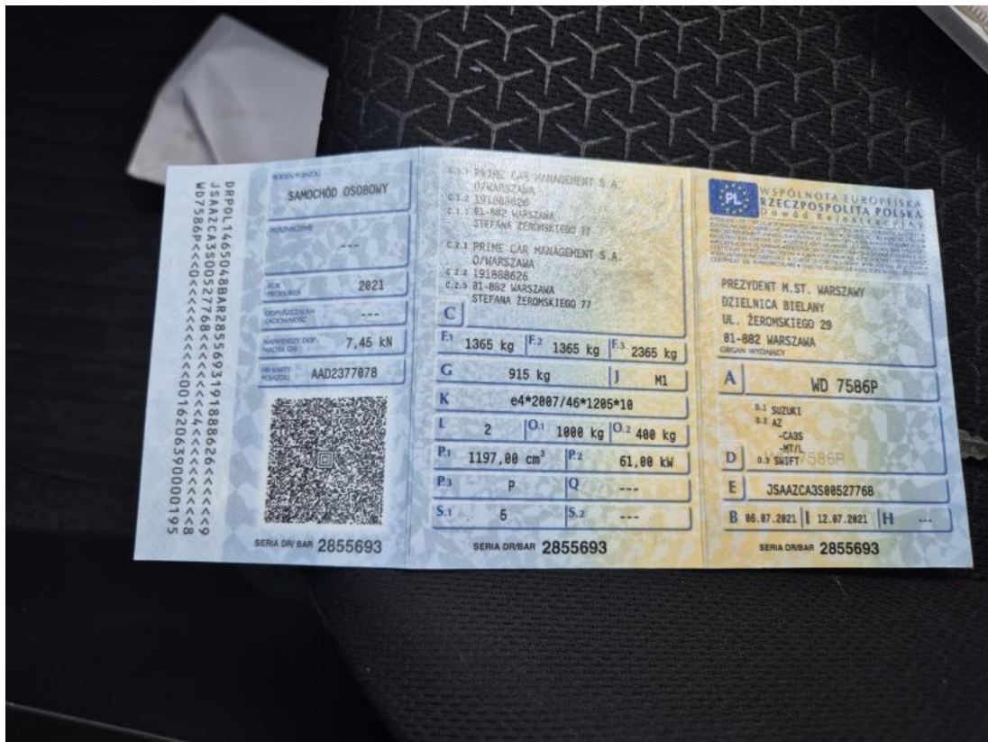
Fot. 33 Dowód rej. Str. 1