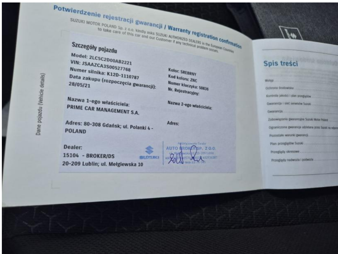
Fot. 34 Książka serwisowa – dane