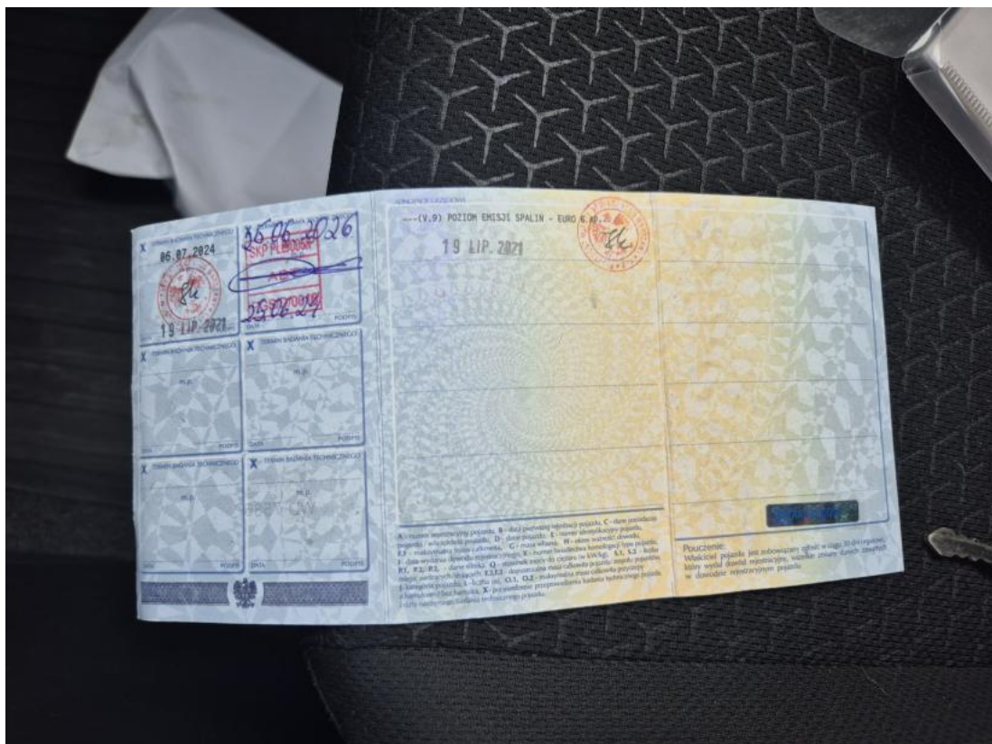
Fot. 36 Dowód rej. str. 2