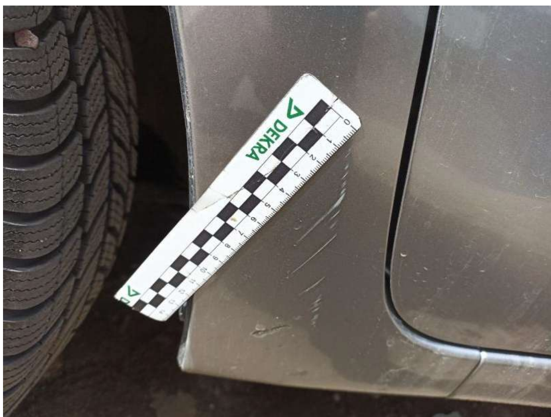
Fot. 56 Błotnik przedni L - Rysa/odprysk 1