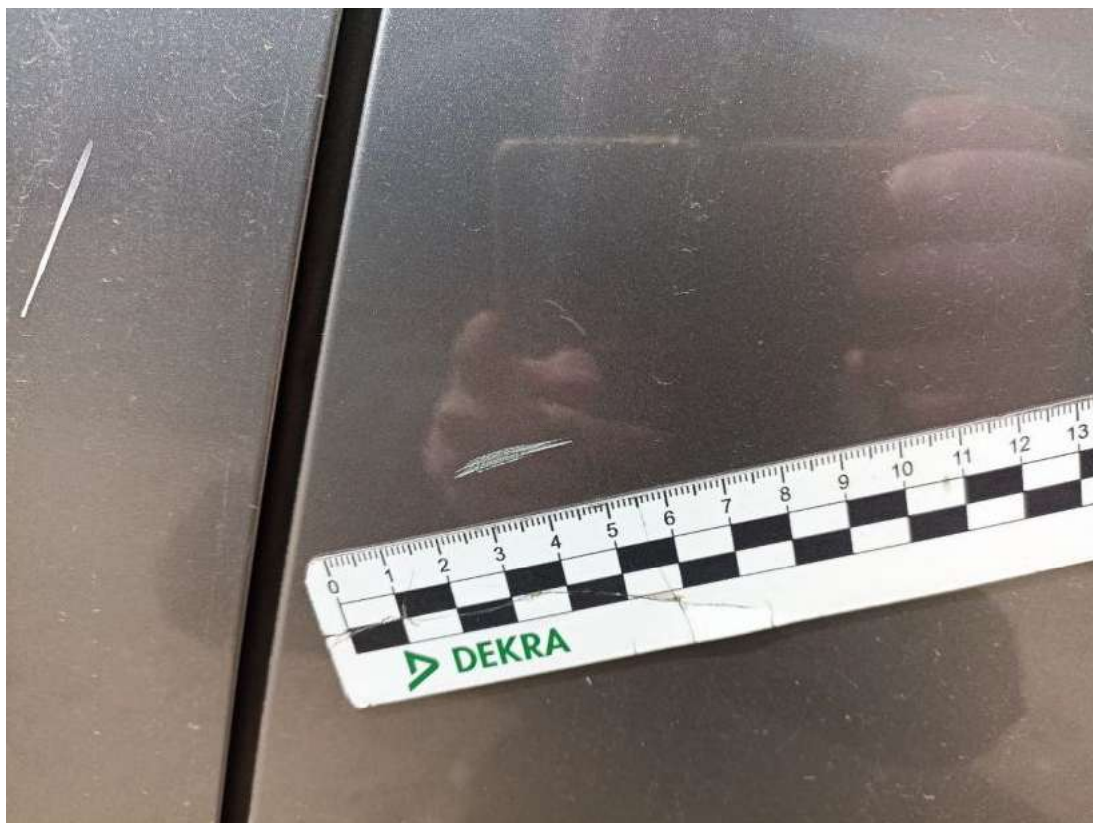
Fot. 55 Drzwi tylne L - Rysa/odprysk 1