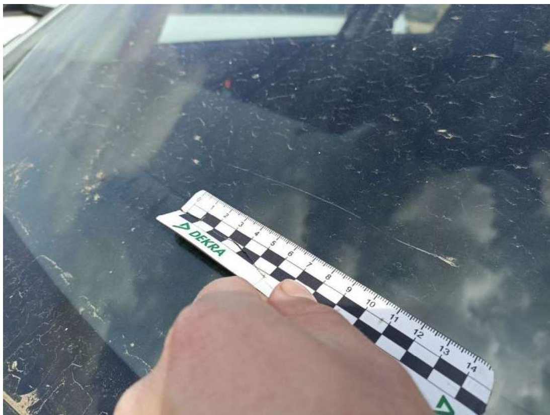
Fot. 37 Szyba czołowa - Inne 2