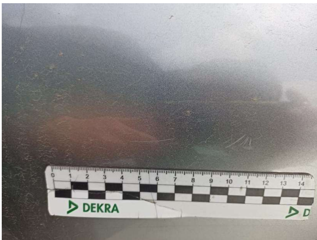
Fot. 40 Drzwi przednie P - Rysa/odprysk 1