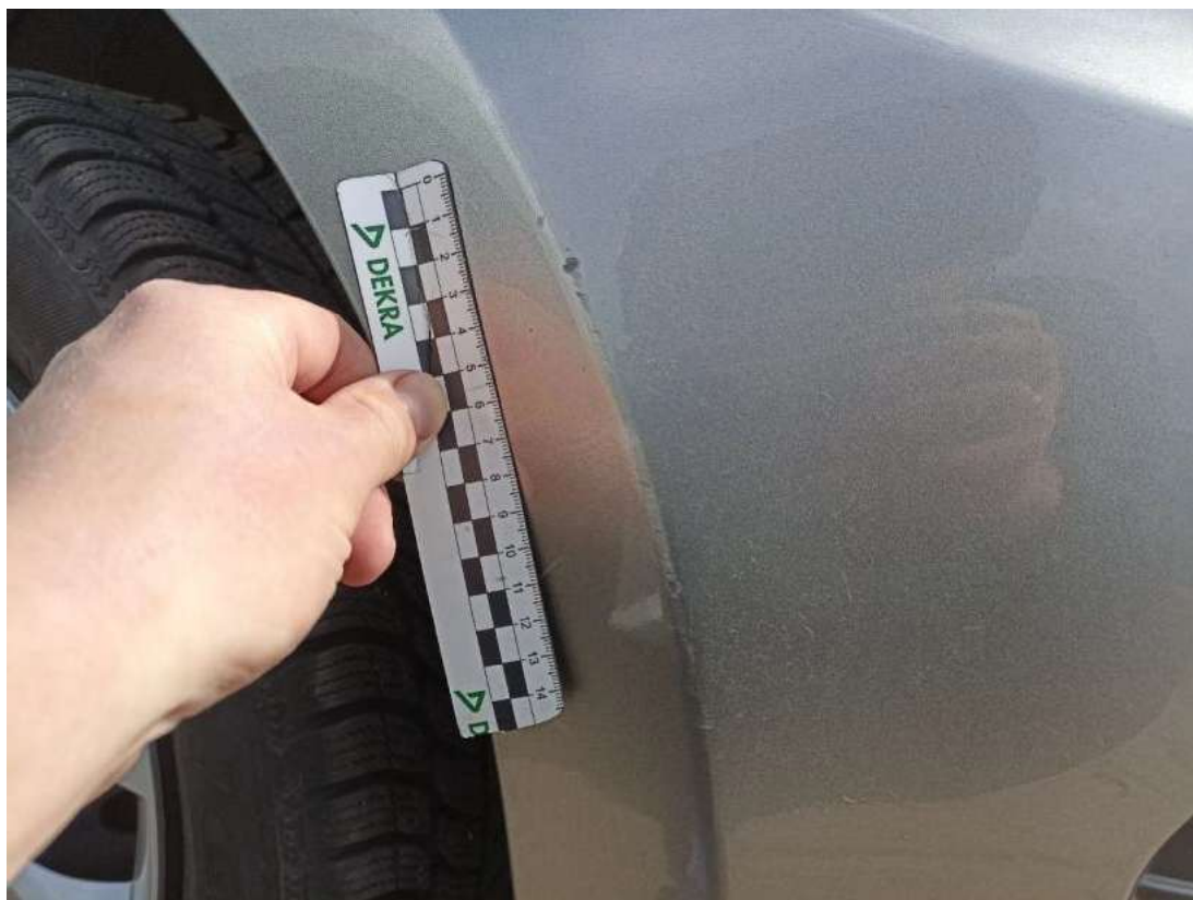
Fot. 39 Zderzak - Rysa/odprysk 2