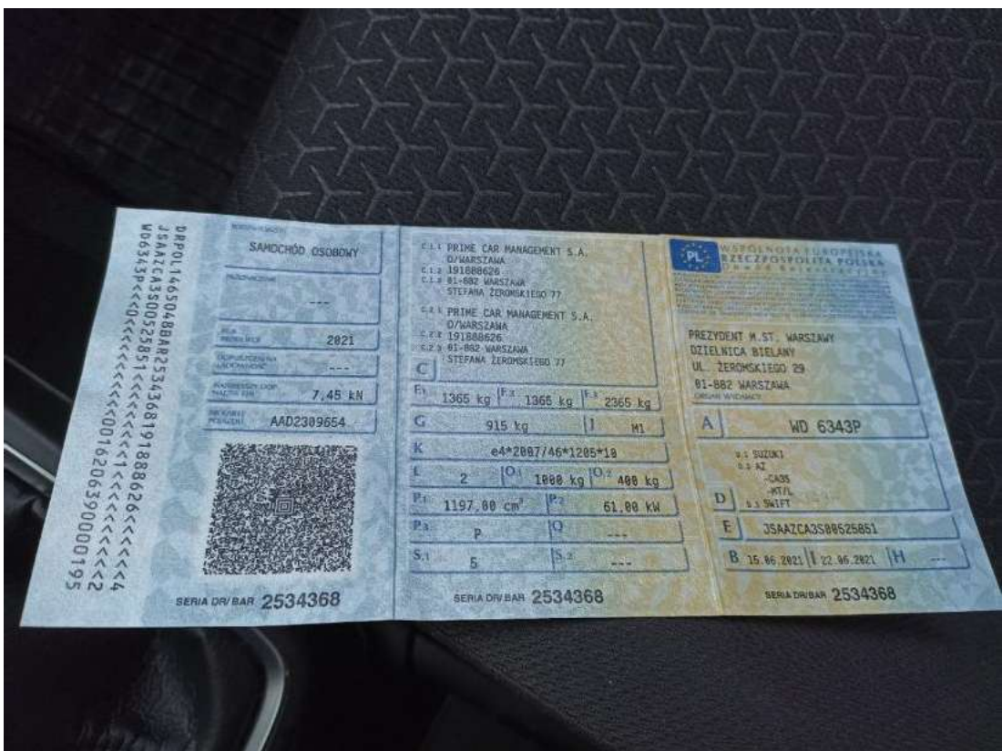
Fot. 28 Dowód rej. Str. 1