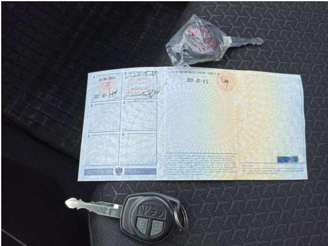
Fot. 29 Dow. Rej. Str.2 i klucze