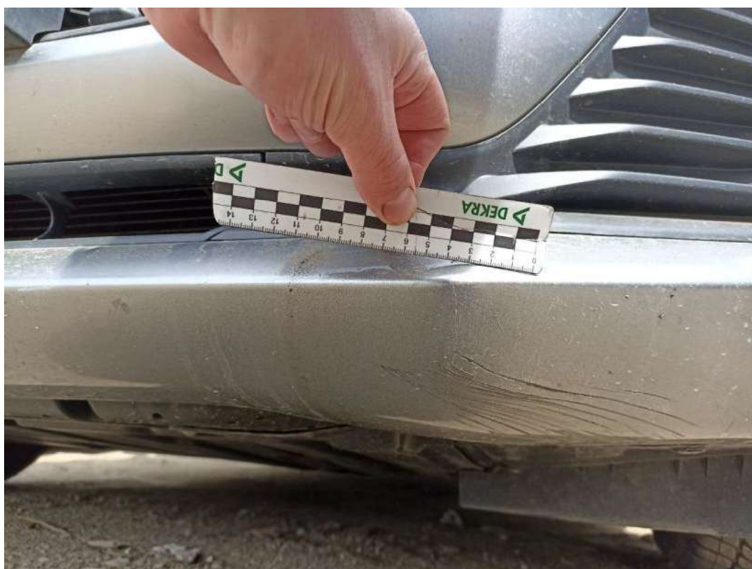
Fot. 38 Zderzak - Rysa/odprysk 1