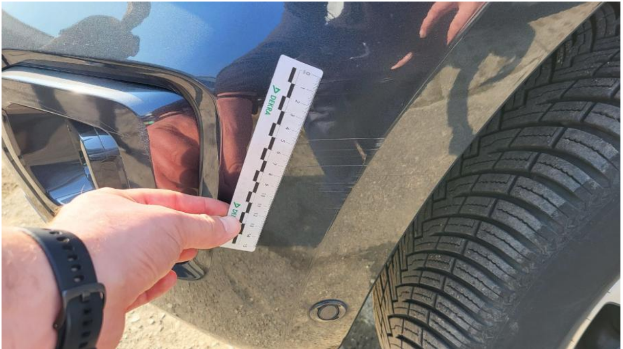
Fot. 31 Zderzak() - Rysa/odprysk 3