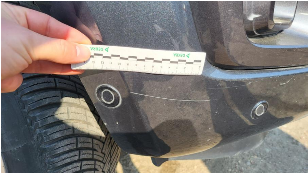
Fot. 29 Zderzak - Rysa/odprysk 1