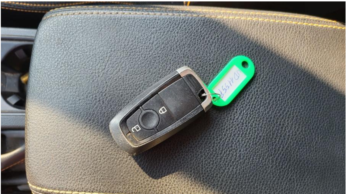
Fot. 28 Zdjęcie do protokołu