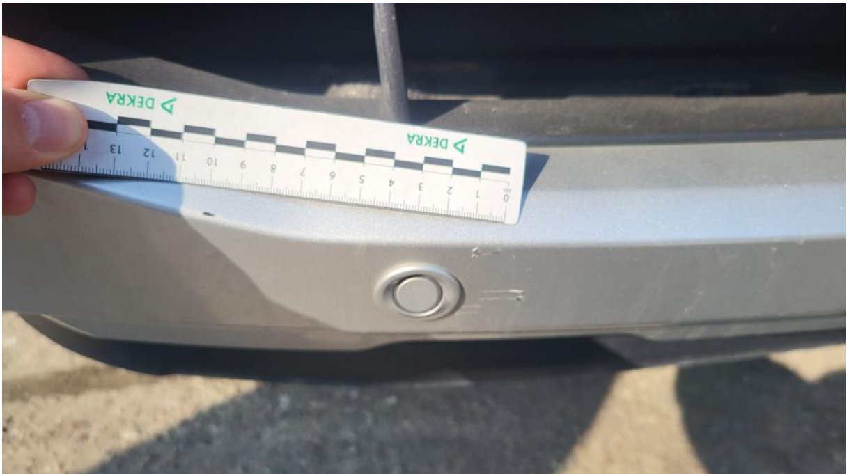
Fot. 32 Zderzak przedni cz Śr - Rysa/odprysk 1