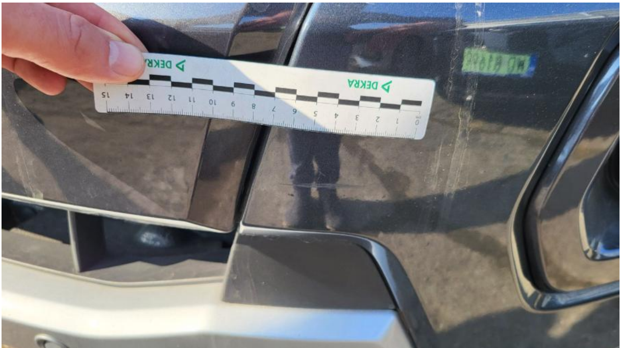
Fot. 30 Zderzak - Rysa/odprysk 2