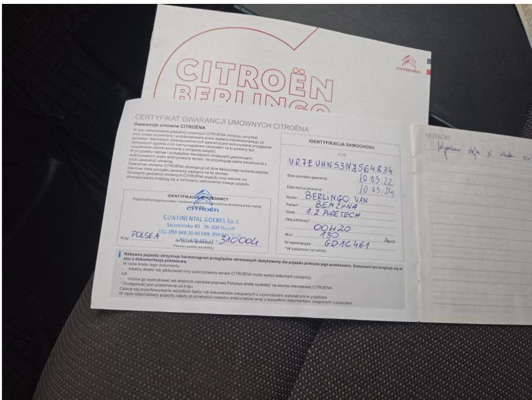
Fot. 34 Książka serwisowa – dane