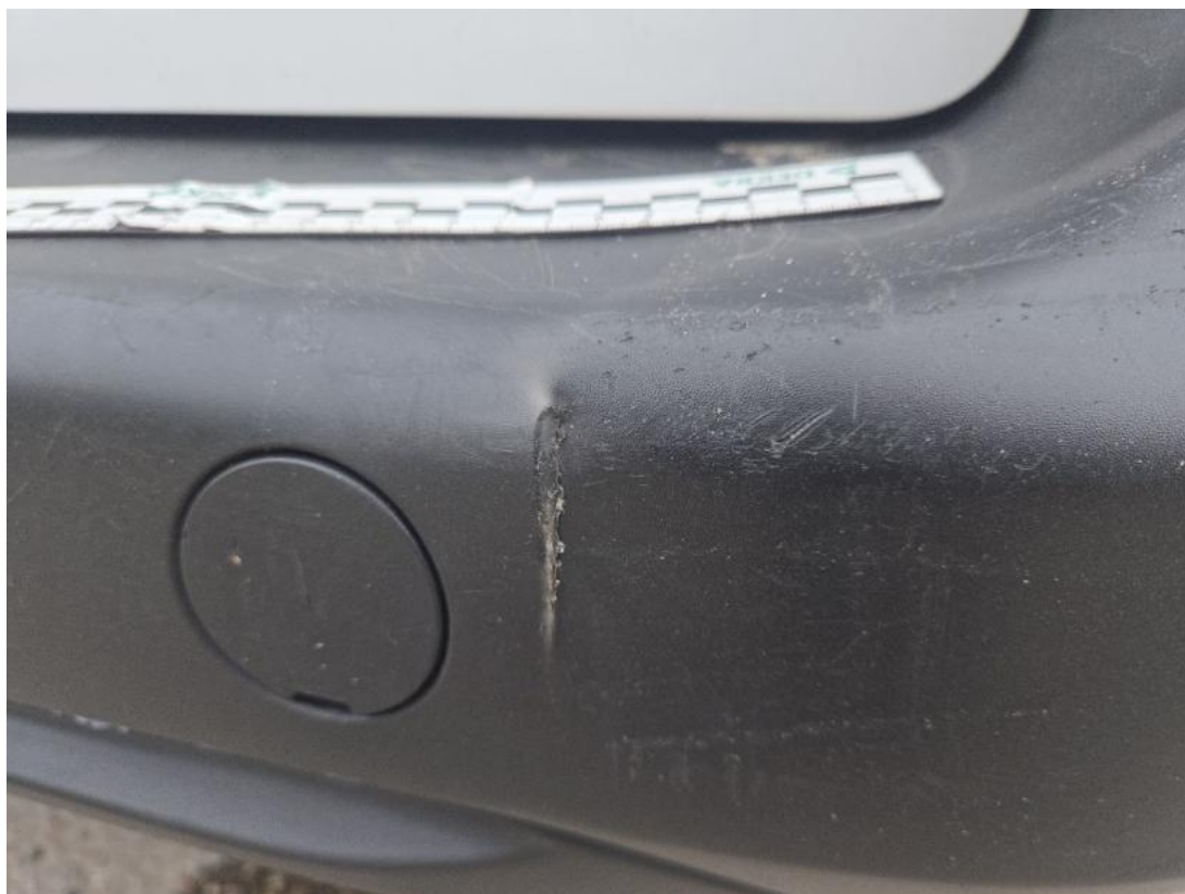
Fot. 49 Zderzak tylny - zdjęcie pogładowe 2