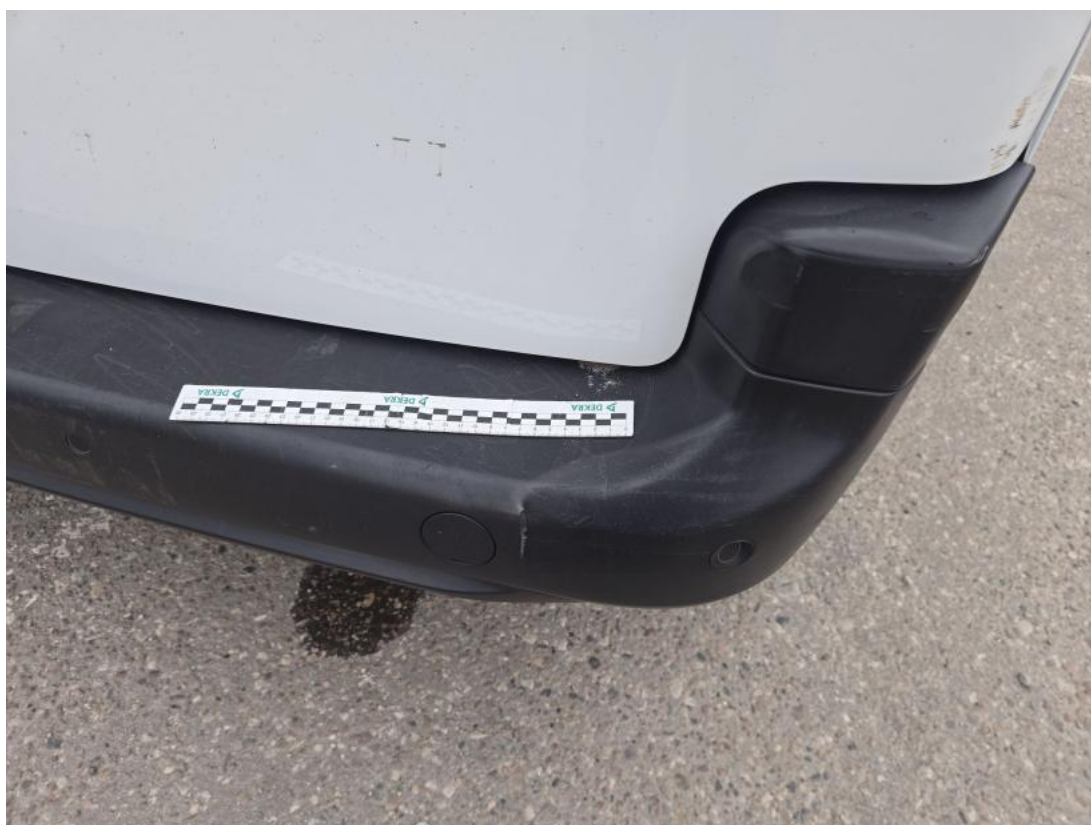
Fot. 50 Zderzak tylny - Pęknięcie/rozerwanie 1