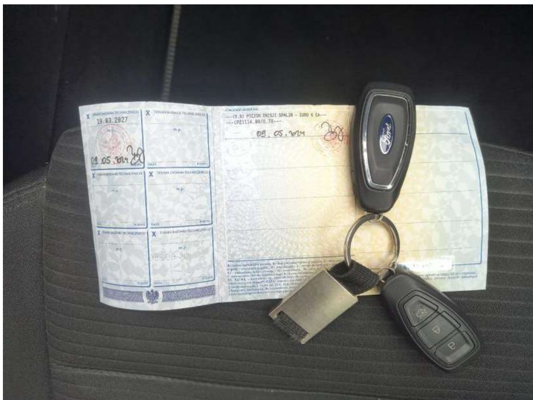
Fot. 12 Dow. Rej. Str.2 i klucze