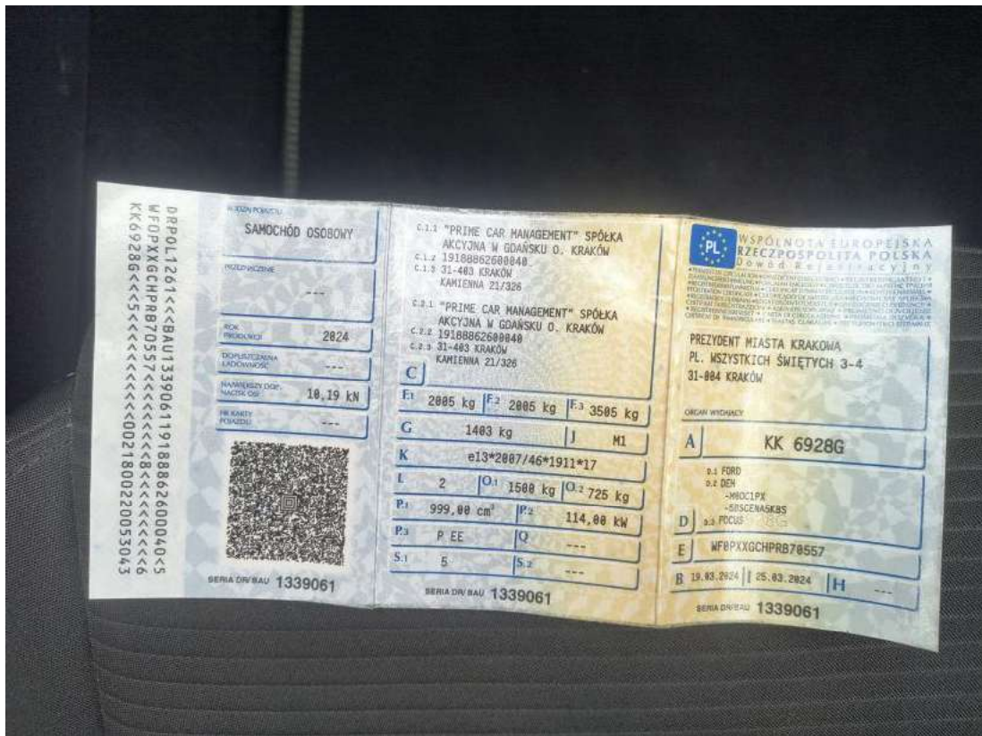
Fot. 11 Dowód rej. Str. 1