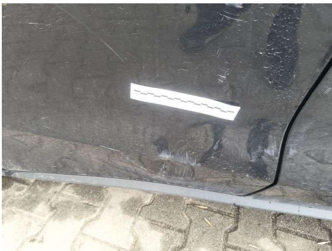
Fot. 42 Drzwi tylne P - Wgniecenie/odkształcenie 2