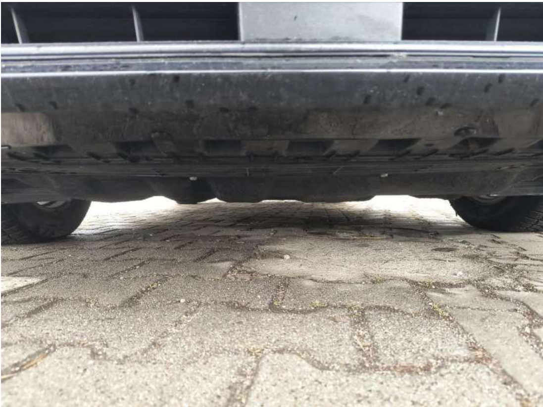
Fot. 25 Spód pojazdu przód