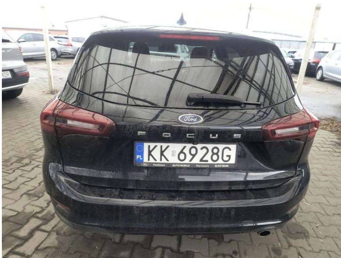
Fot. 8 Tyl