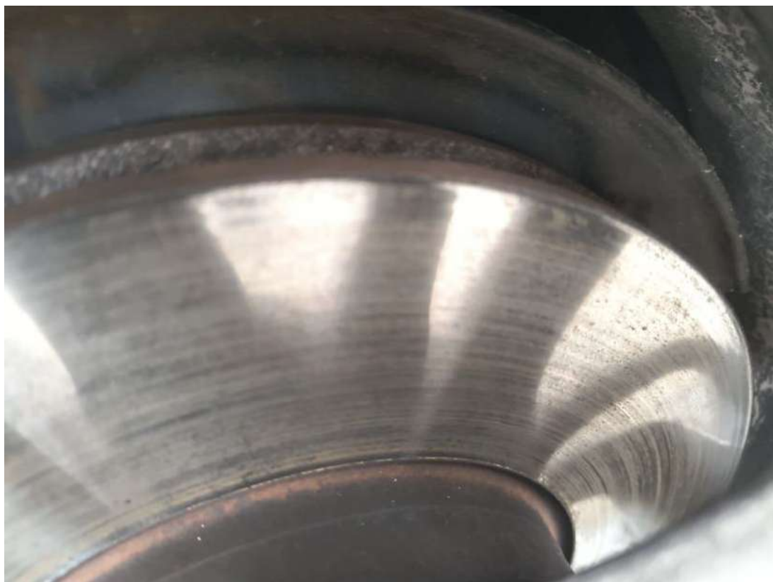
Fot. 27 Tarcza hamulcowa przednia lewa