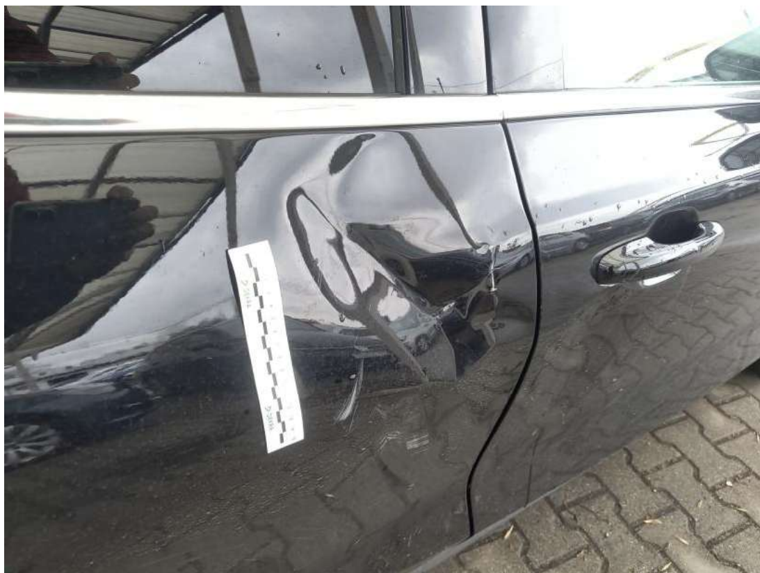
Fot. 41 Drzwi tylne P - Wgniecenie/odkształcenie 1