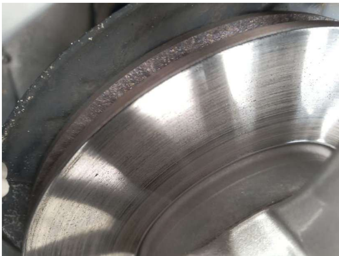
Fot. 28 Tarcza hamulcowa przednia prawa