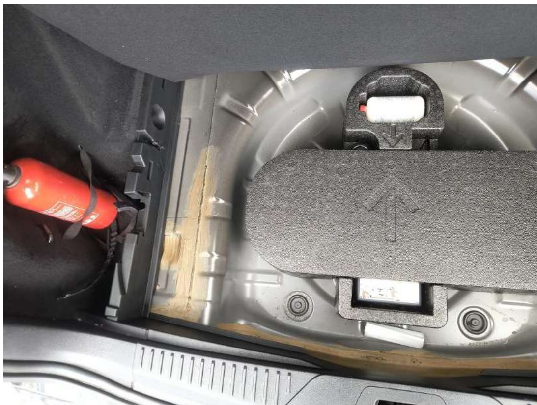
Fot. 33 Zestaw naprawczy koła