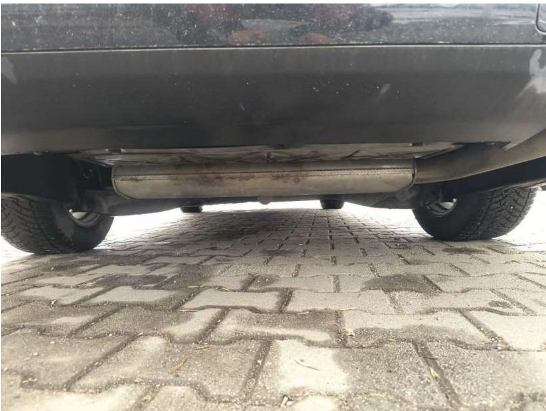
Fot. 26 Spód pojazdu tył