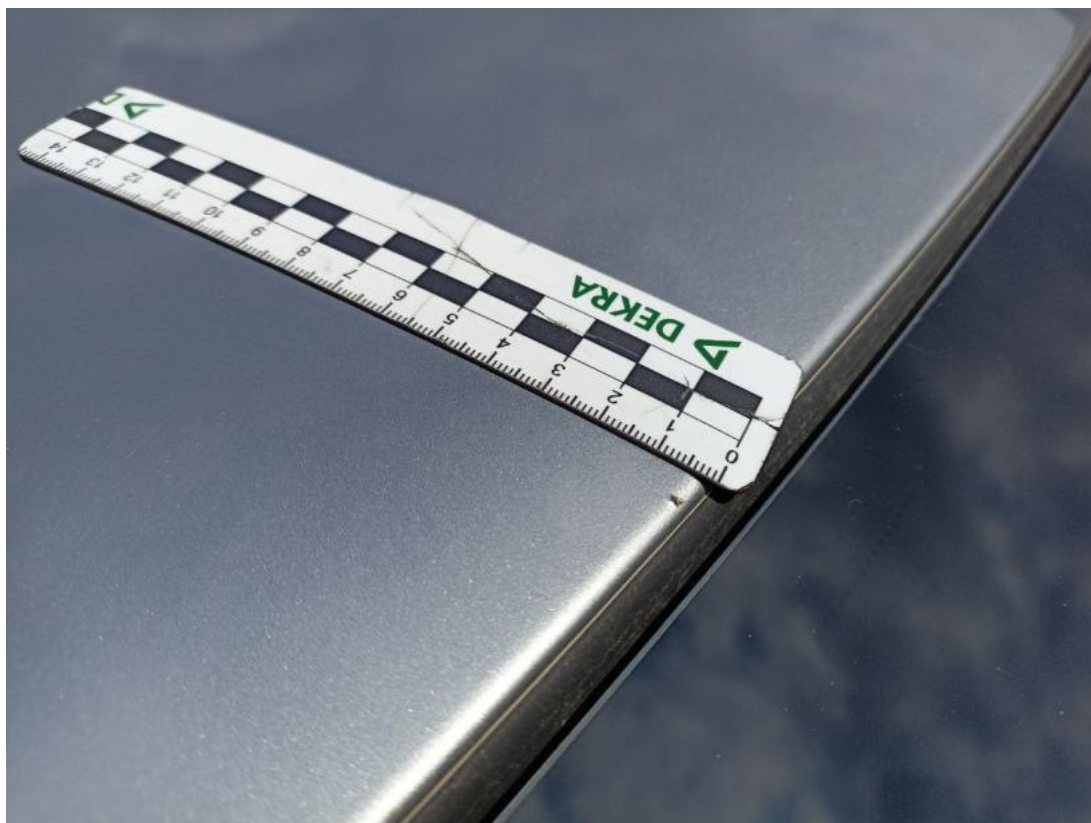
Fot. 41 Dach - Rysa/odprysk 1