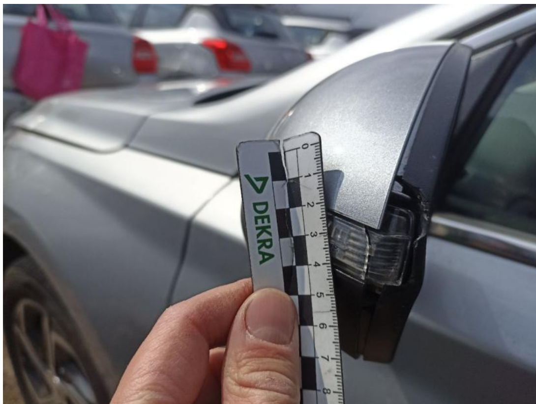
Fot. 45 Obudowa lusterka zew L - Pęknięcie/rozerwanie 1