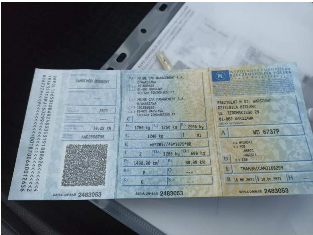
Fot. 28 Dowód rej. Str. 1