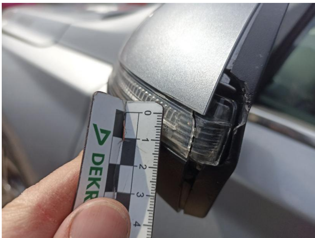
Fot. 44 Kierunkowskaz boczny/lusterka L - Pęknięcie/rozerwanie 1