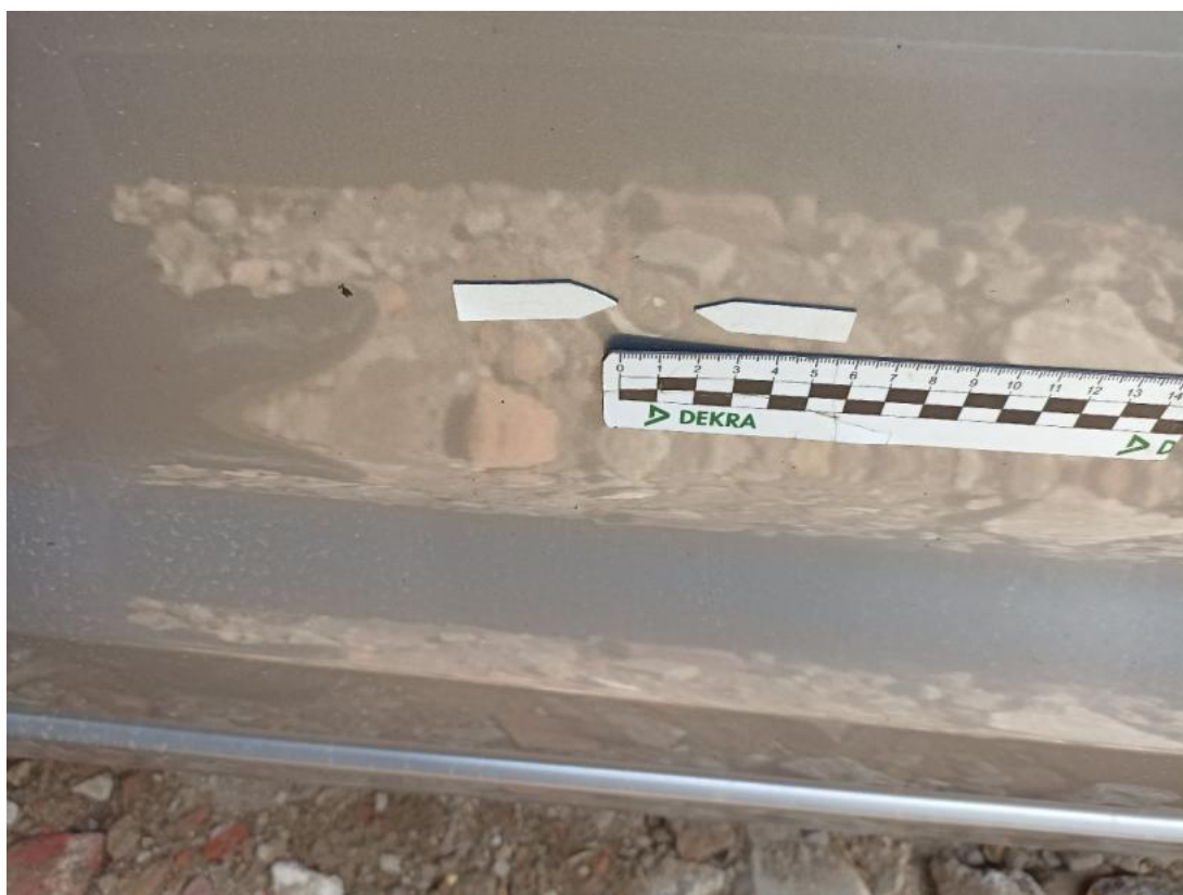
Fot. 38 Drzwi przednie P - Wgniecenie/odkształcenie 1