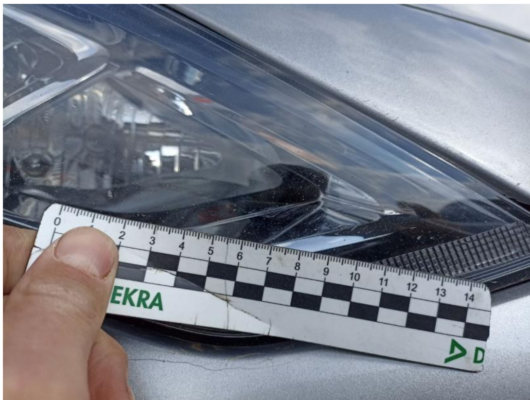
Fot. 37 Reflektor P - Rysa/odprysk 1