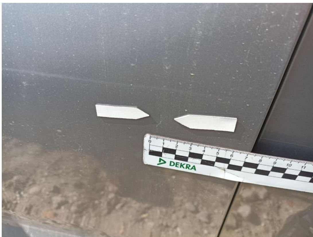
Fot. 42 Drzwi przed L - Wgniecenie/odkształcenie 1