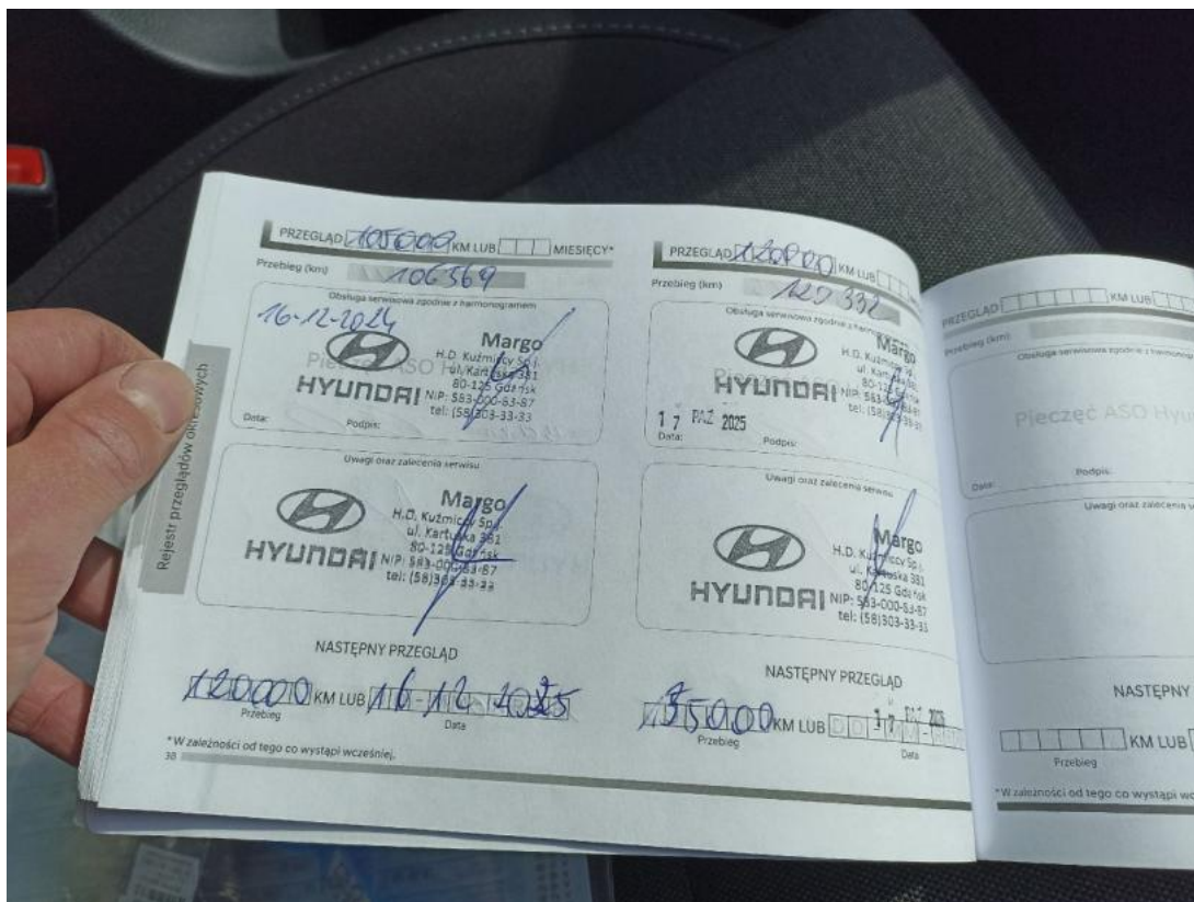
Fot. 31 Książka serwisowa – ostatni przegląd