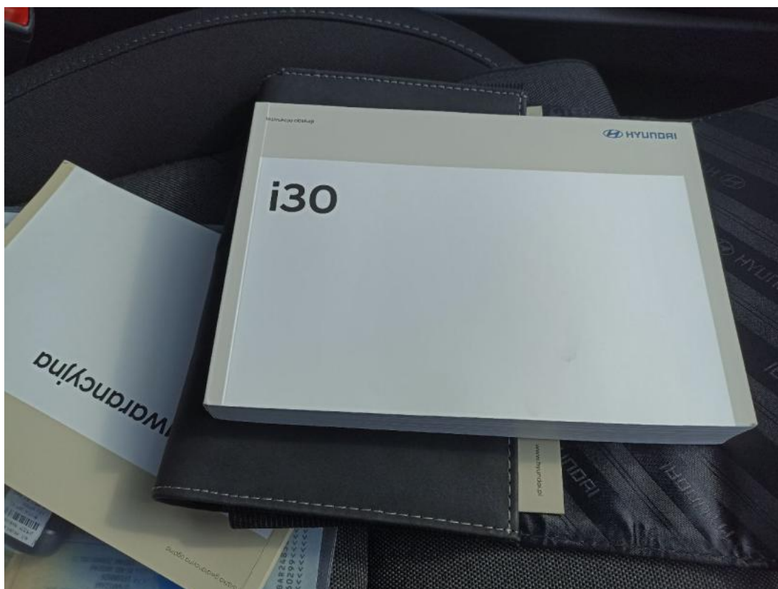
Fot. 32 Instrukcje