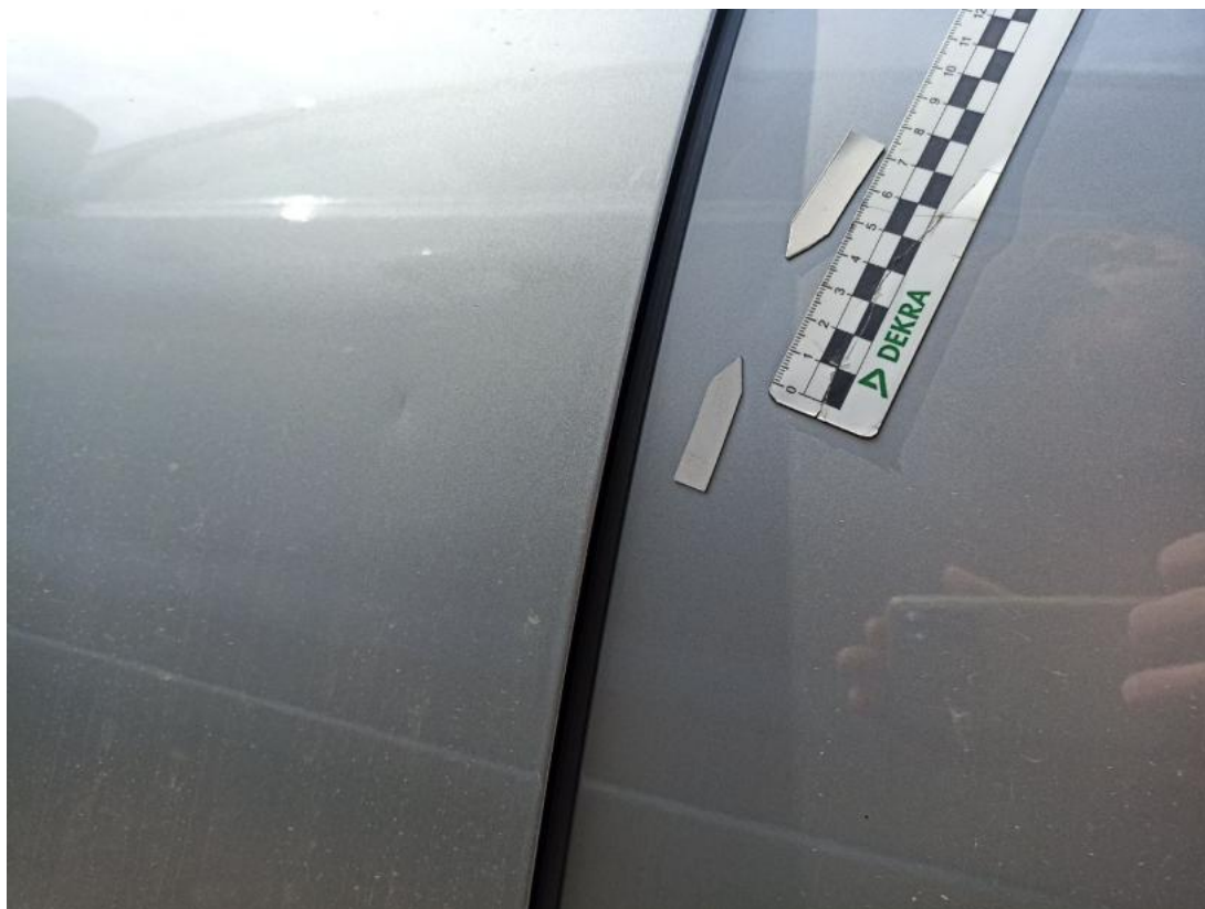
Fot. 43 Drzwi tylne L - Wgniecenie/odkształcenie 1