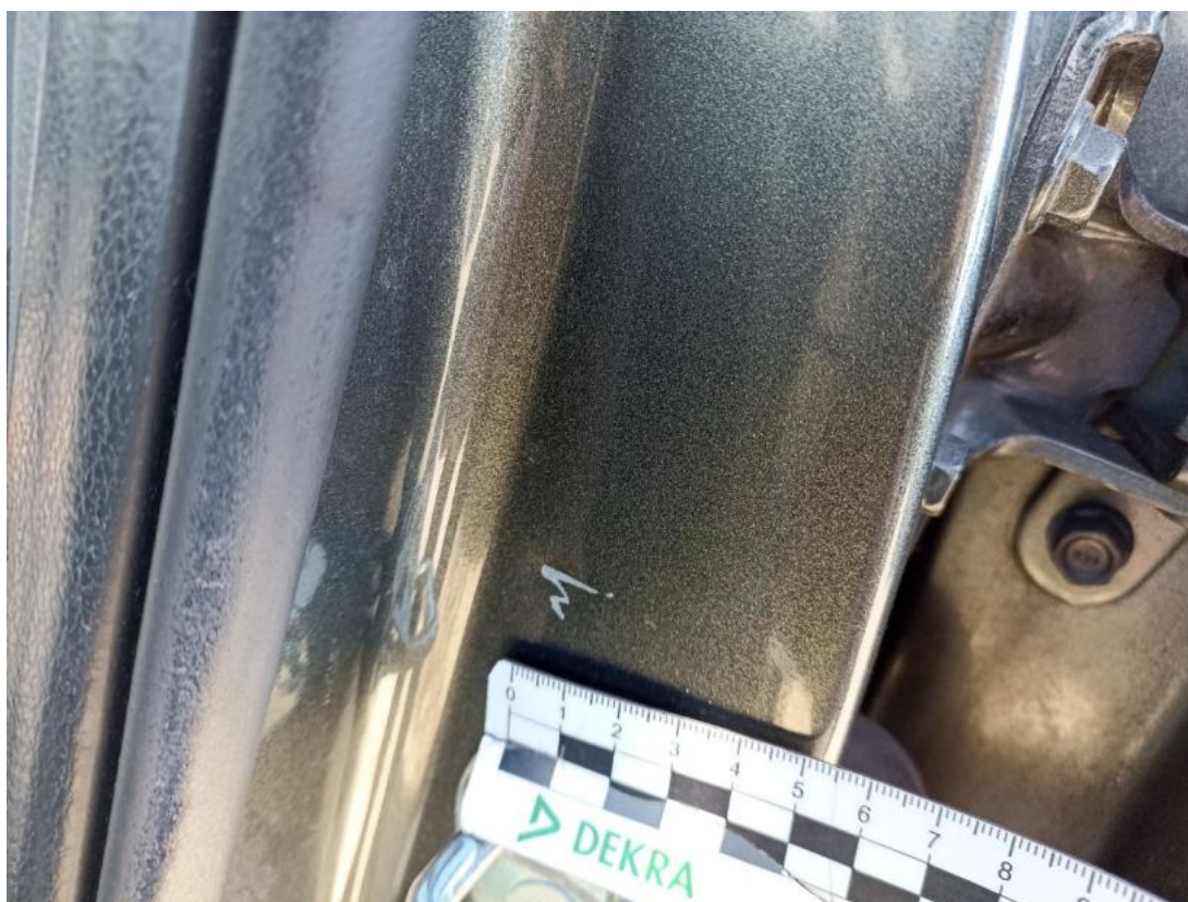
Fot. 54 Słupek środkowy L - Rysa/odprysk 1