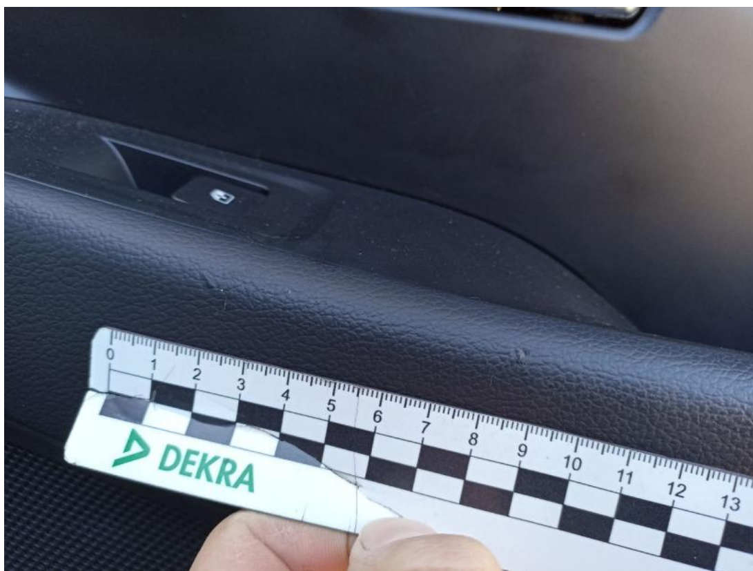
Fot. 56 Tapicerka drzwi tylnych P - Wgniecenie/odkształcenie 1