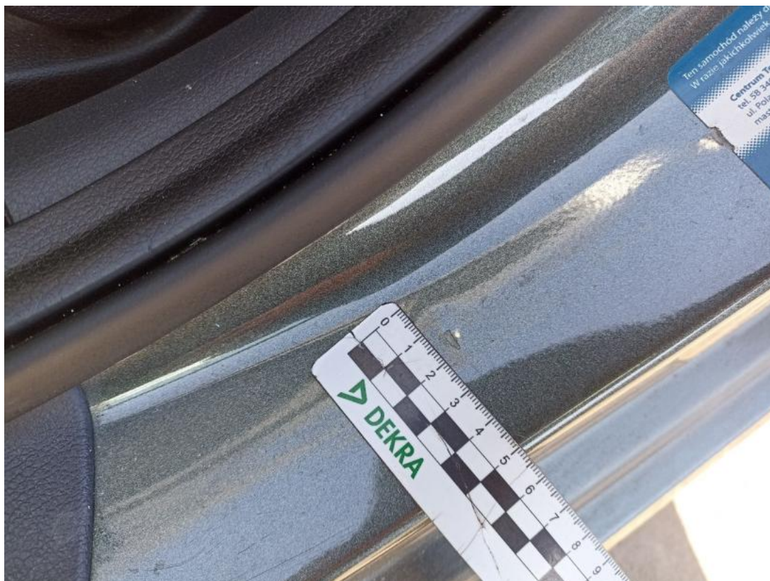
Fot. 53 Próg L - Rysa/odprysk 1