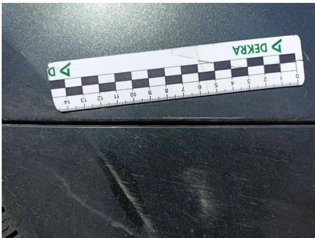
Fot. 48 Błotnik tylny L / Ściana boczna L - Rysa/odprysk 1