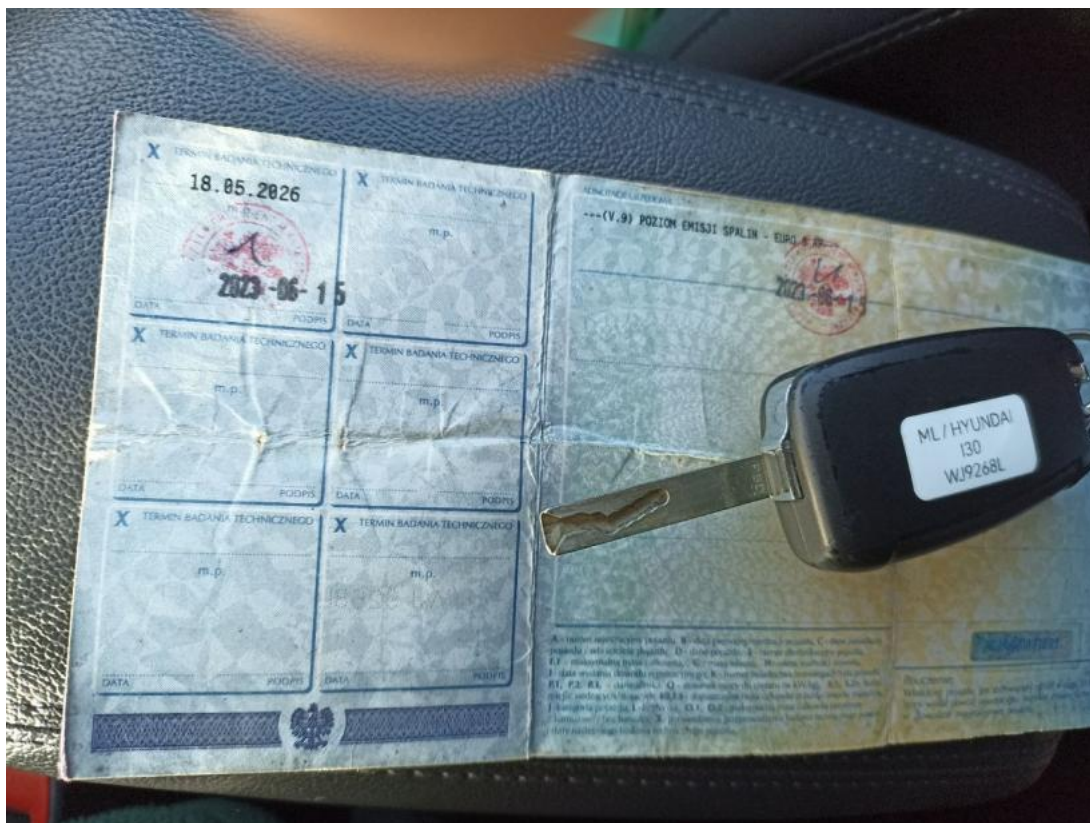
Fot. 29 Dow. Rej. Str.2 i klucze