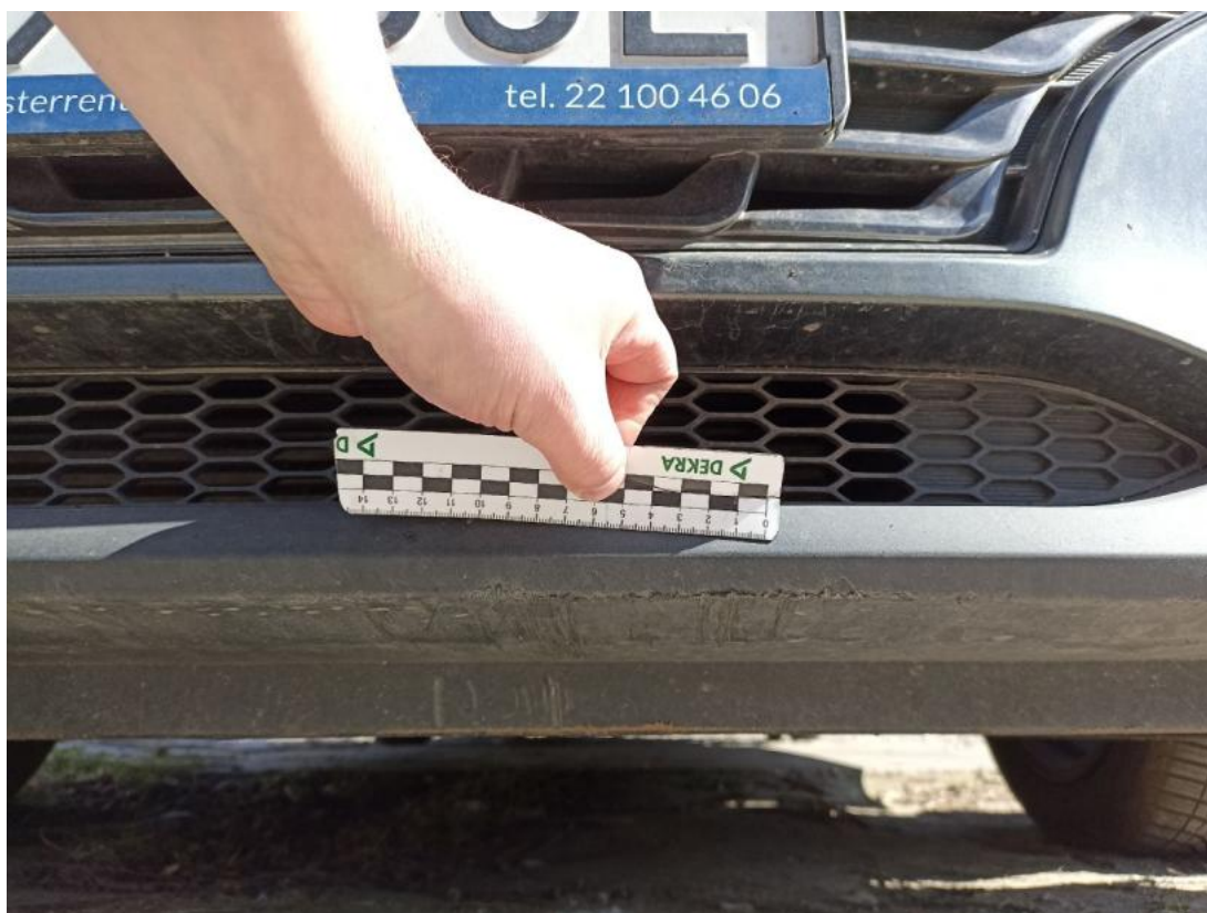
Fot. 35 Spoiler zderzaka przedniego - Rysa/odprysk 1