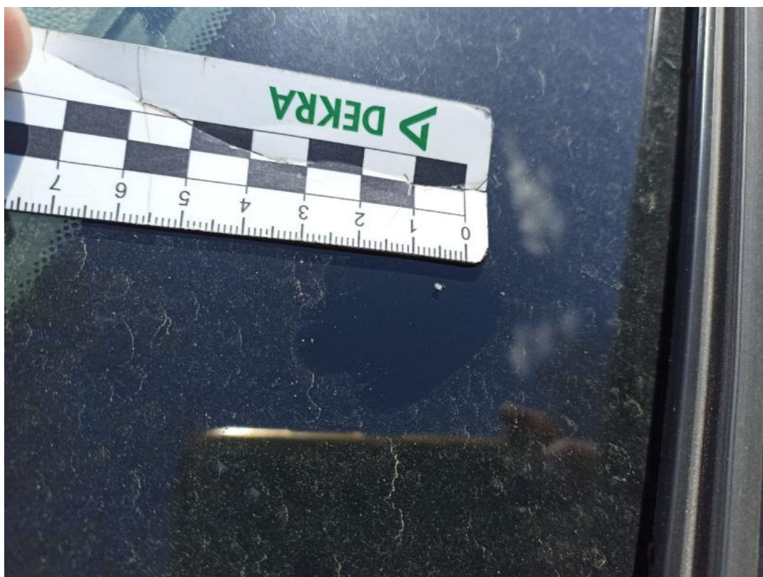
Fot. 36 Szyba czołowa - Rysa/odprysk 1