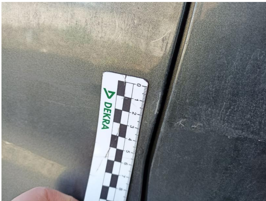
Fot. 41 Drzwi tylne P - Rysa/odprysk 1