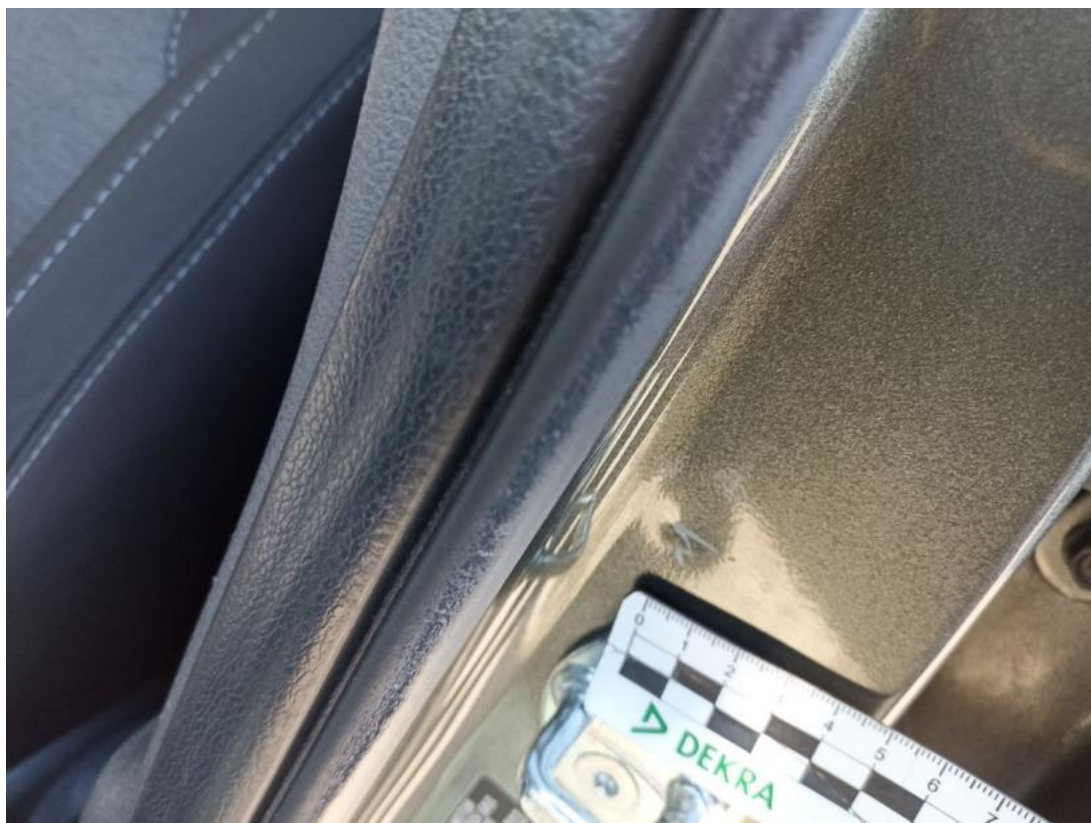
Fot. 55 Słupek środkowy L - Wgniecenie/odkształcenie 1