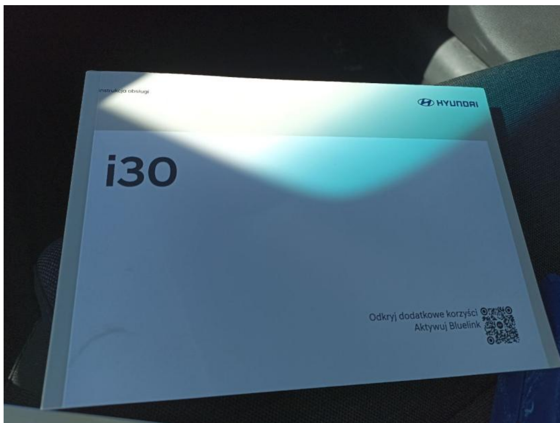
Fot. 32 Instrukcje