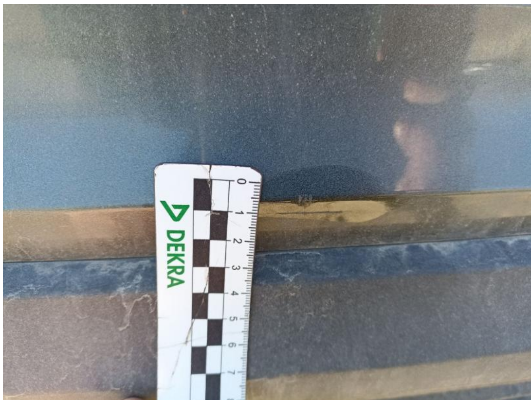
Fot. 47 Zderzak tylny - Wgniecenie/odkształcenie 1