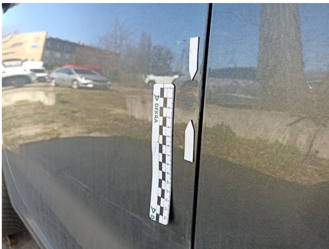
Fot. 42 Drzwi tylne P - Wgniecenie/odkształcenie 1