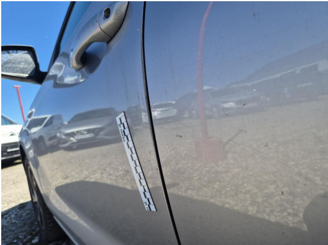
Fot. 37 Drzwi przed L - Wgniecenie/odkształcenie 1