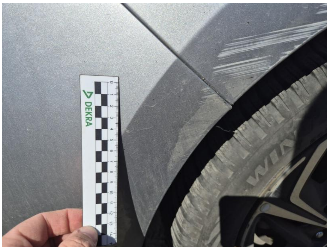
Fot. 35 Zderzak tylny - Rysa/odprysk 1