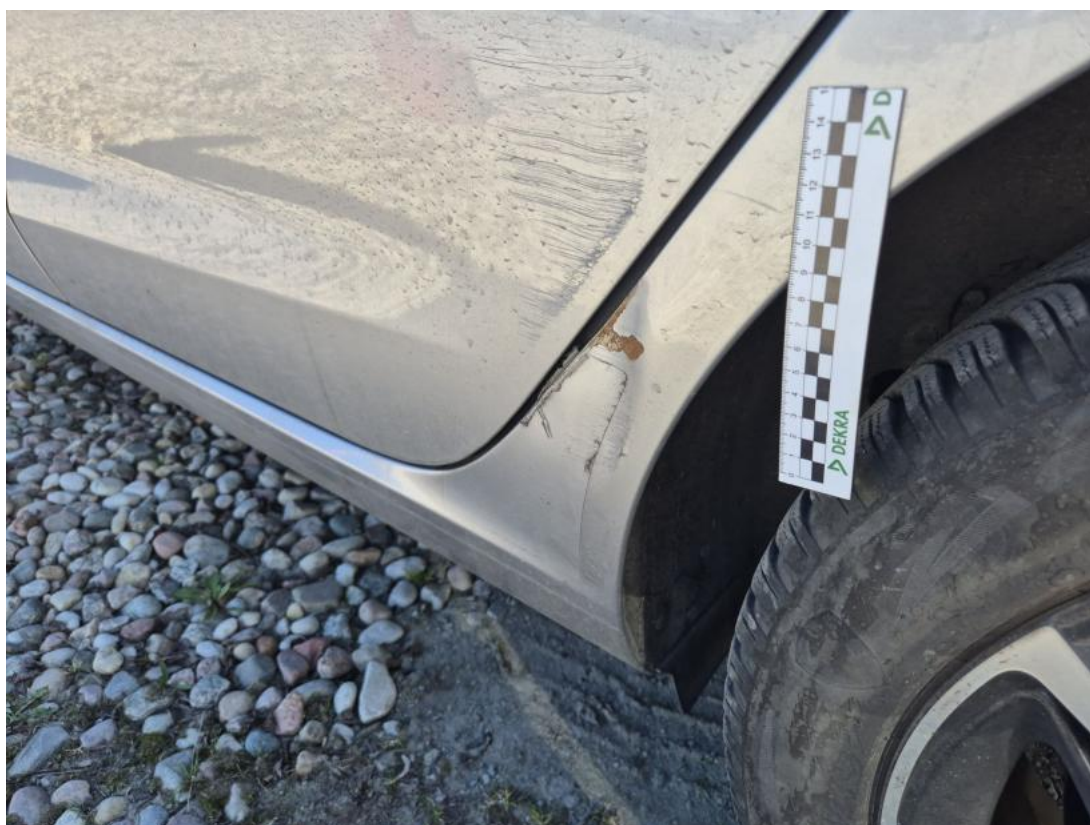
Fot. 36 Błotnik tylny L / Ściana boczna L - Wgniecenie/odkształcenie 1