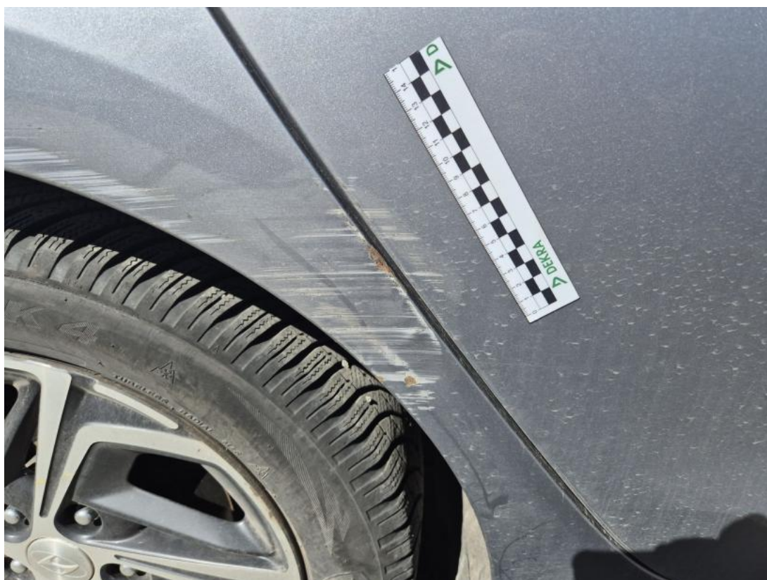
Fot. 31 Drzwi tylne P - Rysa/odprysk 1