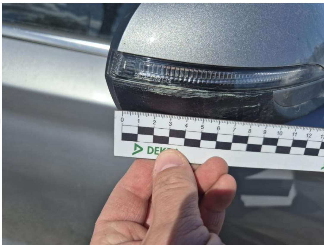
Fot. 32 Lusterko zew P - Rysa/odprysk 1