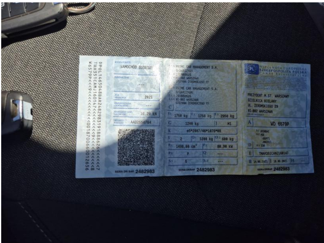
Fot. 28 Dowód rej. Str. 1