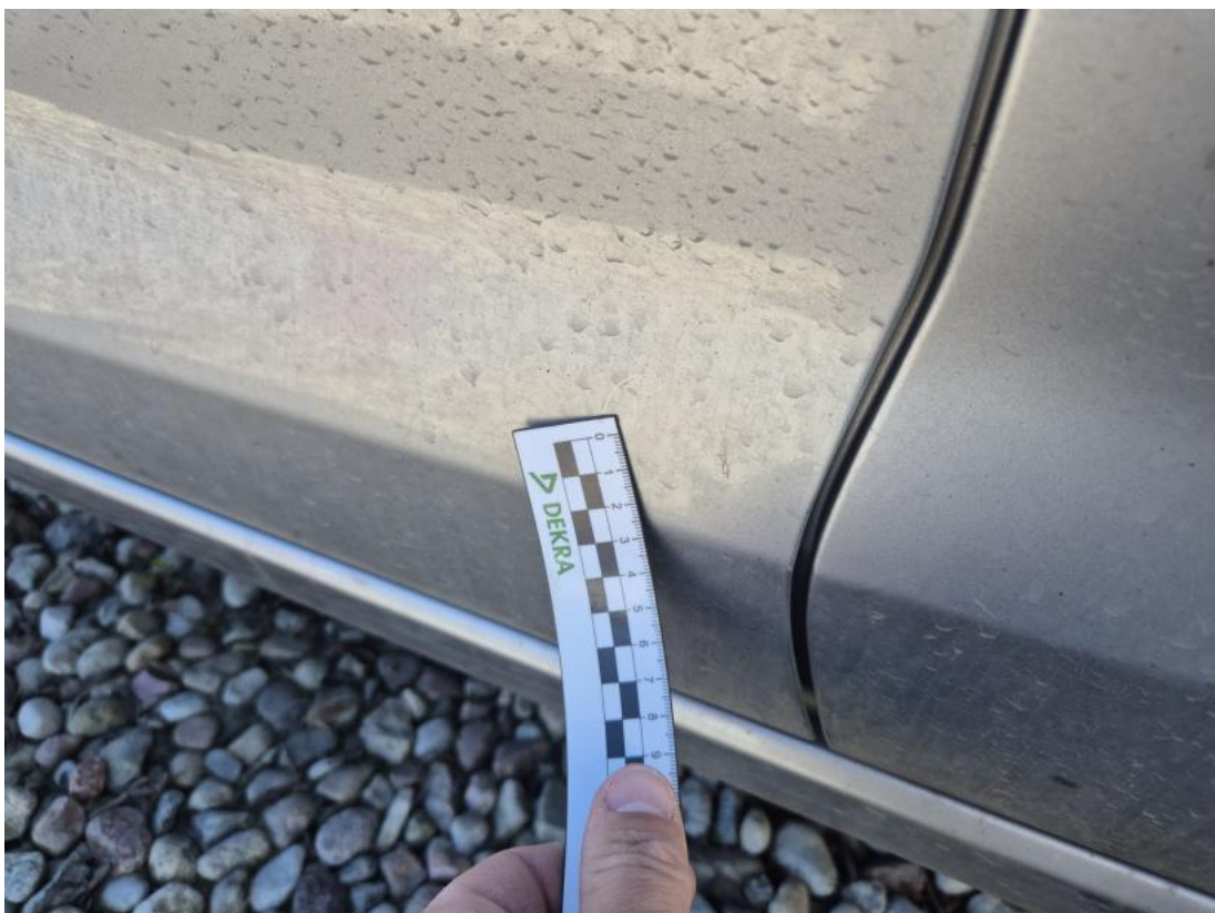
Fot. 38 Drzwi przed L - Wgniecenie/odkształcenie 2