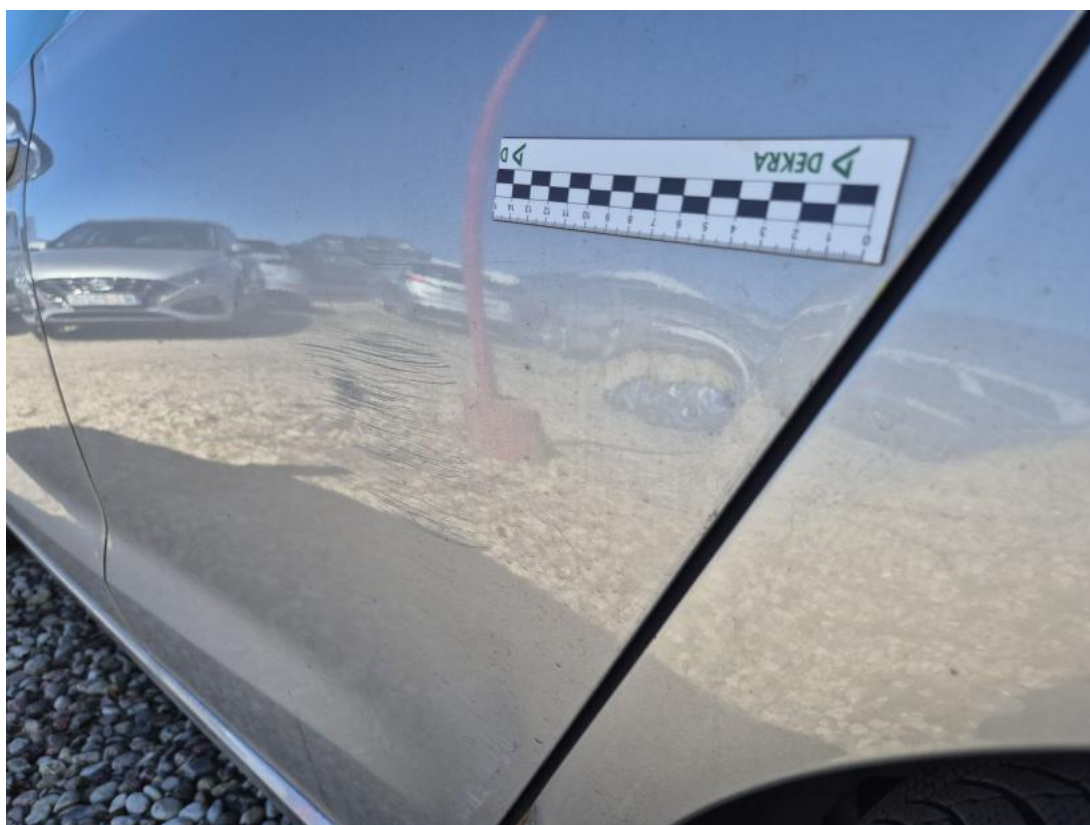
Fot. 39 Drzwi tylne L - Wgniecenie/odkształcenie 1