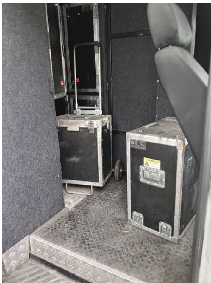
Fot. nr 92