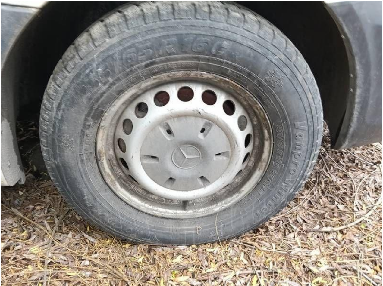
Fot. nr 89