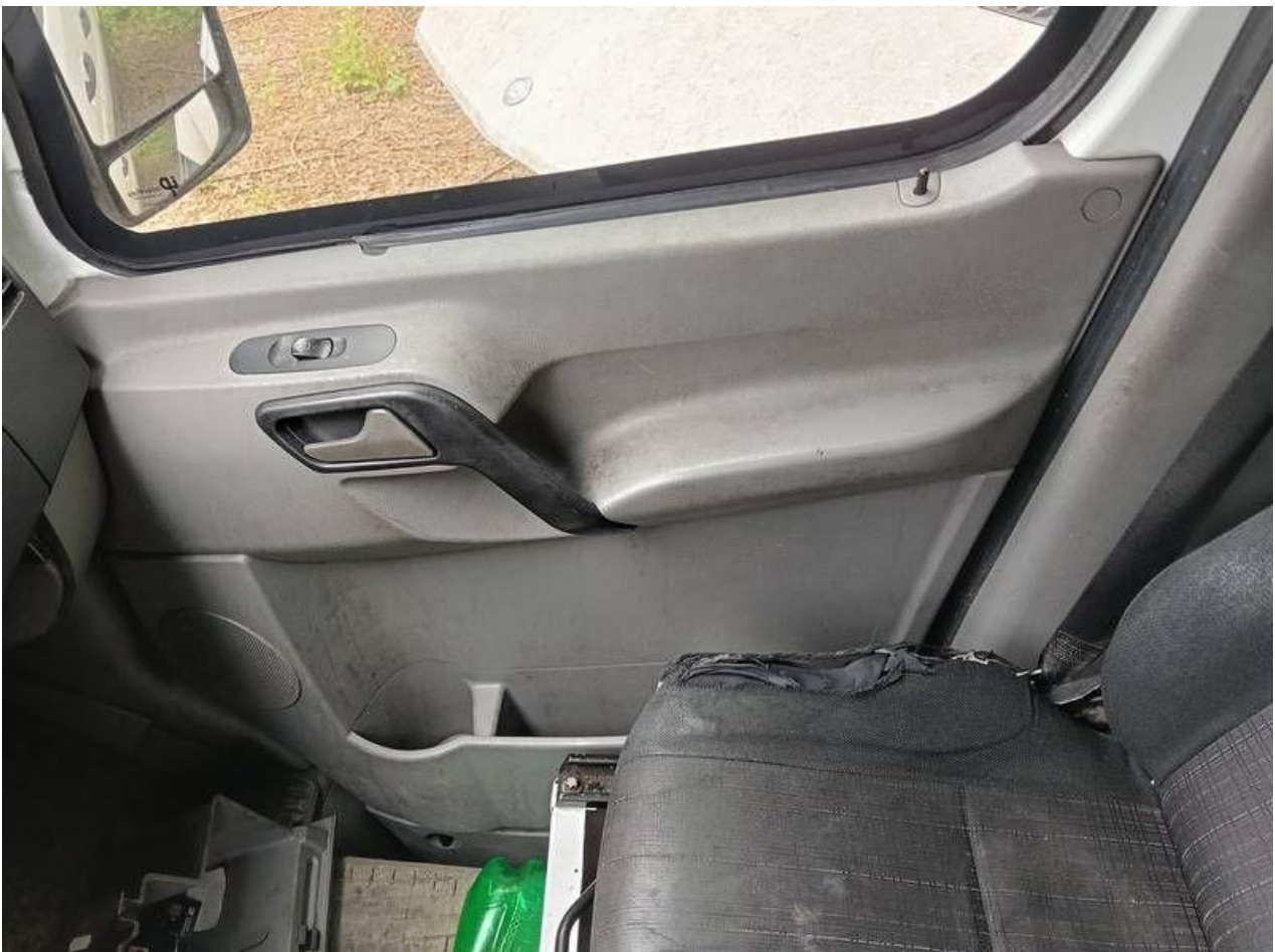
Fot. nr 102