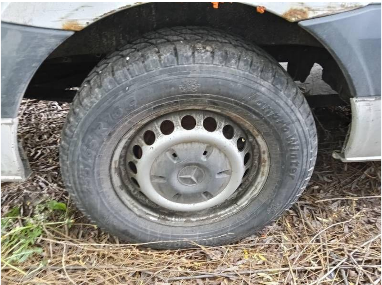
Fot. nr 88