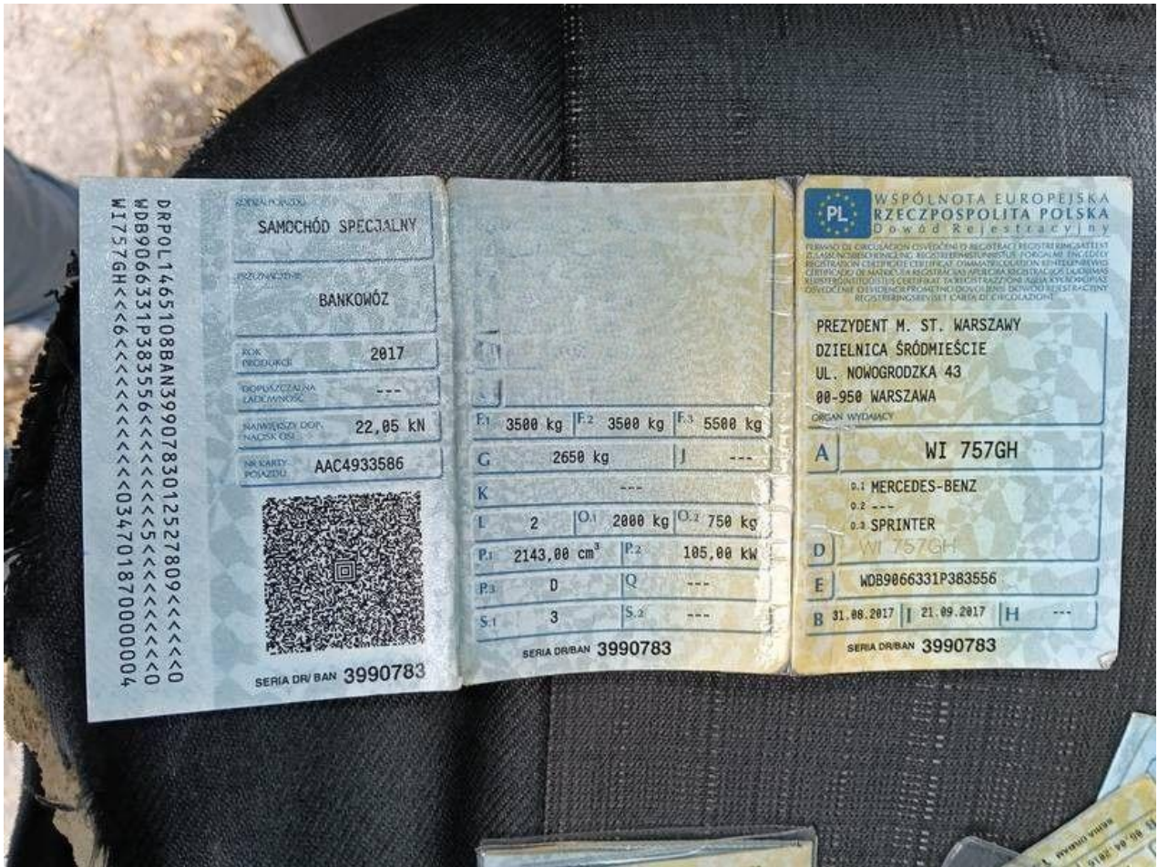
Fot. nr 105