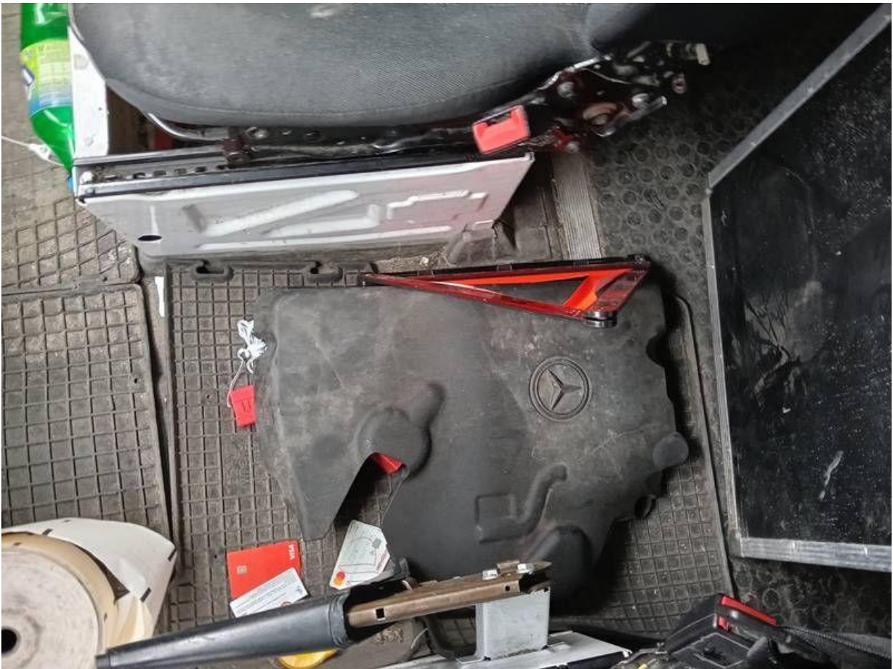
Fot. nr 103