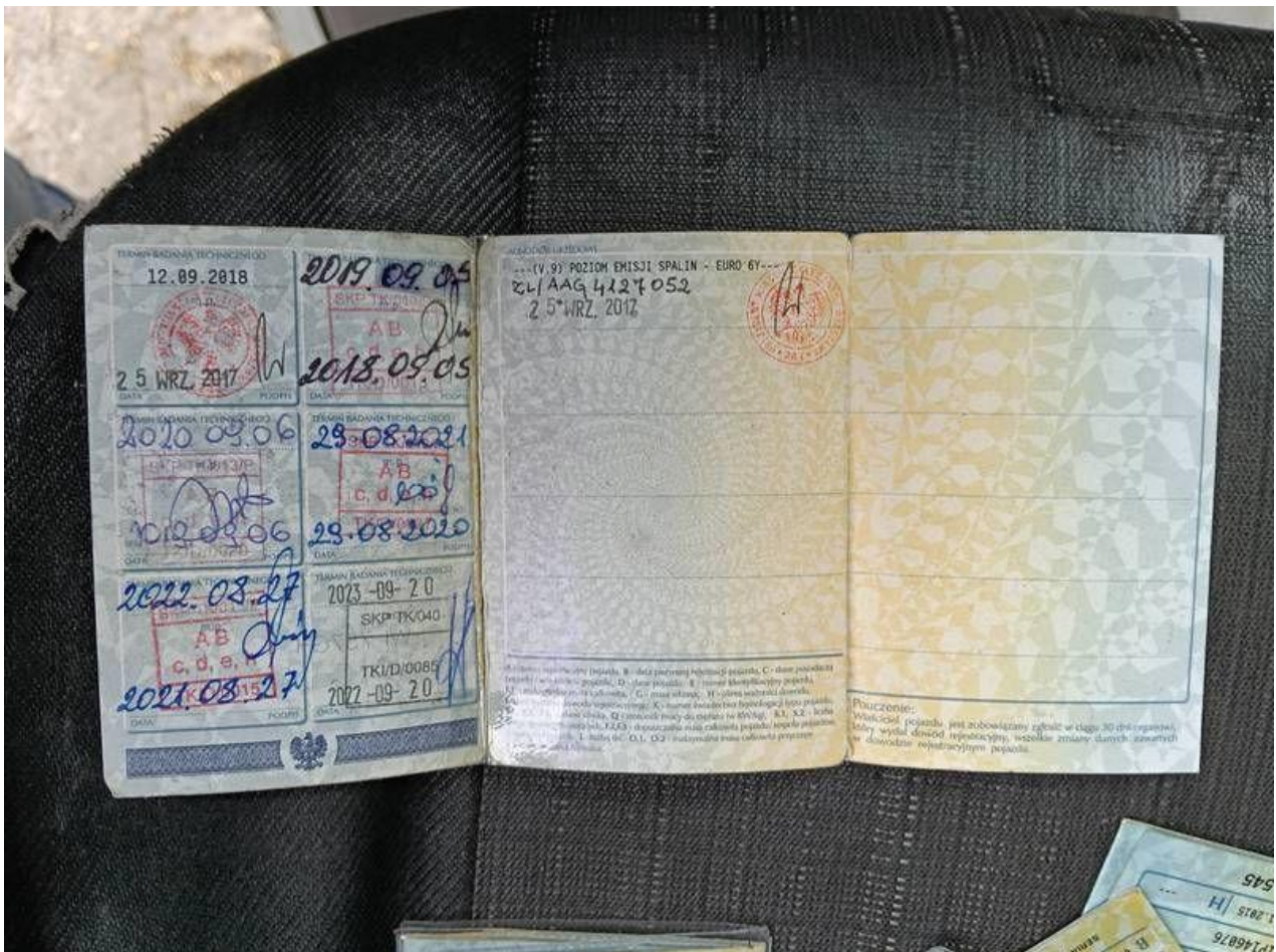
Fot. nr 106