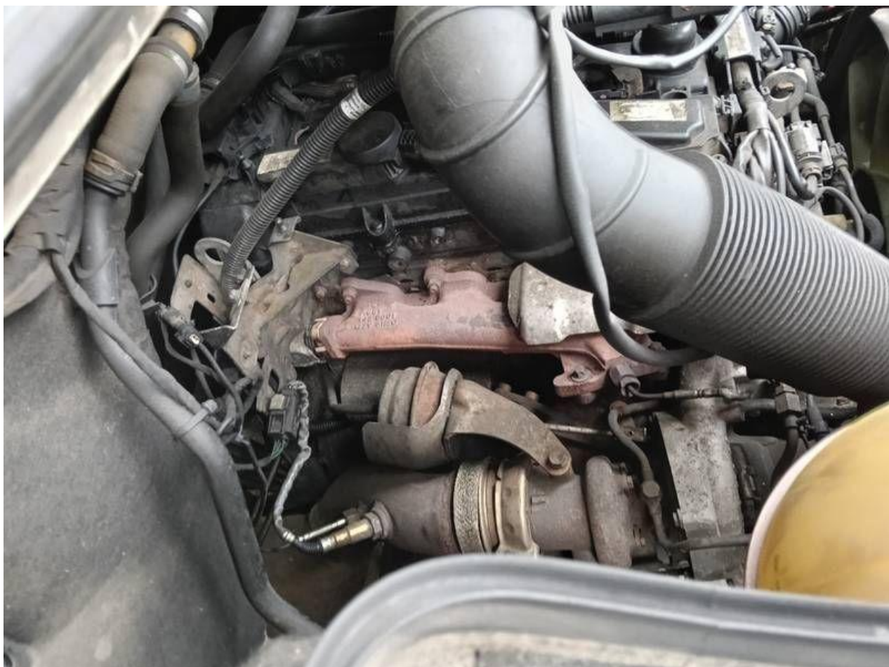
Fot. nr 98