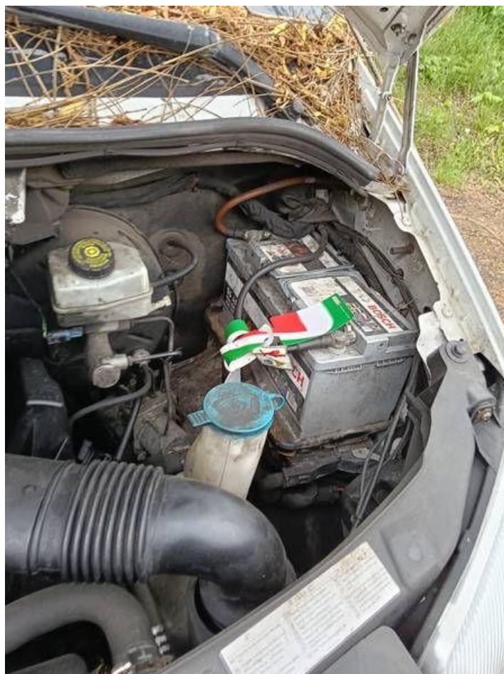
Fot. nr 96