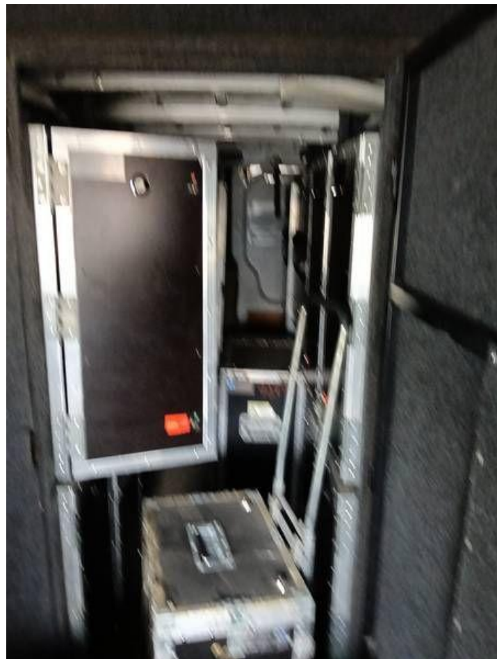
Fot. nr 104