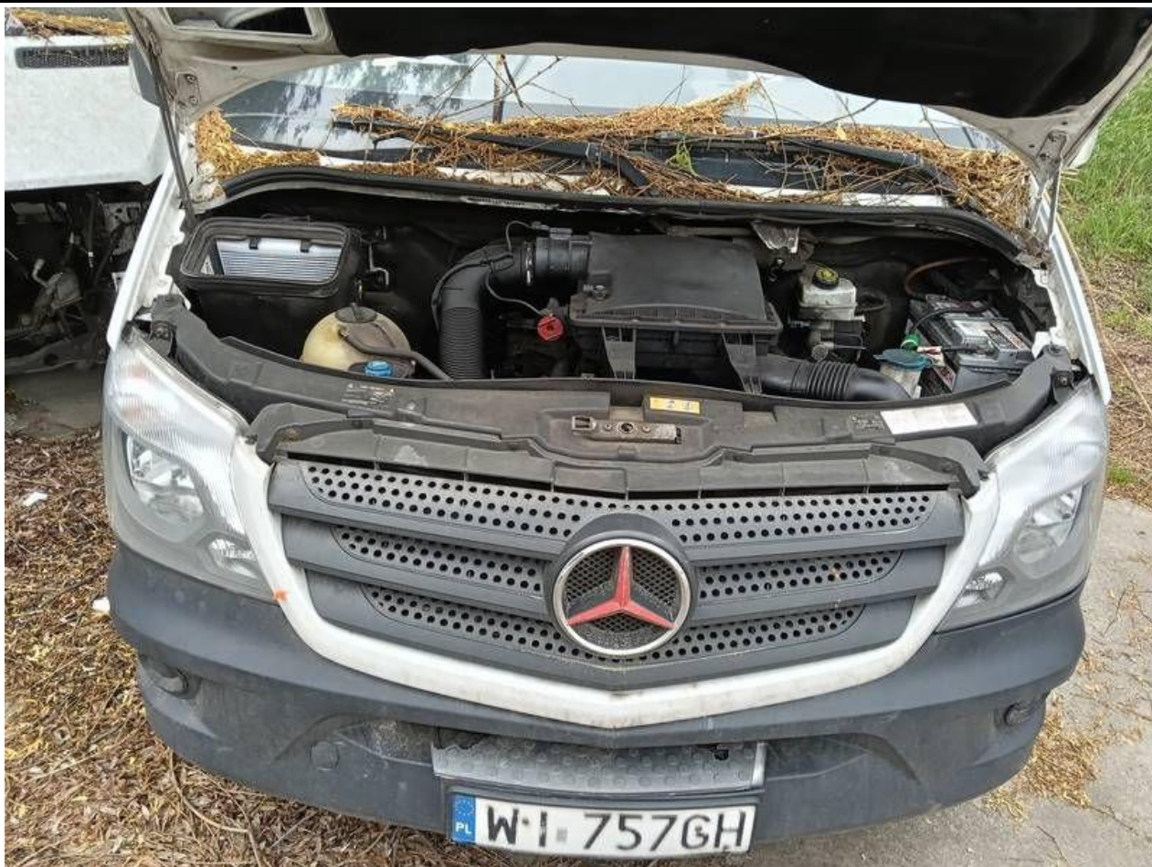
Fot. nr 93