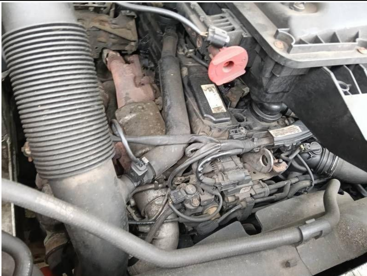
Fot. nr 97