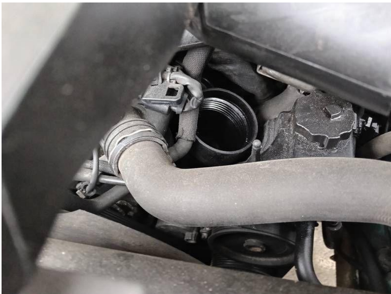
Fot. nr 100