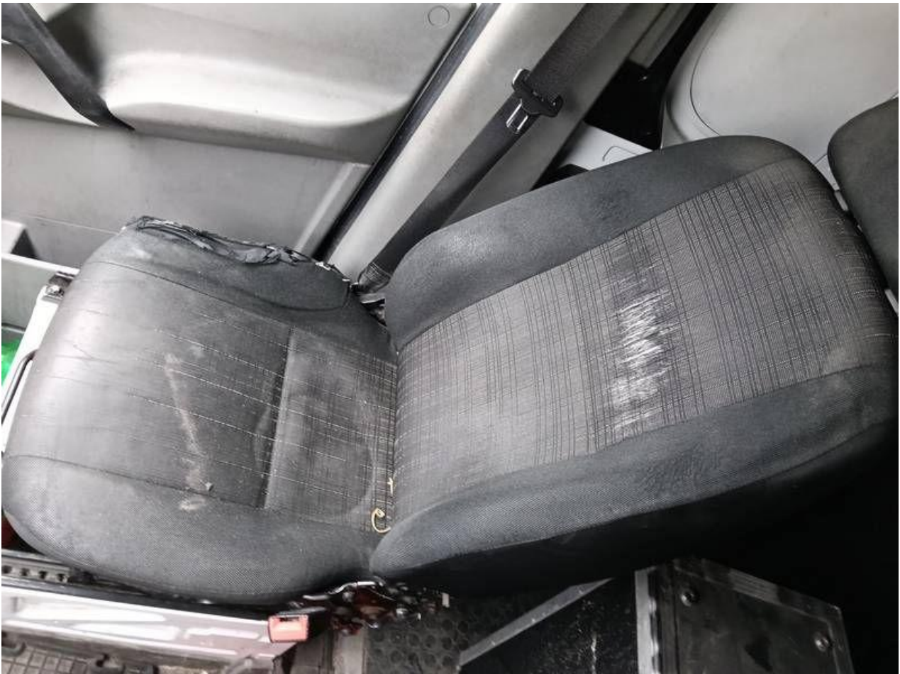
Fot. nr 101