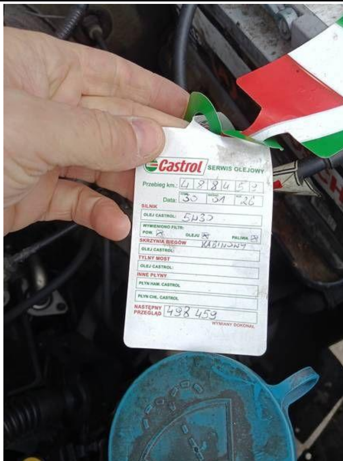
Fot. nr 95