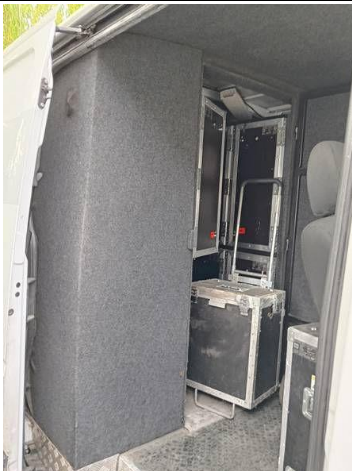
Fot. nr 91