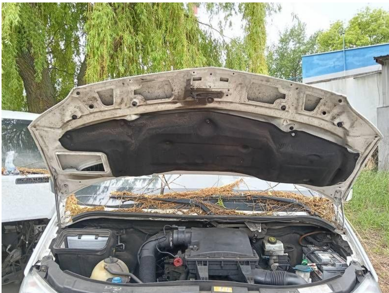
Fot. nr 94