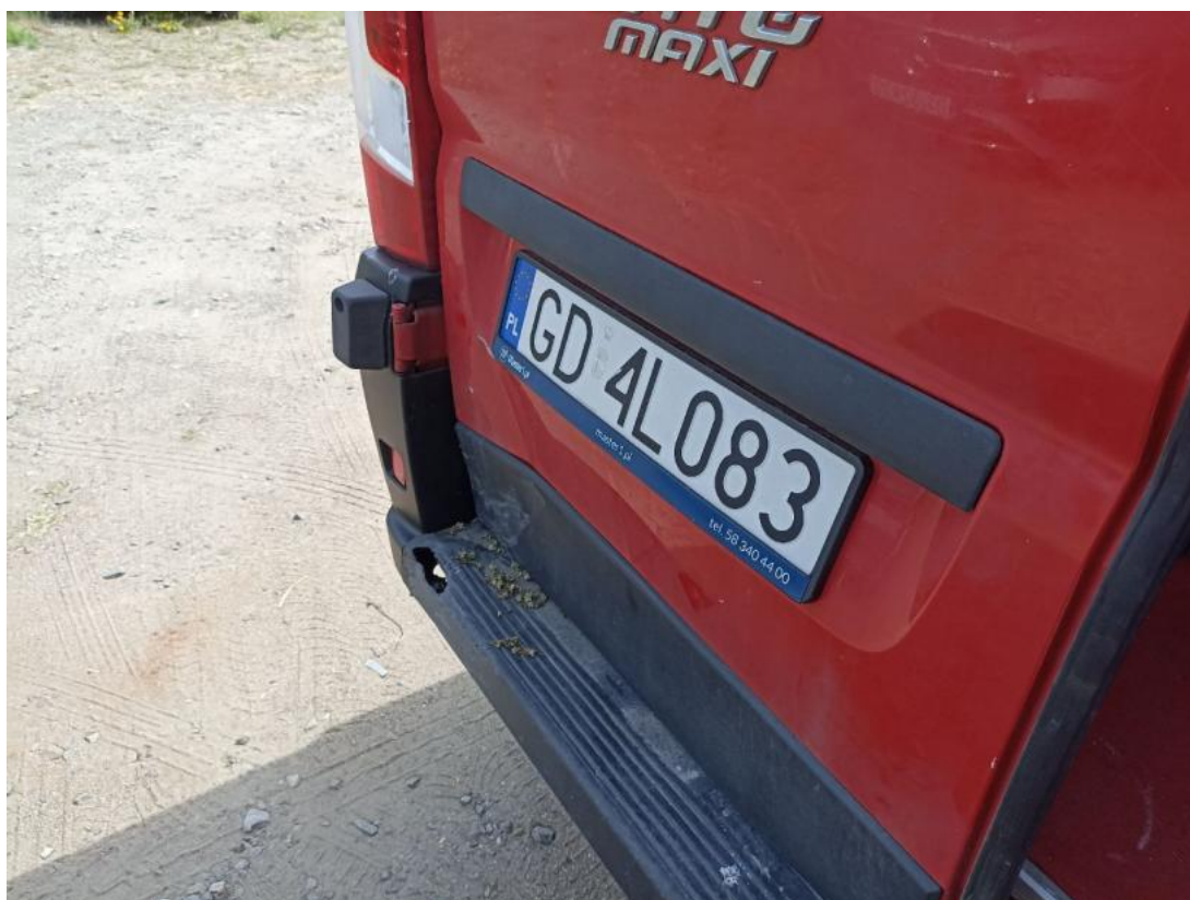
Fot. 72 Drzwi tyłu lewe - Wgniecenie/odkształcenie 1