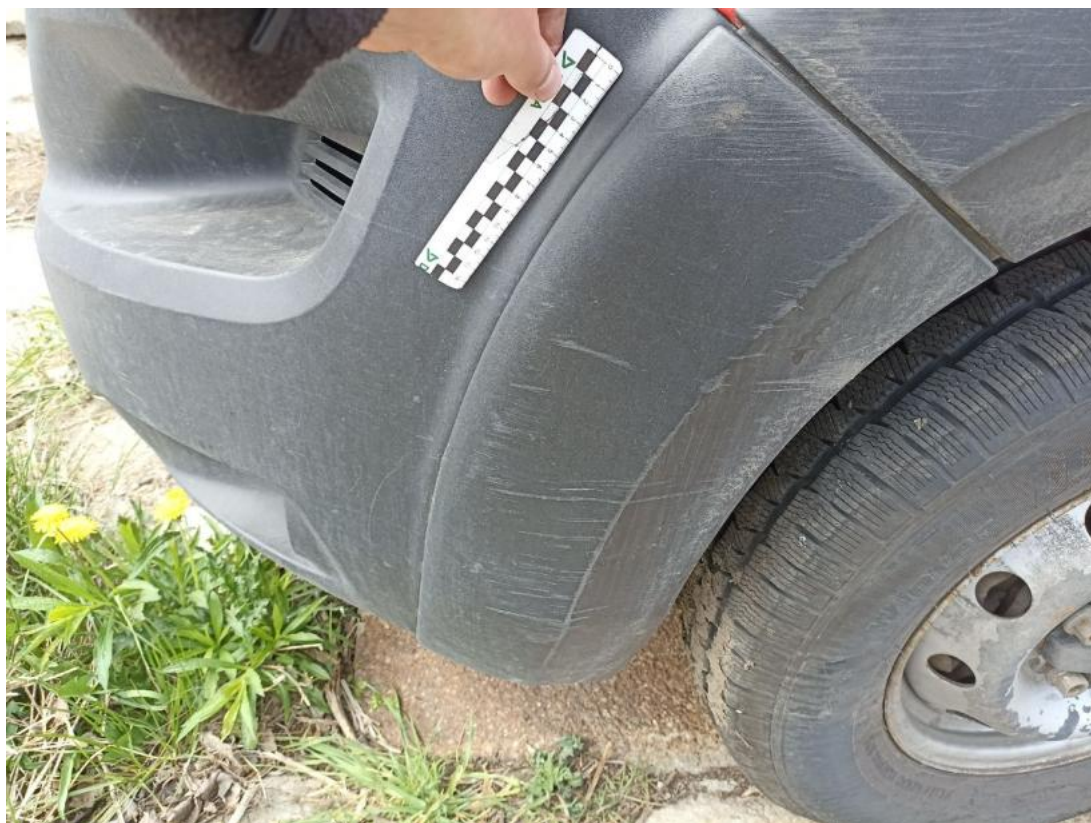
Fot. 37 Zderzak przedni cz L - Rysa/odprysk 1