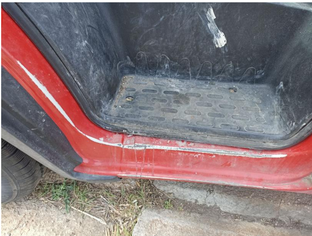
Fot. 55 Próg L - Rysa/odprysk 1