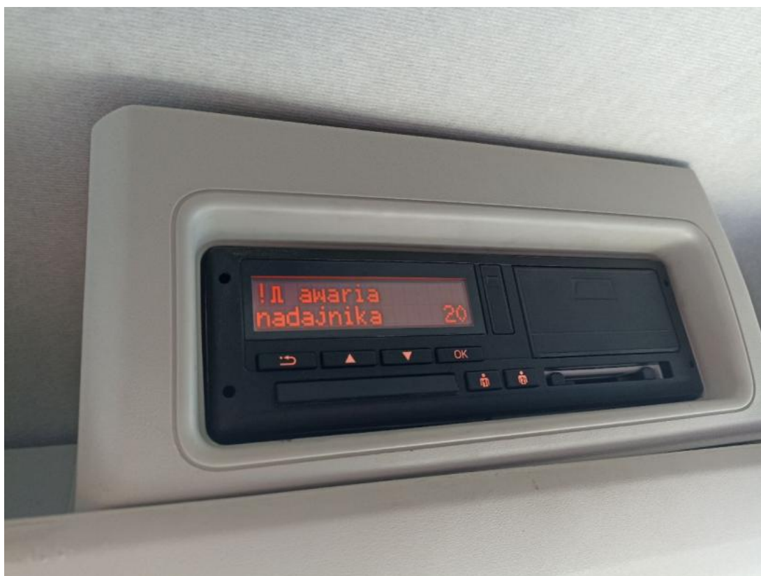
Fot. 30 Zdjęcie do protokołu