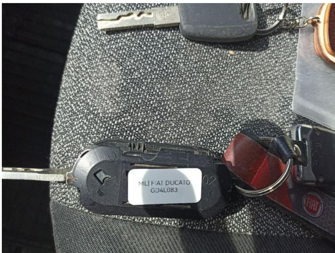
Fot. 29 Zdjęcie do protokołu