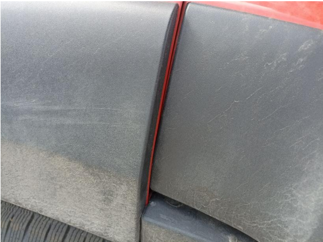
Fot. 57 Błotnik przedni L - Inne 1