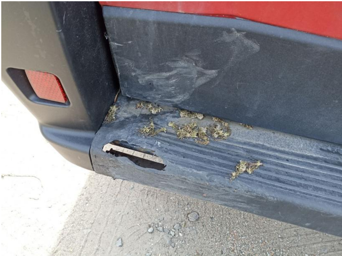
Fot. 47 Zderzak tylny - Pęknięcie/rozerwanie 1