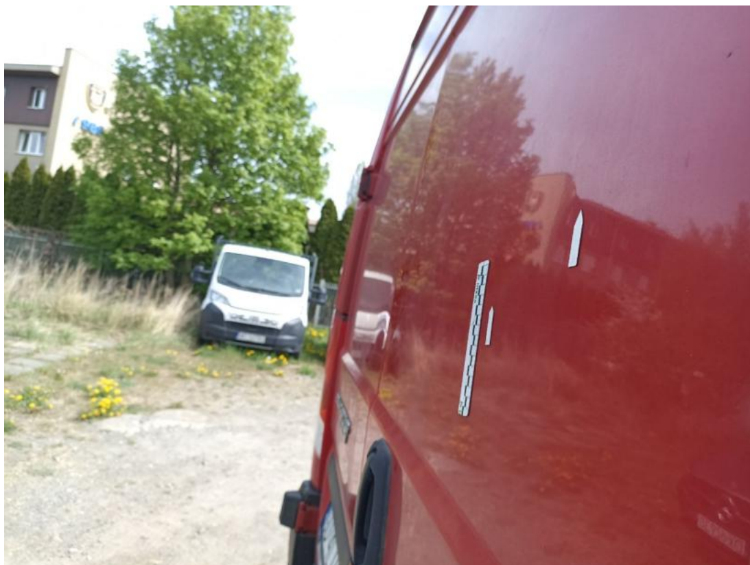
Fot. 77 Drzwi tyłu prawe - Wgniecenie/odkształcenie 2