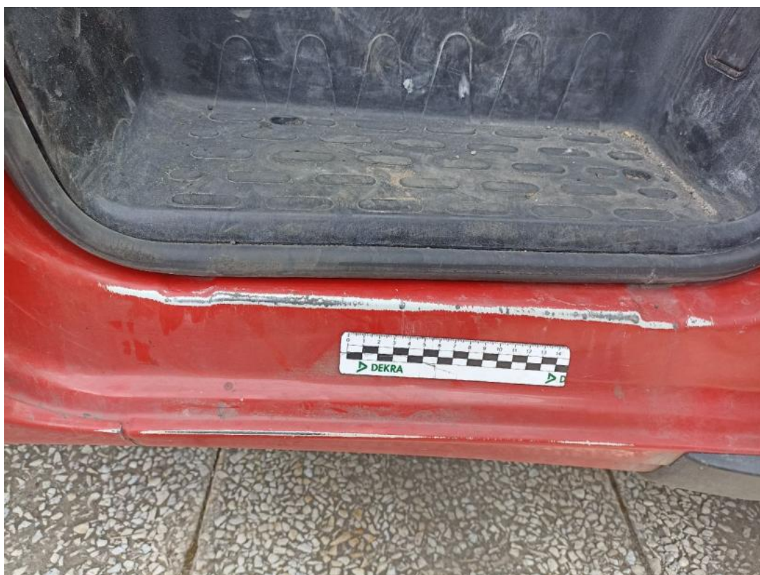
Fot. 42 Próg P - Rysa/odprysk 1