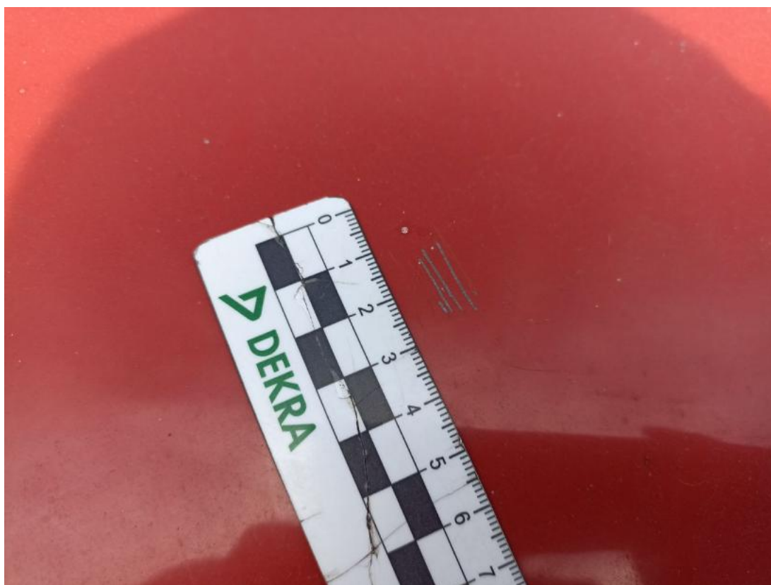
Fot. 34 Pokrywa komory silnika - Rysa/odprysk 2