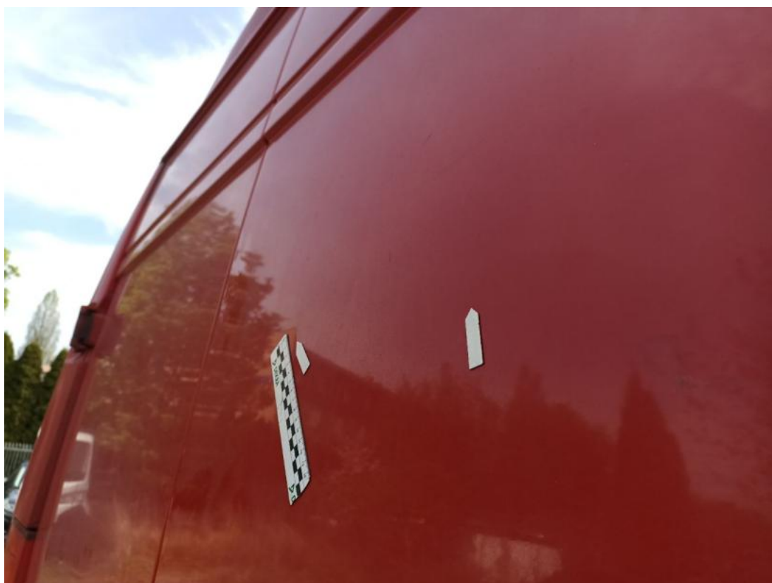
Fot. 78 Drzwi tyłu prawe() - Wgniecenie/odkształcenie 3