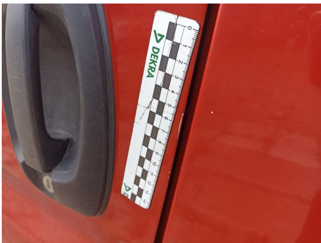
Fot. 52 Drzwi przed L - Rysa/odprysk 2