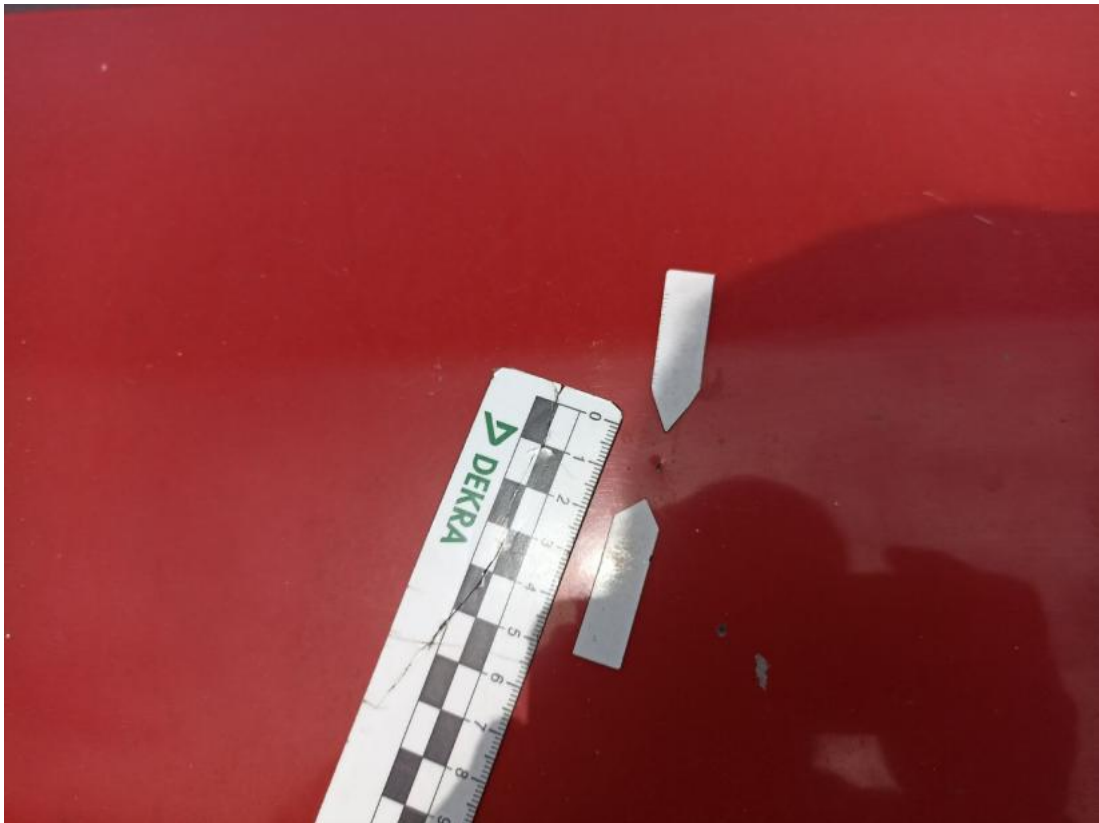
Fot. 35 Pokrywa komory silnika - Wgniecenie/odkształcenie 1