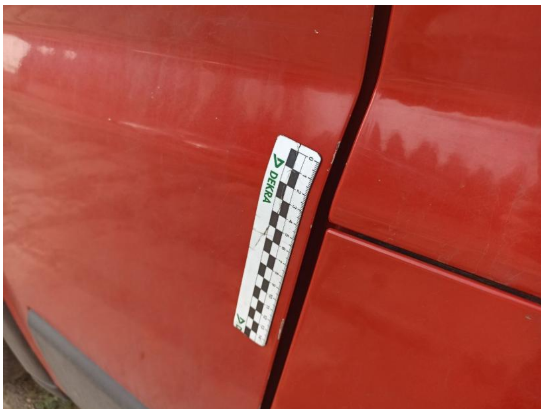
Fot. 51 Drzwi przed L - Rysa/odprysk 1