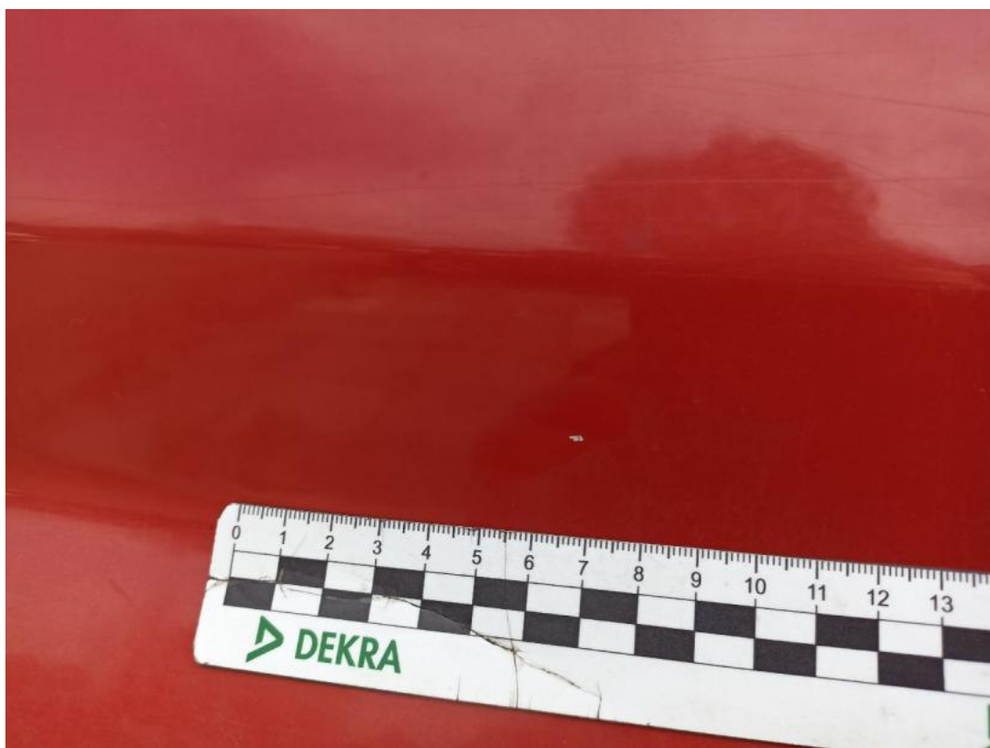
Fot. 38 Drzwi przednie P - Rysa/odprysk 1