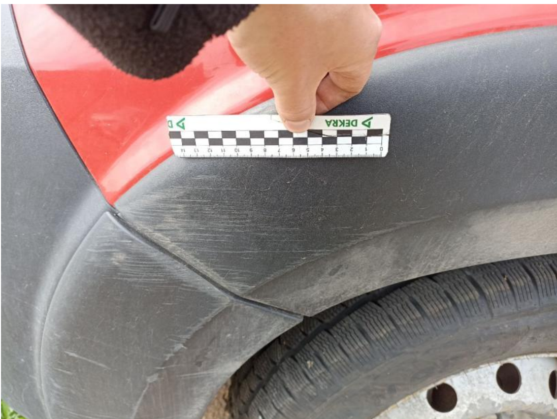
Fot. 58 Listwa krawędzi błotnika prz L - Rysa/odprysk 1