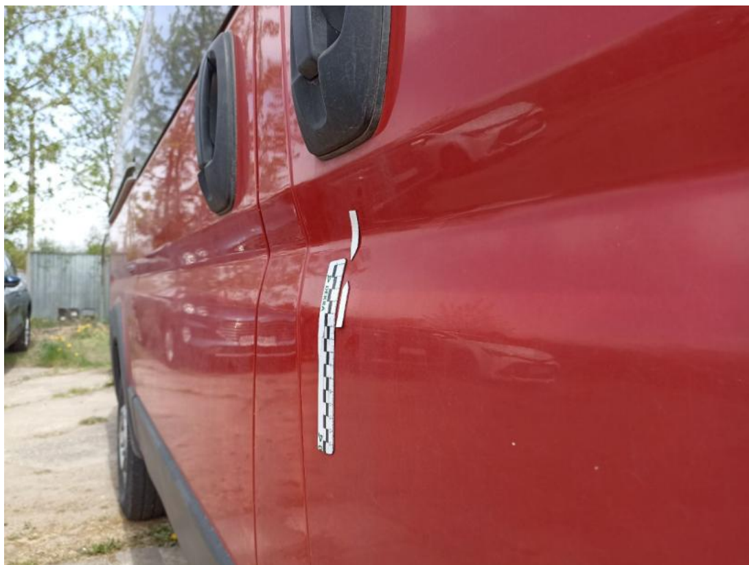
Fot. 41 Drzwi przednie P - Wgniecenie/odkształcenie 2