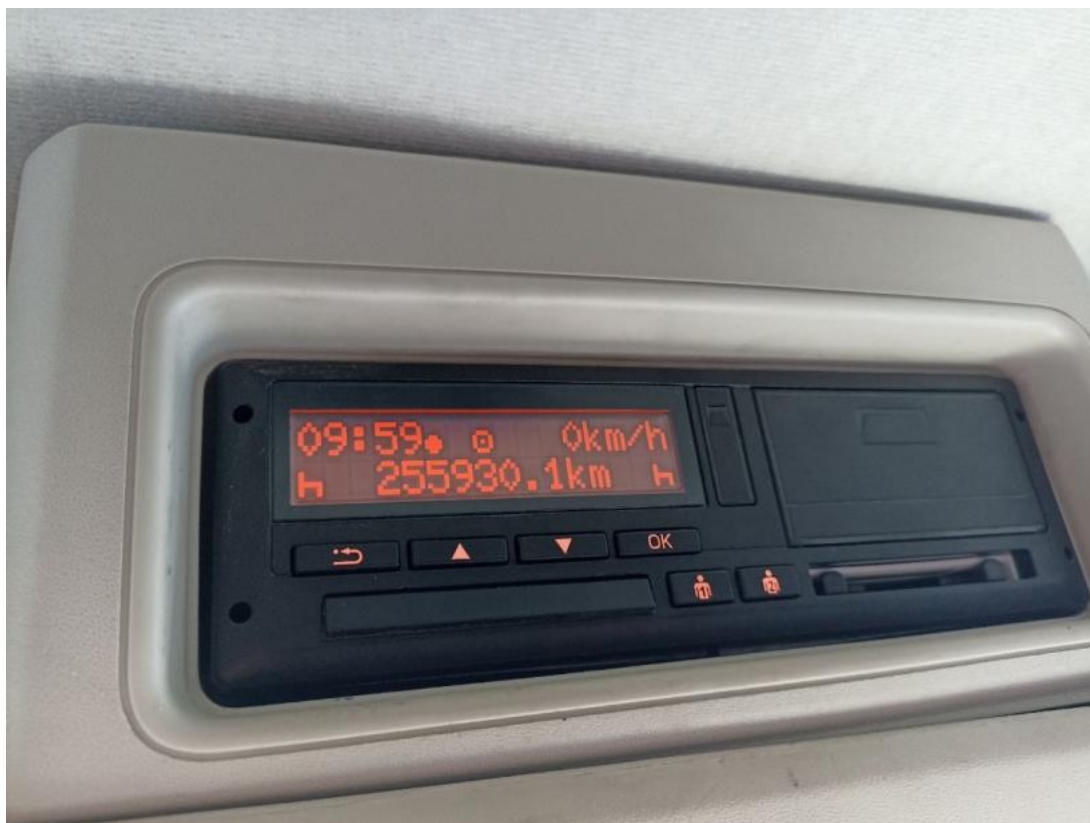
Fot. 31 Zdjęcie do protokołu