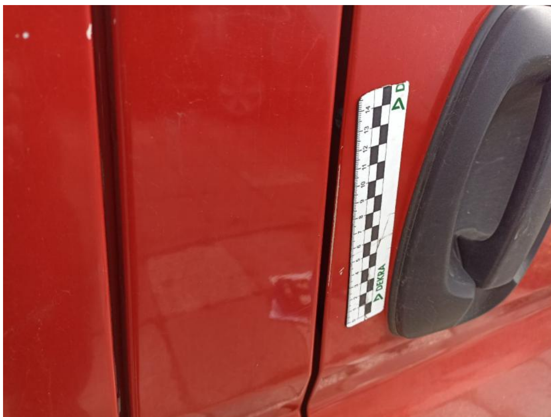
Fot. 39 Drzwi przednie P - Rysa/odprysk 2