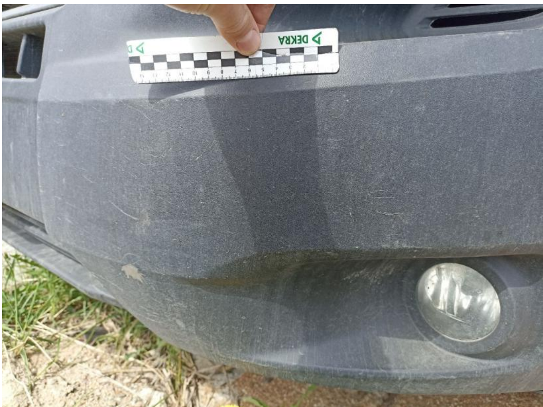
Fot. 36 Zderzak - Rysa/odprysk 1