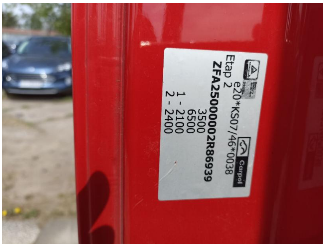
Fot. 32 Zdjęcie do protokołu