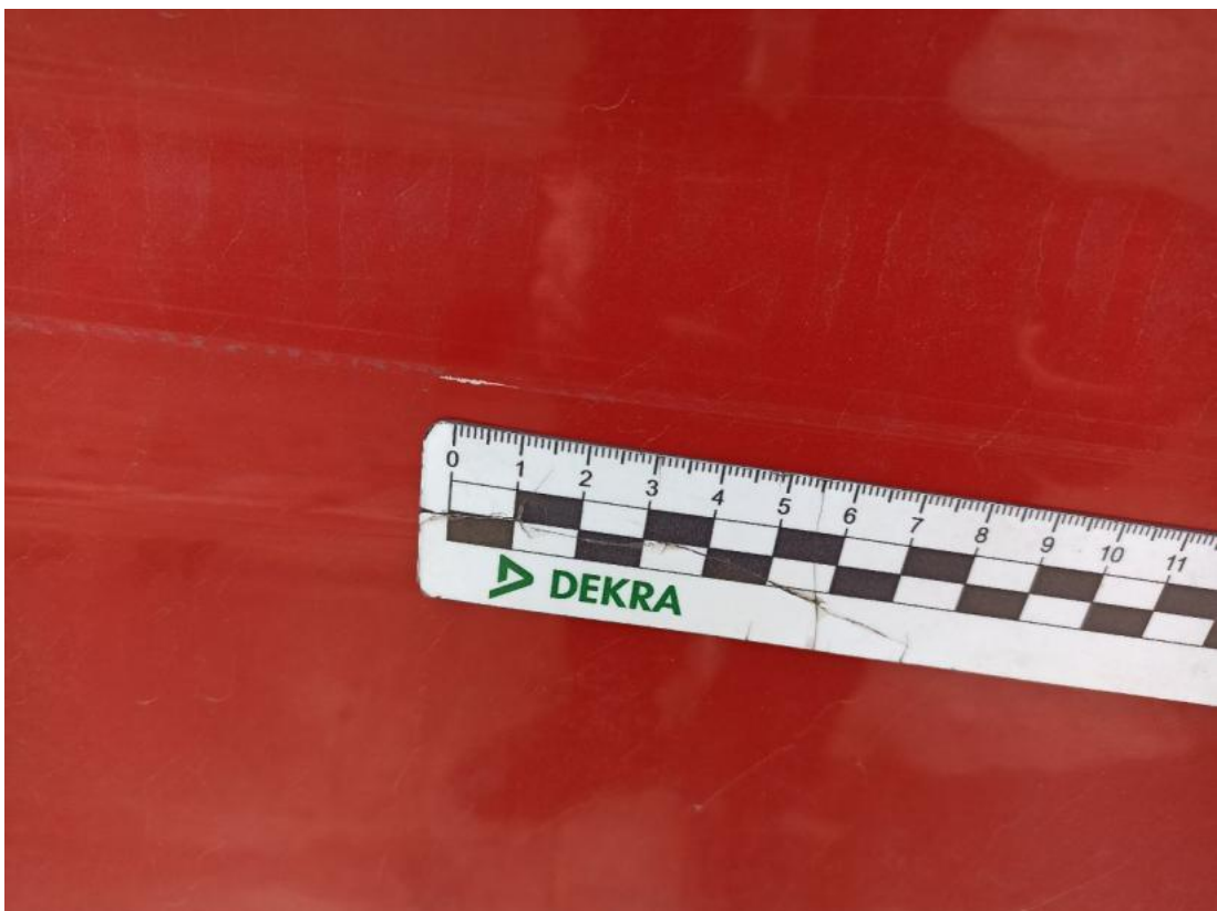
Fot. 48 Błotnik tylny L / Ściana boczna L - Rysa/odprysk 1