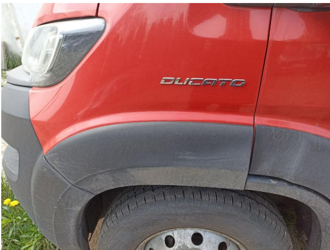
Fot. 56 Błotnik przedni L - zdjęcie poglądowe 1