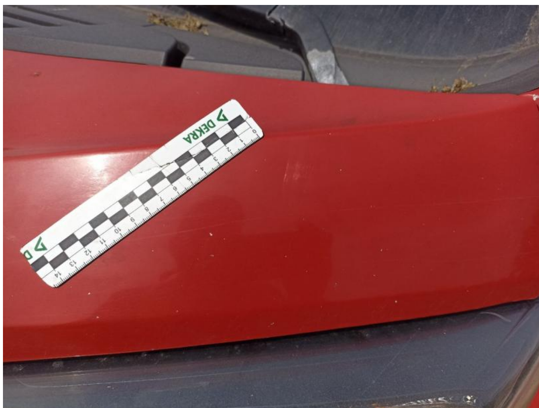
Fot. 33 Pokrywa komory silnika - Rysa/odprysk 1