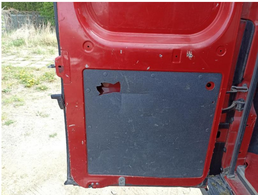
Fot. 71 Drzwi tyłu lewe - Rysa/odprysk 1