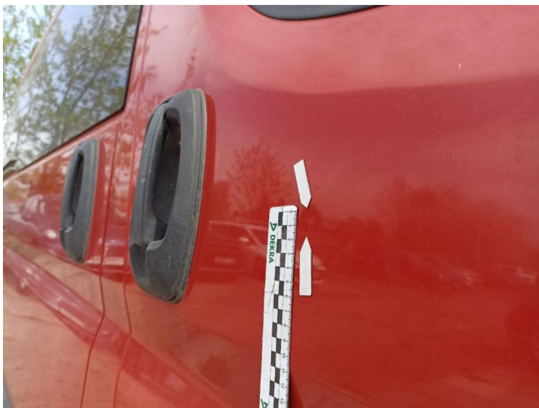
Fot. 40 Drzwi przednie P - Wgniecenie/odkształcenie 1