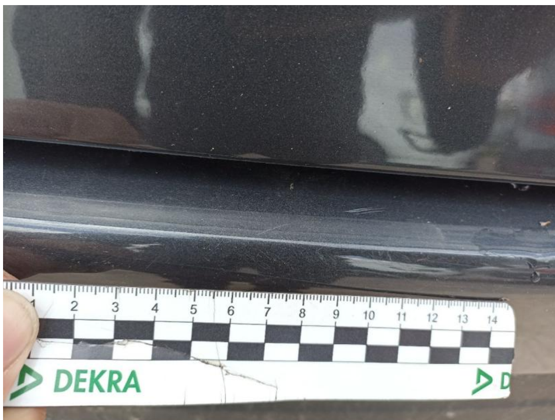
Fot. 50 Zderzak tylny - Rysa/odprysk 1