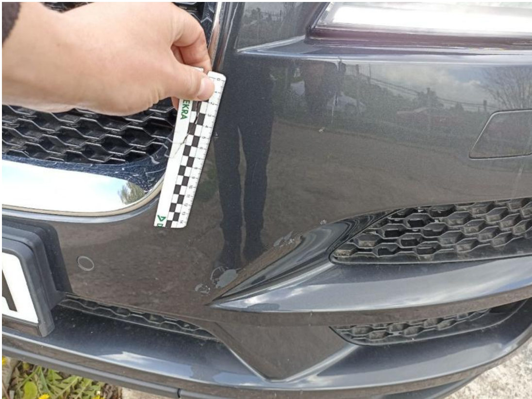
Fot. 39 Zderzak - Rysa/odprysk 1