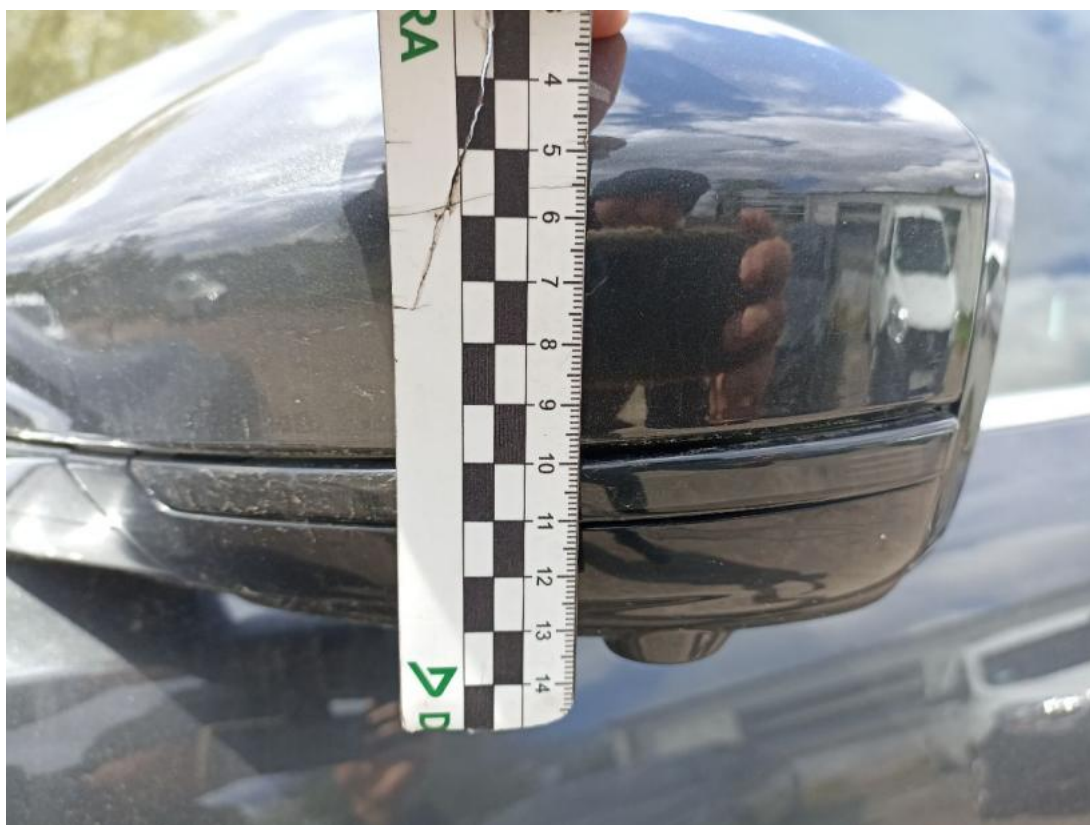
Fot. 55 Obudowa lusterka zew L - Rysa/odprysk 1