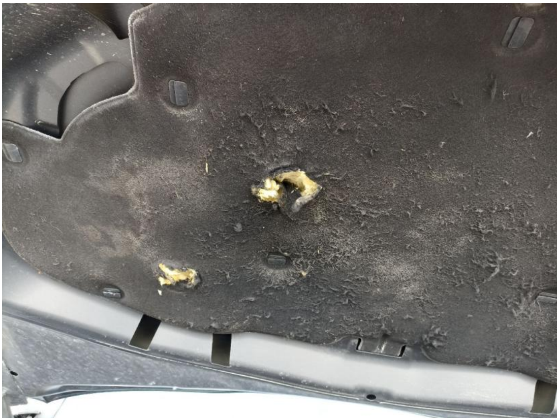
Fot. 38 Wykładzina pokrywy komory silnika - Pęknięcie/rozerwanie 1