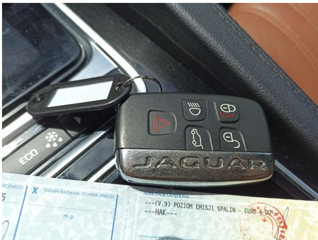
Fot. 36 Kluczyki