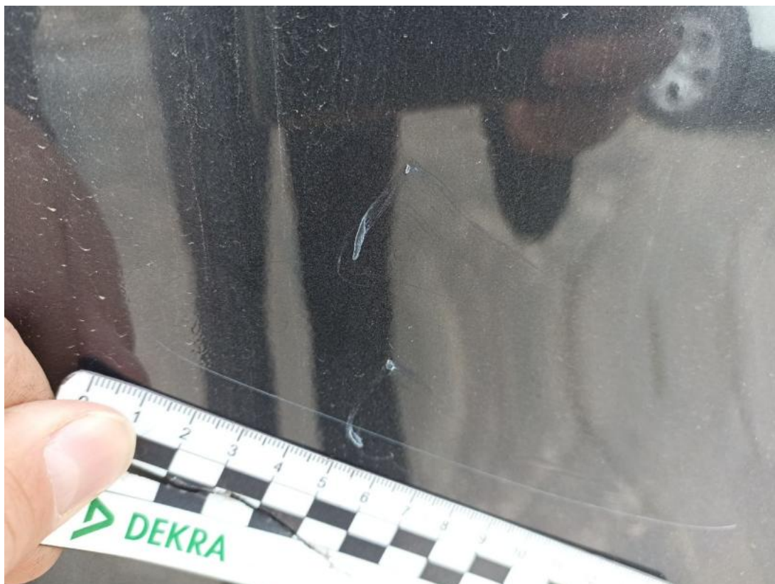
Fot. 49 Pokrywy bagażnika - Rysa/odprysk 1