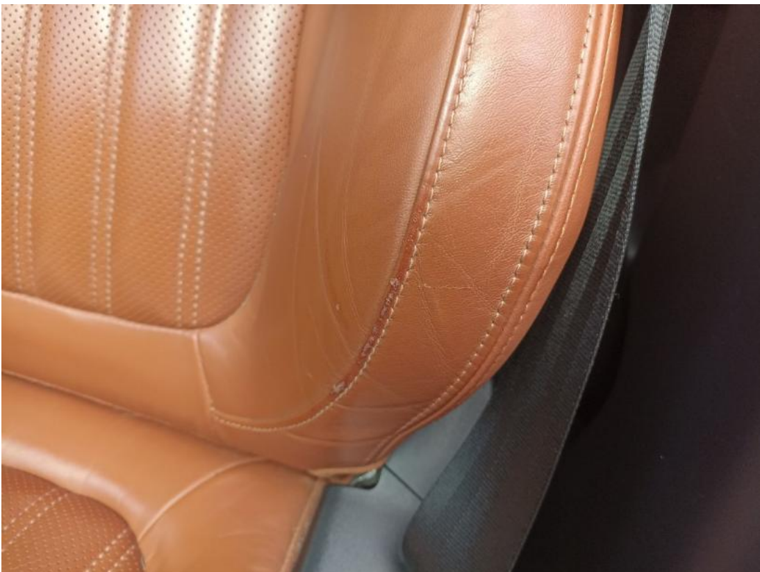
Fot. 58 Fotel prz. lew. - Rysa/odprysk 2