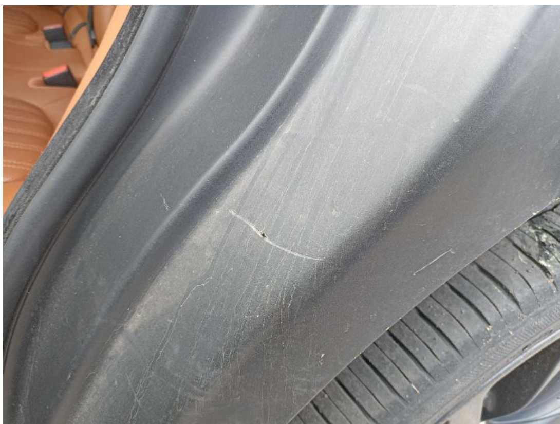
Fot. 52 Listwa krawędzi błotnika tyl L - Rysa/odprysk 1