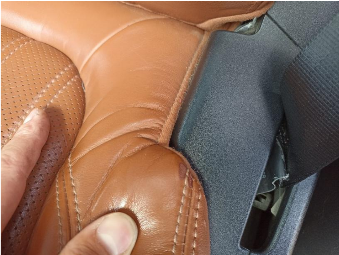
Fot. 57 Fotel prz. lew. - Rysa/odprysk 1