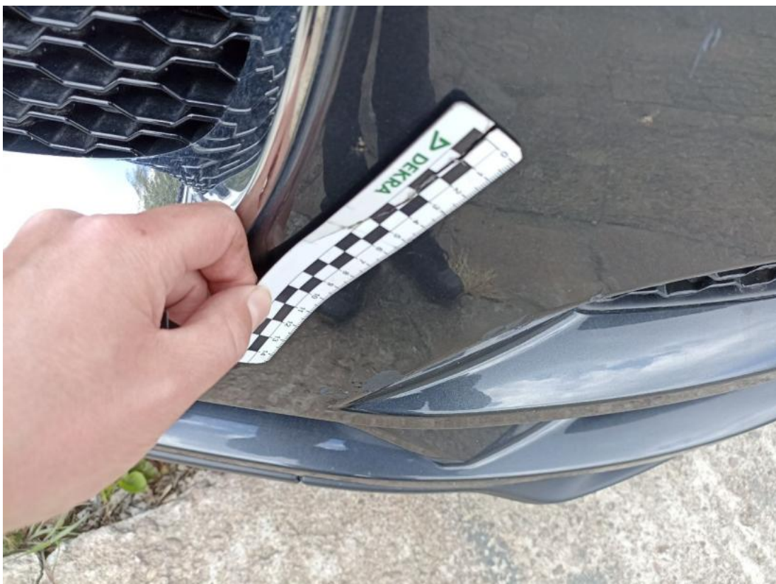
Fot. 40 Zderzak - Wgniecenie/odkształcenie 1