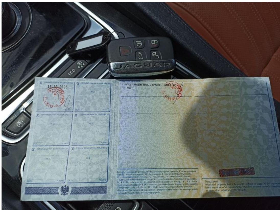
Fot. 34 Dowód rej. str. 2