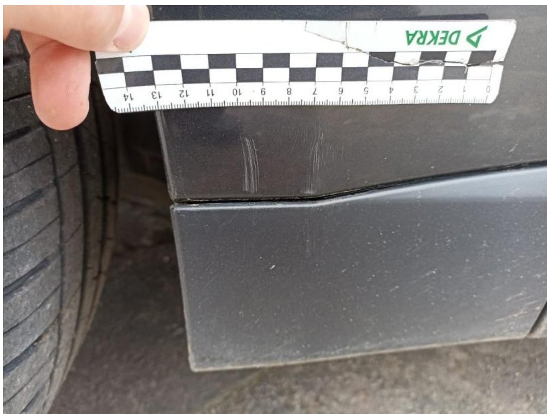
Fot. 56 Błotnik przedni L - Rysa/odprysk 1