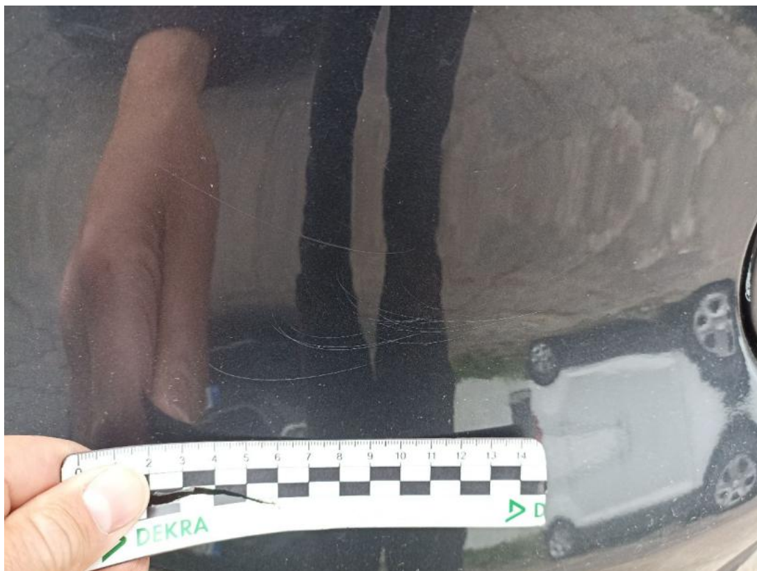
Fot. 51 Zderzak tylny - Rysa/odprysk 2