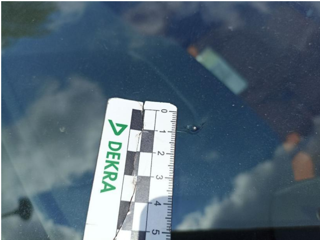
Fot. 37 Szyba czołowa - Pęknięcie/rozerwanie 1