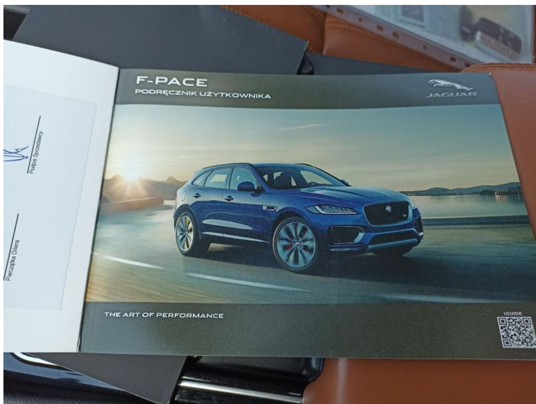
Fot. 35 Instrukcje