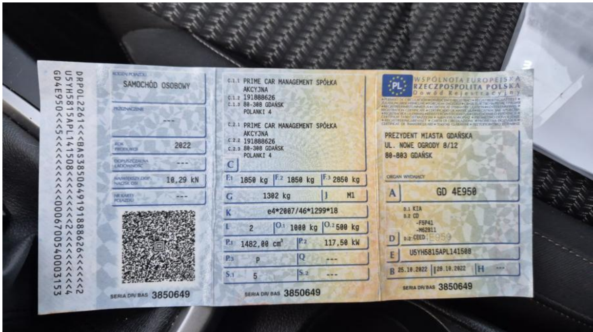
Fot. 28 Dowód rej. Str. 1