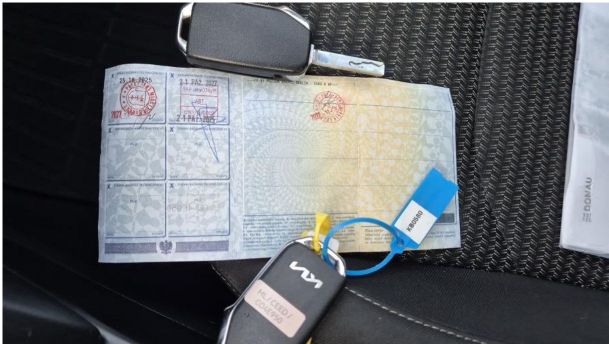
Fot. 29 Dow. Rej. Str.2 i klucze