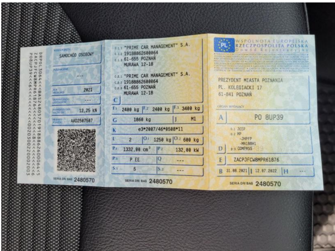
Fot. 28 Dowód rej. Str. 1