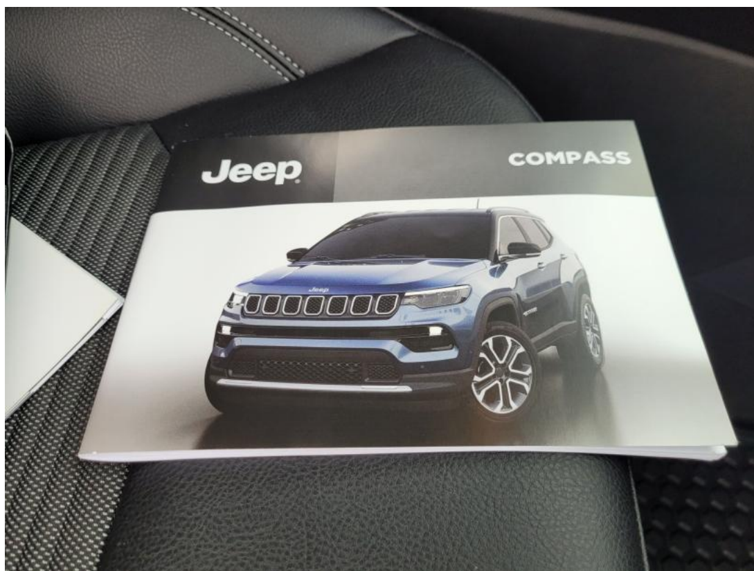
Fot. 32 Instrukcje