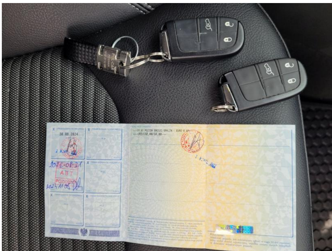
Fot. 29 Dow. Rej. Str.2 i klucze