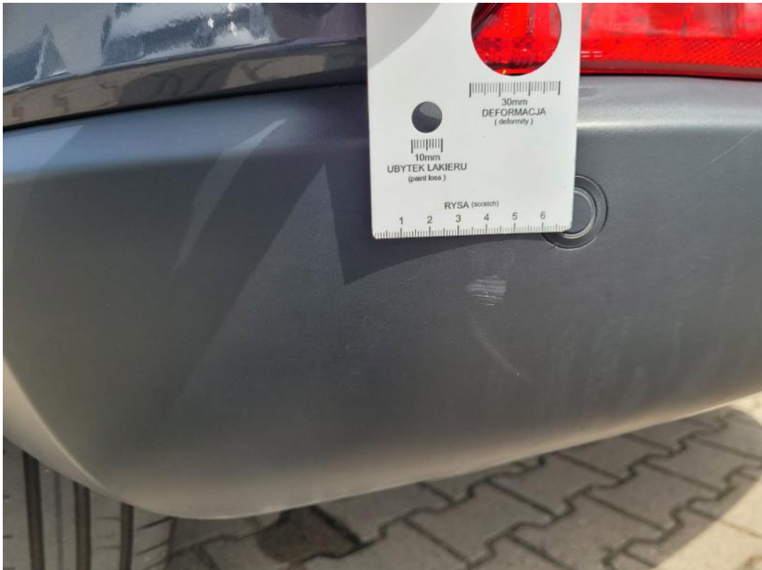
Fot. 39 Zderzak tylny() - Rysa/odprysk 3