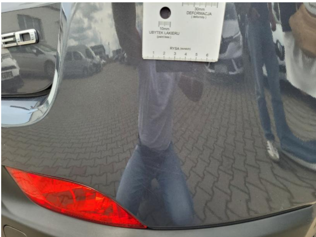
Fot. 36 Zderzak tylny - zdjęcie poglądowe 2