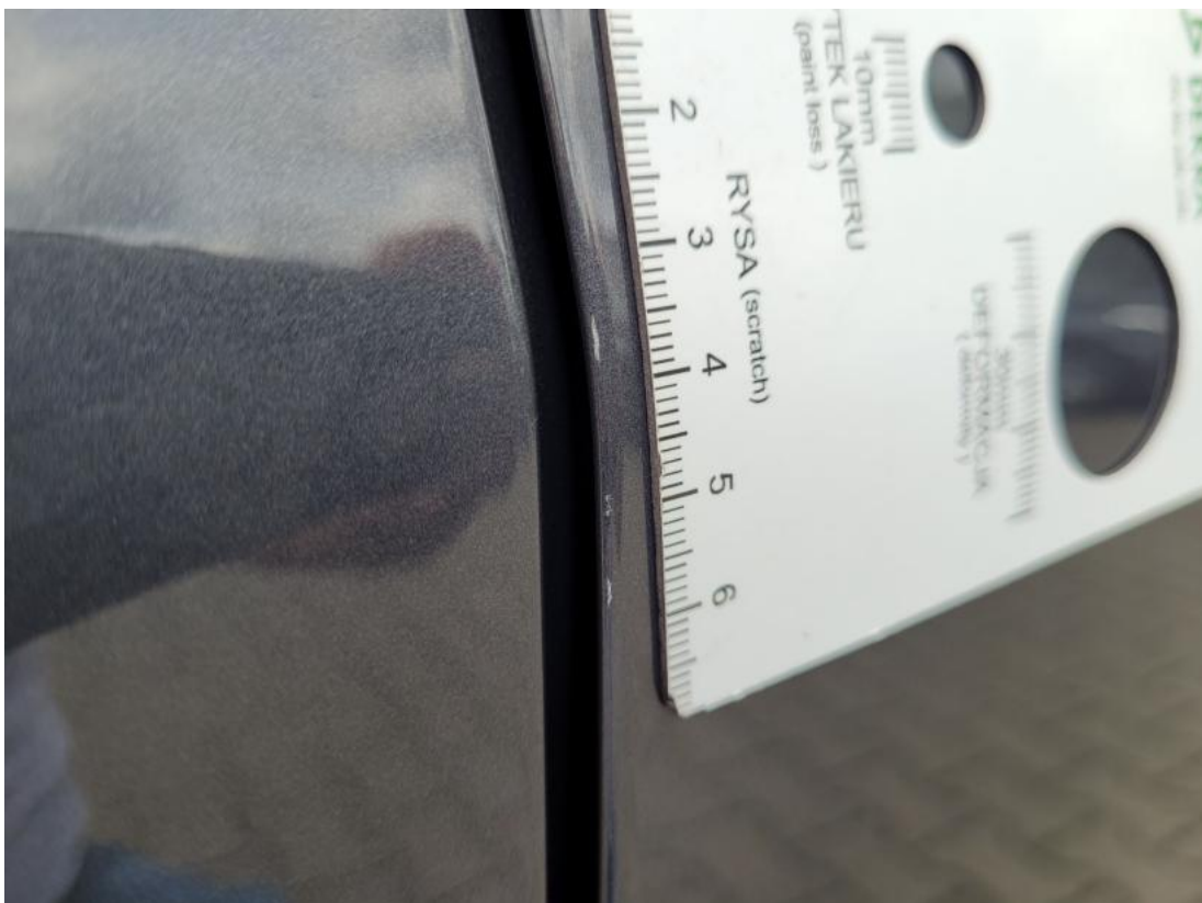
Fot. 34 Drzwi przednie P - Rysa/odprysk 1