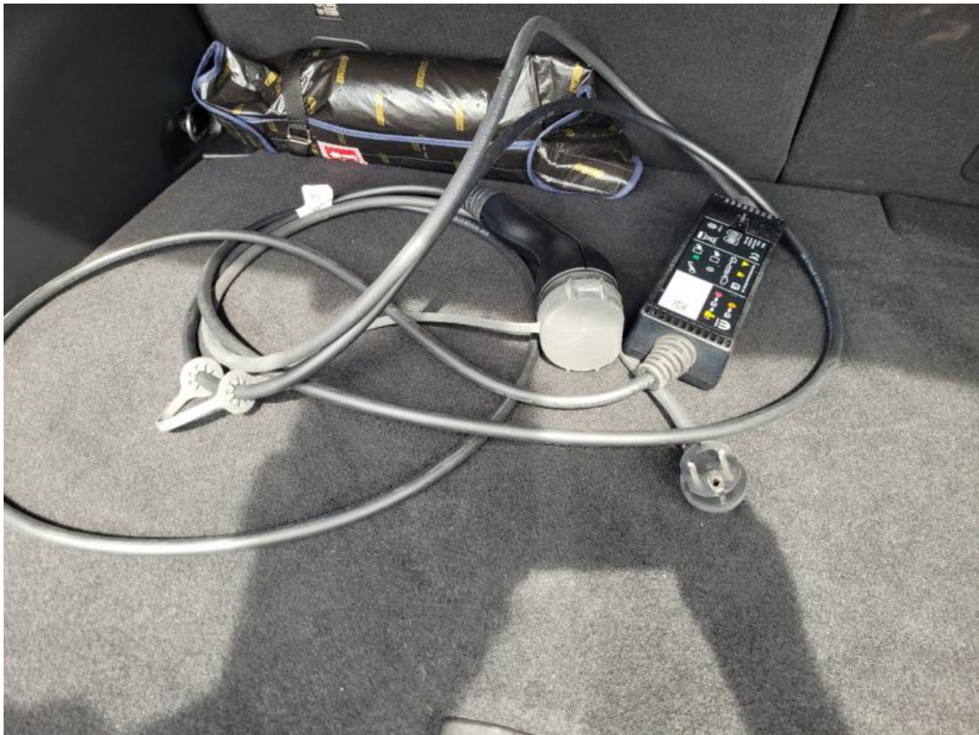
Fot. 33 Zdjęcie do protokołu