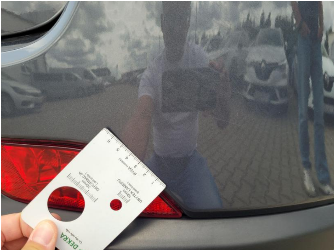
Fot. 37 Zderzak tylny - Rysa/odprysk 1