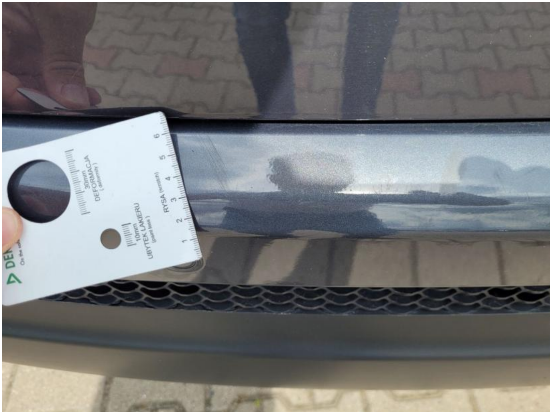
Fot. 35 Zderzak tylny - zdjęcie poglądowe 1