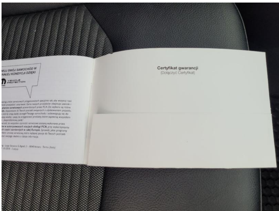
Fot. 30 Książka serwisowa – dane