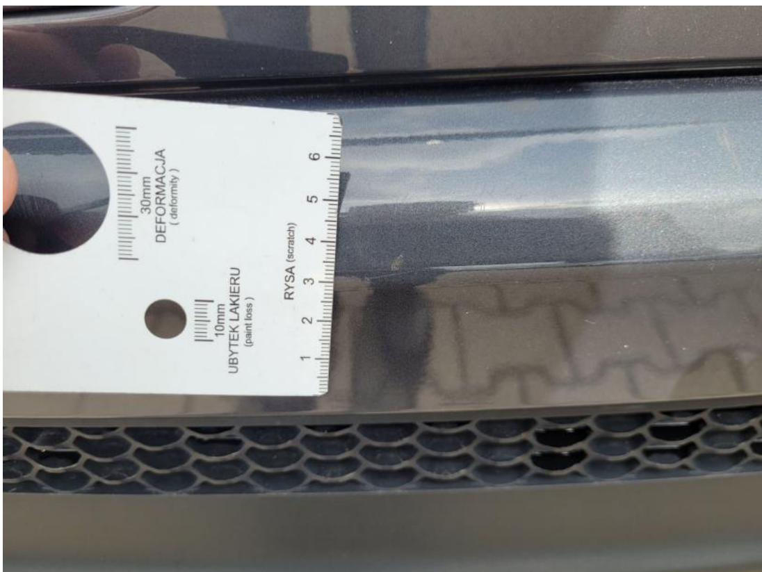
Fot. 38 Zderzak tylny - Rysa/odprysk 2