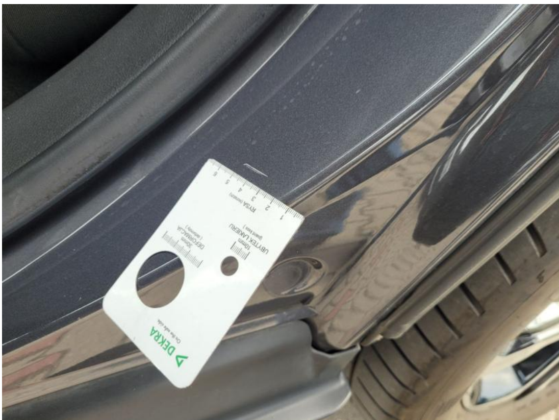
Fot. 40 Błotnik tylny L / Ściana boczna L - zdjęcie pogładowe 2