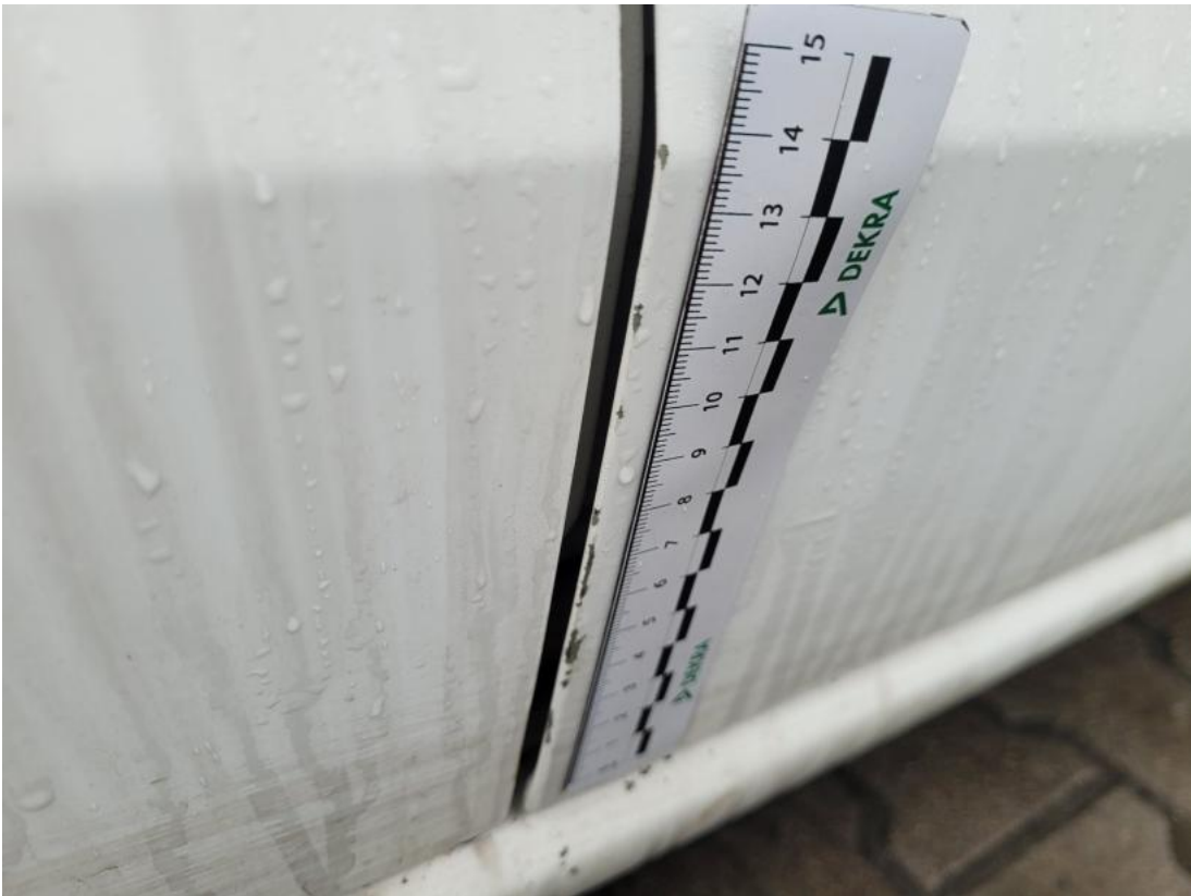
Fot. 37 Drzwi przednie P - Rysa/odprysk 1