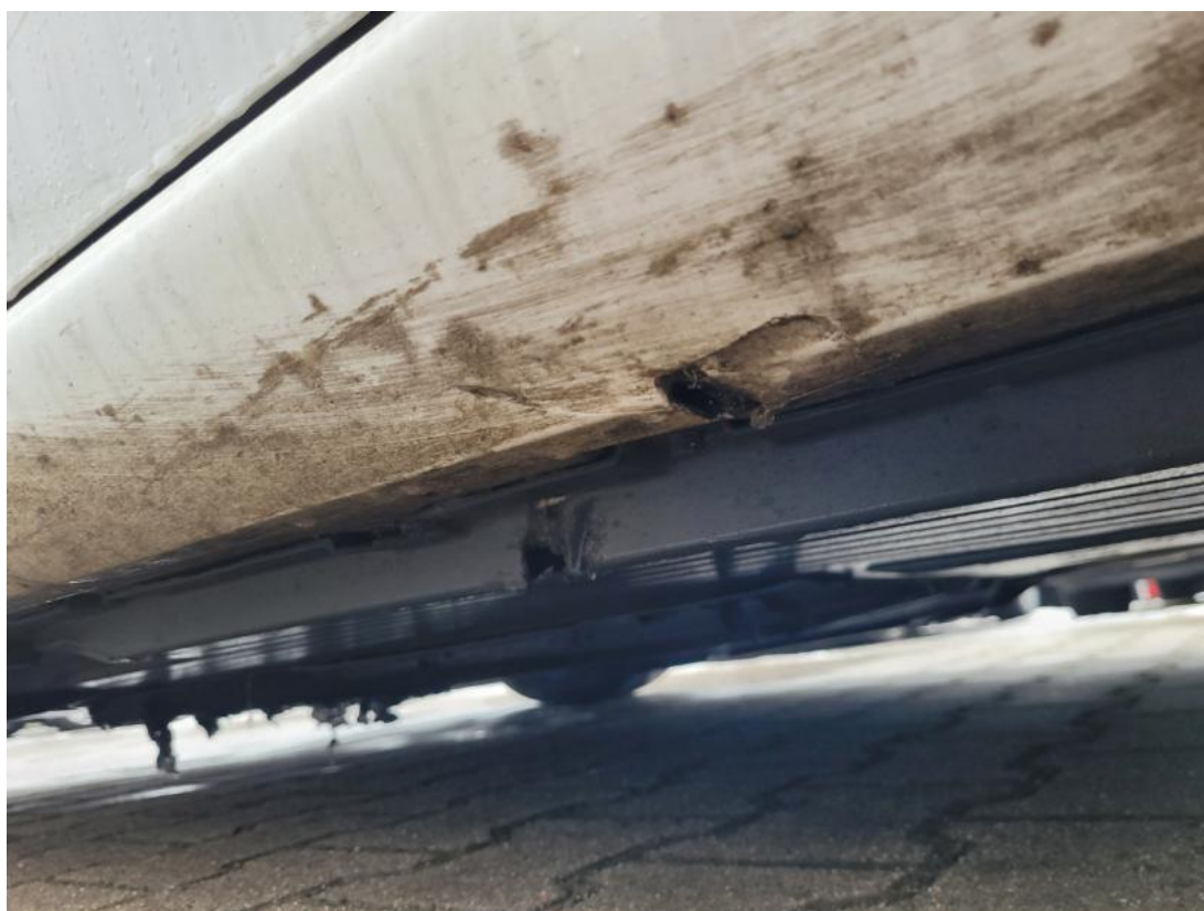
Fot. 52 Próg L - Inne 1