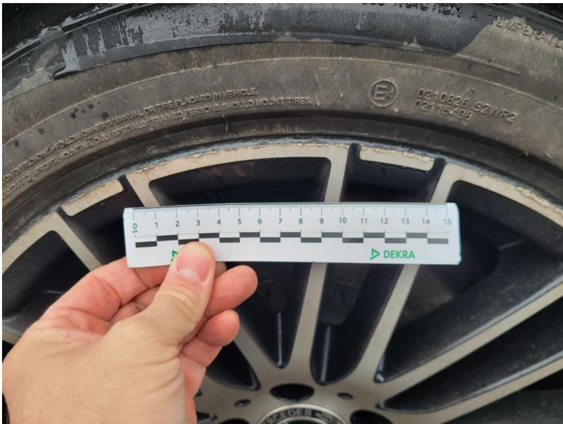
Fot. 41 Felga aluminiowa tylna P - zdjęcie poglądowe 2