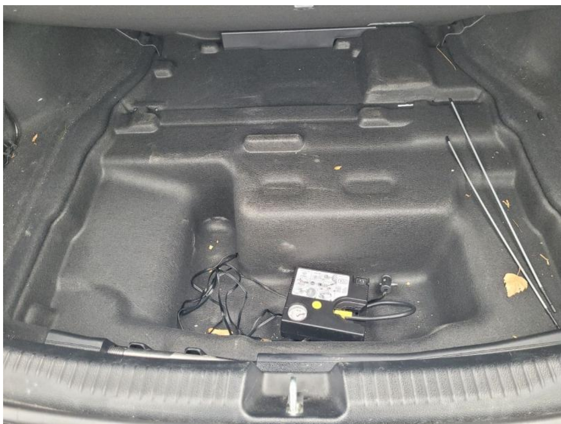
Fot. 26 Koło zapasowe