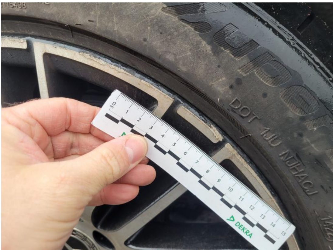
Fot. 42 Felga aluminiowa tylna P - Rysa/odprysk 1