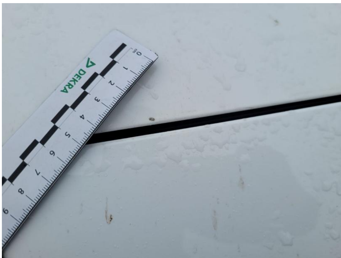
Fot. 32 Pokrywa komory silnika - zdjęcie poglądowe 2