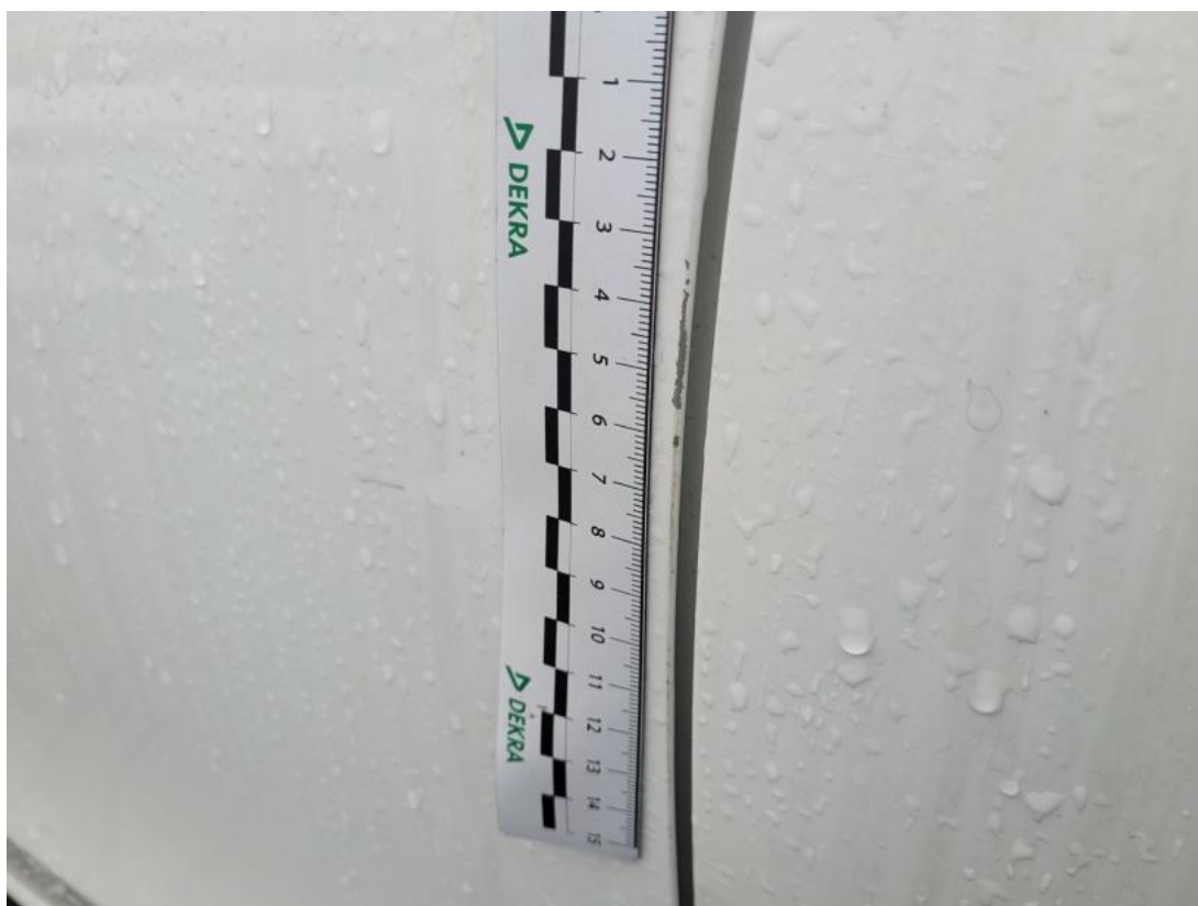
Fot. 49 Drzwi przed L - Rysa/odprysk 1