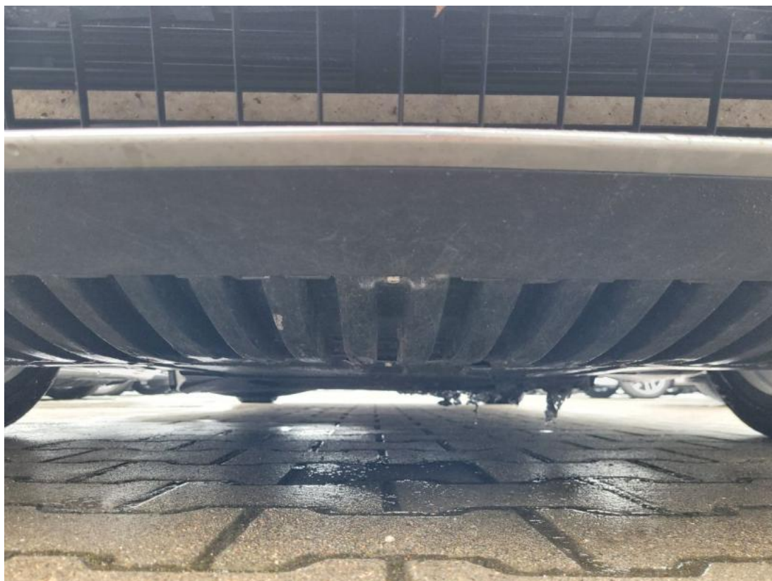
Fot. 27 Spód pojazdu przód