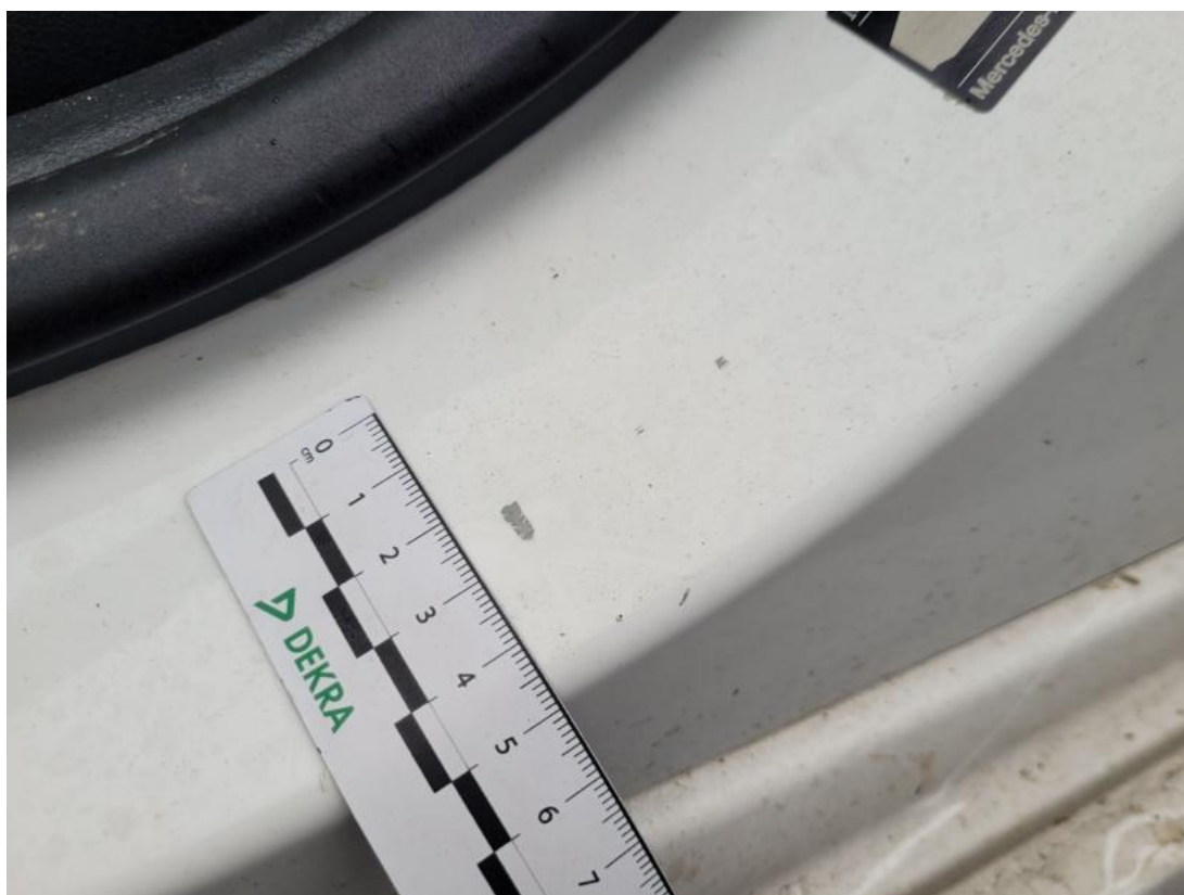
Fot. 51 Próg L - Rysa/odprysk 1