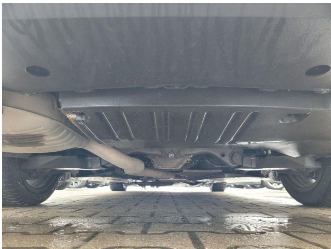
Fot. 28 Spód pojazdu tył