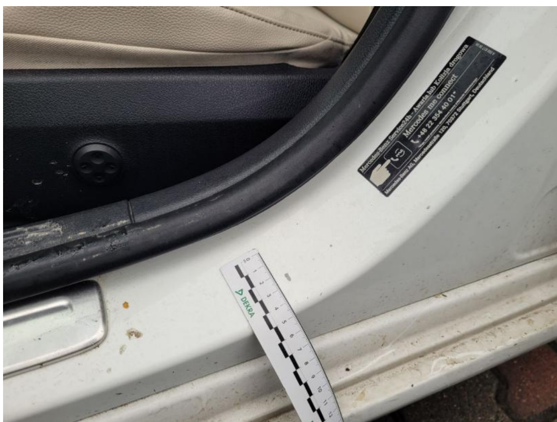
Fot. 50 Próg L - zdjęcie poglądowe 2