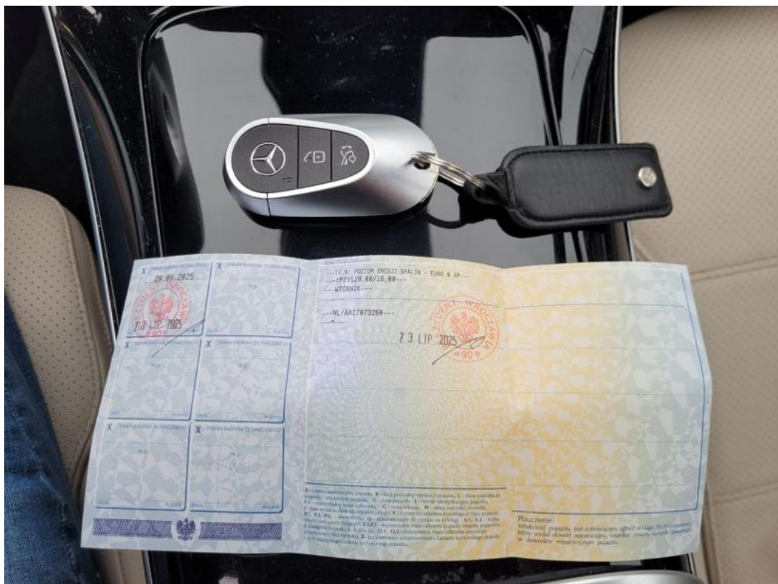
Fot. 30 Dow. Rej. Str.2 i klucze