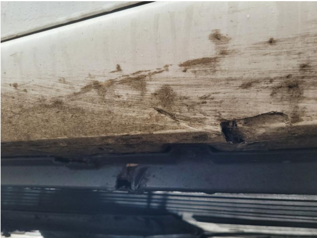
Fot. 53 Próg L - Inne 2