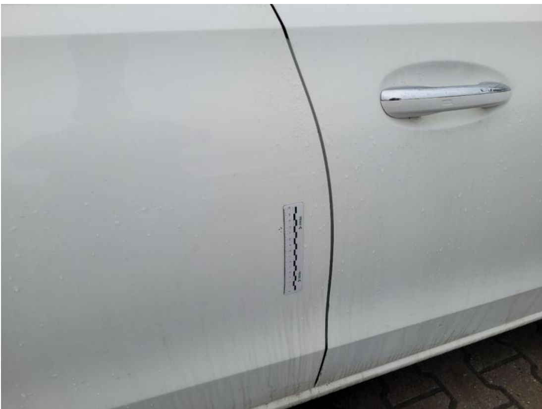
Fot. 38 Drzwi tylne P - zdjęcie poglądowe 2