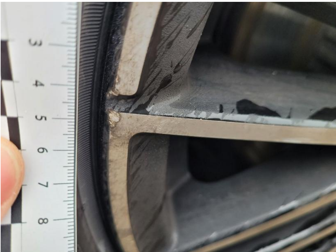
Fot. 54 Felga Aluminiowa przednia L - zdjęcie pogładowe 2