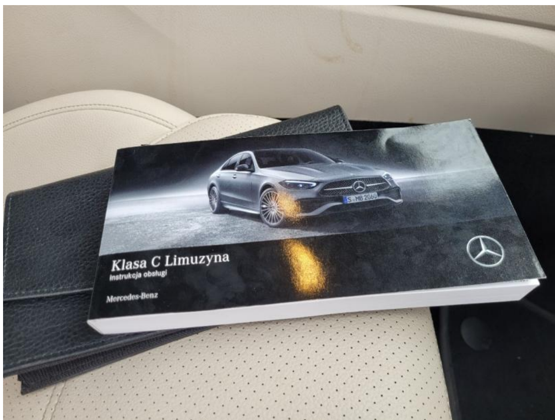
Fot. 31 Instrukcje