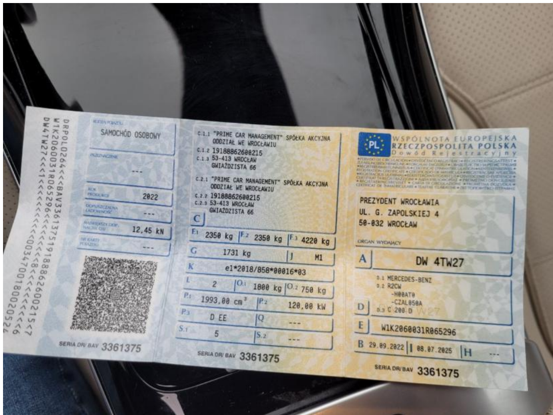
Fot. 29 Dowód rej. Str. 1