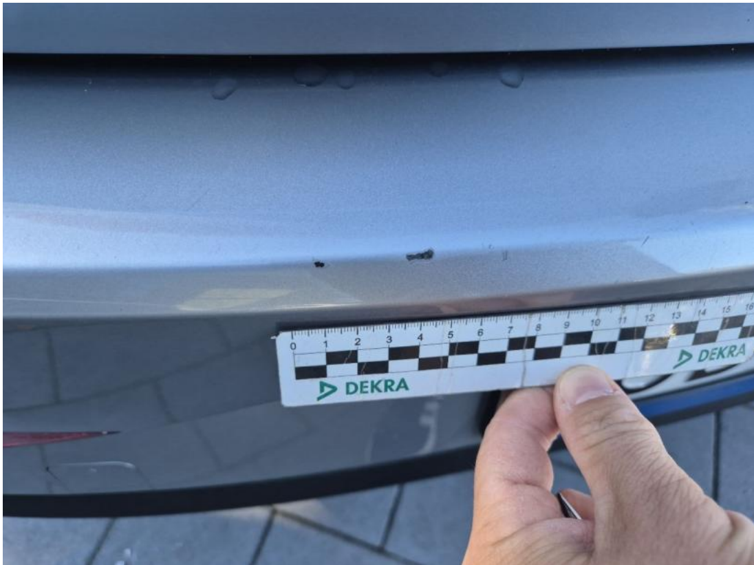
Fot. 37 Zderzak tylny - Rysa/odprysk 2