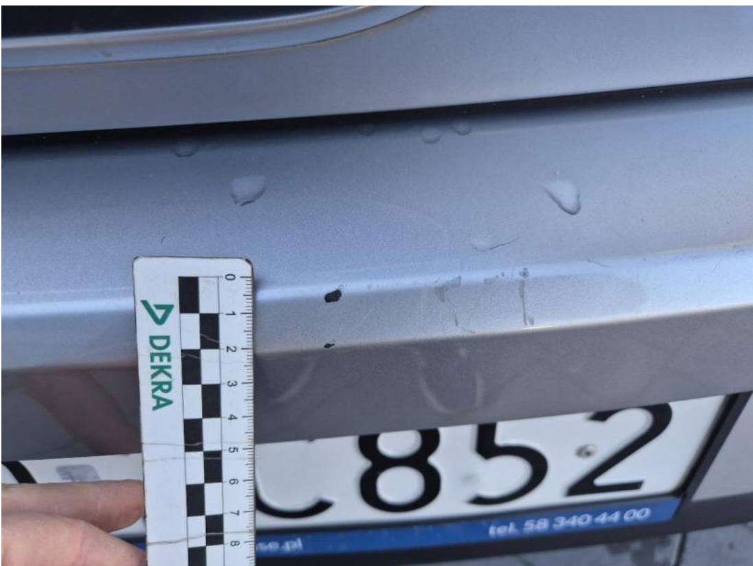
Fot. 36 Zderzak tylny - Rysa/odprysk 1