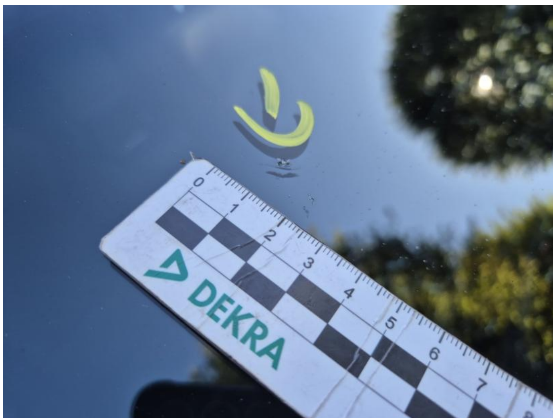
Fot. 32 Pokrywa komory silnika - Pęknięcie/rozerwanie 1