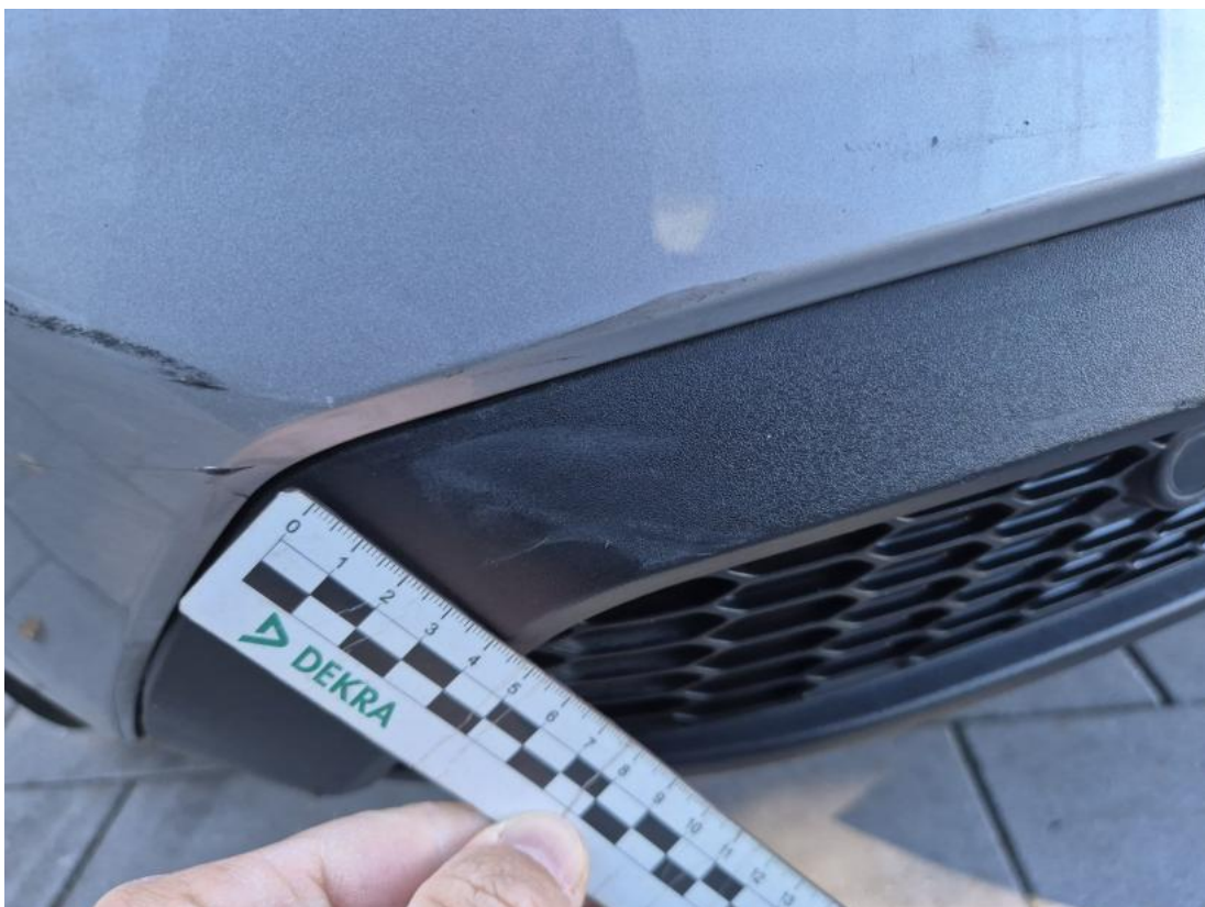
Fot. 40 Zderzak tylny cz dolna - Rysa/odprysk 1