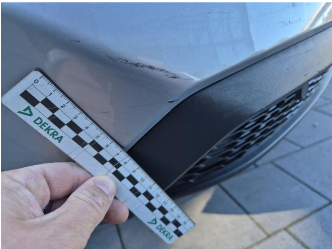
Fot. 38 Zderzak tylny() - Rysa/odprysk 3