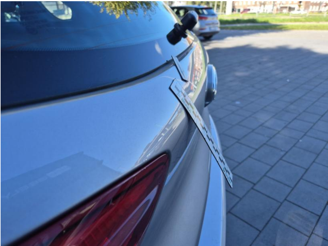
Fot. 35 Pokrywy bagażnika - Wgniecenie/odkształcenie 1