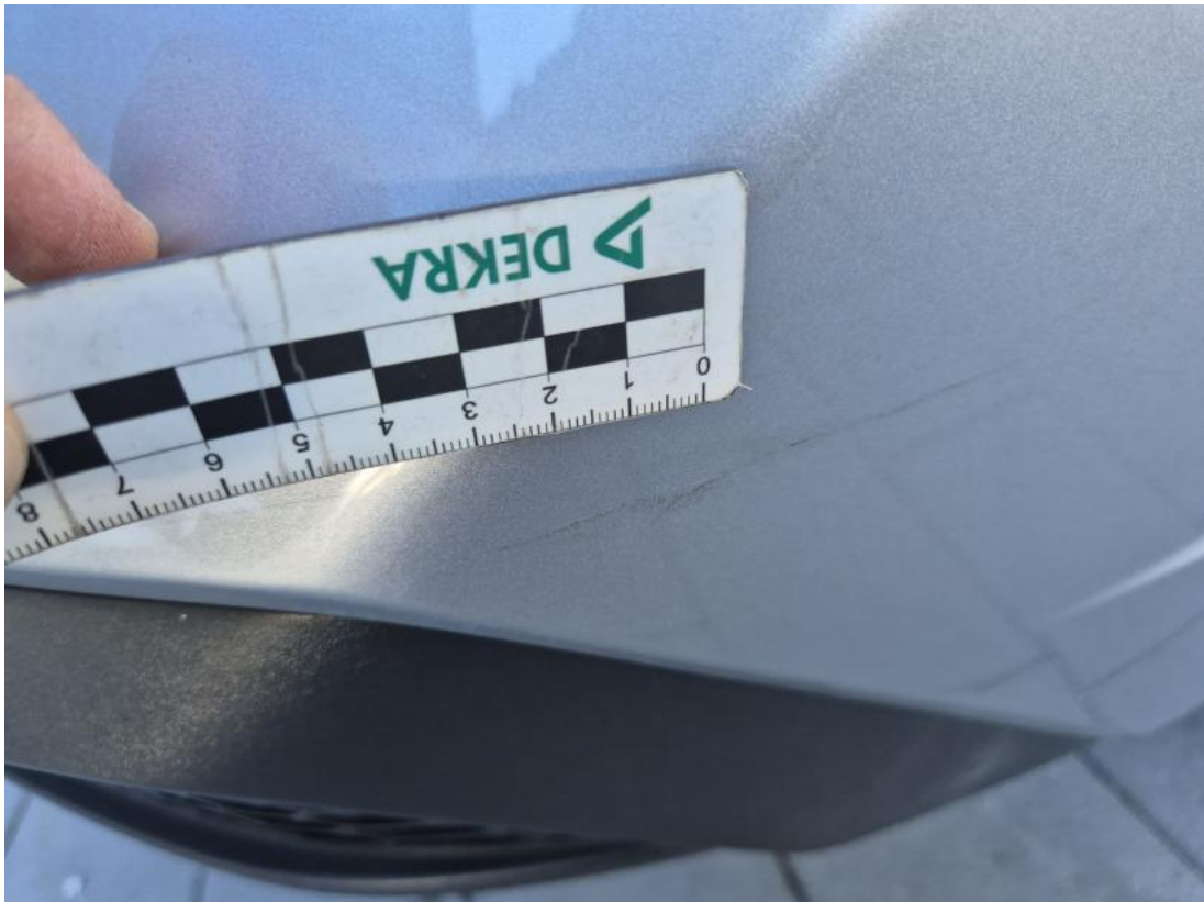
Fot. 39 Zderzak tylny - Wgniecenie/odkształcenie 1