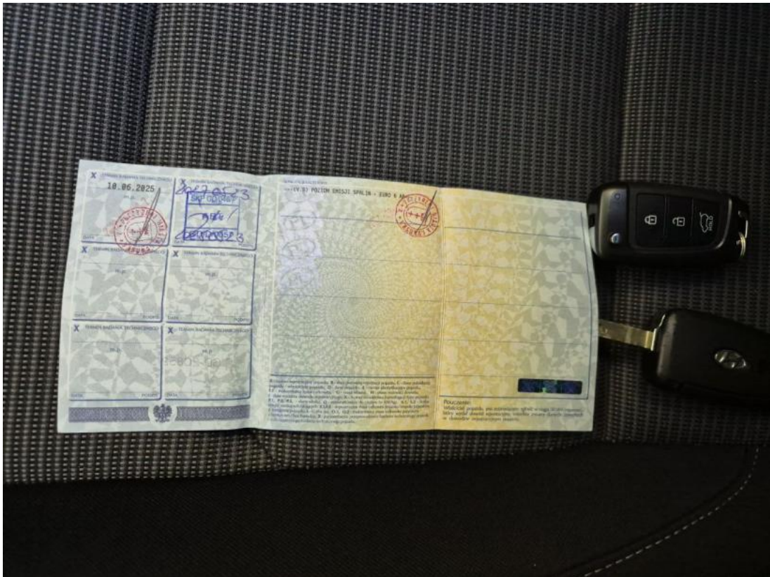
Fot. 29 Dow. Rej. Str.2 i klucze