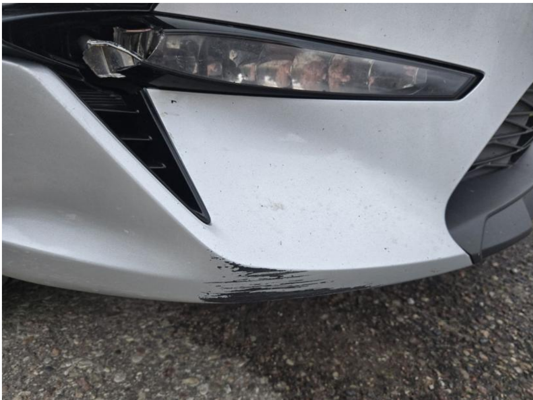
Fot. 38 Zderzak - zdjęcie poglądowe 1