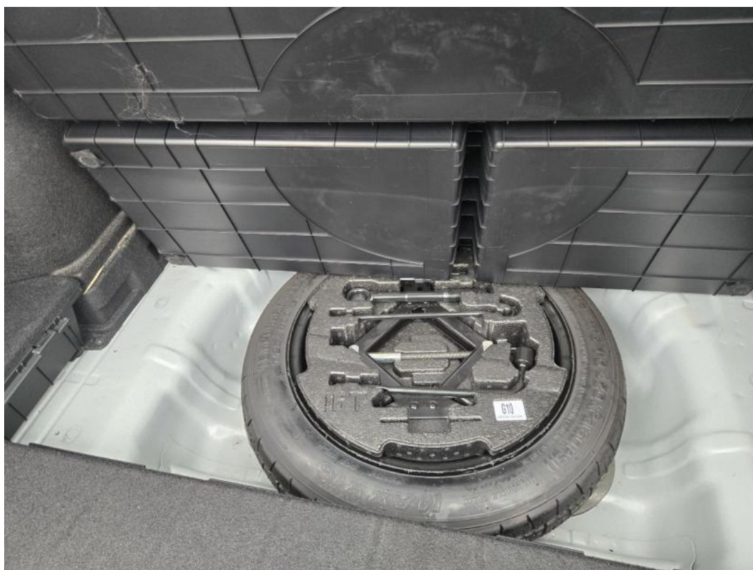
Fot. 26 Koło zapasowe