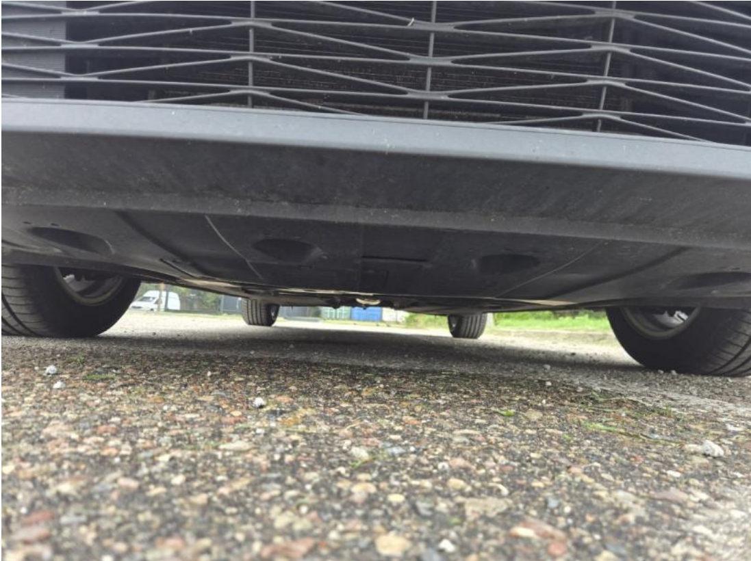
Fot. 27 Spód pojazdu przód