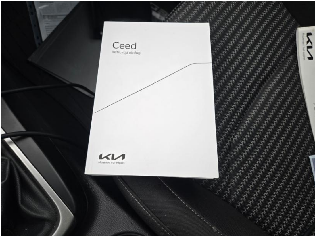
Fot. 37 Instrukcje