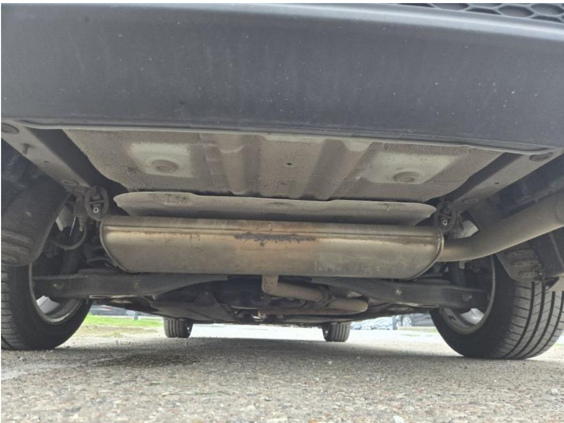
Fot. 28 Spód pojazdu tył