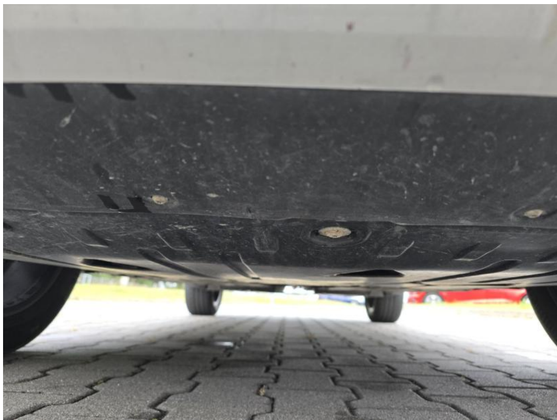
Fot. 27 Spód pojazdu przód