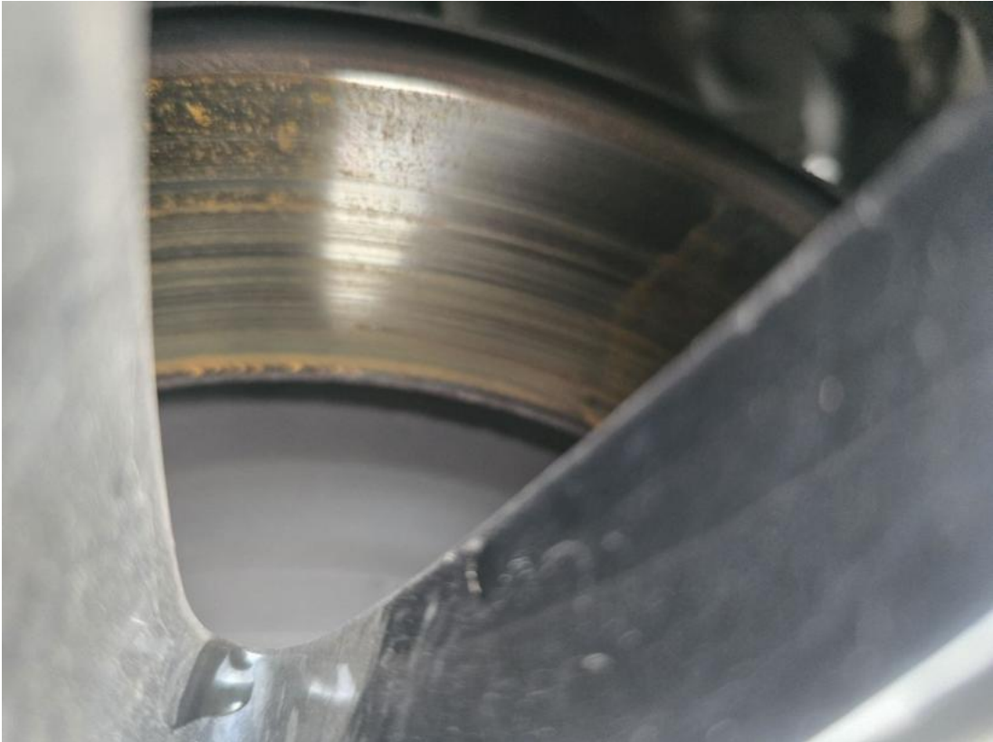
Fot. 31 Tarcza hamulcowa tylna prawa