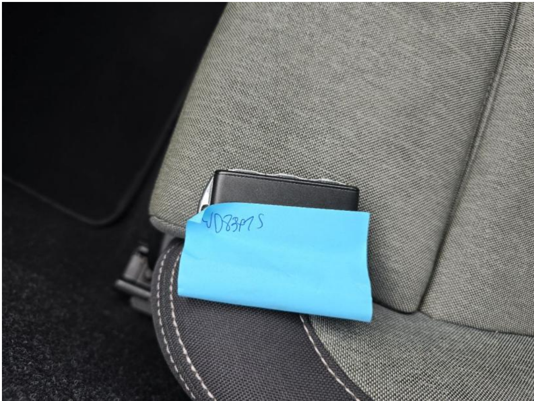
Fot. 33 kluczyk