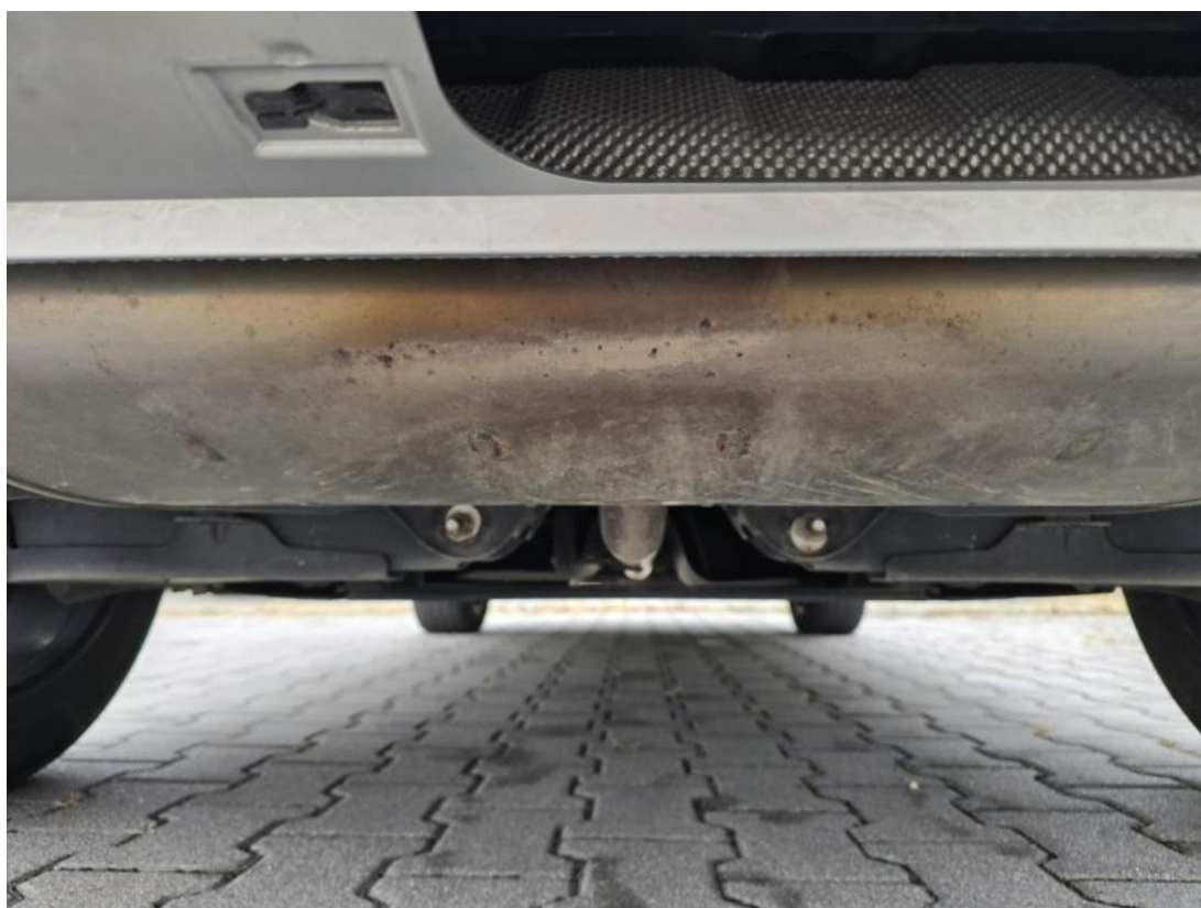
Fot. 28 Spód pojazdu tył