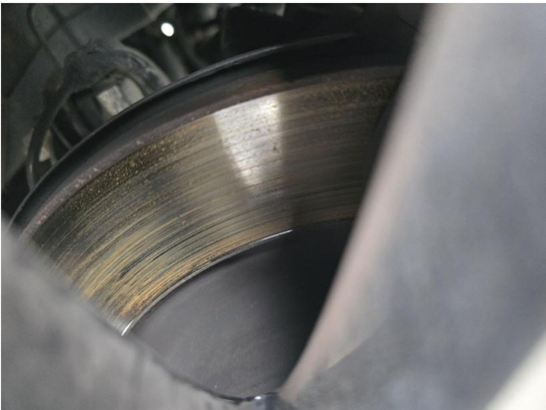
Fot. 32 Tarcza hamulcowa tylna lewa