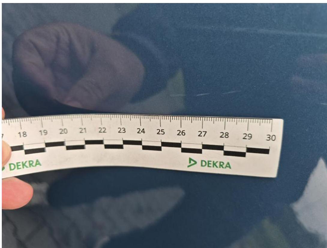
Fot. 39 Drzwi tylne P() - Rysa/odprysk 3