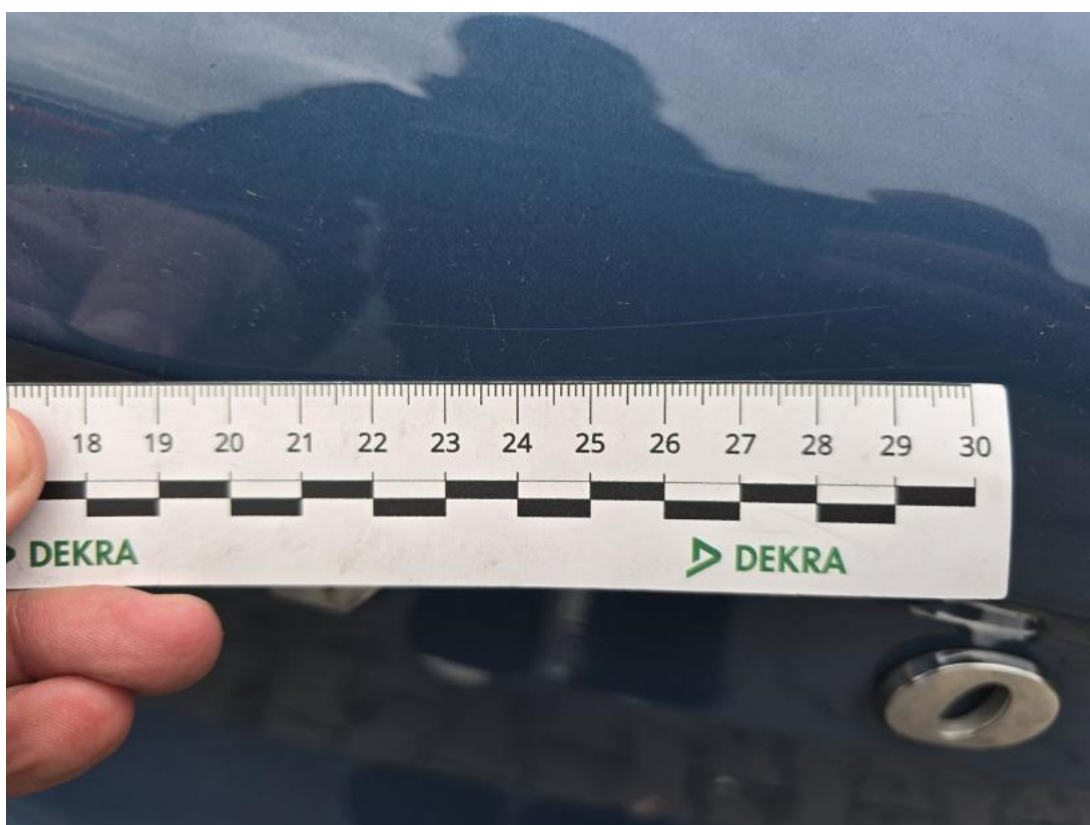
Fot. 40 Pokrywy bagażnika - Rysa/odprysk 1