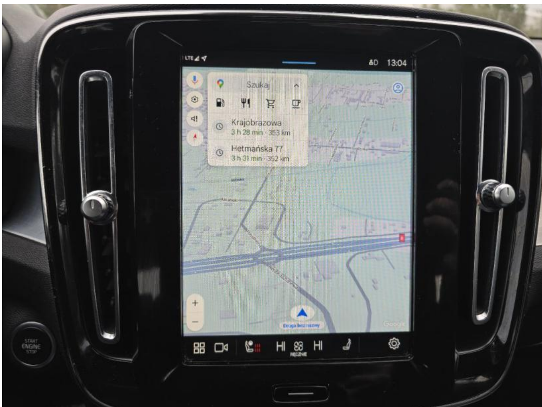
Fot. 34 nawigacja