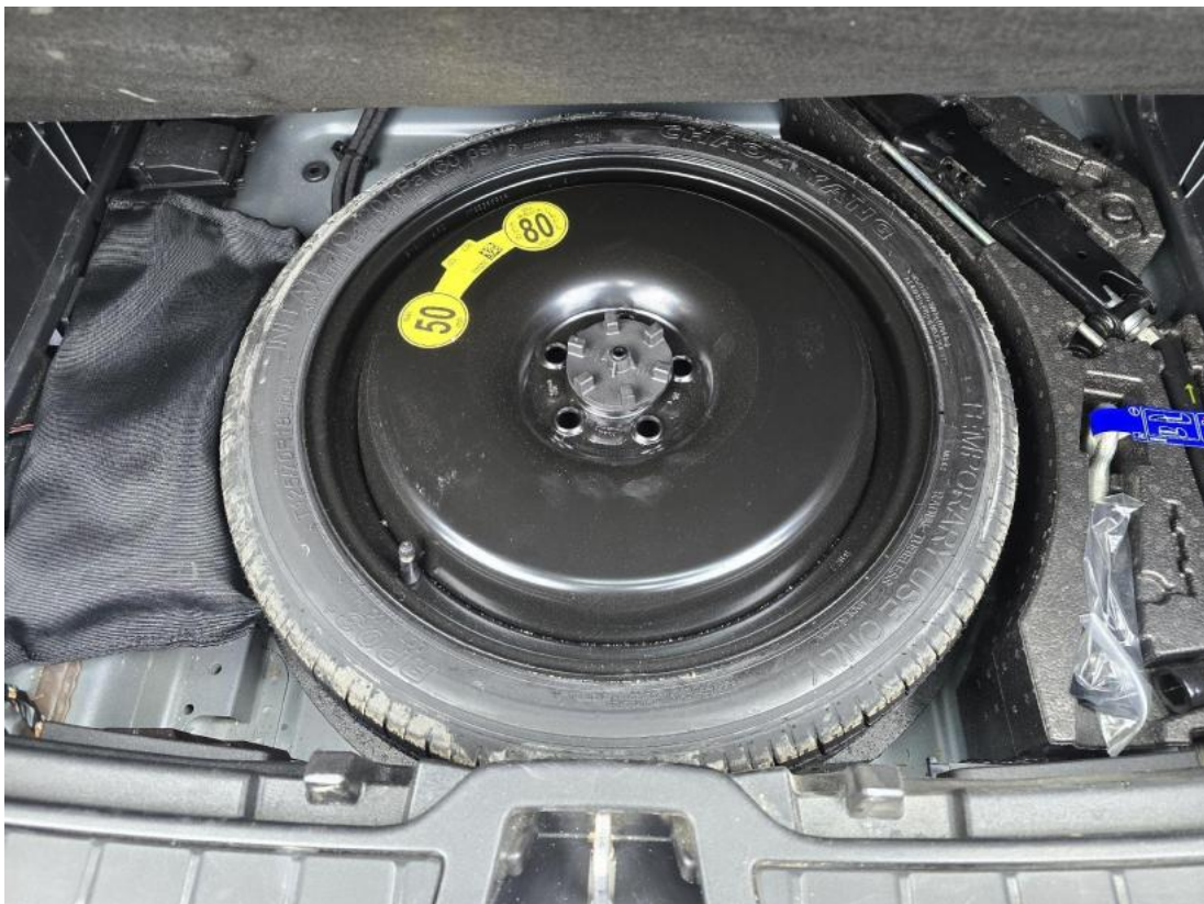
Fot. 26 Koło zapasowe