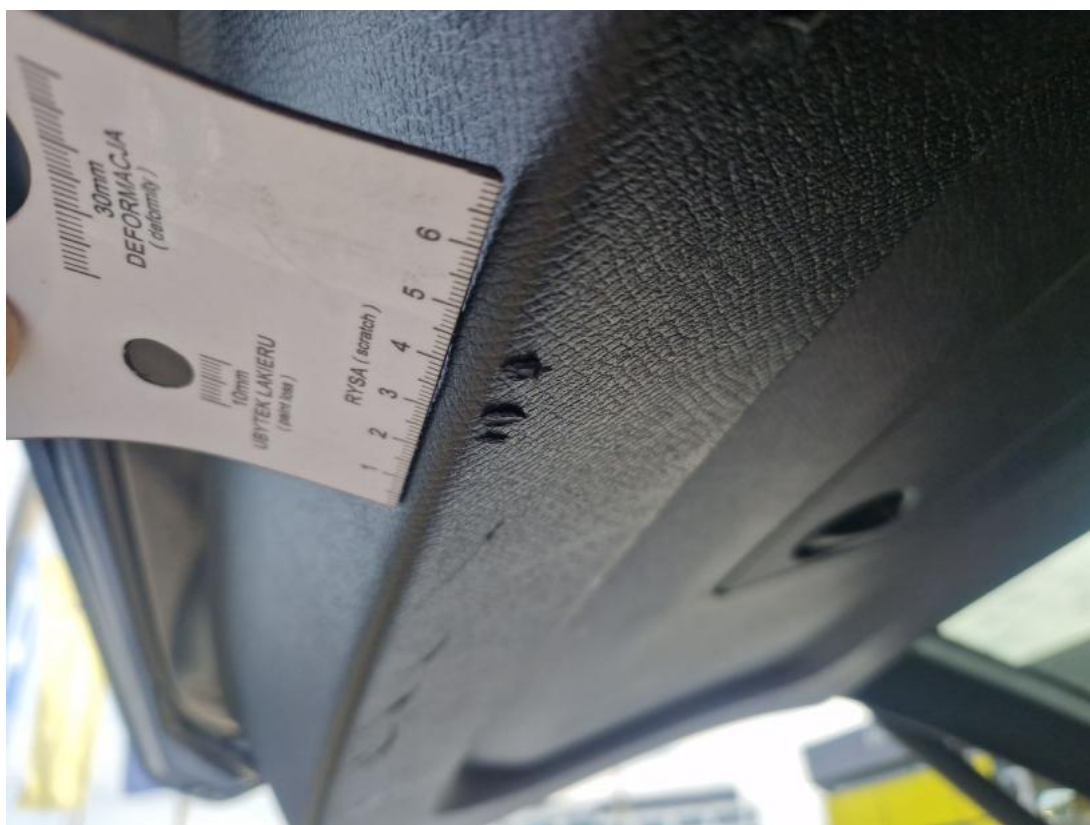
Fot. 43 Wykładzina pokrywy tylnej - zdjęcie poglądowe 2