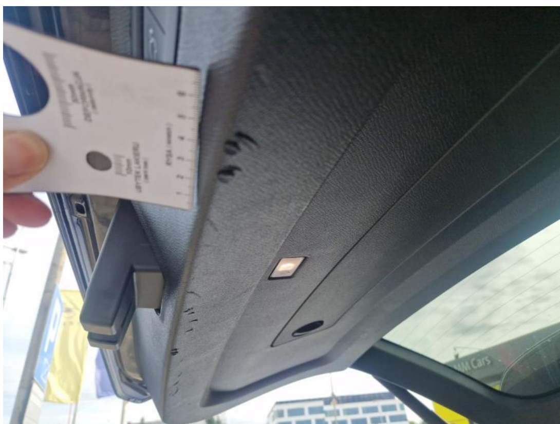
Fot. 44 Wykładzina pokrywy tylnej - Rysa/odprysk 1