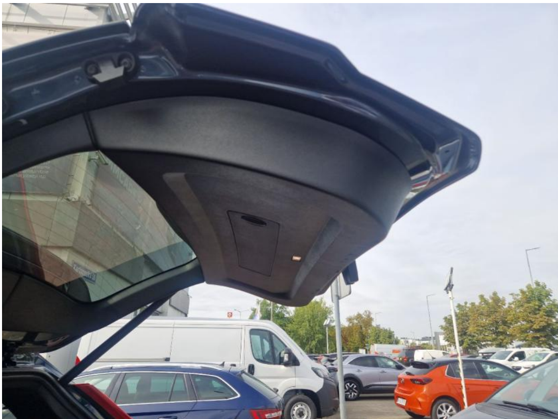
Fot. 42 Wykładzina pokrywy tylnej - zdjęcie poglądowe 1