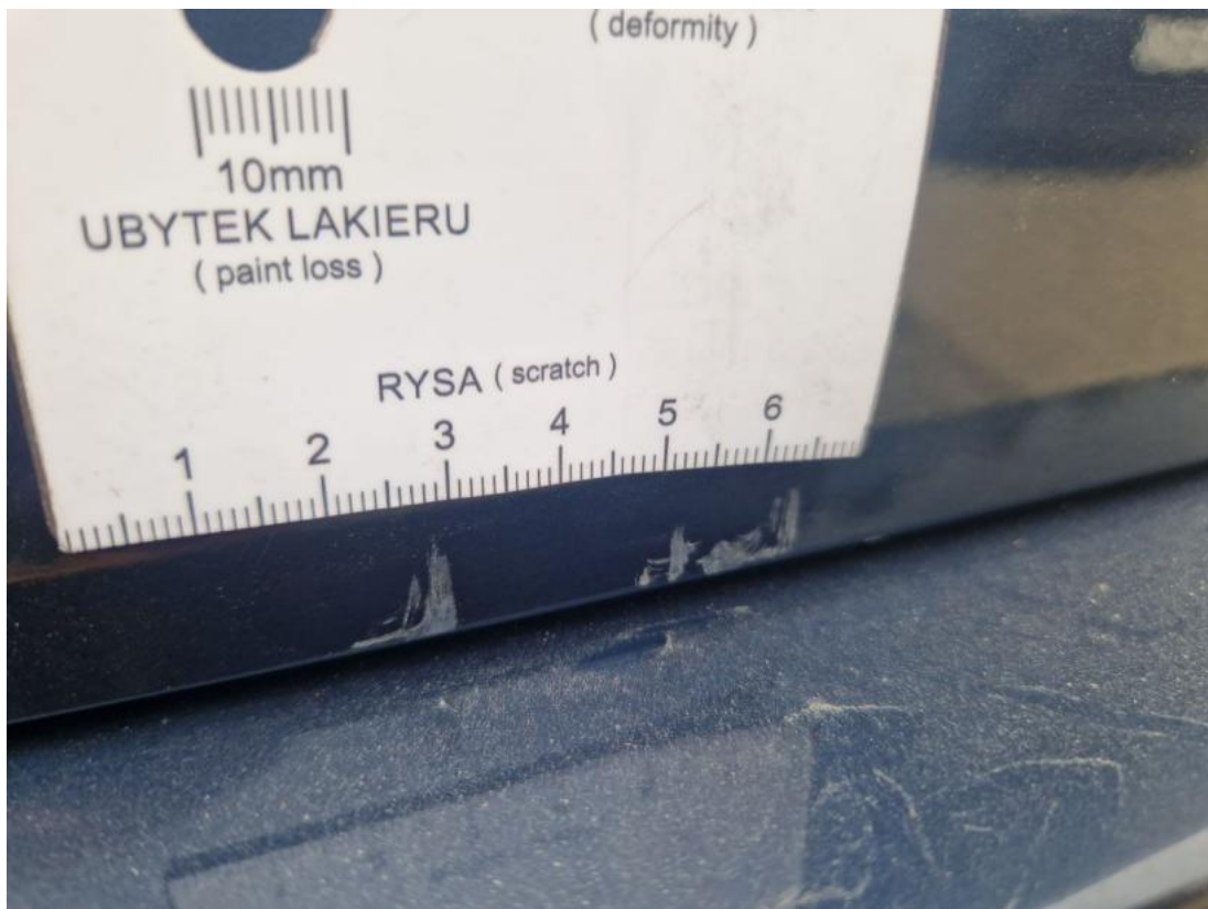
Fot. 41 Pokrywy bagażnika - Rysa/odprysk 2