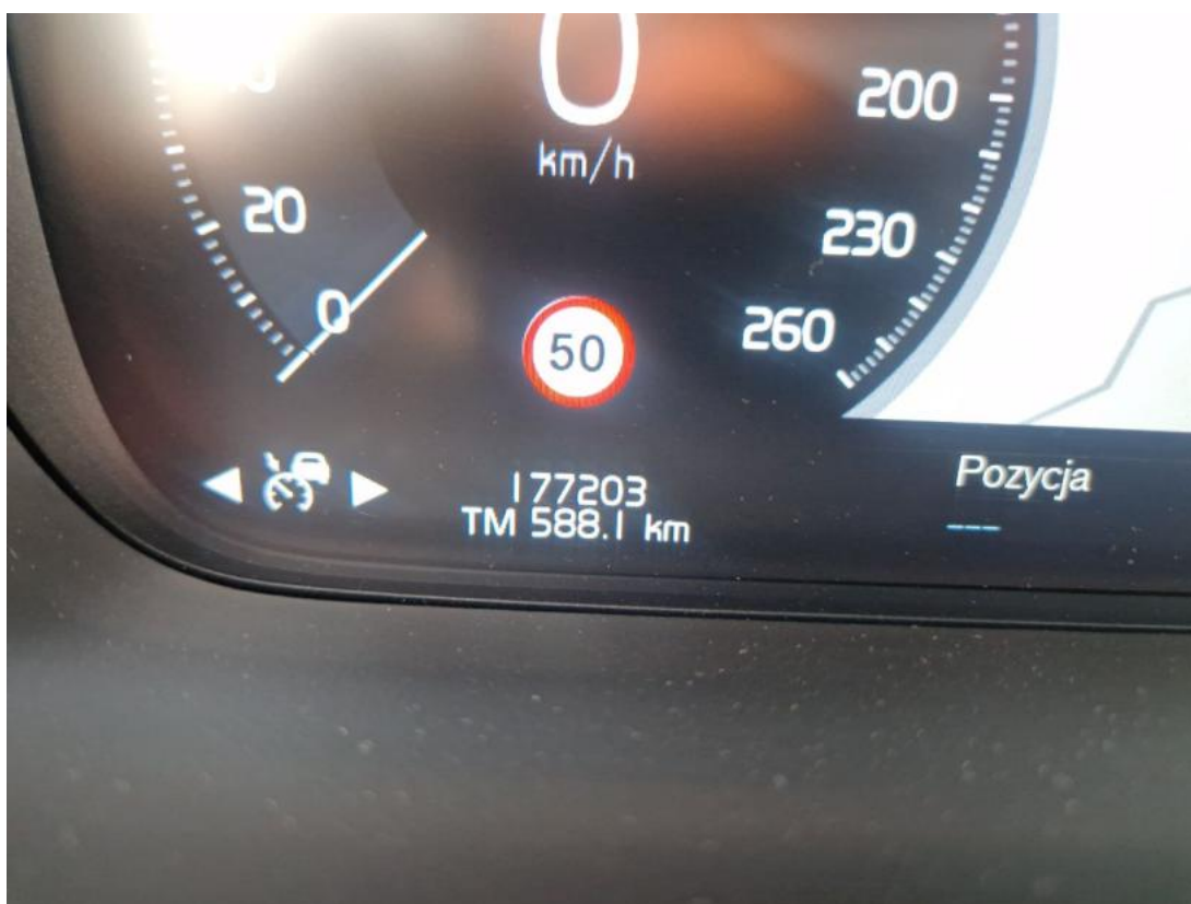
Fot. 34 Przebieg