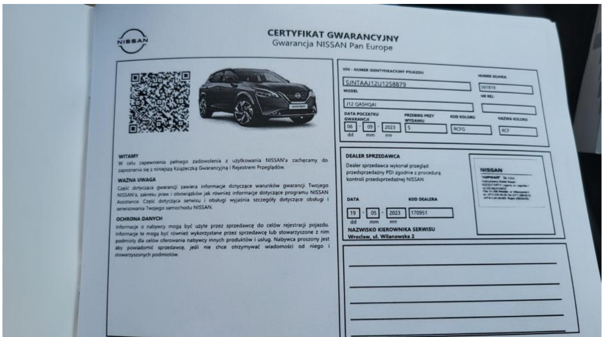
Fot. 30 Książka serwisowa – dane