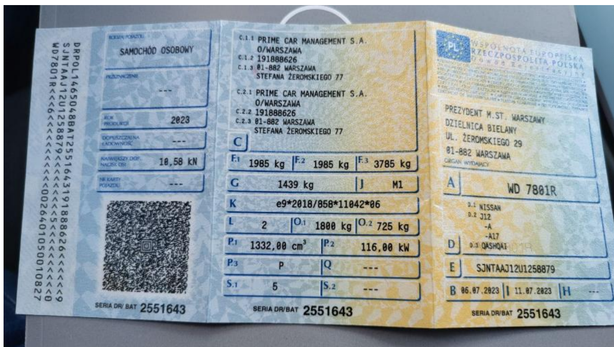
Fot. 28 Dowód rej. Str. 1