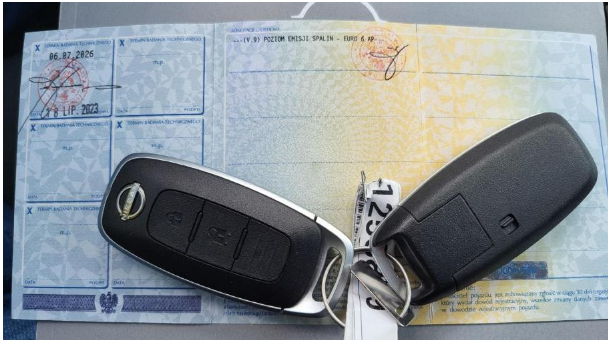
Fot. 29 Dow. Rej. Str.2 i klucze