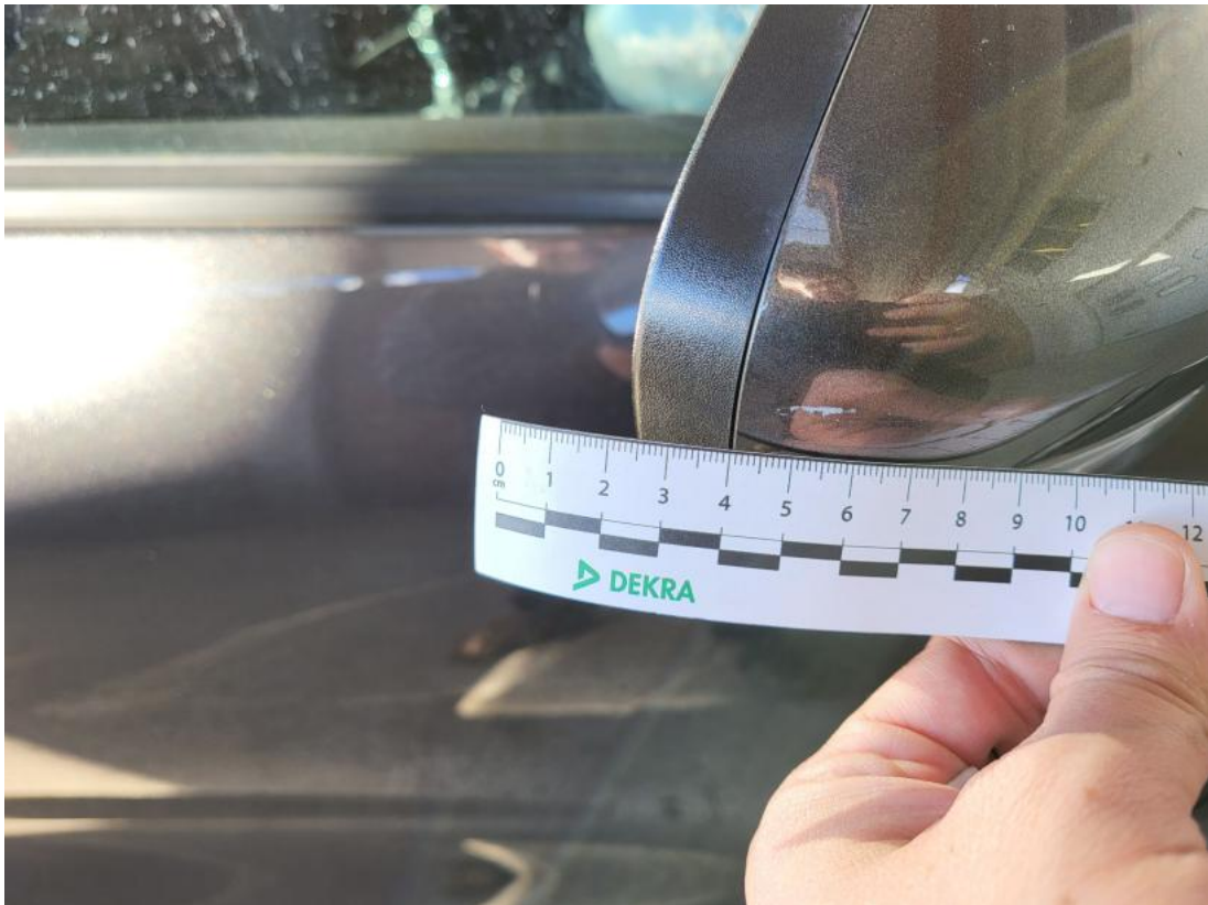
Fot. 39 Obudowa lusterka zew P - Rysa/odprysk 1