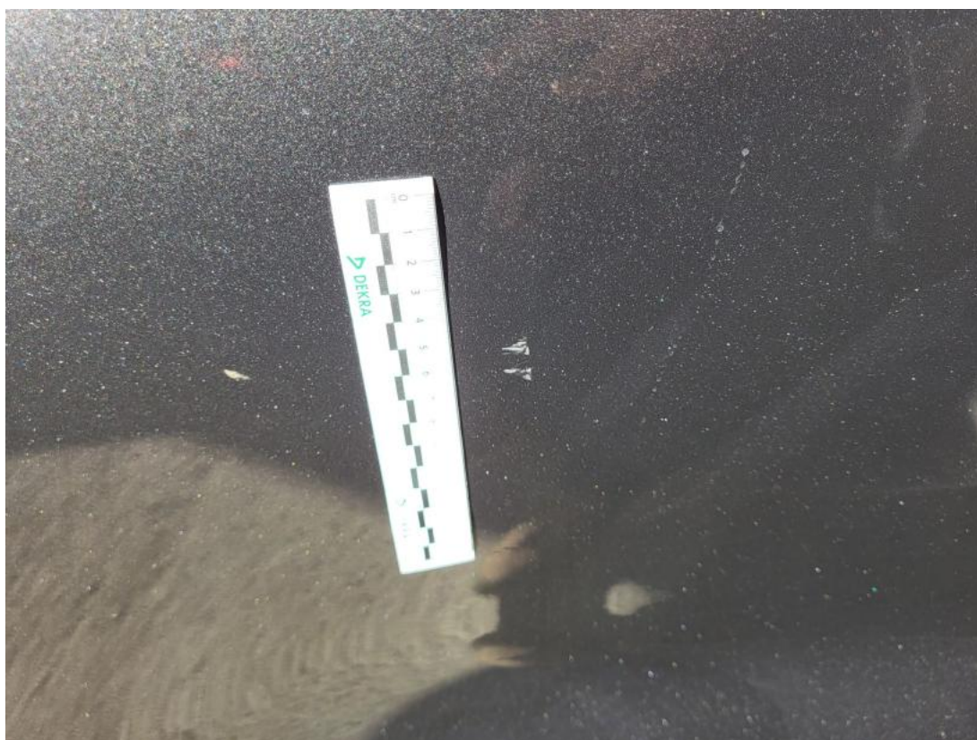
Fot. 38 Drzwi tylne P - Rysa/odprysk 1