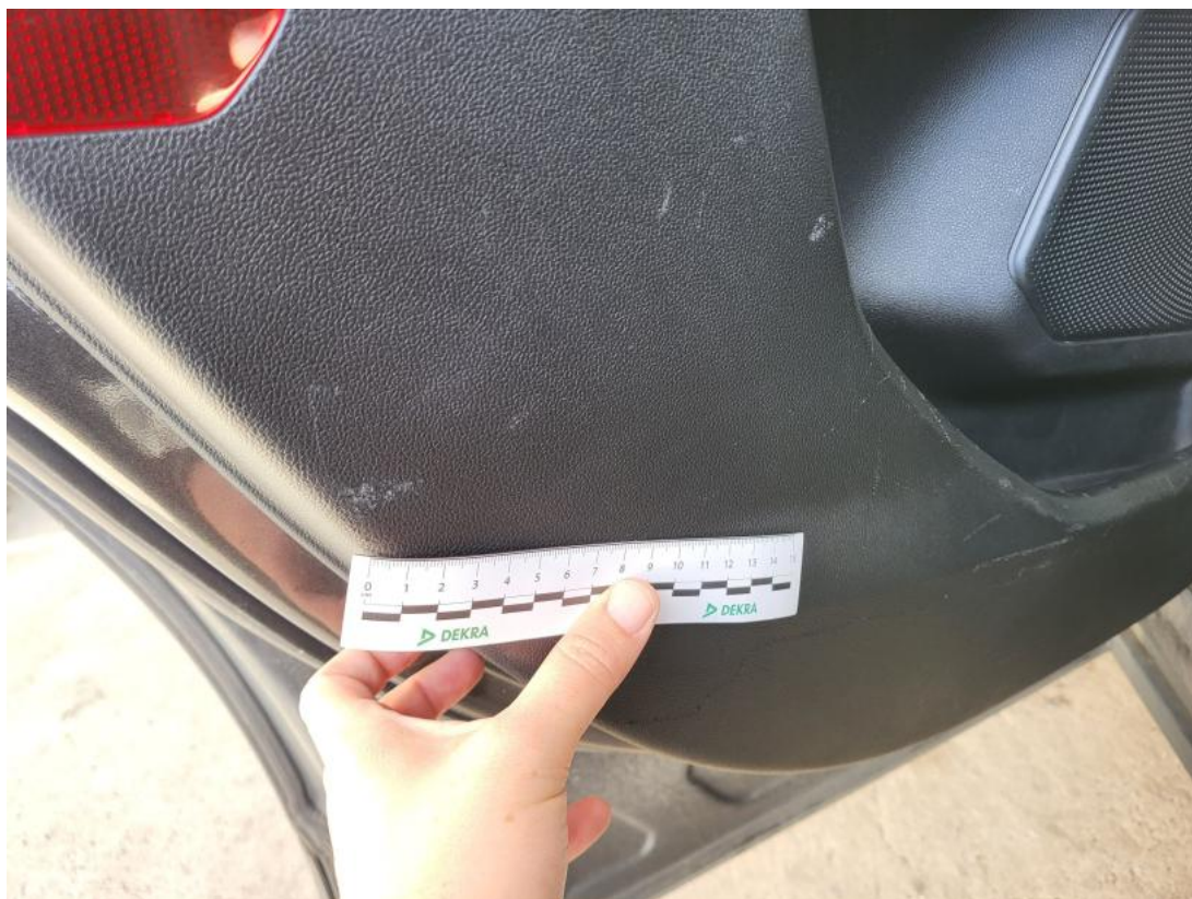
Fot. 47 Tapicerka drzwi tylnych L - Rysa/odprysk 1