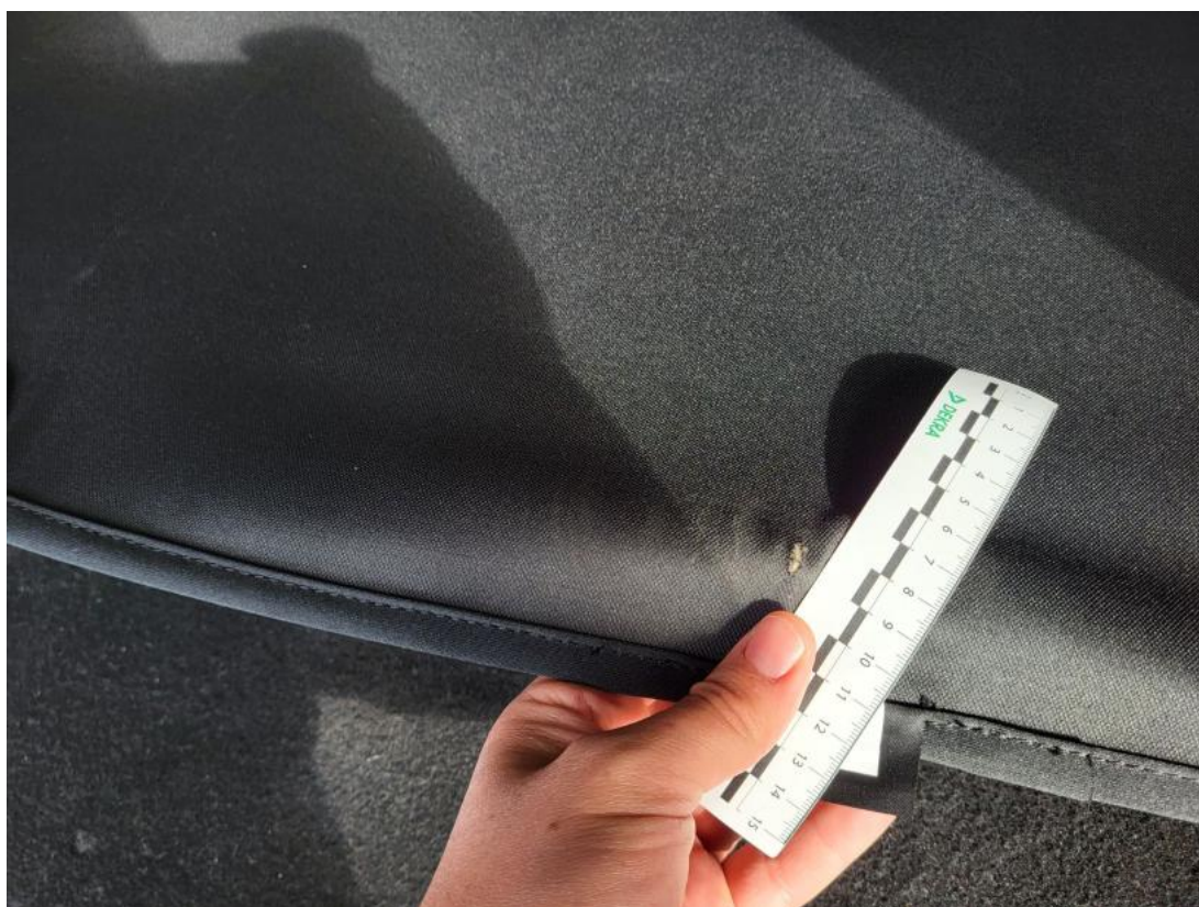
Fot. 48 Półka/roleta tylna - Pęknięcie/rozerwanie 1