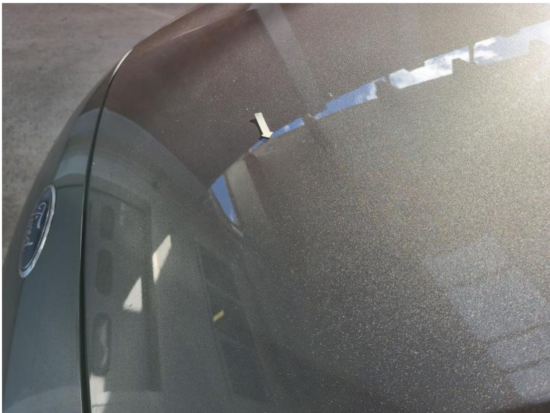
Fot. 34 Pokrywa komory silnika - Wgniecenie/odkształcenie 1