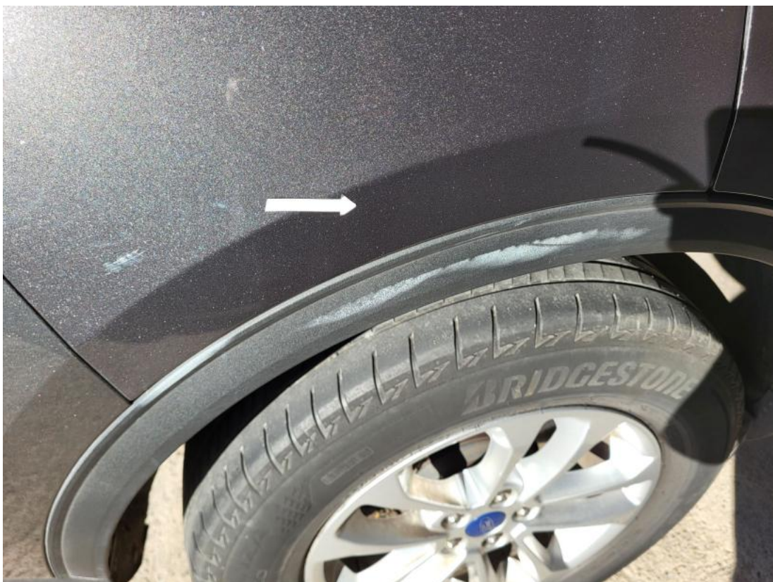
Fot. 40 Listwa krawędzi błotnika tyl P - Inne 1