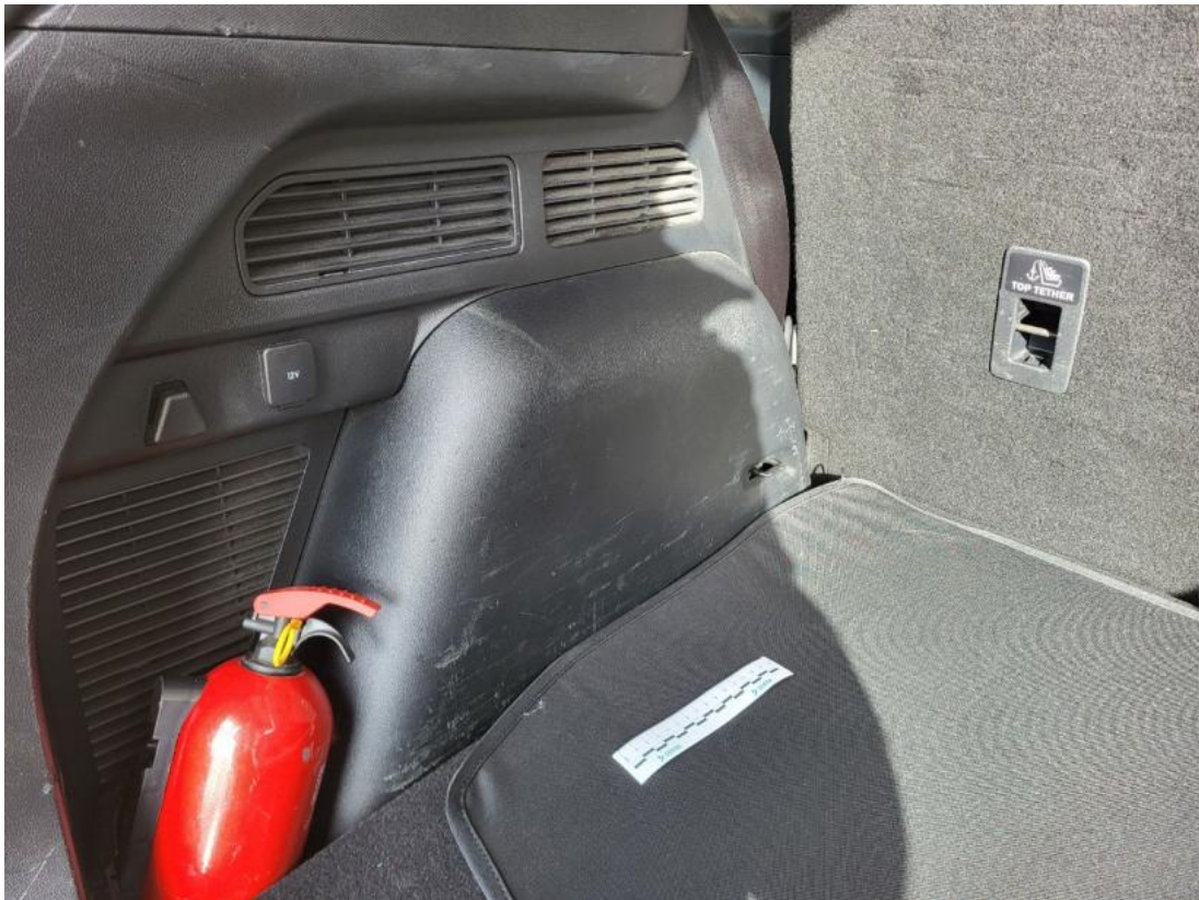
Fot. 51 Wykładzina przestrzeni bagażowej - zdjęcie poglądowe 1