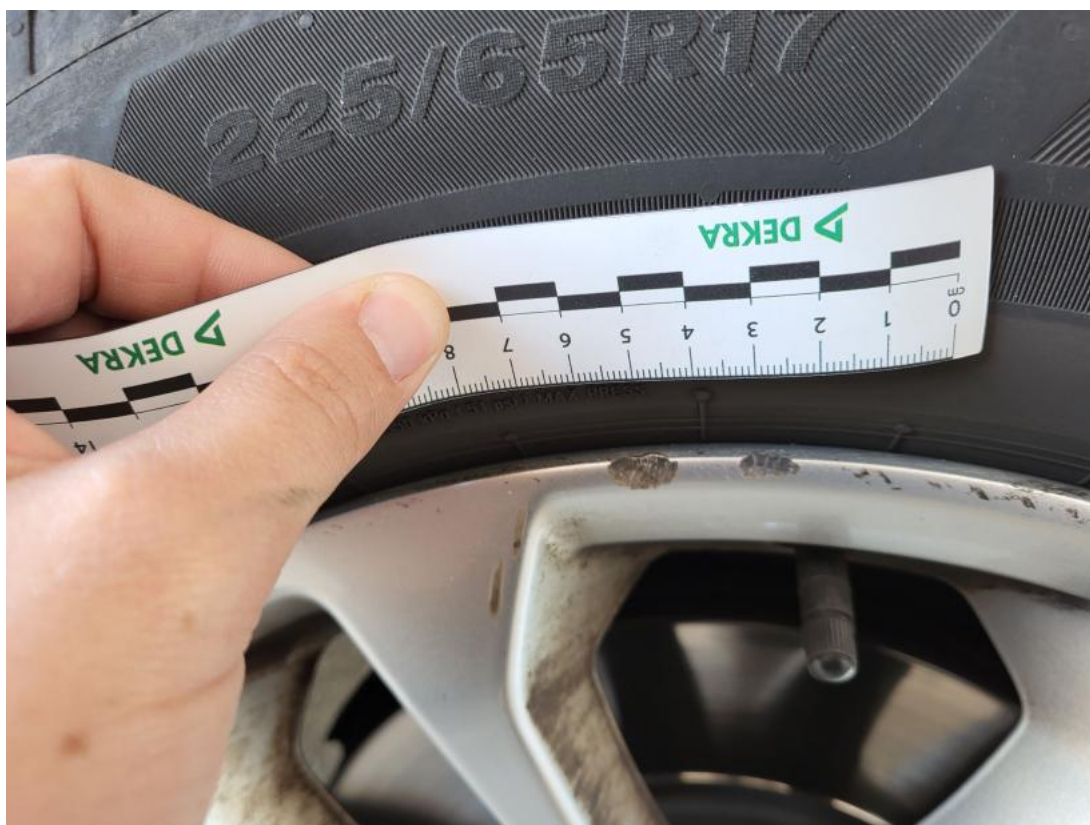
Fot. 37 Felga aluminiowa przednia P - Rysa/odprysk 1