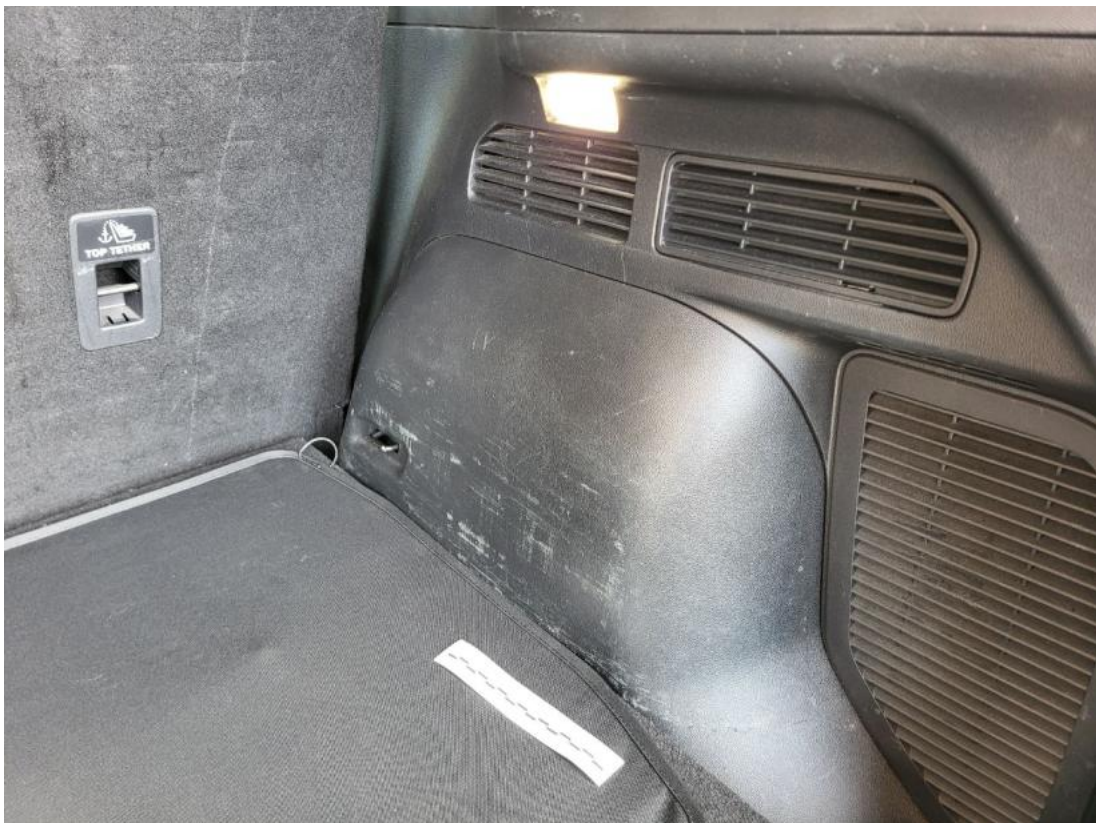
Fot. 52 Wykładzina przestrzeni bagażowej - zdjęcie poglądowe 2