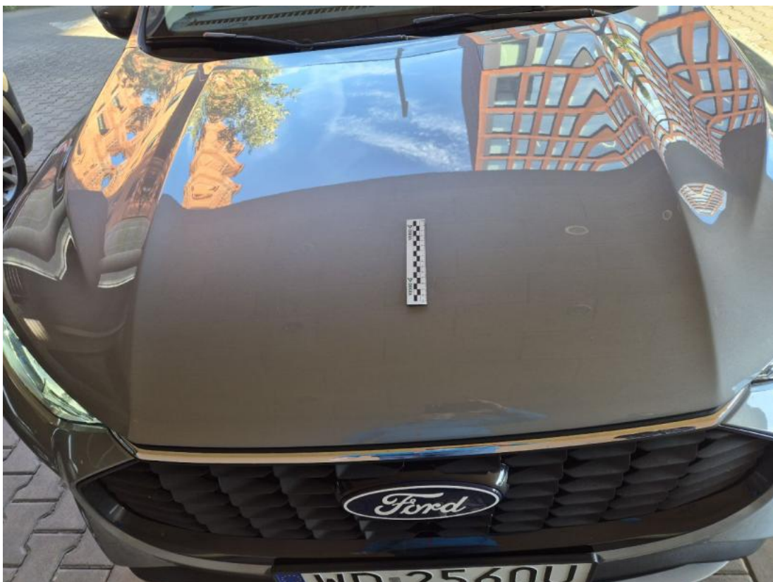
Fot. 36 Pokrywa komory silnika - zdjęcie poglądowe 1