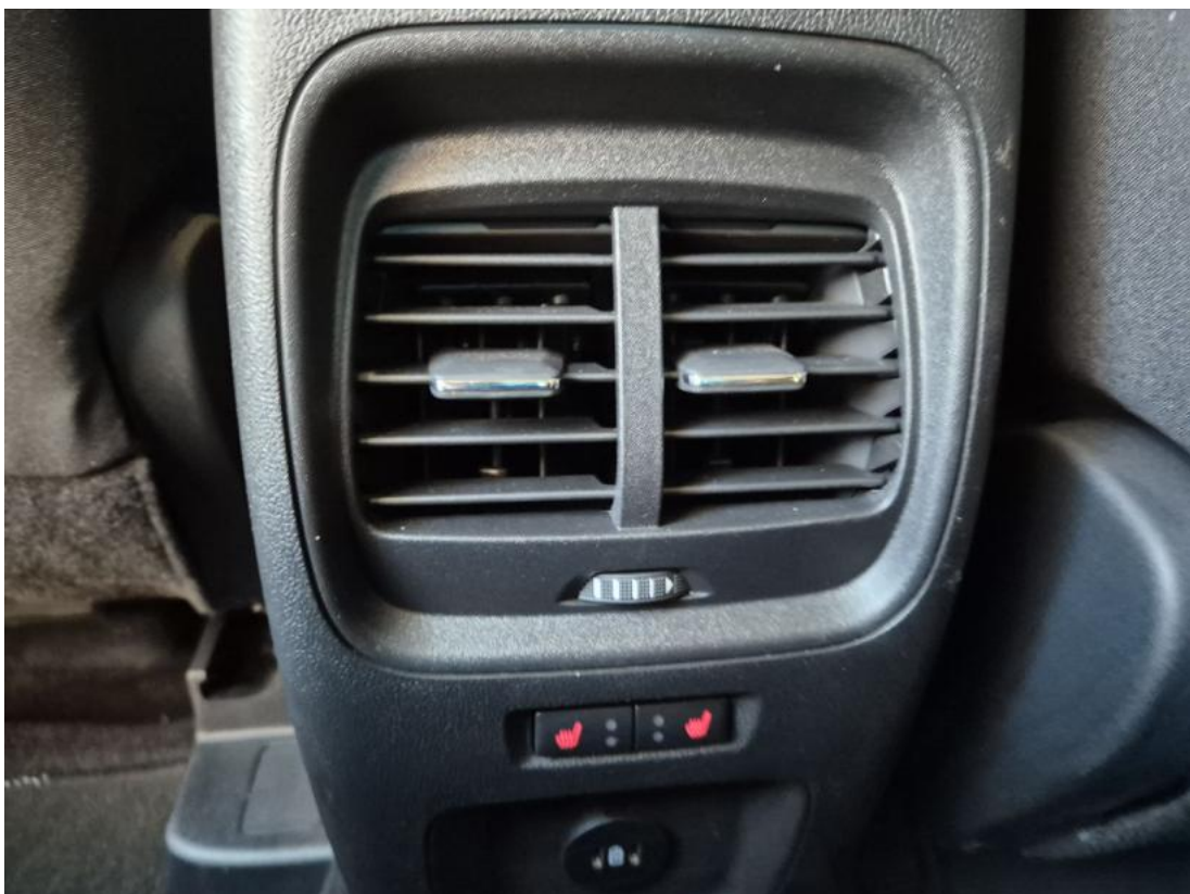
Fot. 34 Zdjęcie do protokołu