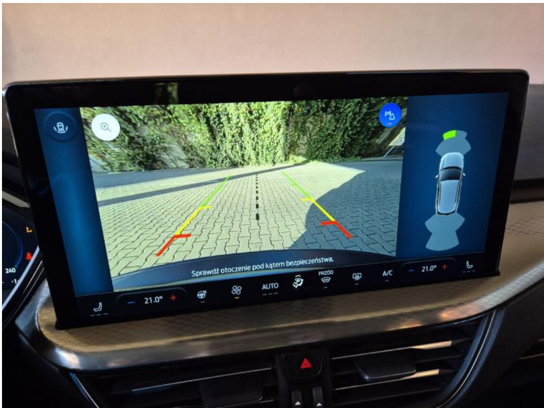
Fot. 35 Zdjęcie do protokołu