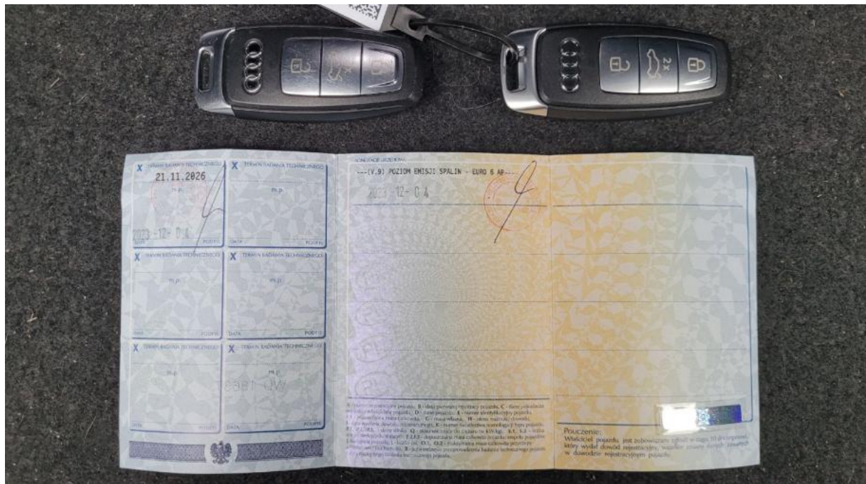
Fot. 34 Dow. Rej. Str.2 i klucze