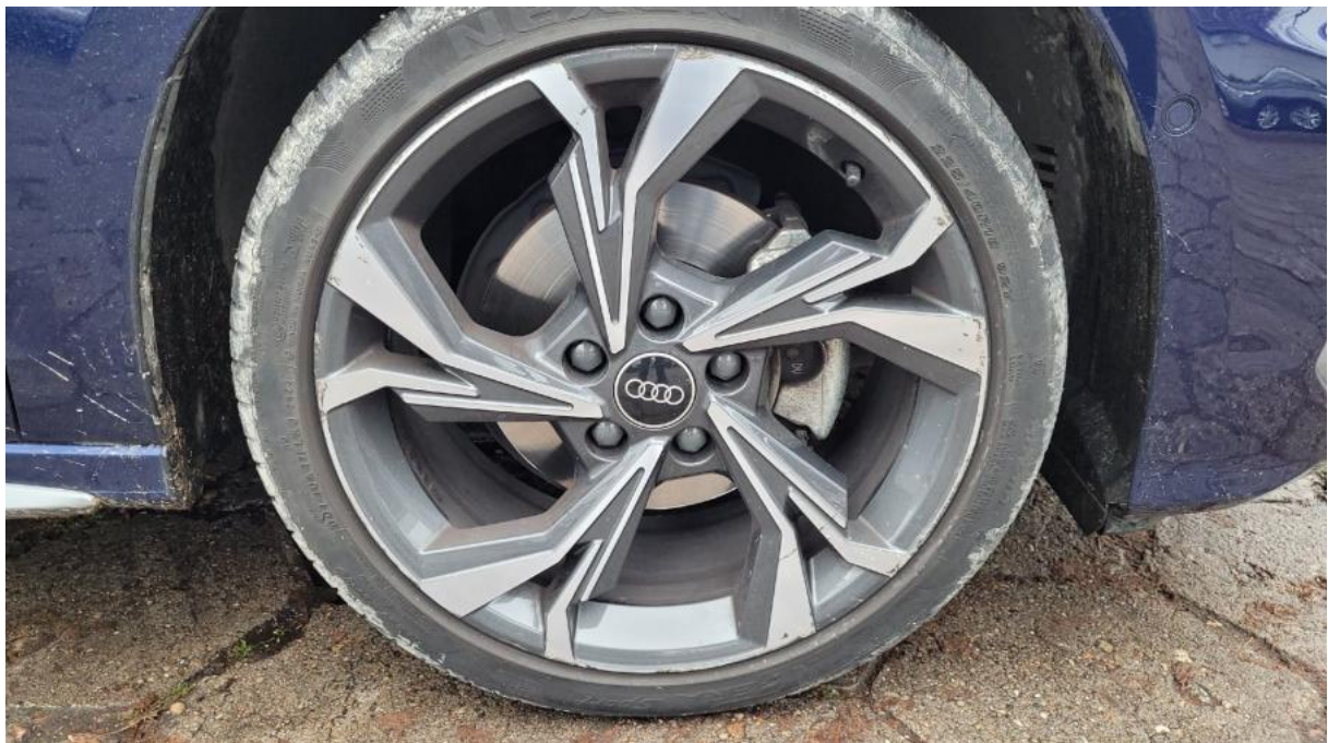
Fot. 36 Felga aluminiowa przednia P - zdjęcie pogładowe 1