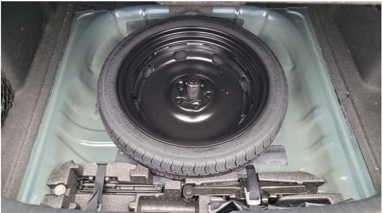
Fot. 26 Koło zapasowe