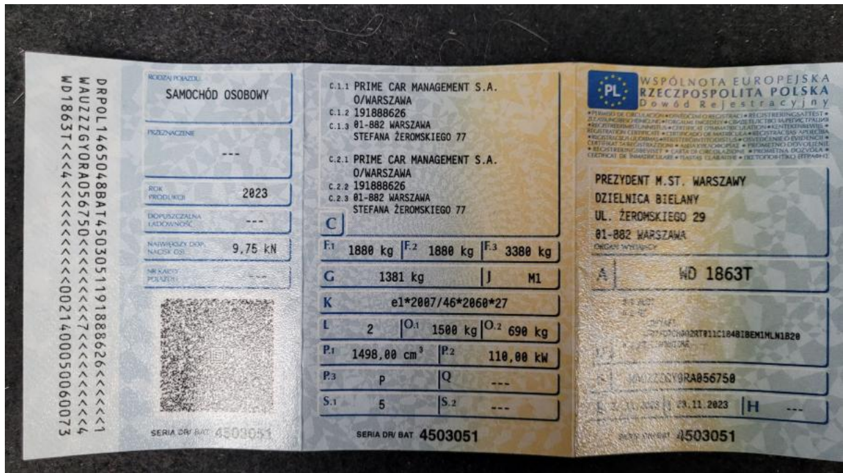
Fot. 33 Dowód rej. Str. 1