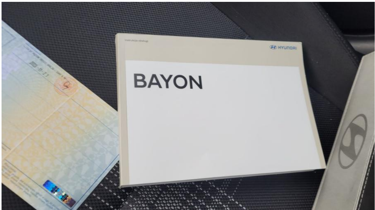
Fot. 32 Instrukcje