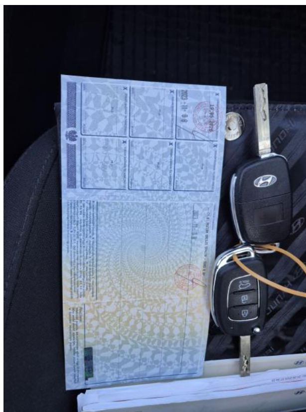
Fot. 31 Dow. Rej. Str.2 i klucze