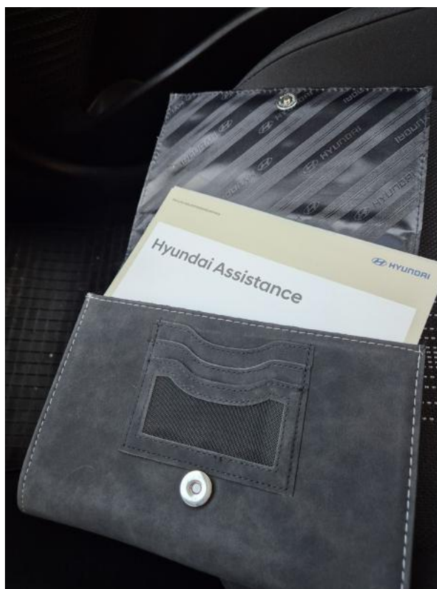
Fot. 34 Instrukcje