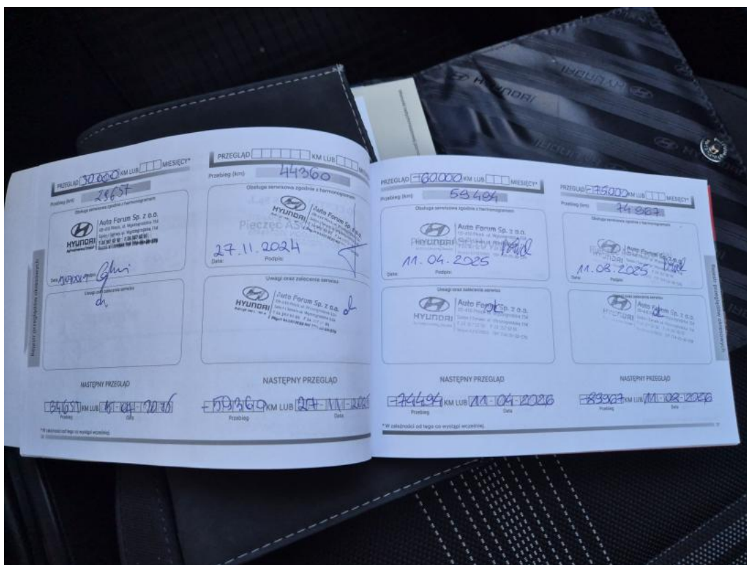
Fot. 33 Książka serwisowa – ostatni przegląd