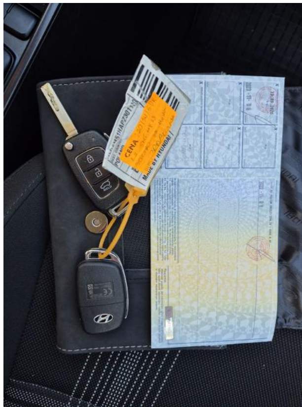
Fot. 31 Dow. Rej. Str.2 i klucze