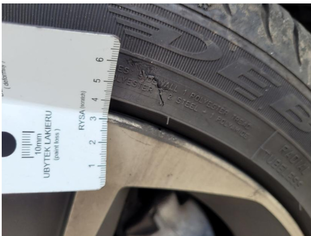
Fot. 38 Opona przednia P - Pęknięcie/rozerwanie 1