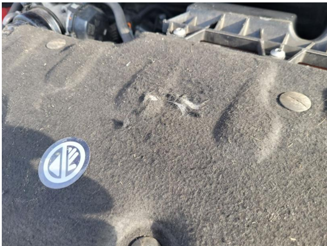
Fot. 33 Zdjęcie do protokołu