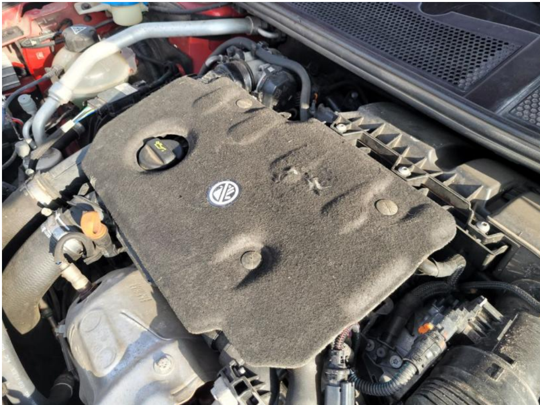
Fot. 35 Wykładzina pokrywy komory silnika - zdjęcie poglądowe 2