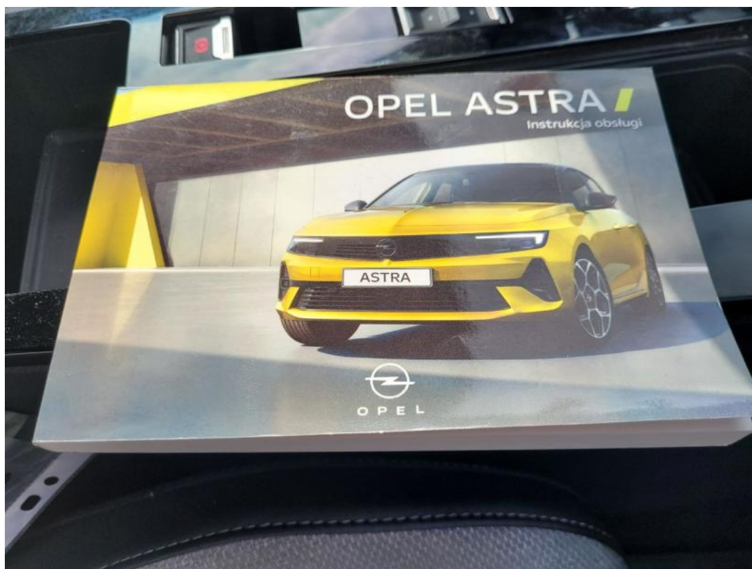
Fot. 32 Instrukcje