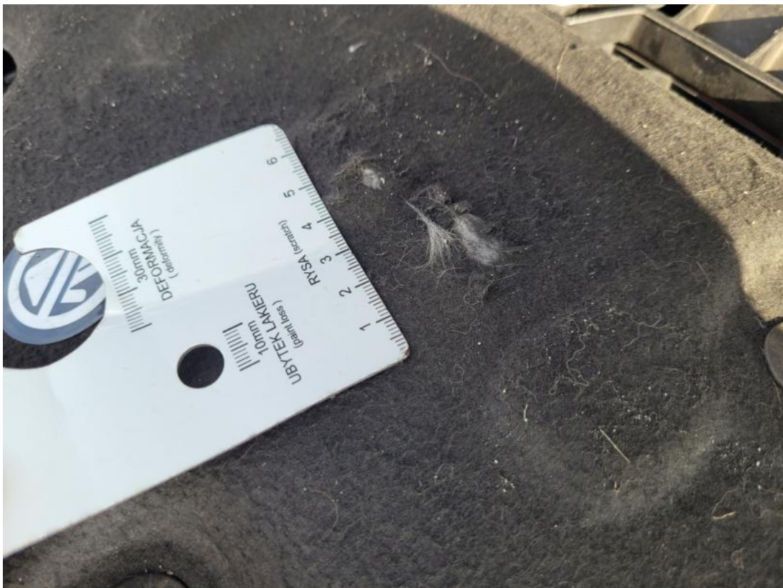
Fot. 36 Wykładzina pokrywy komory silnika - Pęknięcie/rozerwanie 1