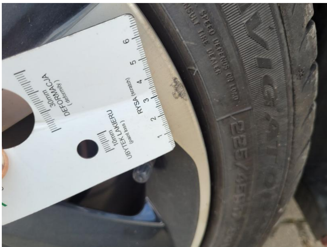
Fot. 39 Felga aluminiowa tylna P - Rysa/odprysk 1