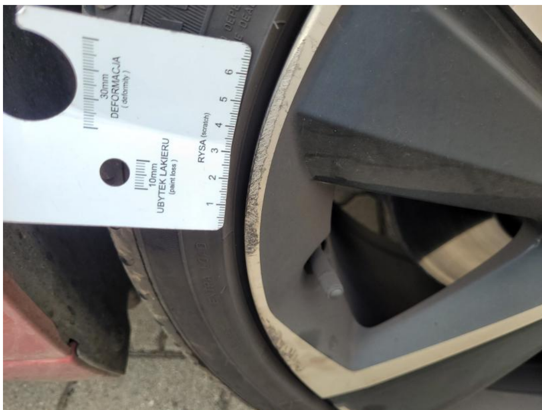
Fot. 37 Felga aluminiowa przednia P - Rysa/odprysk 1