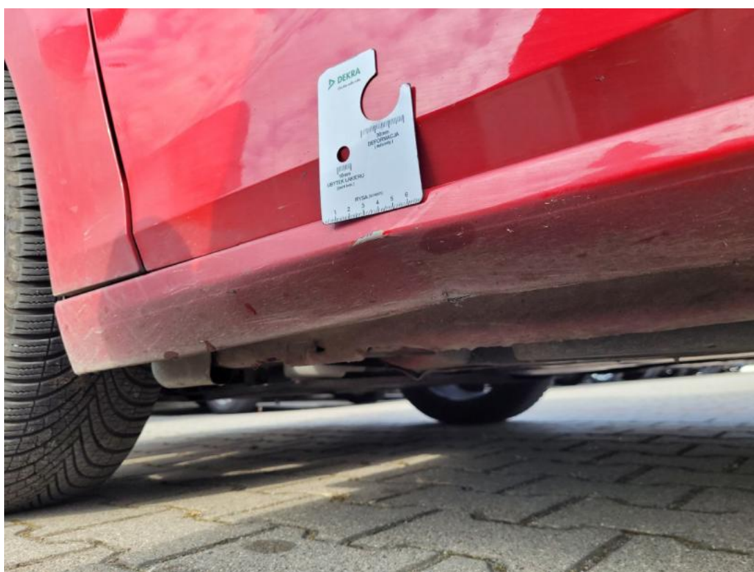
Fot. 40 Próg L - zdjęcie poglądowe 2