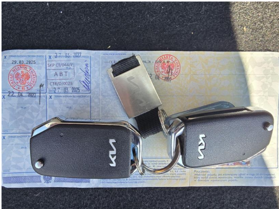
Fot. 29 Dow. Rej. Str.2 i klucze