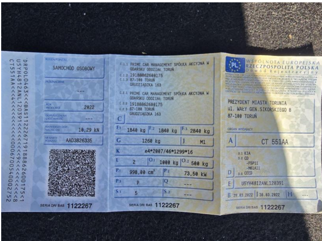
Fot. 28 Dowód rej. Str. 1