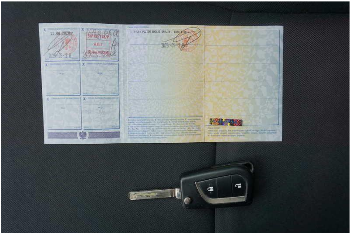
Fot. nr 92

Dokument wystawiony elektronicznie, ważny bez podpisu