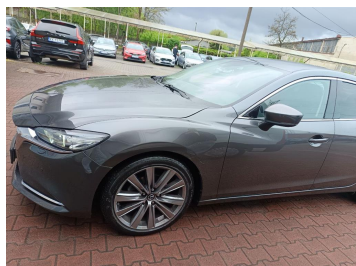
Bok lewy z przodu