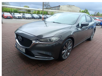
Przekątna przednia lewa