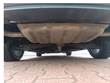
Spód pojazdu tył