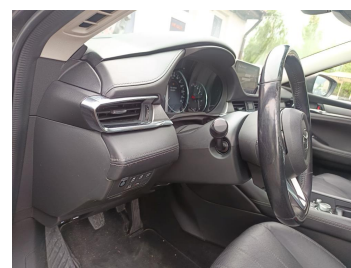
Kierownica z lewej strony