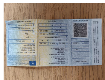
Dowód rej. Str. 1