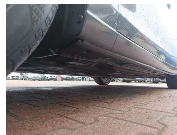
Próg lewy (widok od przodu)