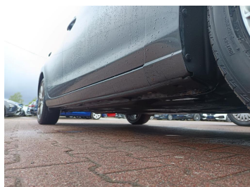
Próg prawy (widok od przodu)