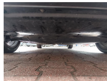
Spód pojazdu przód