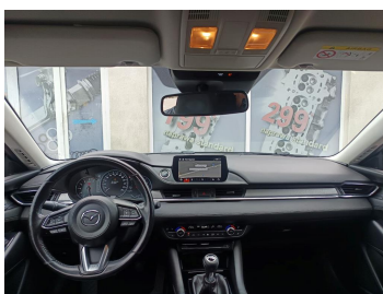
Widok z tylnej kanapy na deskę rozdź.