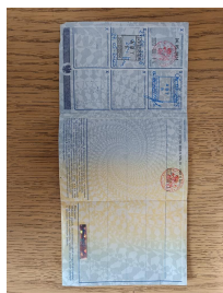
Dowód rej. str. 2