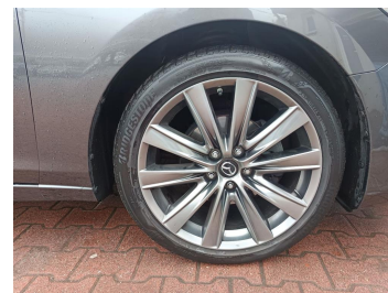
Tarcza hamulcowa przednia prawa