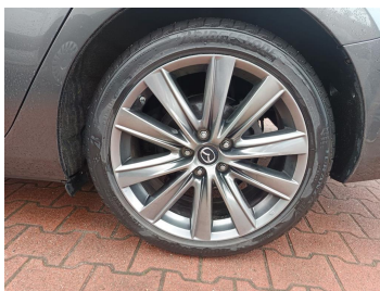
Tarcza hamulcowa tylna lewa