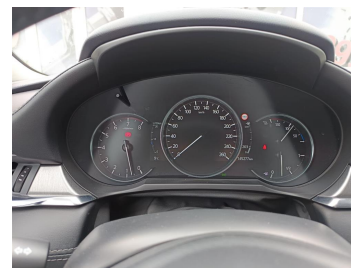
Zestaw wskaźników - przebieg