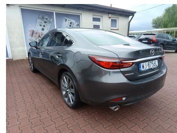
Przekątna tylna lewa