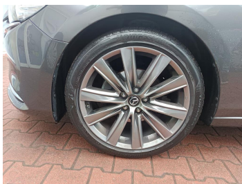
Tarcza hamulcowa przednia lewa