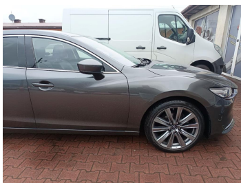
Bok prawy z przodu