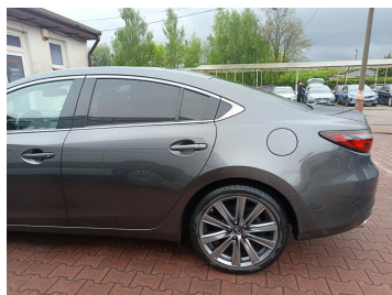
Bok lewy z tyłu