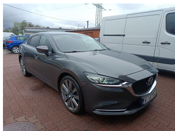
Przekątna przednia prawa