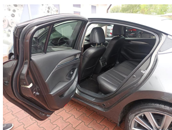
Widok przez otwarte drzwi tylne lewe