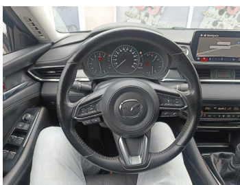
Kierownica (na wprost)