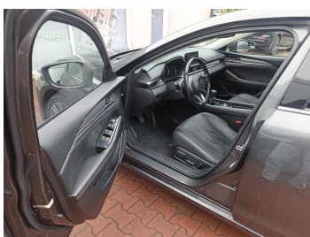
Widok przez otwarte drzwi przednie lewe