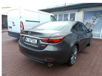
Przekątna tylna prawa