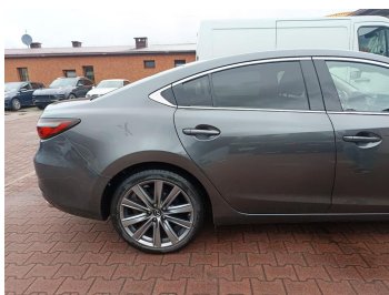
Bok prawy z tyłu