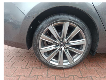
Tarcza hamulcowa tylna prawa