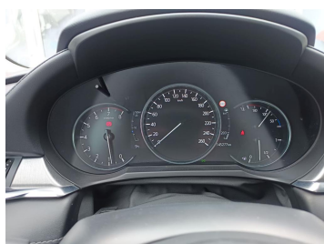
Zestaw wskaźników - serwis