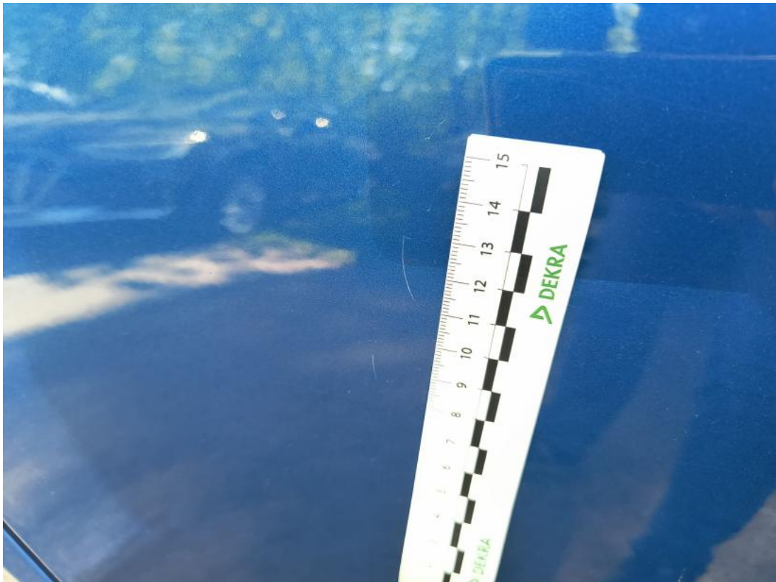
Fot. 53 Drzwi tylne P - Rysa/odprysk 1