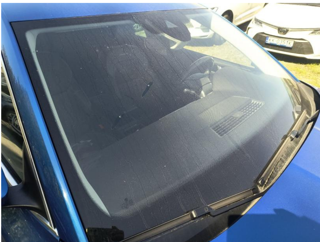
Fot. 38 Szyba czołowa - zdjęcie poglądowe 1