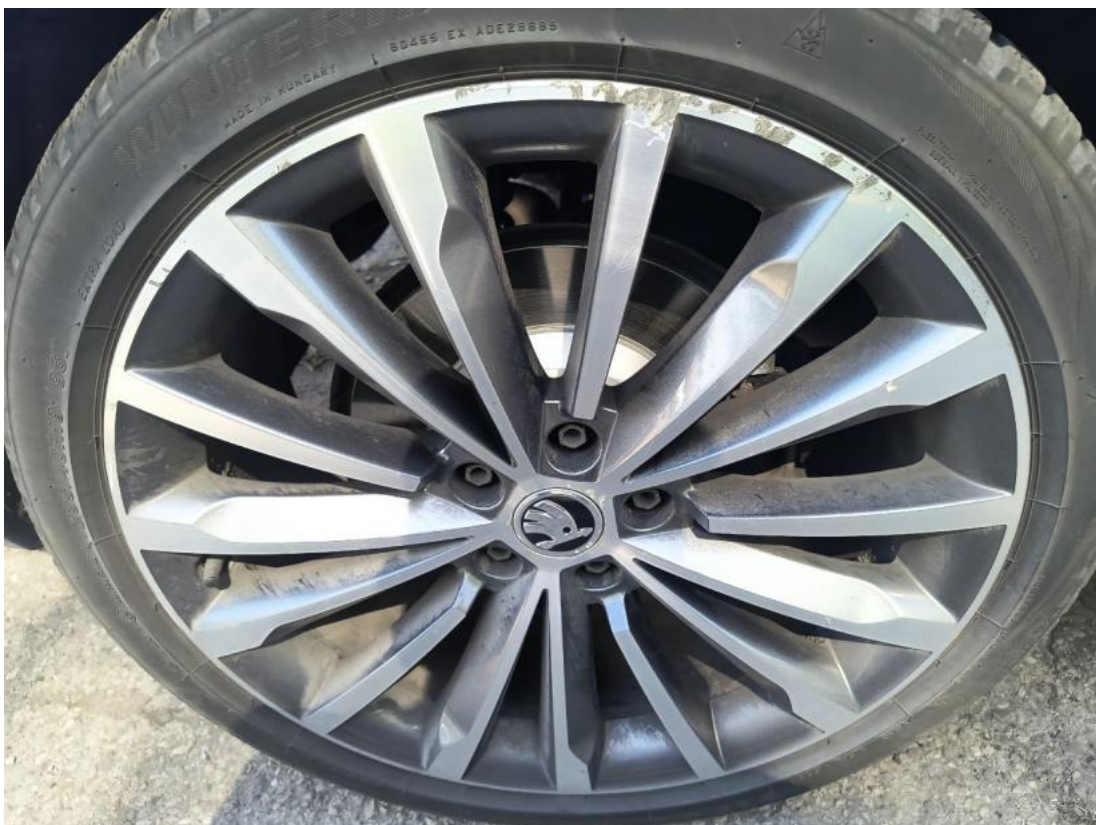
Fot. 54 Felga aluminiowa tylna P - zdjęcie poglądowe 1