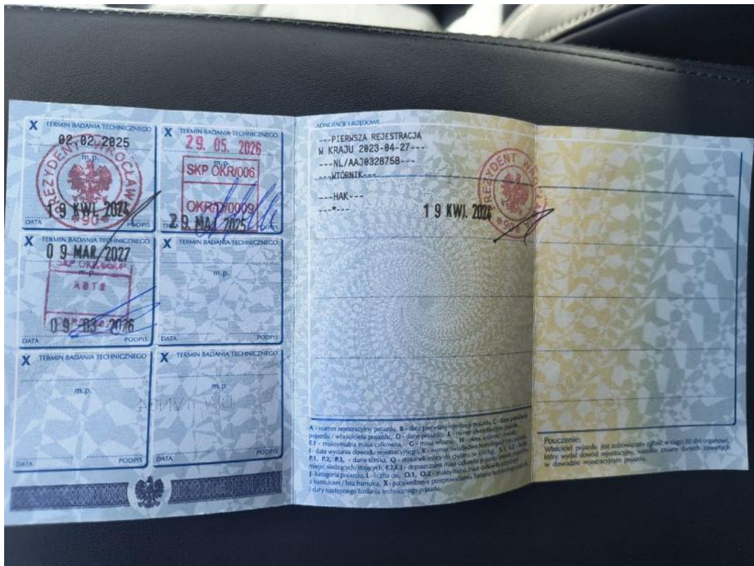
Fot. 33 Dowód rej. str. 2