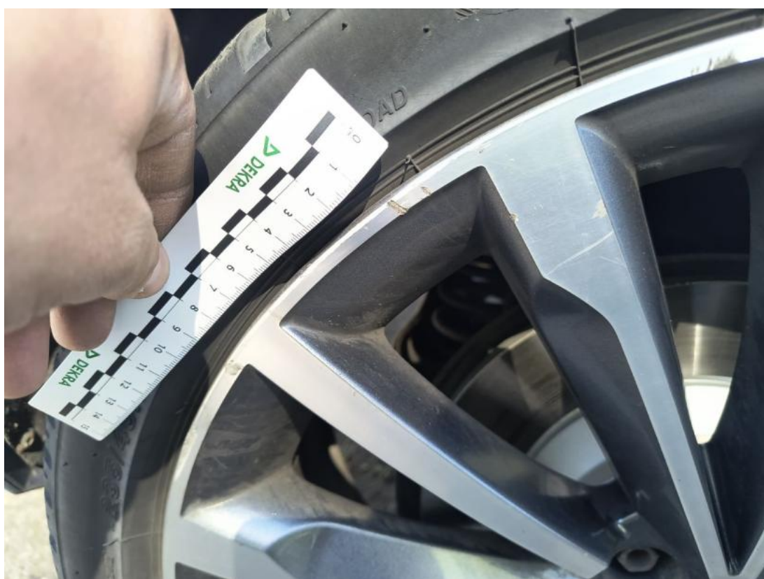
Fot. 56 Felga aluminiowa tylna P - Rysa/odprysk 2