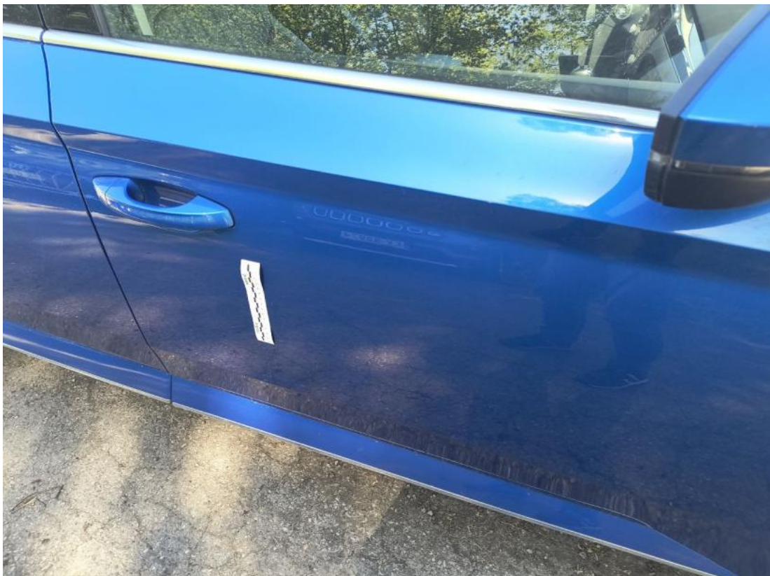
Fot. 50 Drzwi przednie P - zdjęcie pogładowe 1