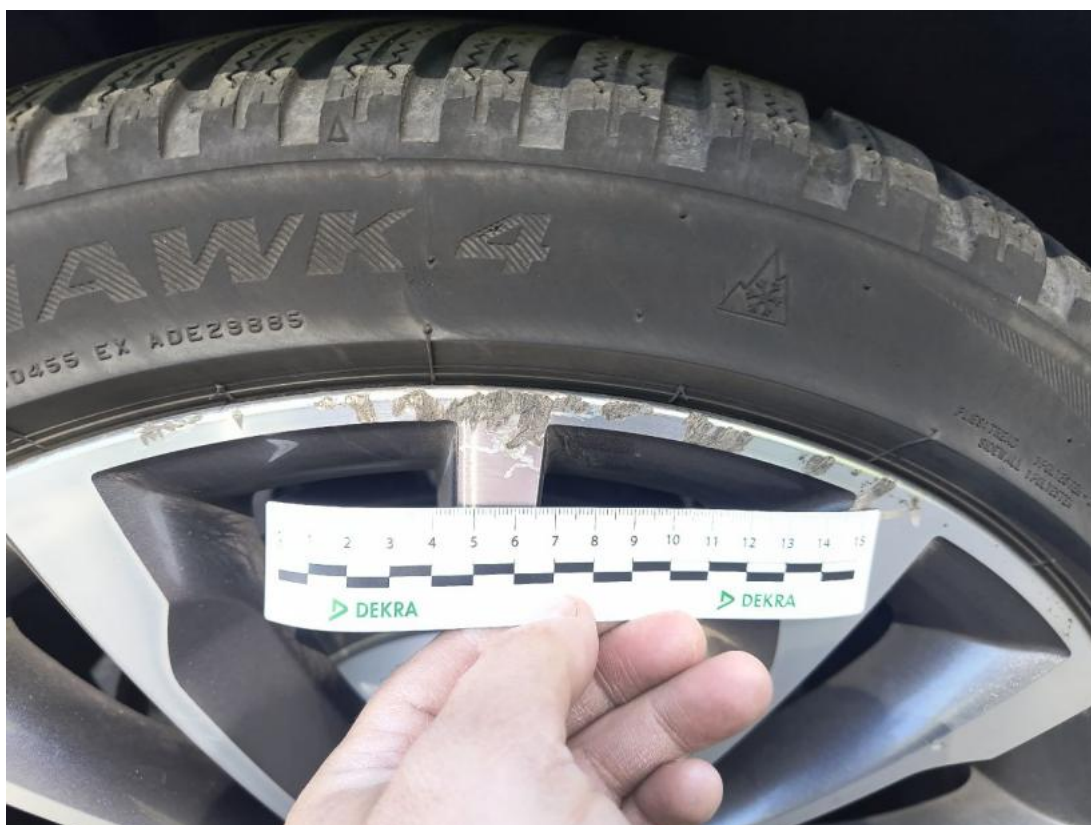
Fot. 55 Felga aluminiowa tylna P - Rysa/odprysk 1