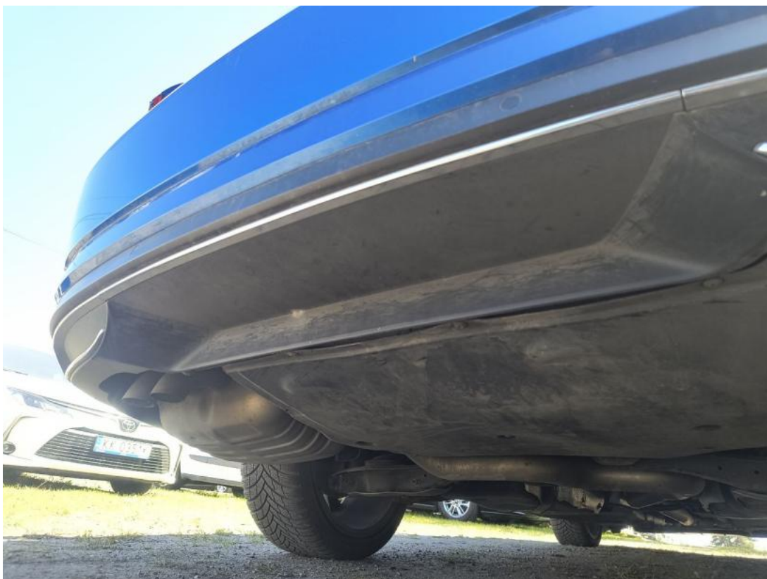
Fot. 37 Zdjęcie do protokołu