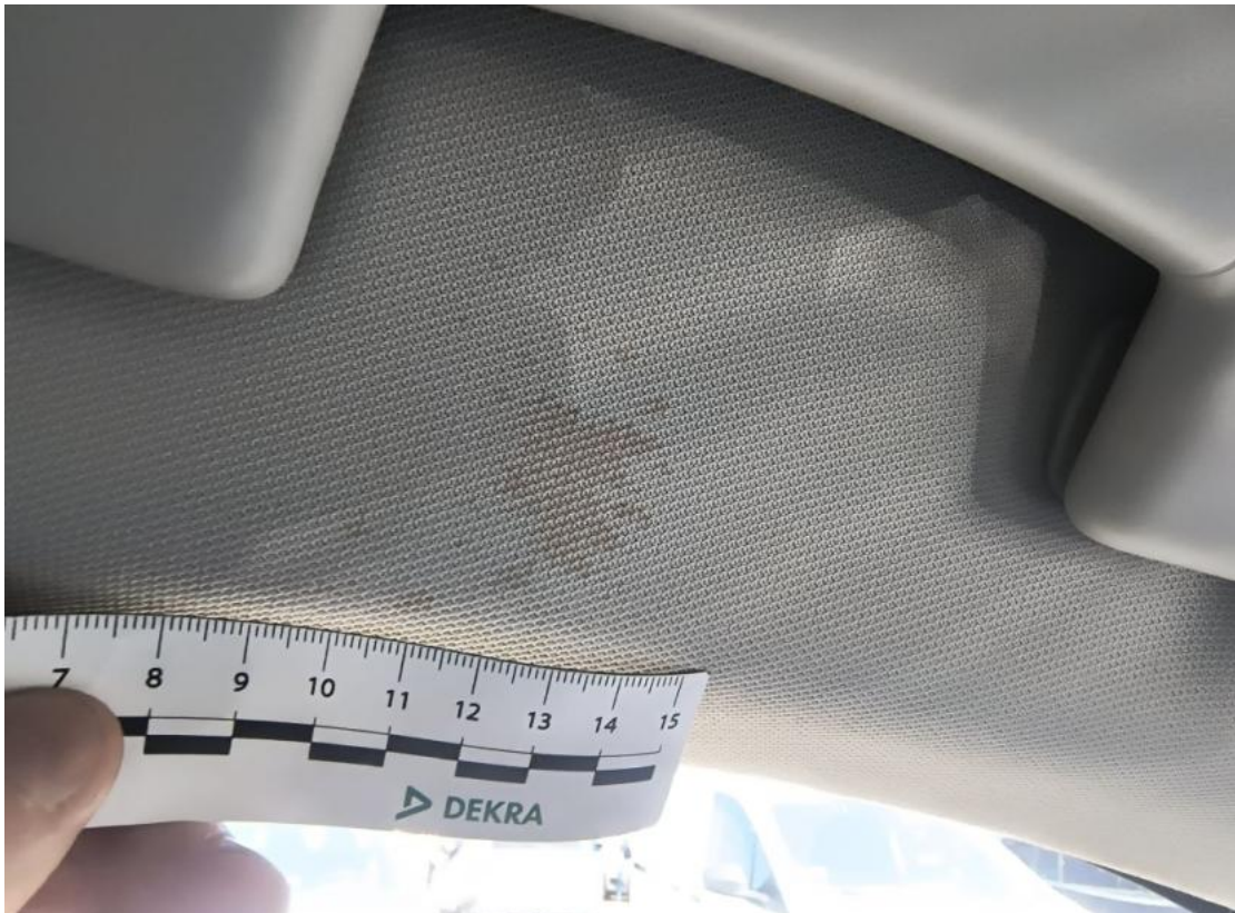
Fot. 77 Podsufitka - Inne 1