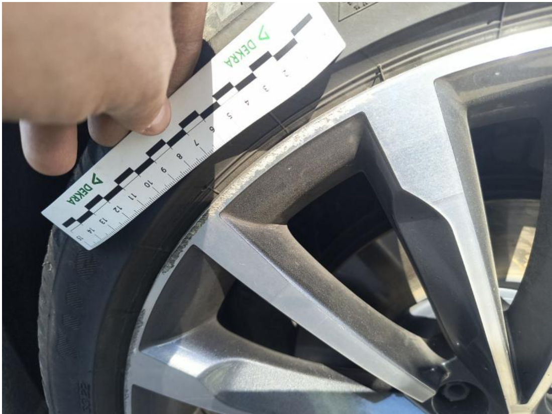
Fot. 49 Felga przednia P() - Rysa/odprysk 3