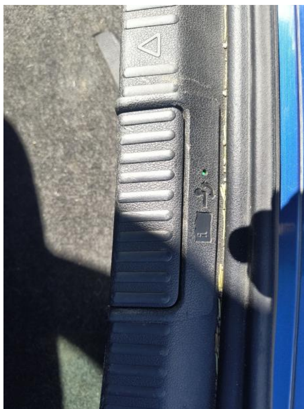
Fot. 36 Zdjęcie do protokołu