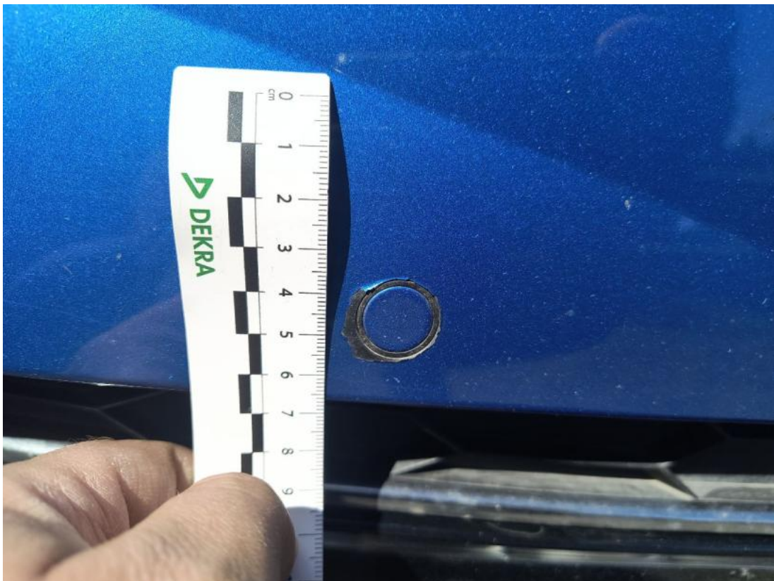
Fot. 45 Zderzak() - Rysa/odprysk 3