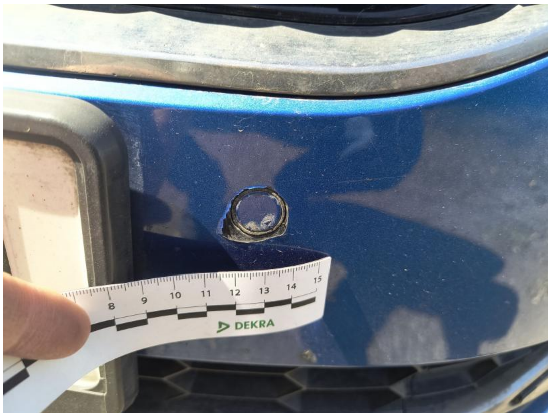
Fot. 43 Zderzak - Rysa/odprysk 1