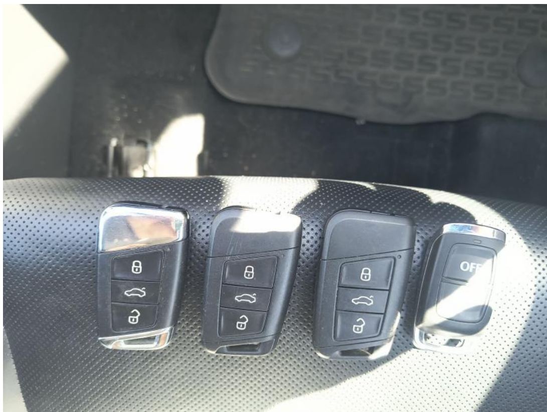
Fot. 35 Kluczyki