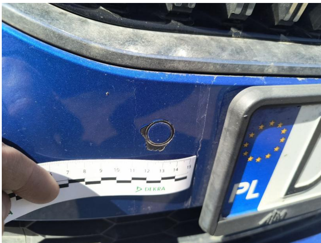
Fot. 44 Zderzak - Rysa/odprysk 2