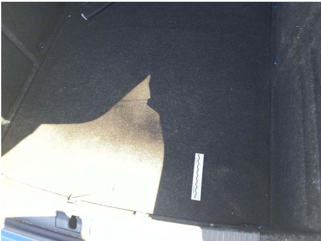
Fot. 78 Wykładzina podłogi bagażnika - zdjęcie poglądowe 1