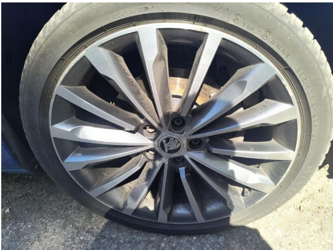
Fot. 46 Felga przednia P - zdjęcie pogładowe 1