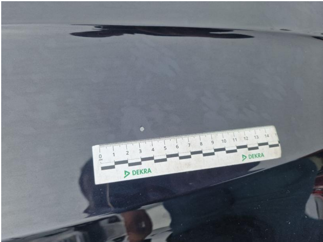
Fot. 39 Pokrywa komory silnika() - Rysa/odprysk 3