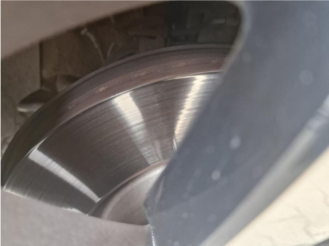
Fot. 29 Tarcza hamulcowa przednia prawa