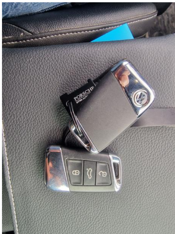
Fot. 35 Kluczyki