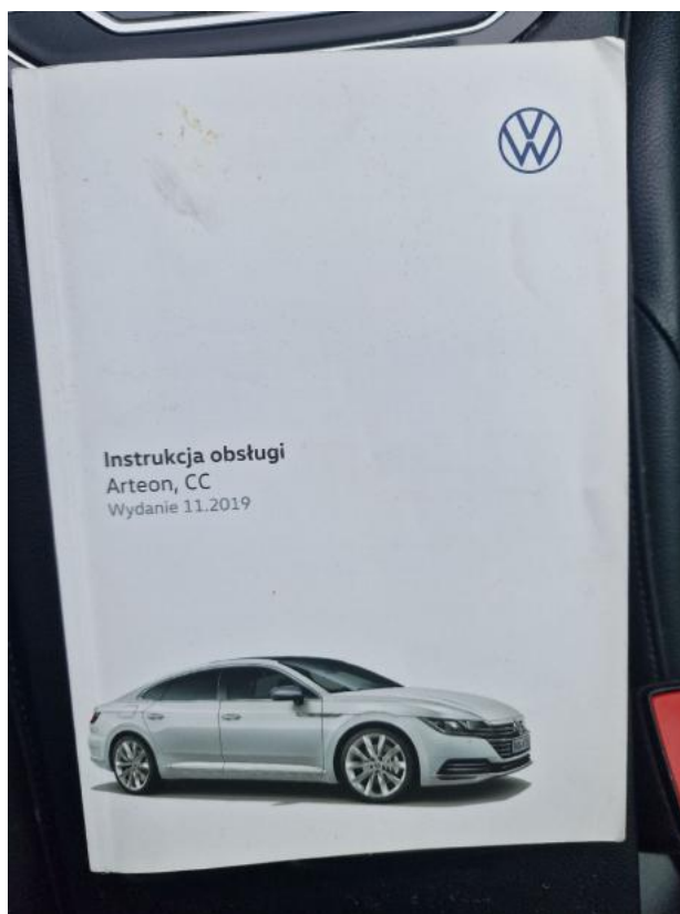
Fot. 34 Instrukcje