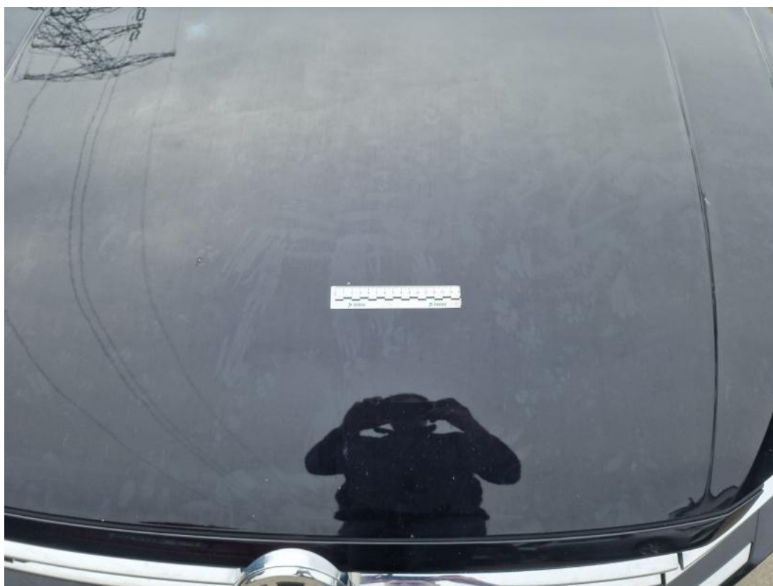
Fot. 36 Pokrywa komory silnika - zdjęcie poglądowe 1