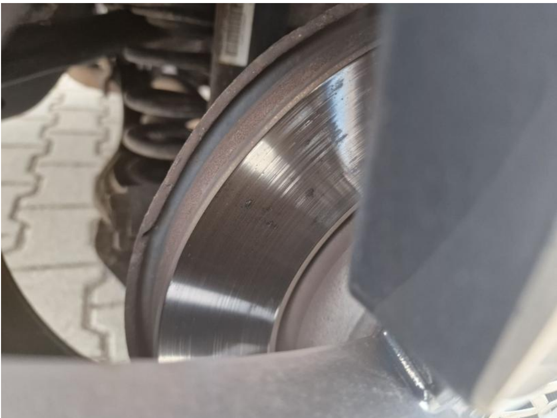
Fot. 30 Tarcza hamulcowa tylna prawa