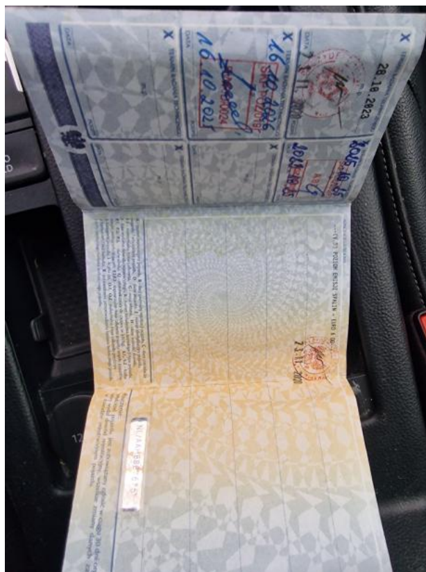
Fot. 33 Dowód rej. str. 2