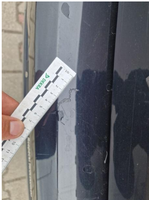
Fot. 40 Zderzak tylny - zdjęcie poglądowe 1