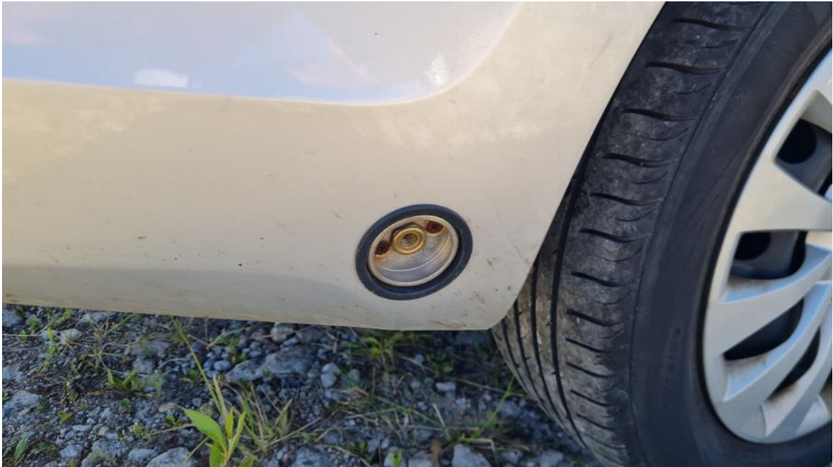
Fot. 33 Zdjęcie do protokołu