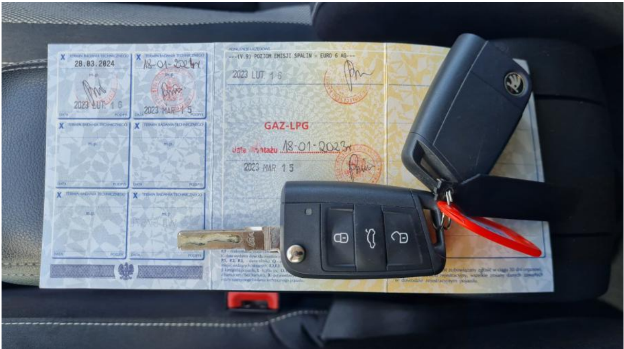
Fot. 29 Dow. Rej. Str.2 i klucze