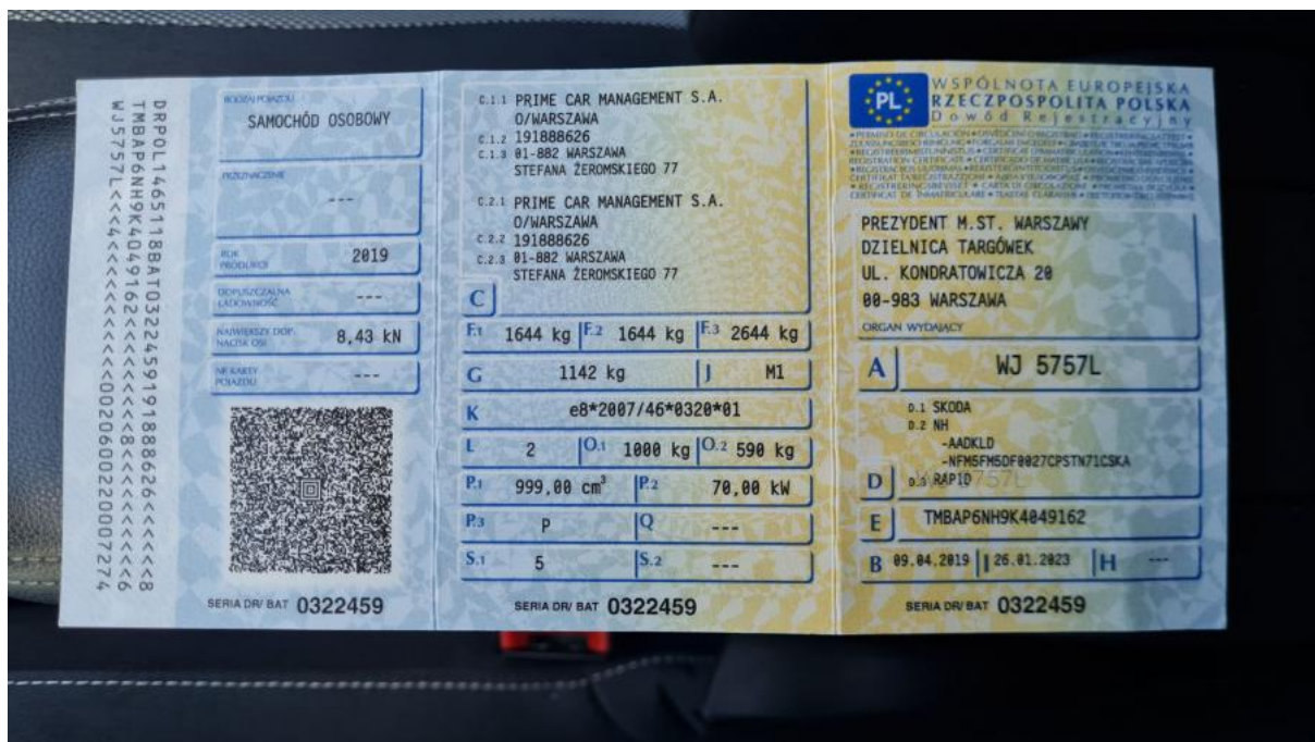
Fot. 28 Dowód rej. Str. 1