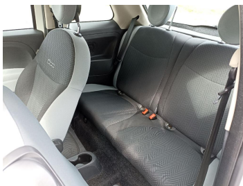
Widok przez otwarte drzwi tylne lewe