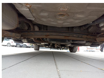
Spód pojazdu tył