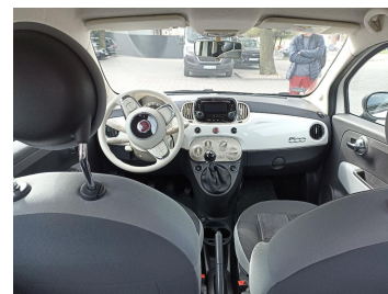
Widok z tylnej kanapy na deskę rozdz.