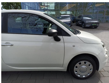
Bok prawy z przodu