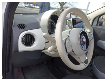
Kierownica z lewej strony