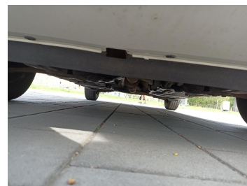
Spód pojazdu przód