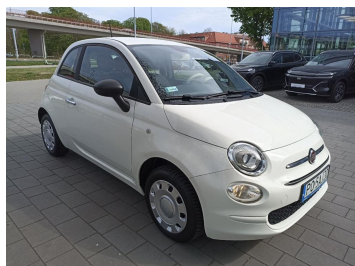
Przekątna przednia prawa