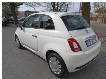
Przekątna tylna lewa