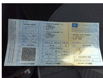
Dowód rej. Str. 1