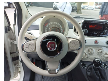
Kierownica (na wprost)