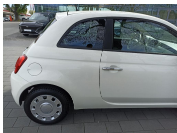
Bok prawy z tyłu