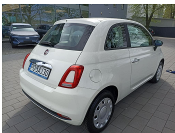
Przekątna tylna prawa