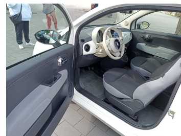
Widok przez otwarte drzwi przednie lewe