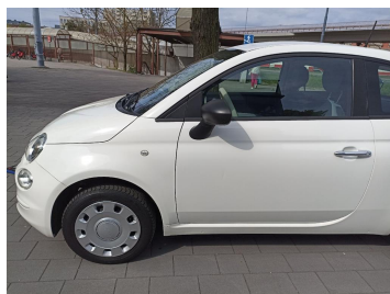
Bok lewy z przodu