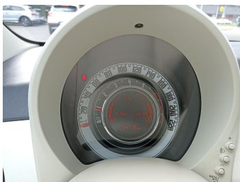
Zestaw wskaźników - przebieg