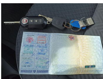
Dow. Rej. Str.2 i klucze