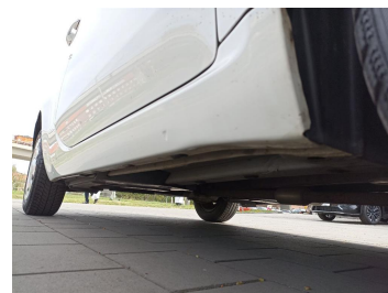
Próg prawy (widok od przodu)