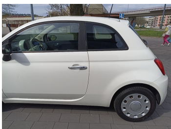
Bok lewy z tyłu