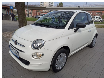
Przekątna przednia lewa