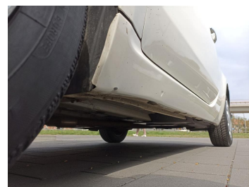
Próg lewy (widok od przodu)