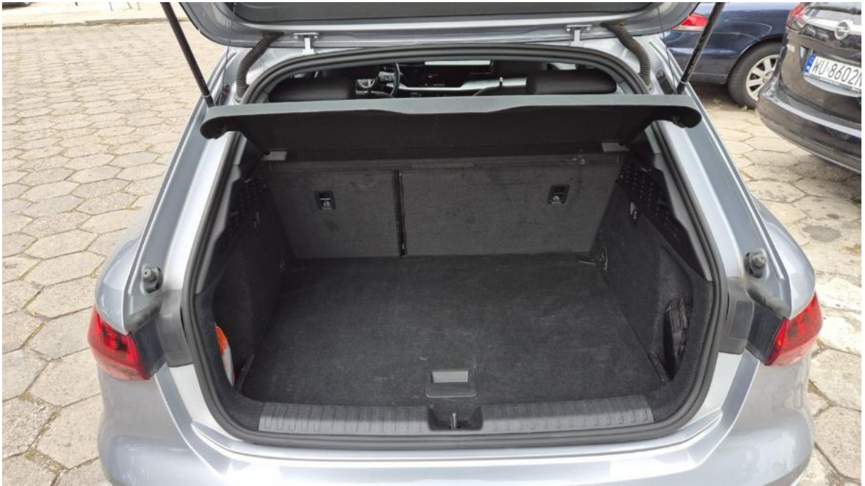
Fot. 25 Bagażnik