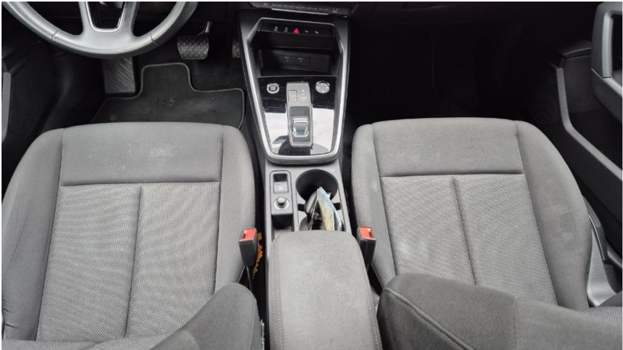
Fot. 21 Tunel środkowy