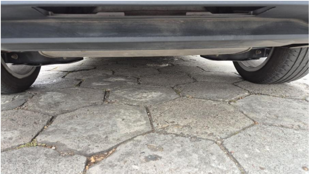
Fot. 27 Spód pojazdu tył