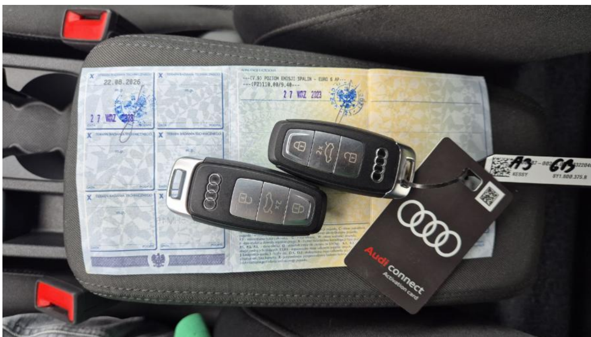
Fot. 29 Dow. Rej. Str.2 i klucze