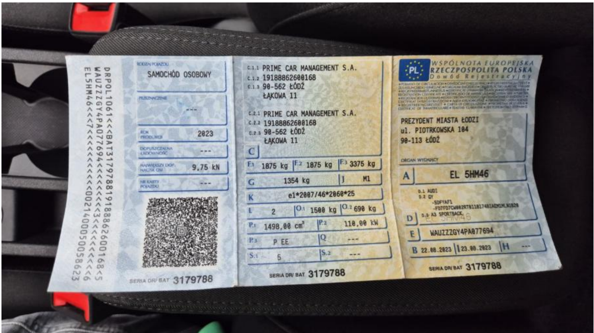
Fot. 28 Dowód rej. Str. 1