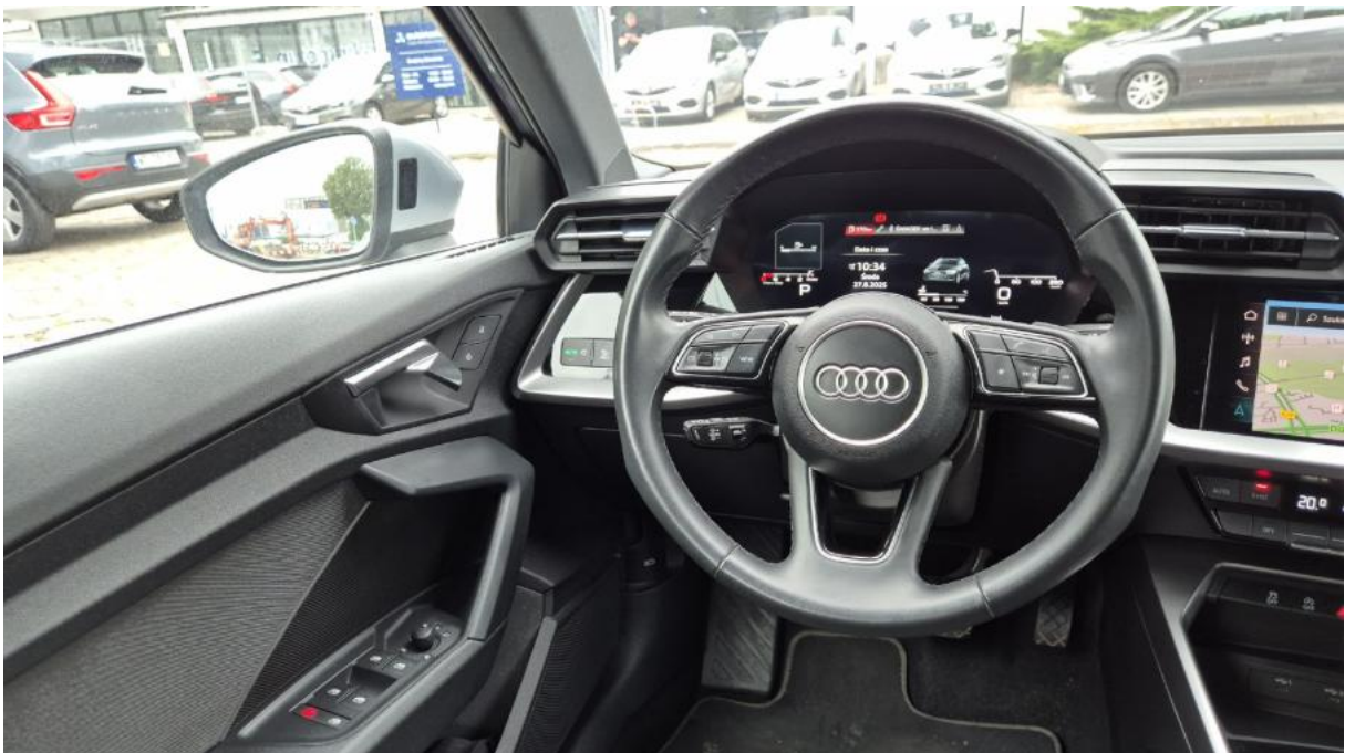
Fot. 22 Kierownica (na wprost)