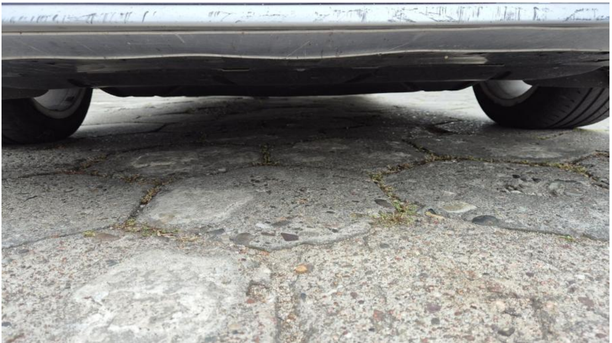
Fot. 26 Spód pojazdu przód