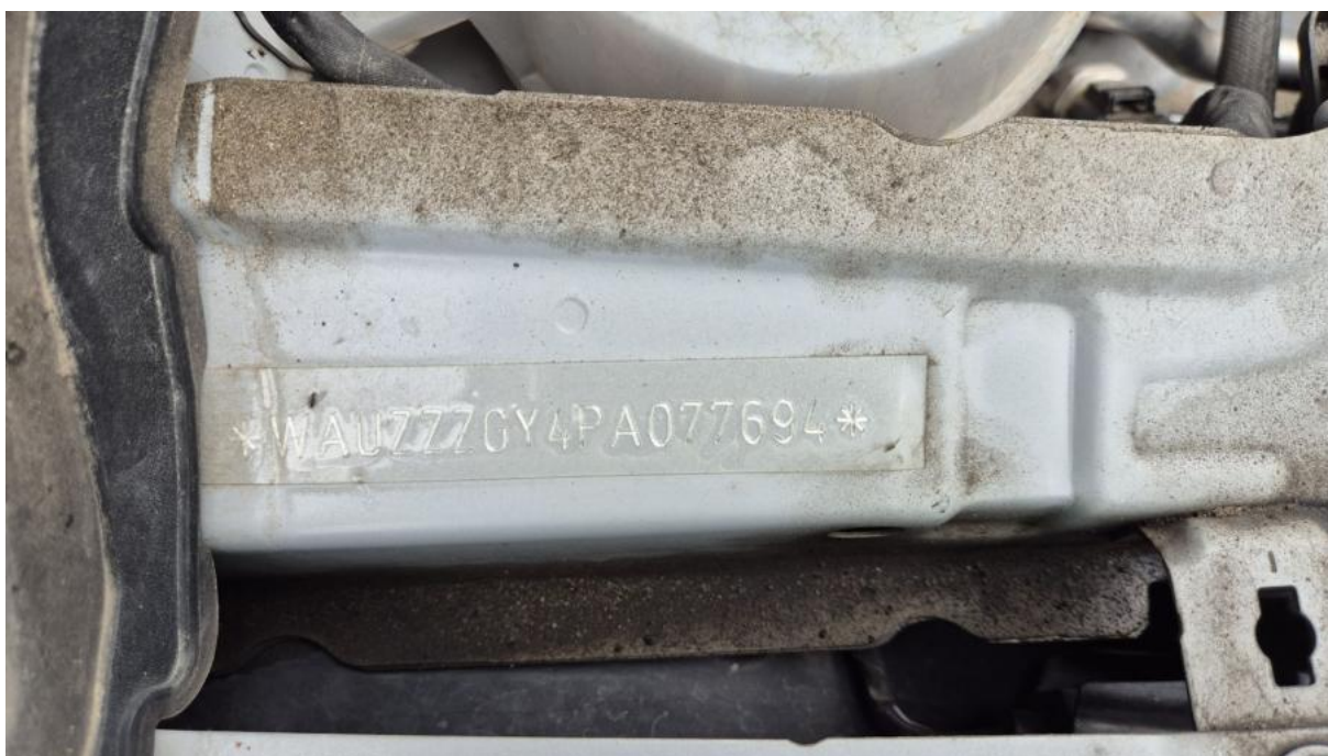
Fot. 13 Numer identyfikacyjny