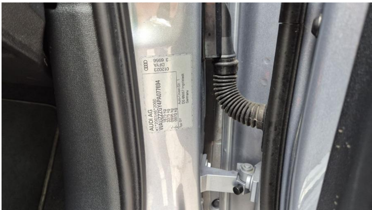
Fot. 14 Tabliczka znamionowa