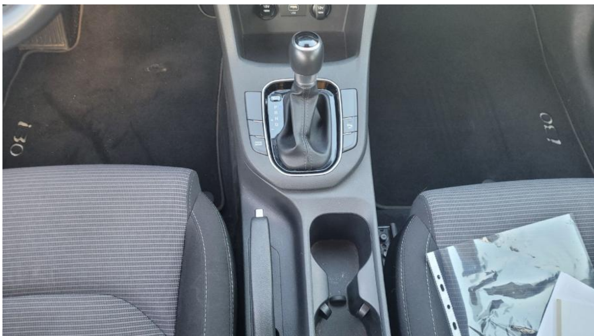
Fot. 20 Tunel środkowy