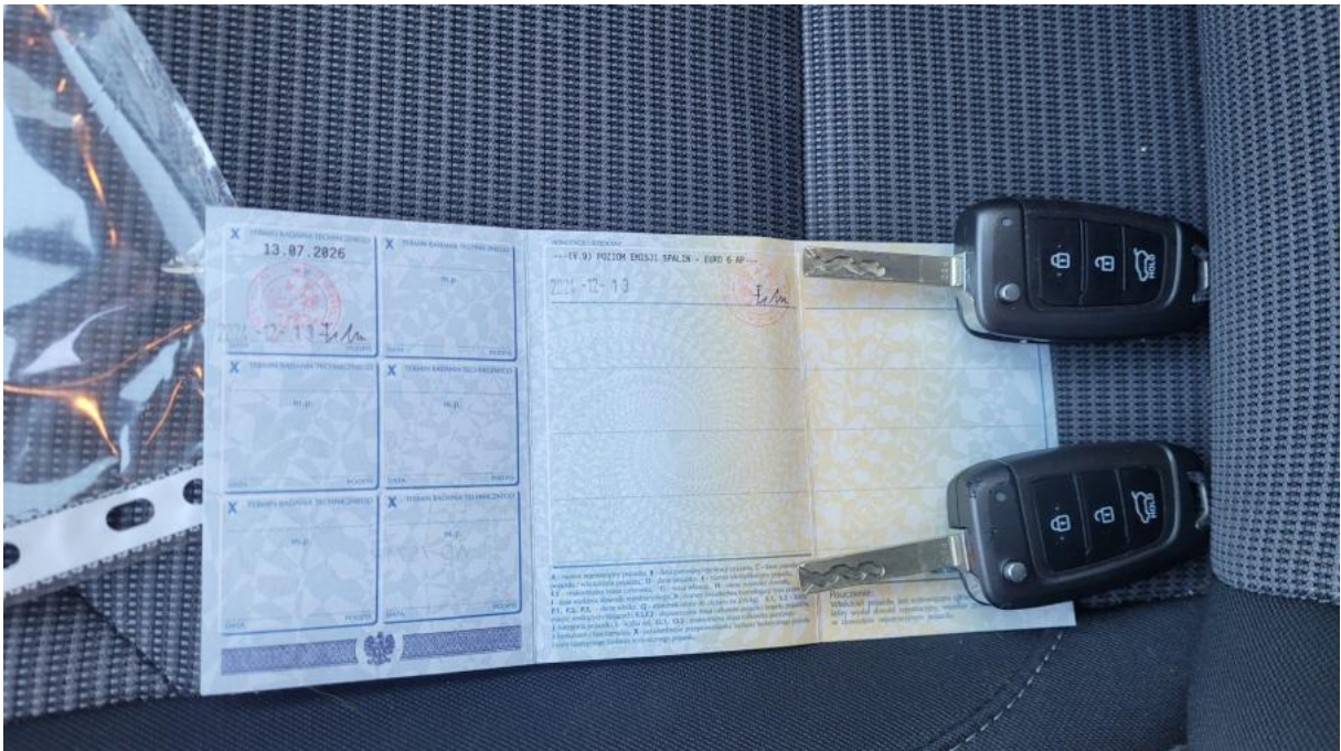
Fot. 29 Dow. Rej. Str.2 i klucze