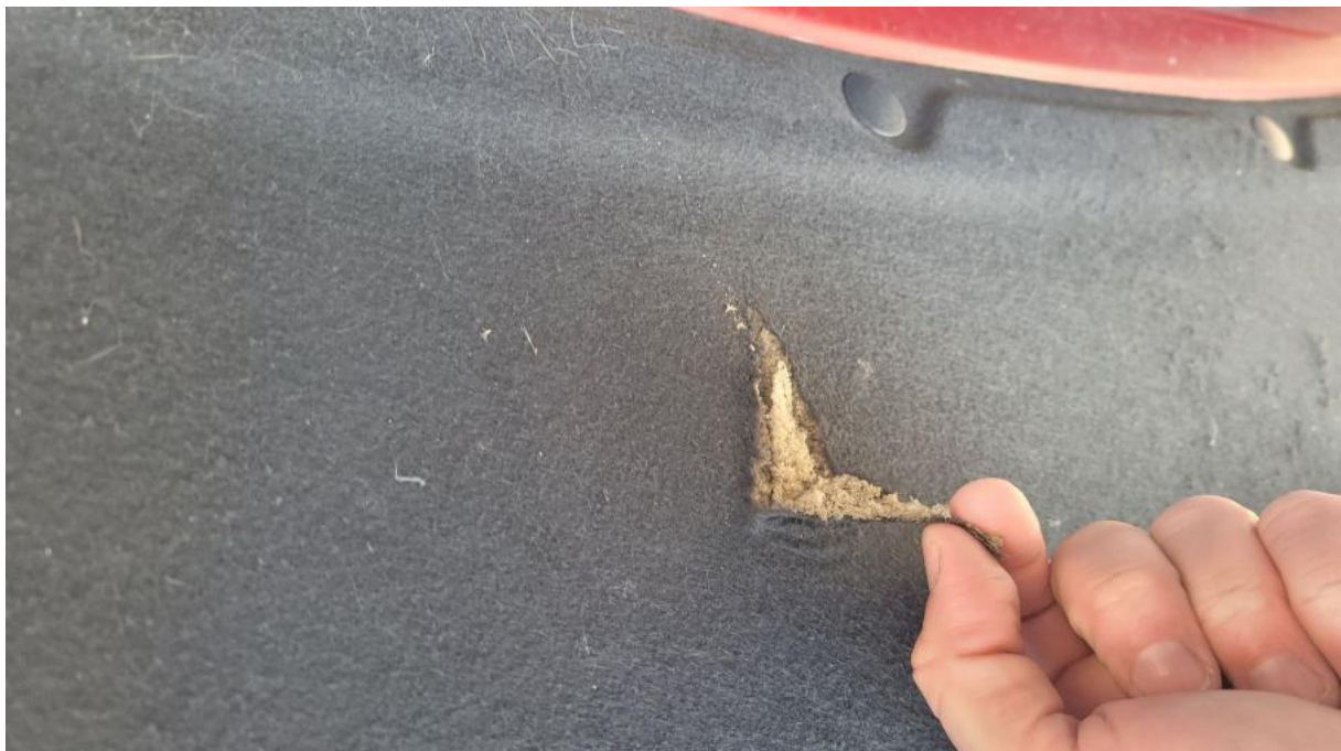
Fot. 32 Wykładzina pokrywy komory silnika - Pęknięcie/rozerwanie 1