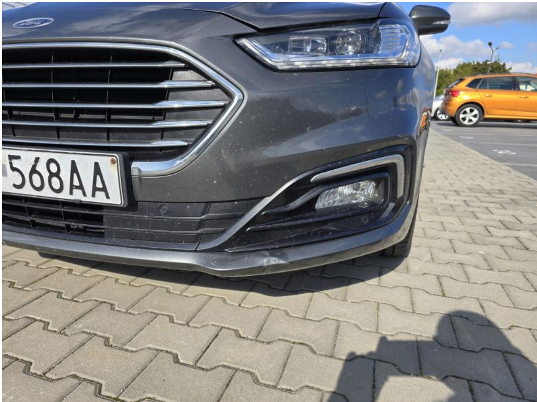
Fot. 37 Zderzak przedni cz L - Wgniecenie/odkształcenie 1