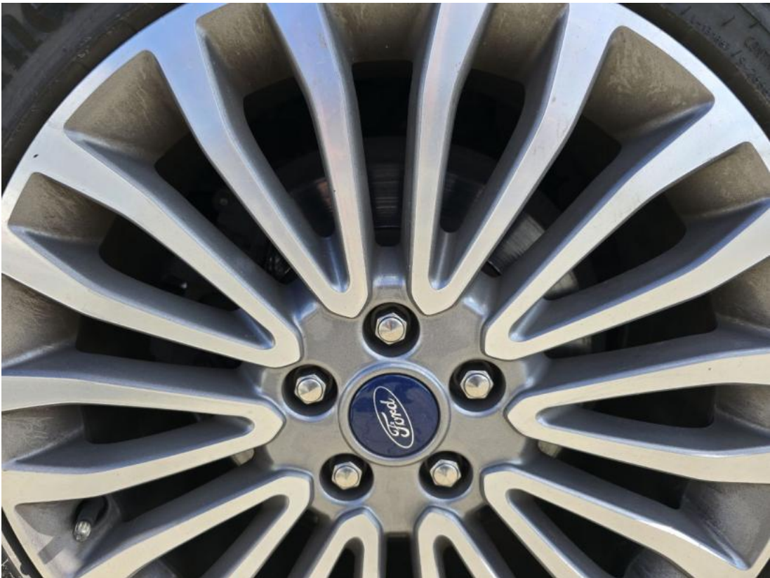
Fot. 29 Tarcza hamulcowa tylna prawa