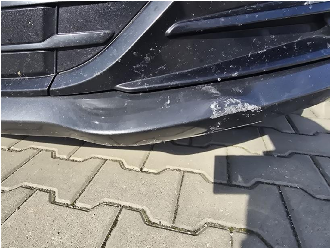
Fot. 35 Zderzak przedni cz L - zdjęcie poglądowe 1