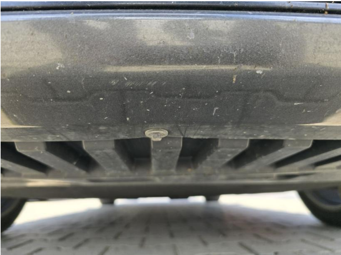
Fot. 25 Spód pojazdu przód