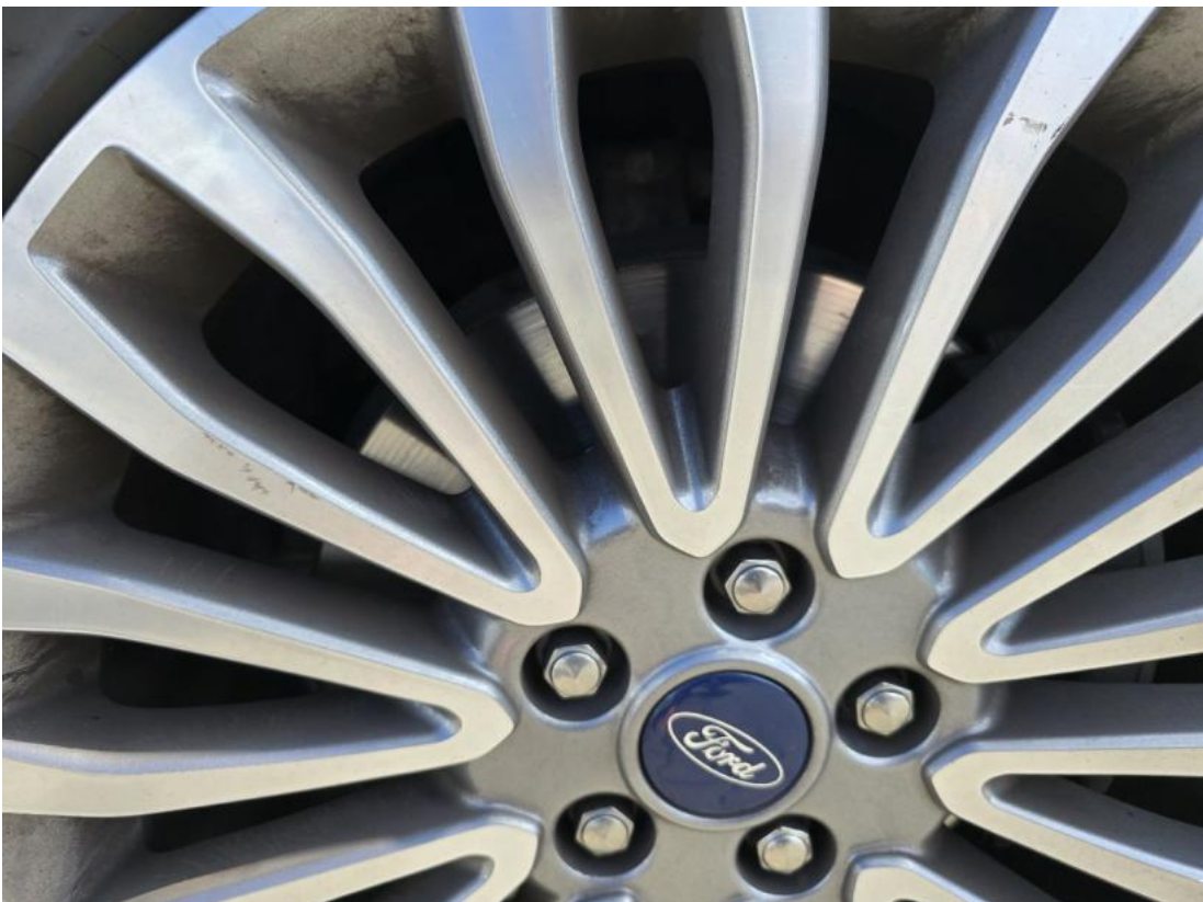
Fot. 28 Tarcza hamulcowa przednia prawa