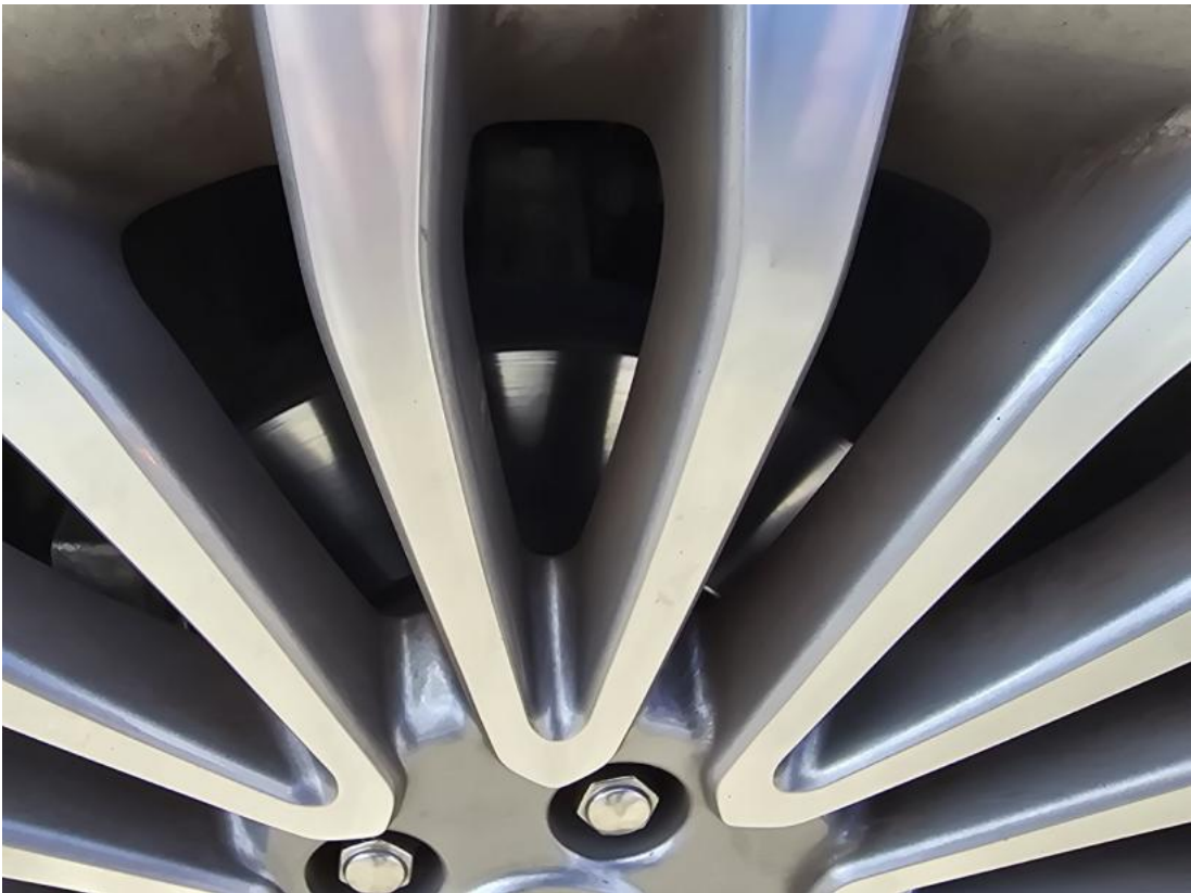
Fot. 27 Tarcza hamulcowa przednia lewa