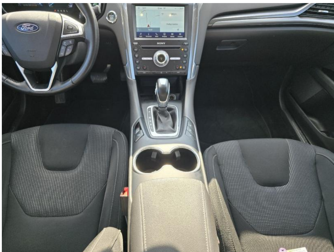
Fot. 20 Tunel środkowy