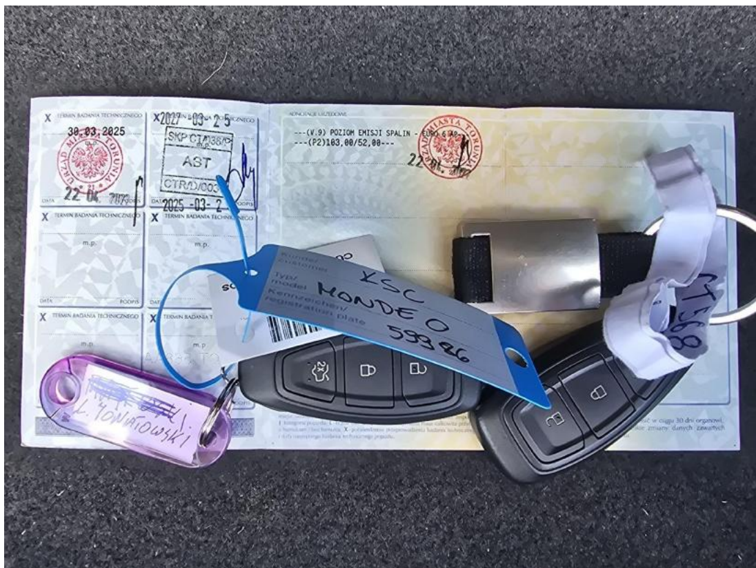
Fot. 32 Dow. Rej. Str.2 i klucze