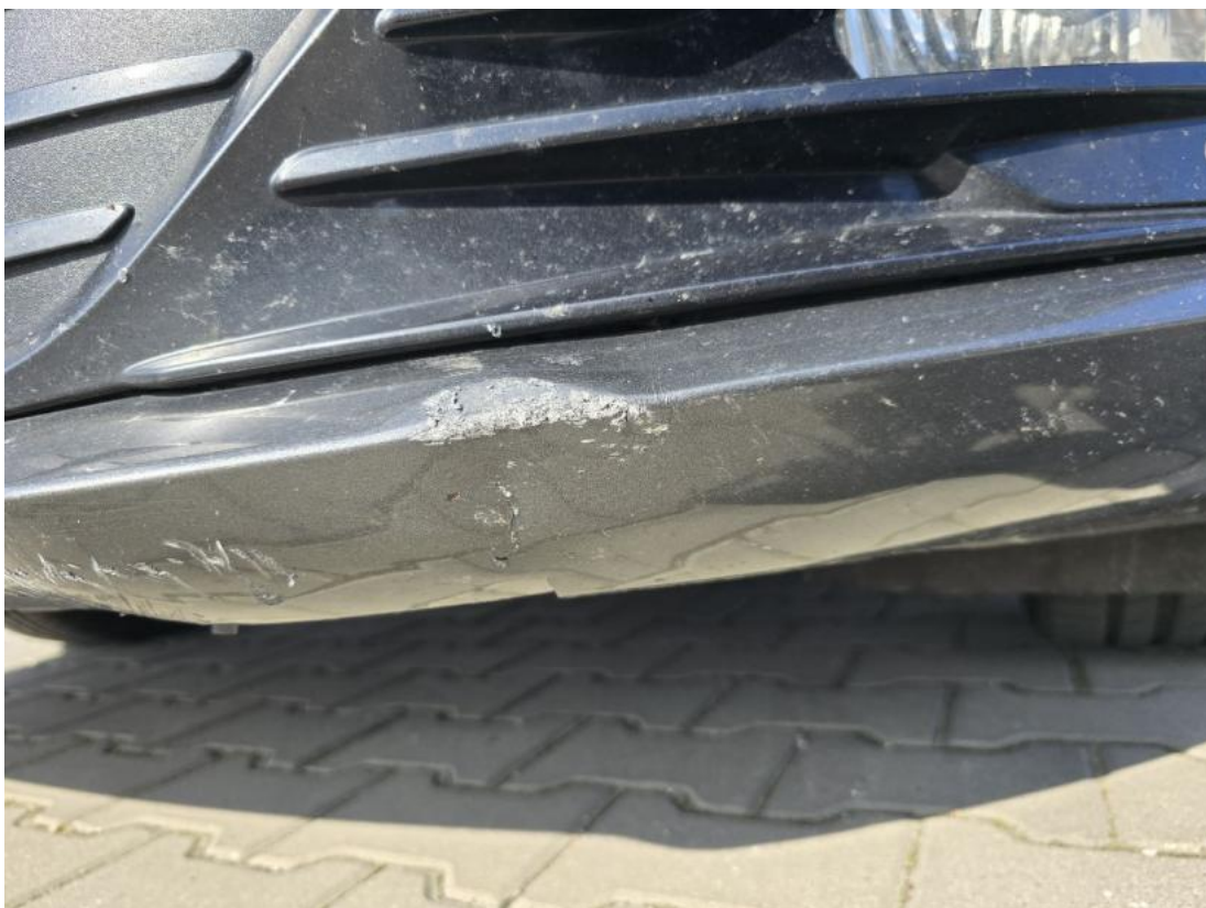
Fot. 38 Zderzak przedni cz L - Wgniecenie/odkształcenie 2