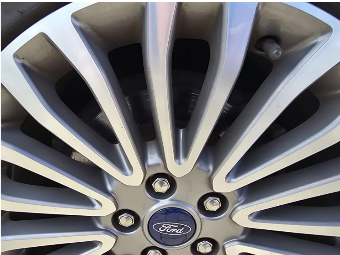
Fot. 30 Tarcza hamulcowa tylna lewa