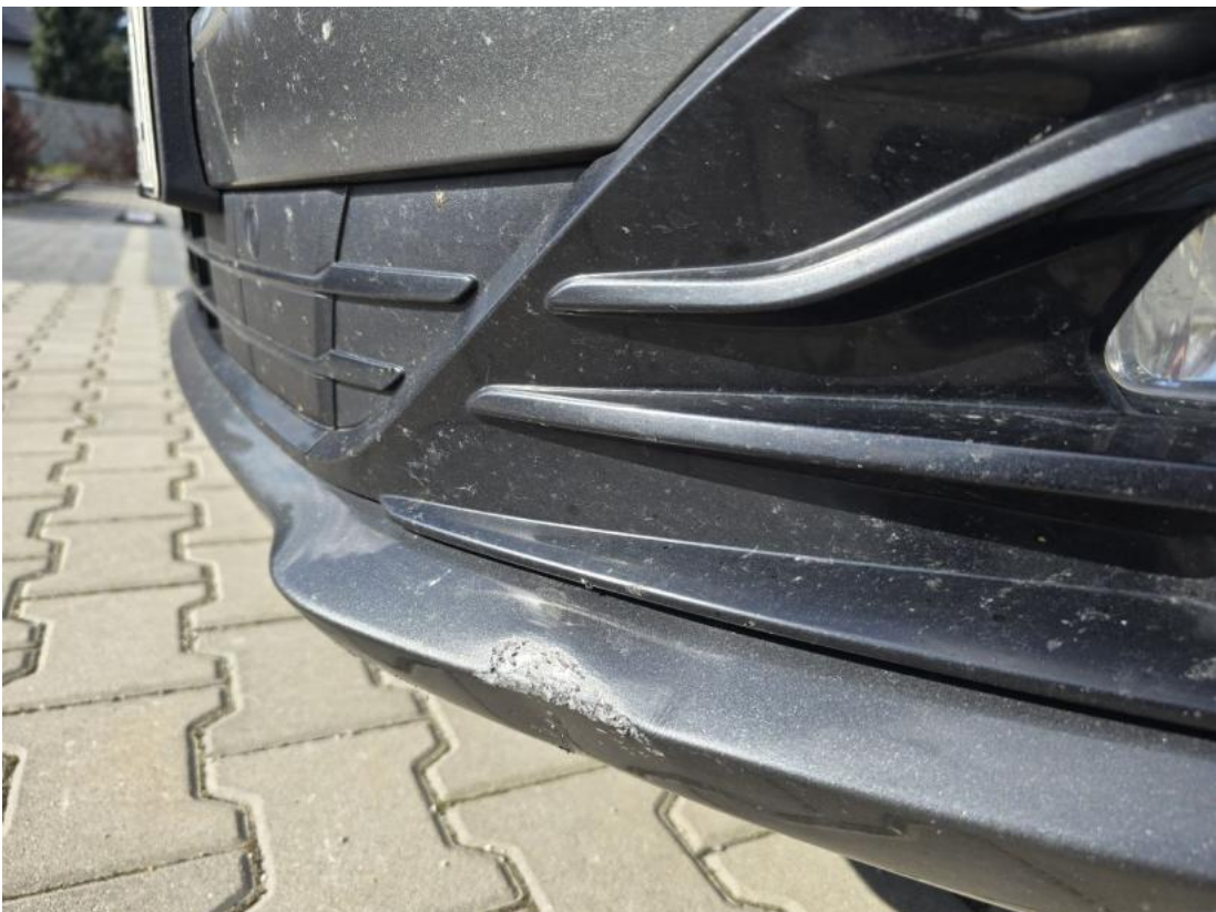
Fot. 36 Zderzak przedni cz L - zdjęcie poglądowe 2