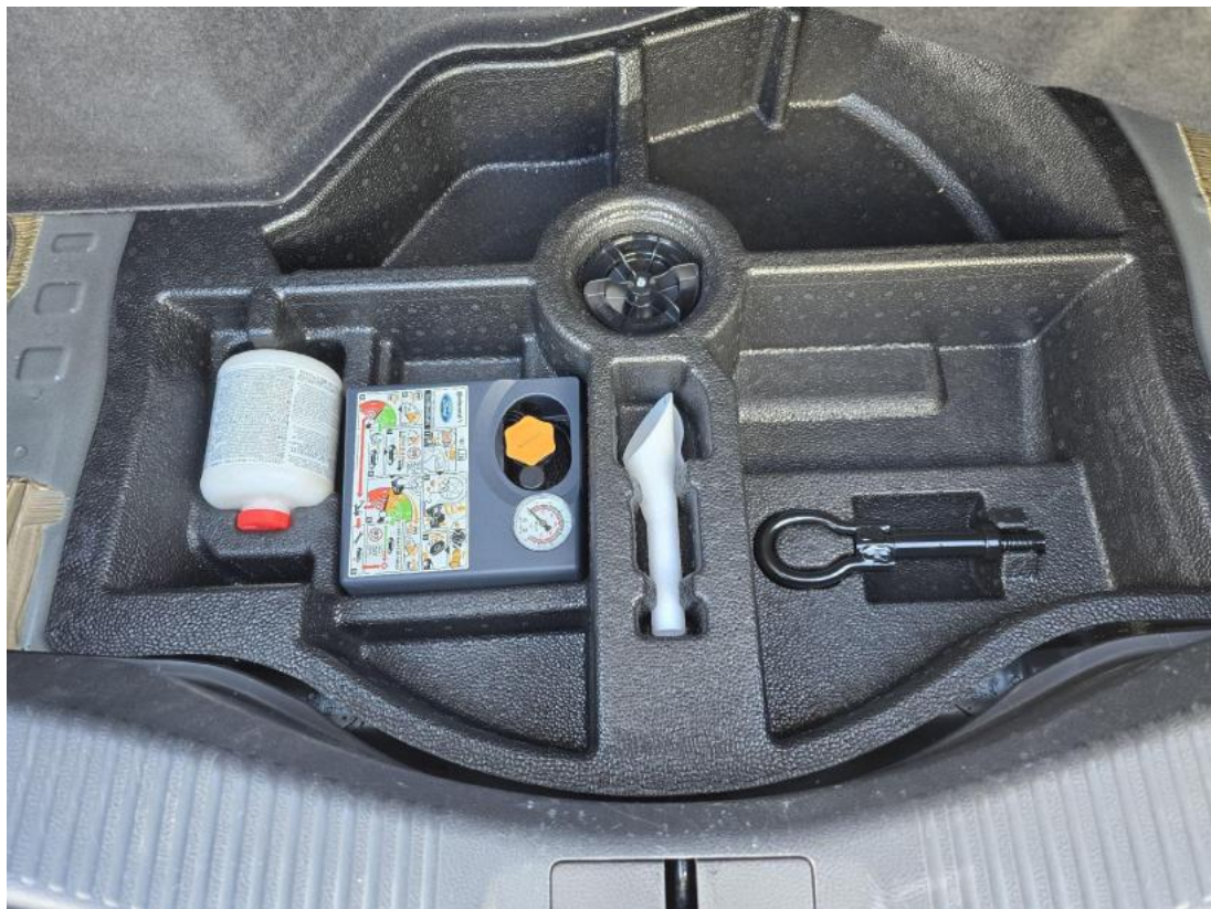
Fot. 34 Zestaw naprawy koła