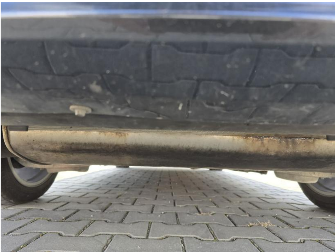
Fot. 26 Spód pojazdu tył