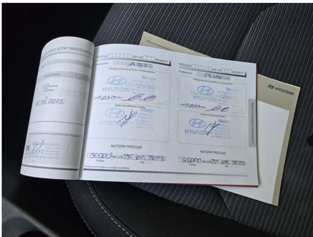
Fot. 35 Książka serwisowa – ostatni przegląd