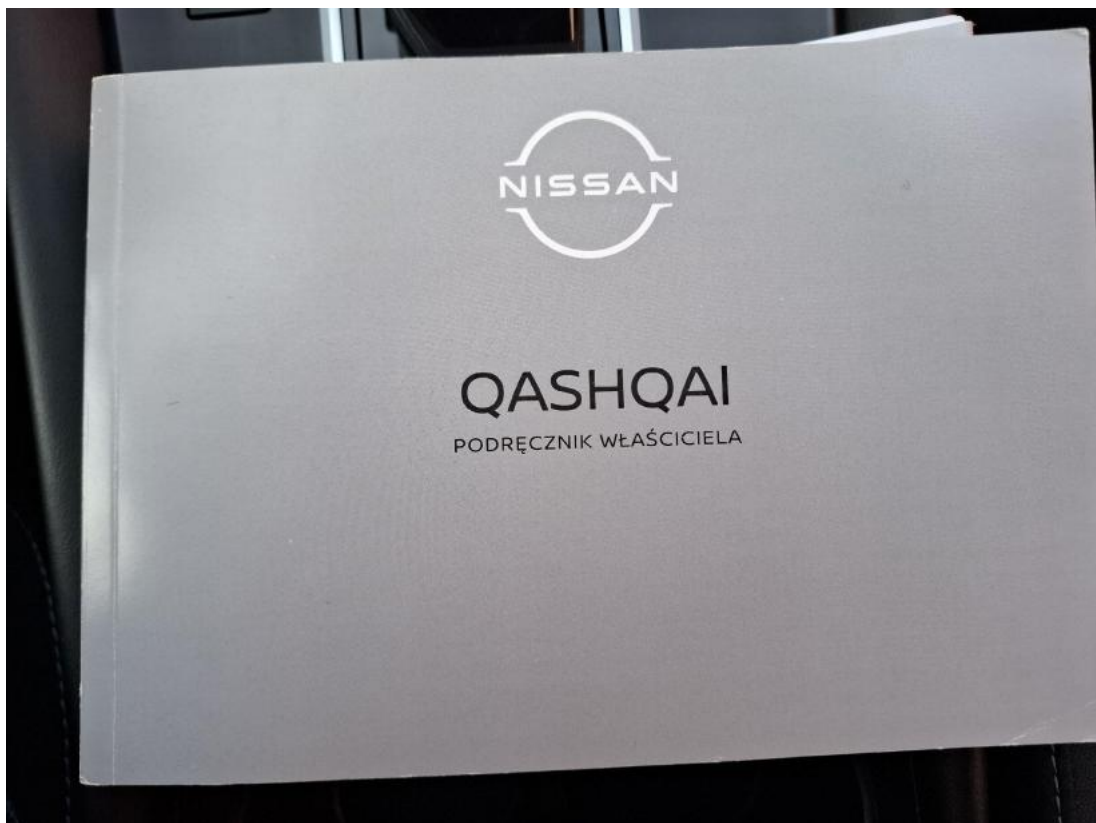
Fot. 36 Instrukcje