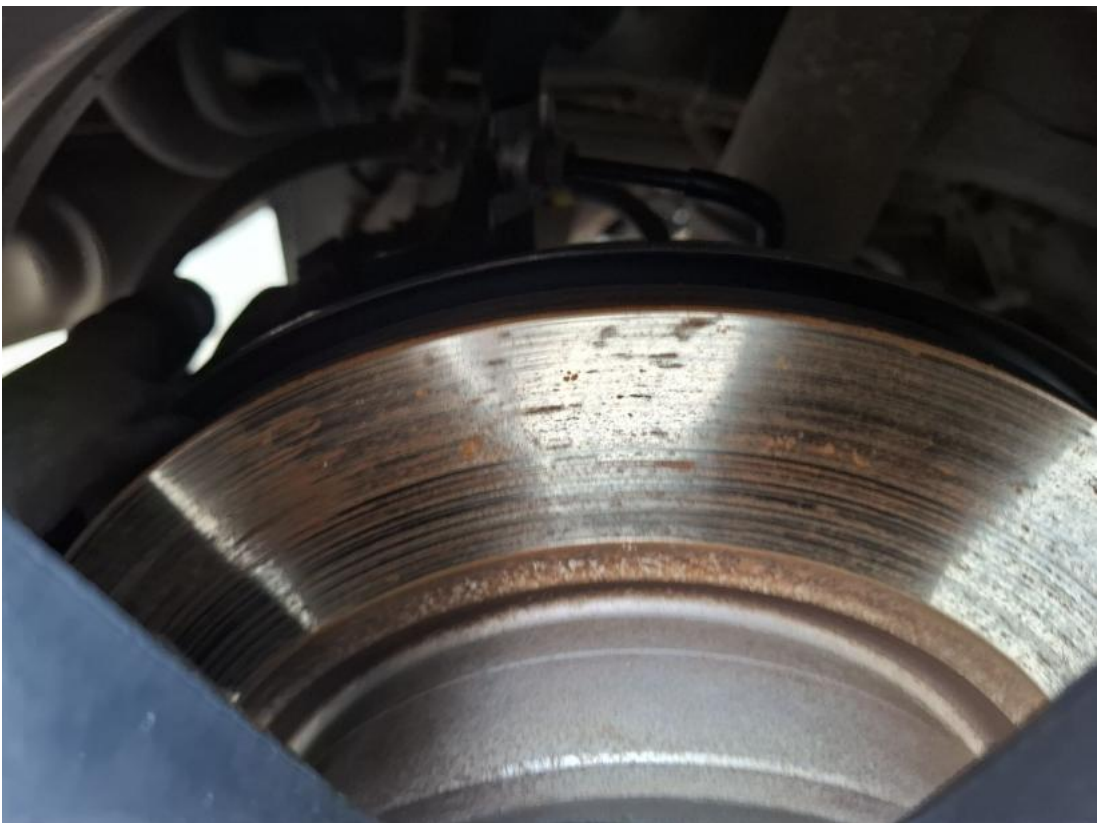
Fot. 30 Tarcza hamulcowa tylna prawa