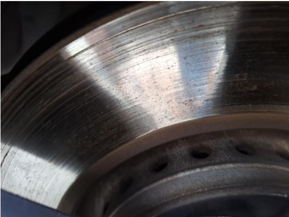
Fot. 29 Tarcza hamulcowa przednia prawa