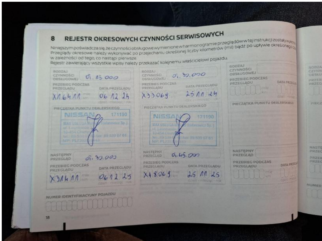
Fot. 35 Książka serwisowa – ostatni przegląd