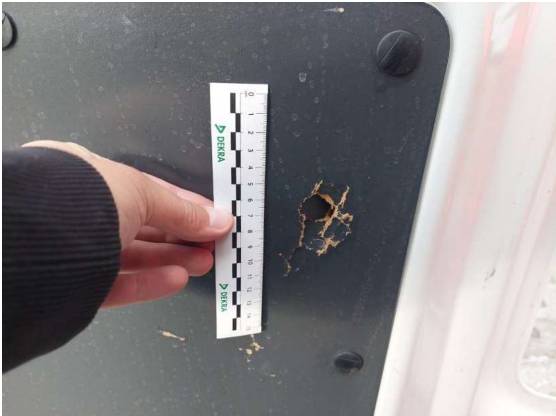
Fot. 53 Wykładzina pokrywy tylnej - Pęknięcie/rozerwanie 2