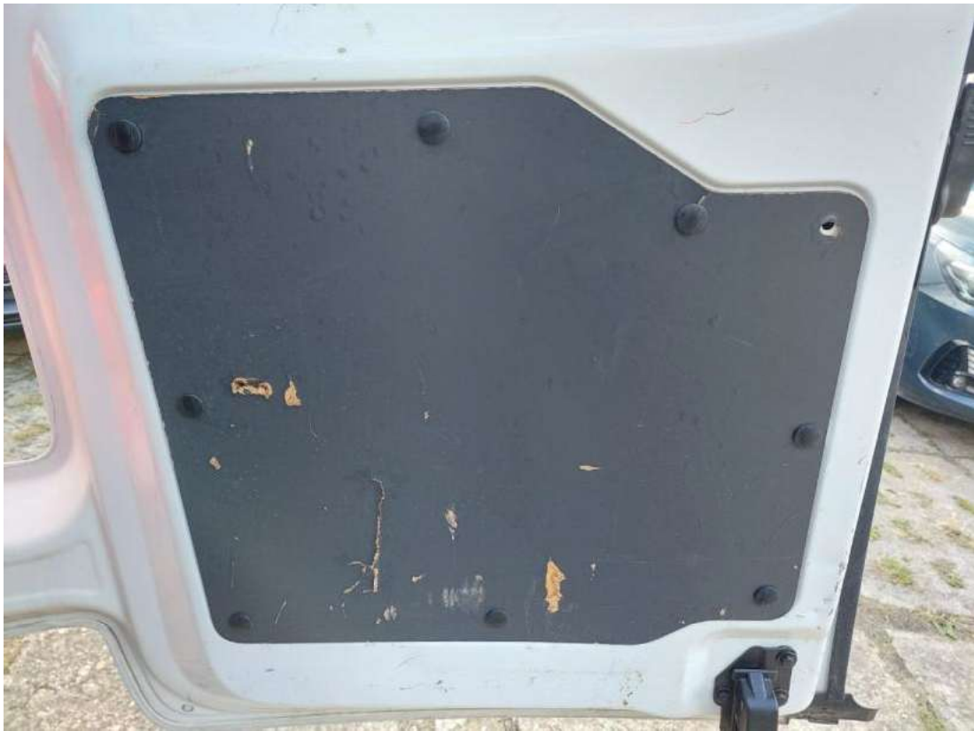
Fot. 51 Wykładzina pokrywy tylnej - zdjęcie poglądowe 2