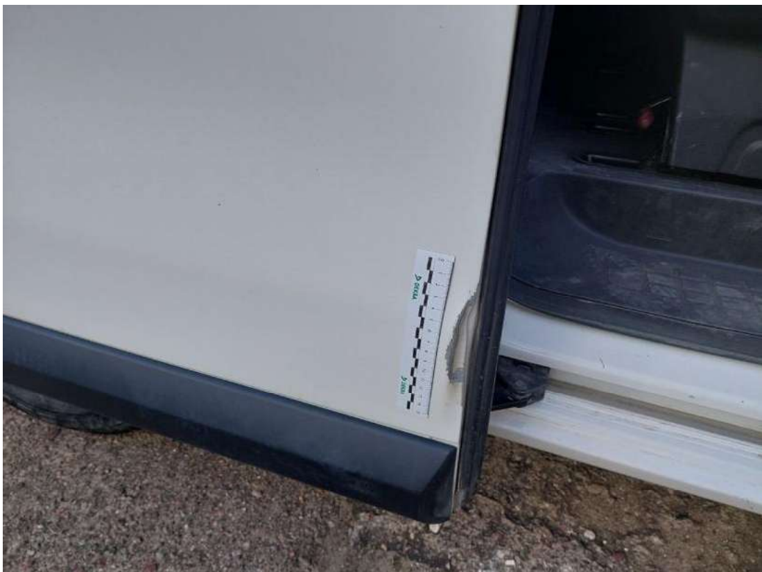
Fot. 38 Drzwi tylne P - zdjęcie poglądowe 1