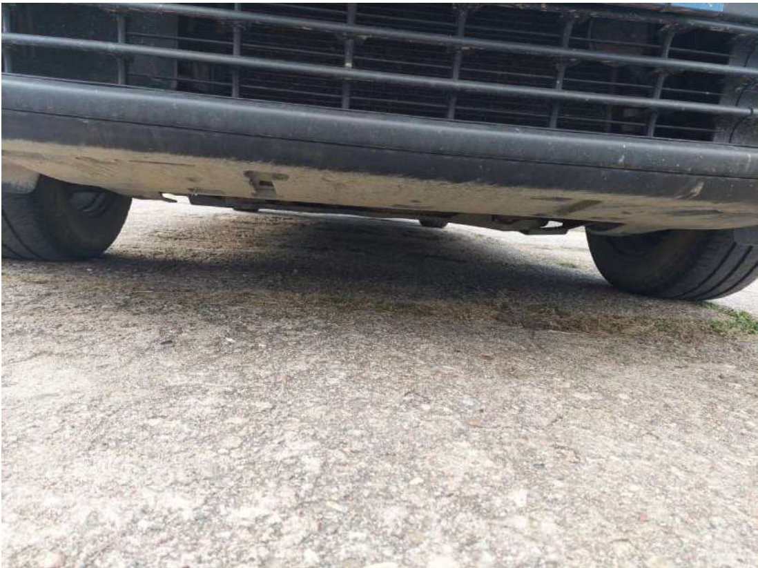
Fot. 27 Spód pojazdu przód