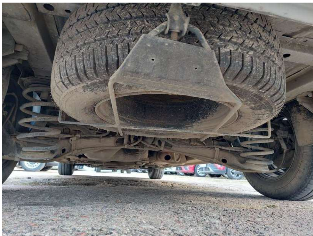
Fot. 26 Koło zapasowe