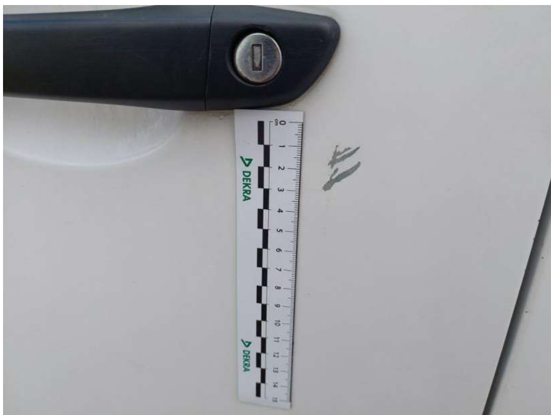
Fot. 45 Drzwi przed L - Rysa/odprysk 1