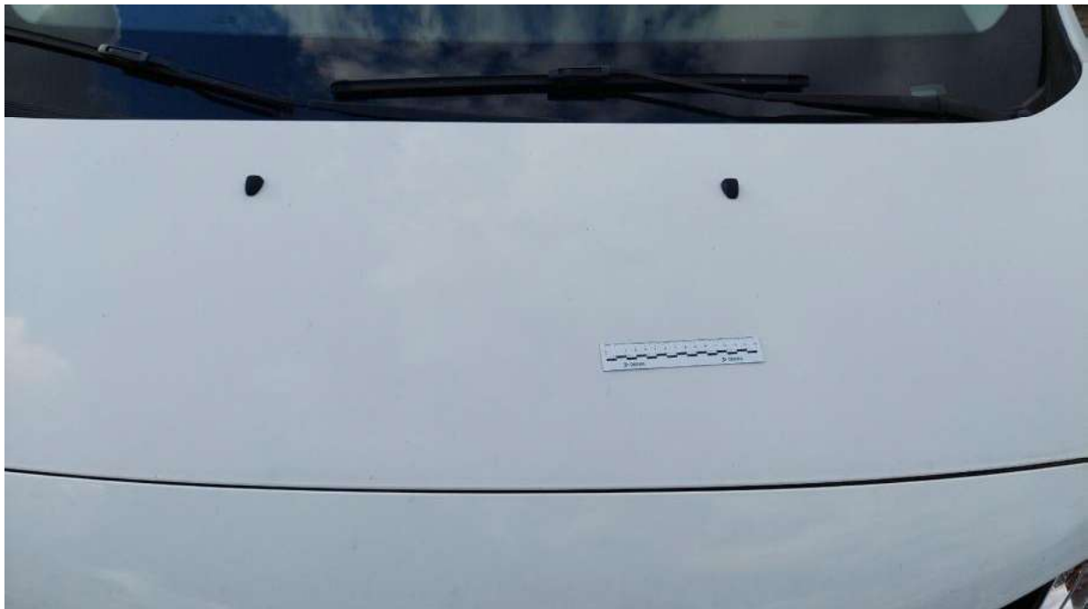
Fot. 36 Pokrywa komory silnika - Rysa/odprysk 1