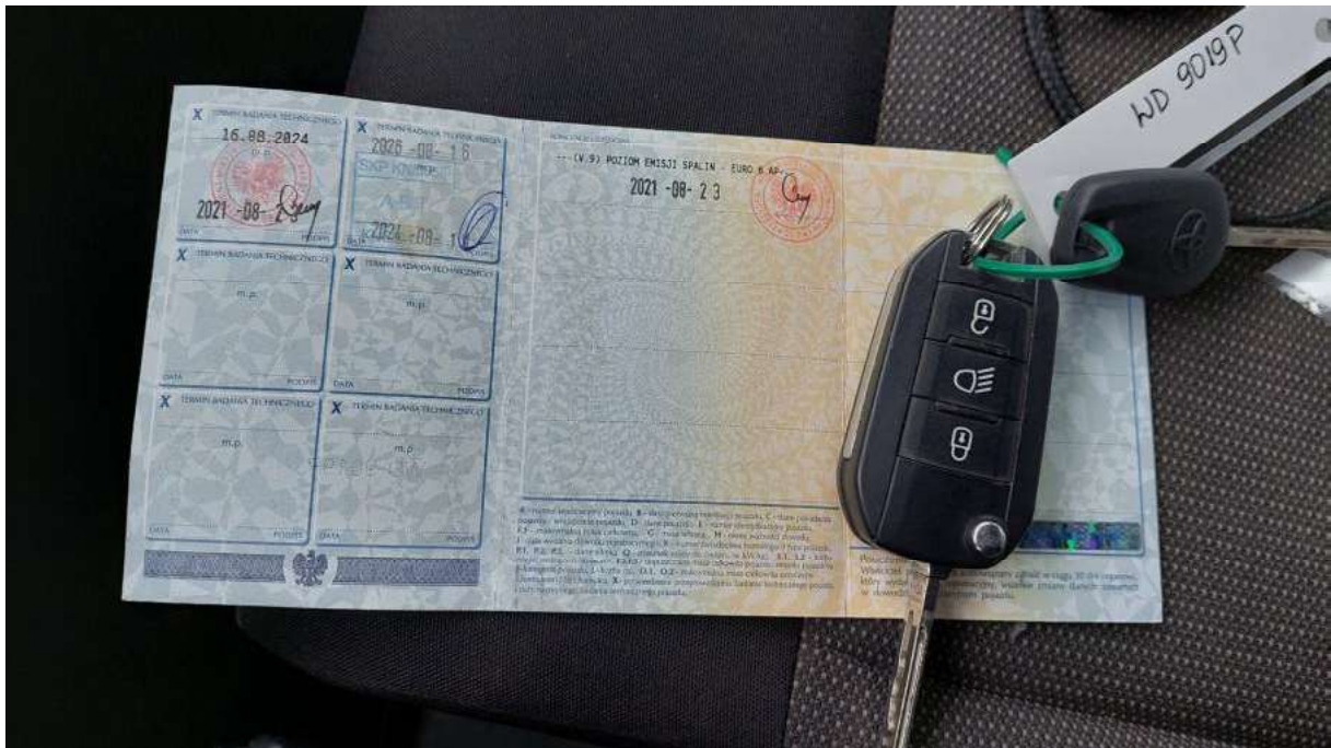
Fot. 34 Dow. Rej. Str.2 i klucze