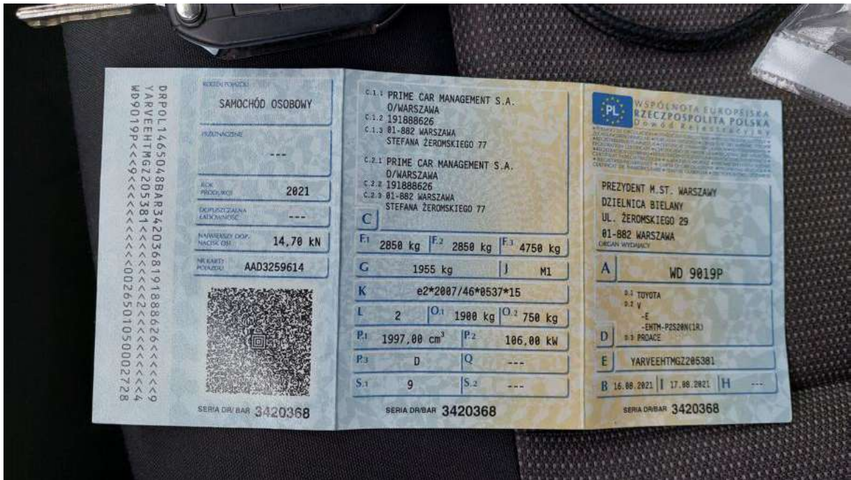
Fot. 33 Dowód rej. Str. 1