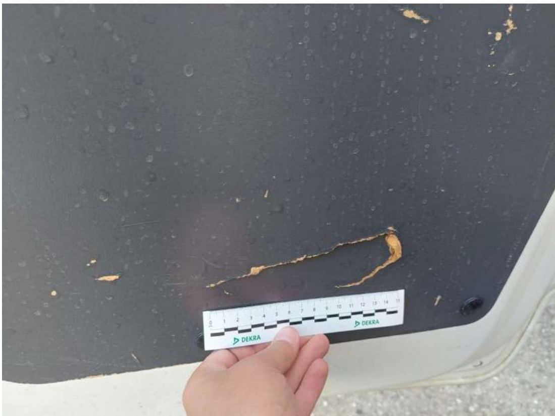
Fot. 52 Wykładzina pokrywy tylnej - Pęknięcie/rozerwanie 1