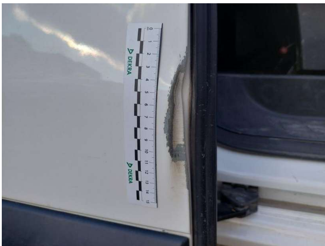
Fot. 40 Drzwi tylne P - Wgniecenie/odkształcenie 1