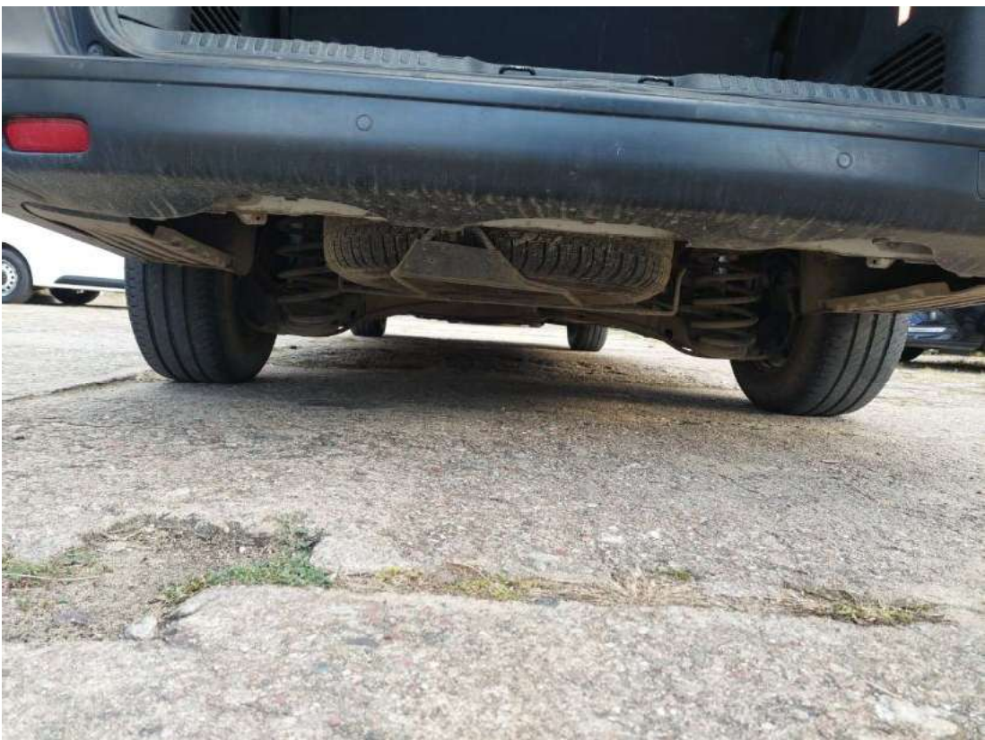
Fot. 28 Spód pojazdu tył