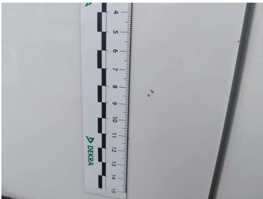
Fot. 46 Drzwi przed L - Rysa/odprysk 2