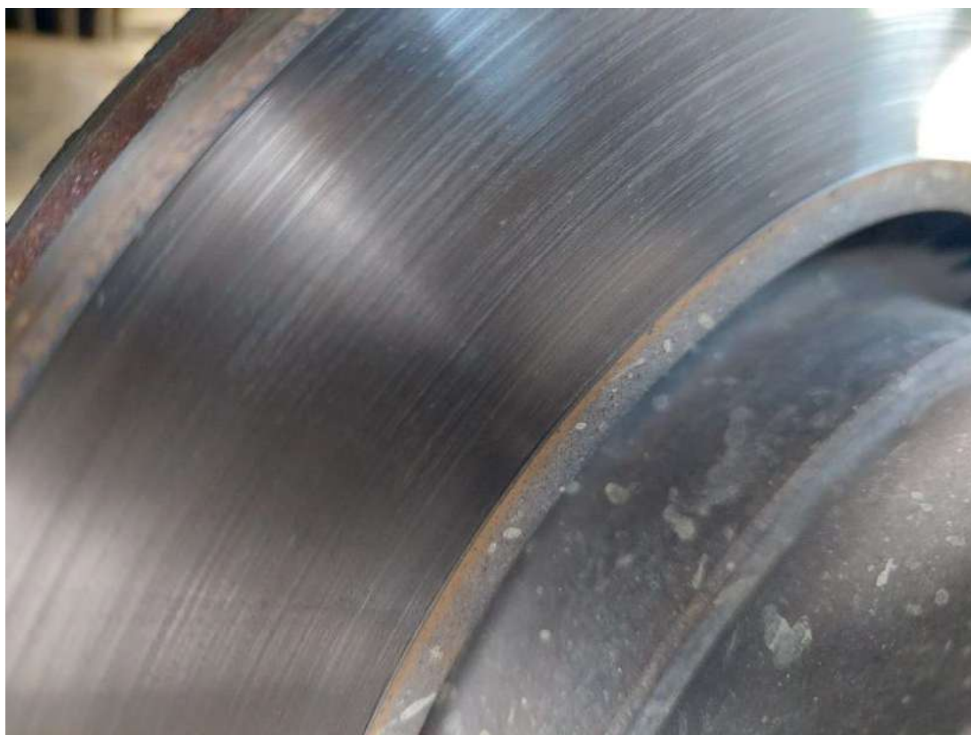
Fot. 32 Tarcza hamulcowa tylna lewa