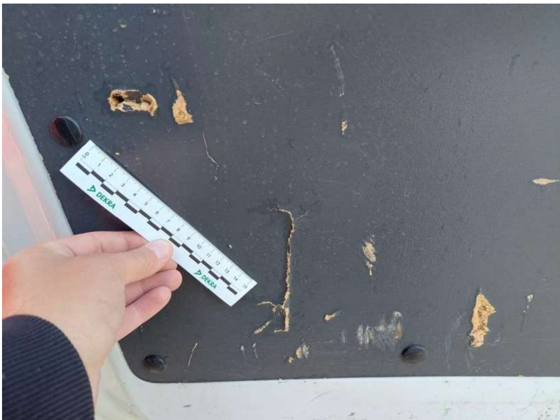
Fot. 54 Wykładzina pokrywy tylnej() - Pęknięcie/rozerwanie 3