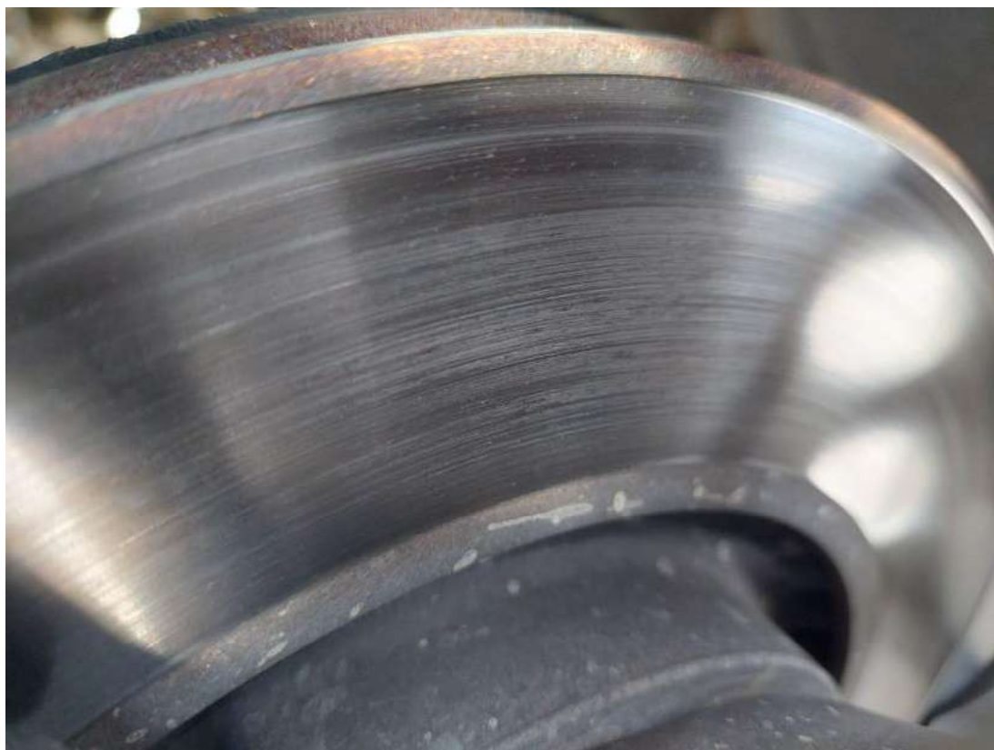
Fot. 31 Tarcza hamulcowa tylna prawa