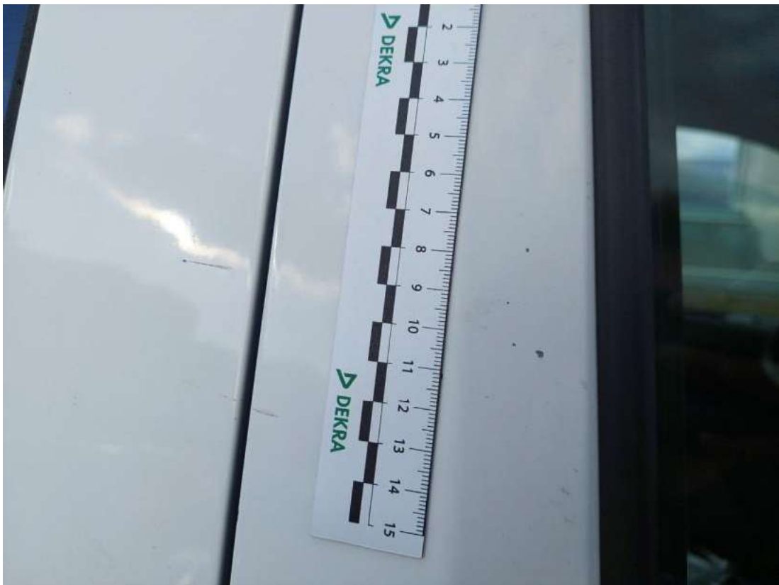
Fot. 37 Drzwi przednie P - Rysa/odprysk 1