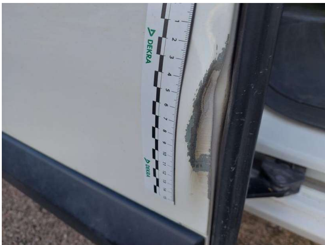
Fot. 39 Drzwi tylne P - Rysa/odprysk 1