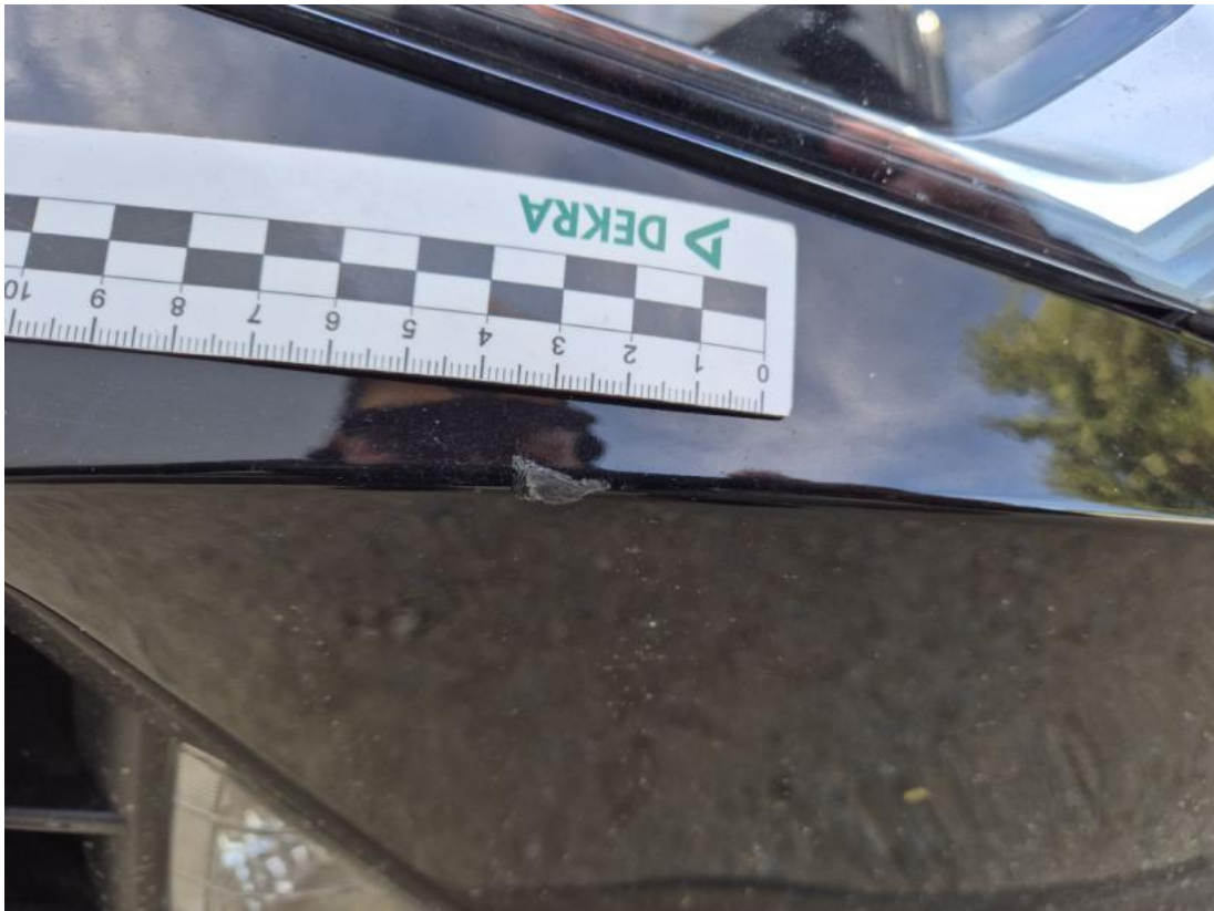
Fot. 37 Zderzak - Rysa/odprysk 2