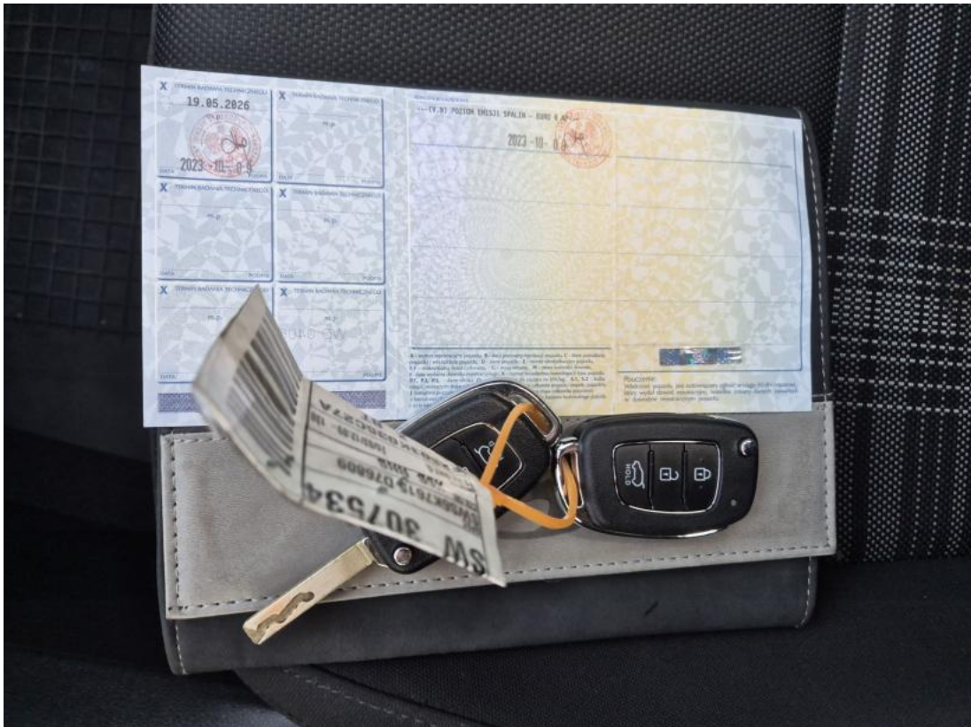
Fot. 31 Dow. Rej. Str.2 i klucze