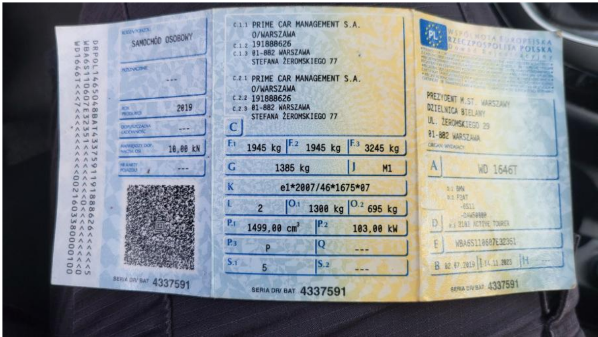
Fot. 27 Dowód rej. Str. 1