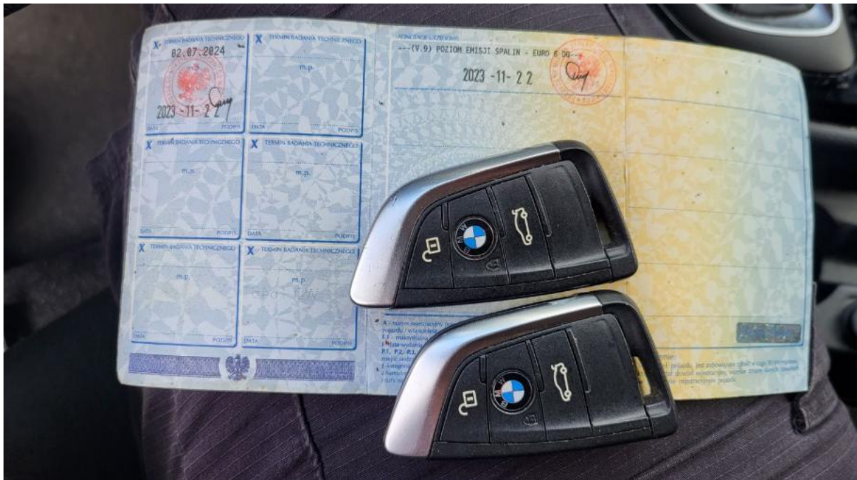
Fot. 28 Dow. Rej. Str.2 i klucze