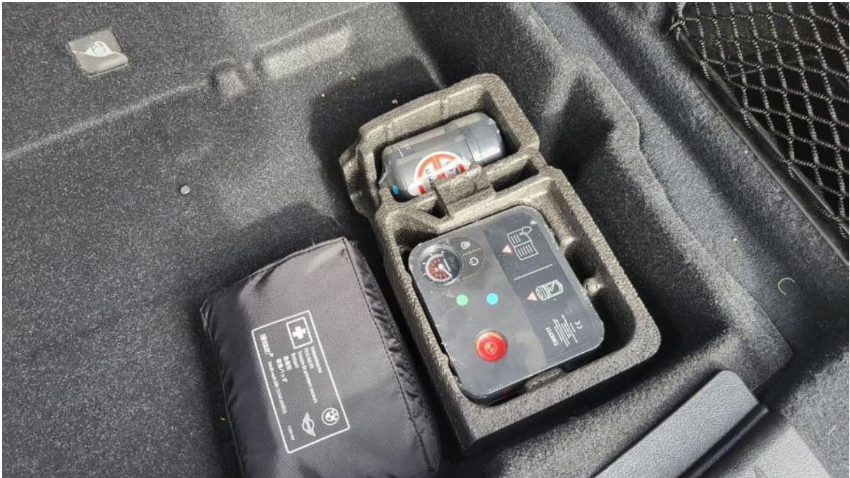
Fot. 31 Zestaw naprawy koła