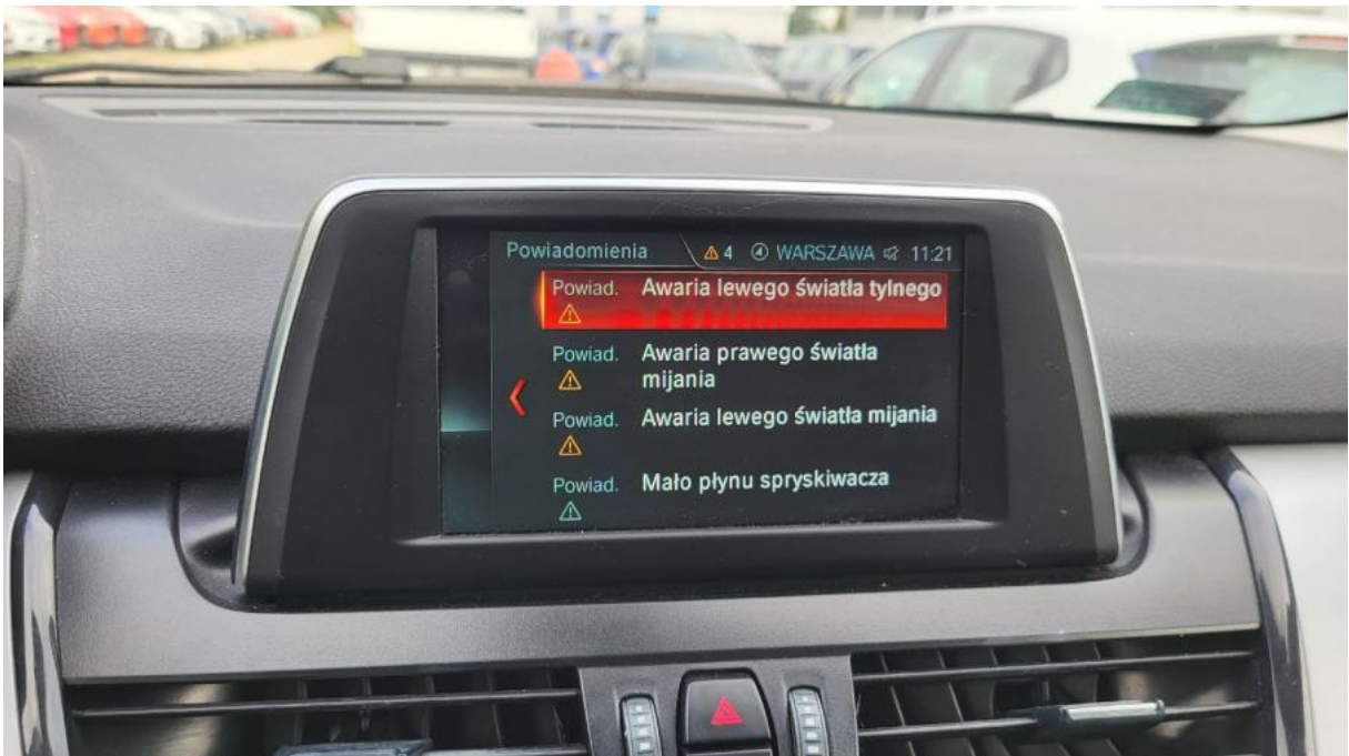
Fot. 32 Zdjęcie do protokołu