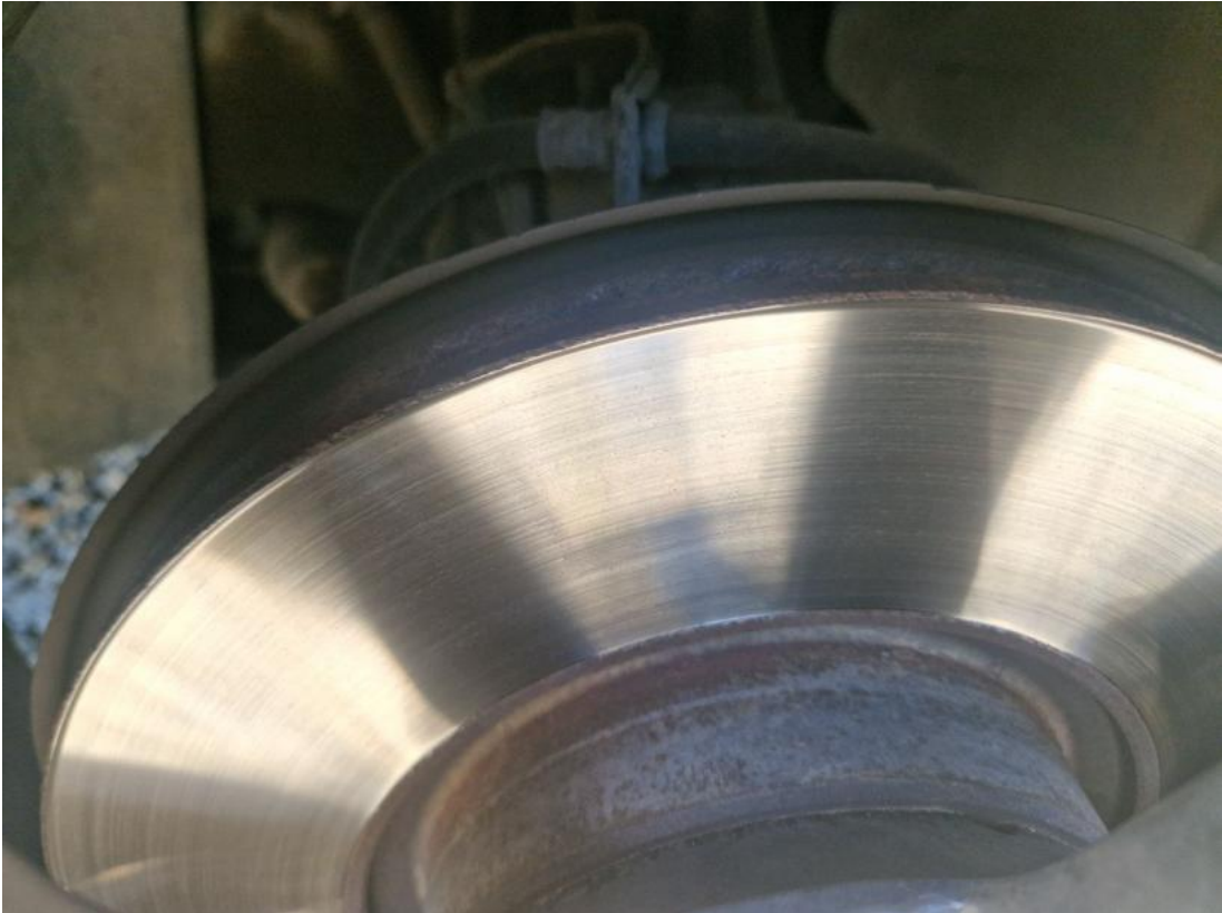
Fot. 29 Tarcza hamulcowa przednia prawa