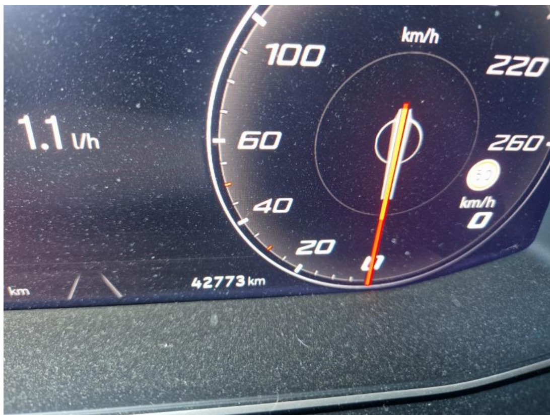
Fot. 35 Przebieg pojazdu.