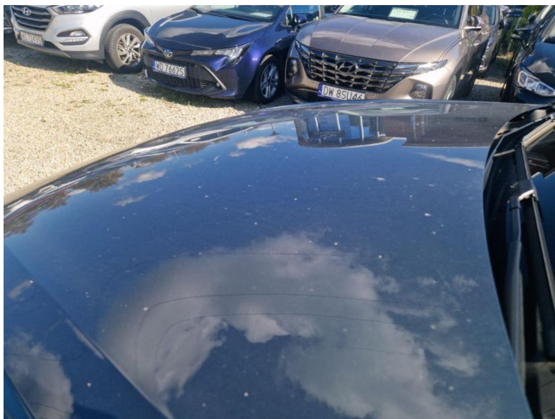
Fot. 36 Stan zabrudzenia karoserii.