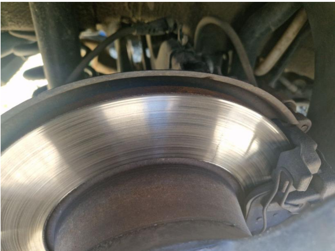
Fot. 30 Tarcza hamulcowa tylna prawa