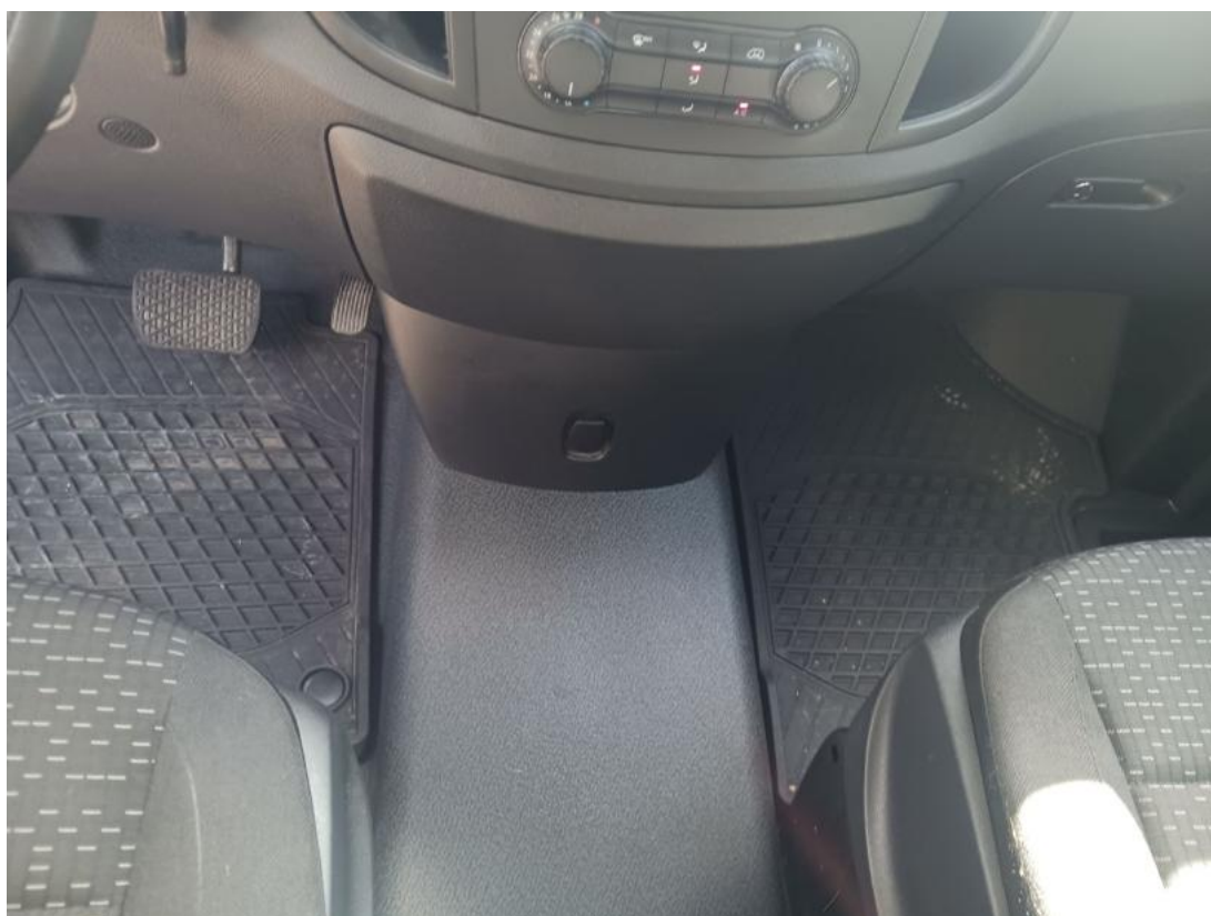
Fot. 20 Tunel środkowy