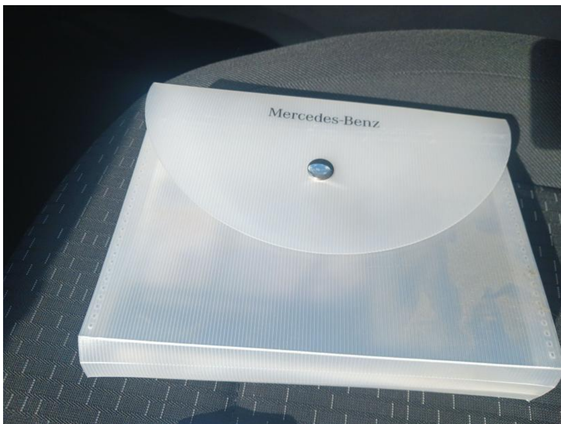
Fot. 31 Instrukcje