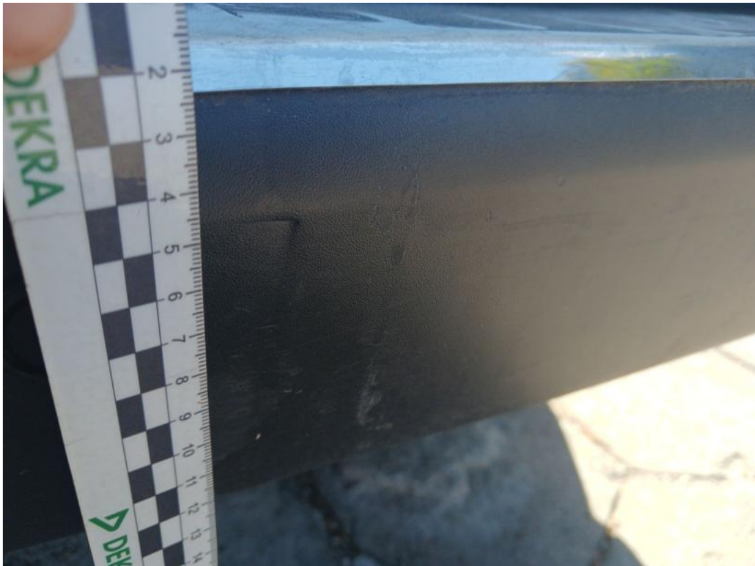
Fot. 37 Zderzak tylny cz śr - Rysa/odprysk 2