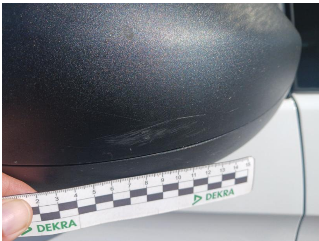
Fot. 32 Obudowa lusterka zew P - Rysa/odprysk 1