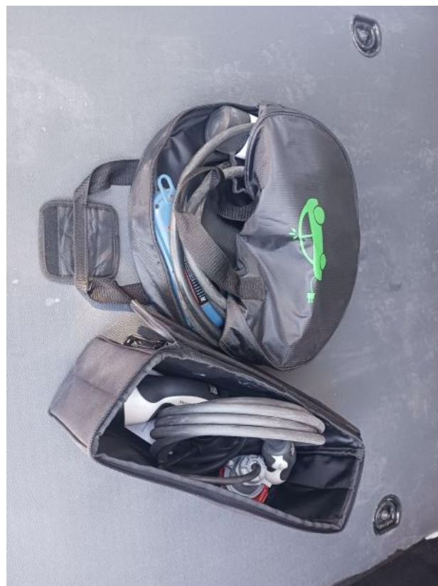
Fot. 28 Przewód ładowania baterii trakcyjnej