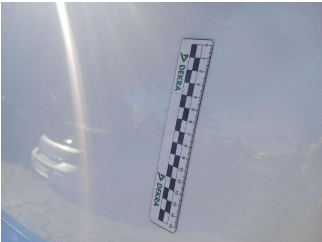
Fot. 38 Błotnik tylny L / Ściana boczna L - Wgniecenie/odkształcenie 1